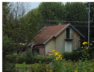
Façade postérieure IVR82_20087300813NUCA