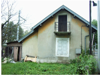
Pignon gauche