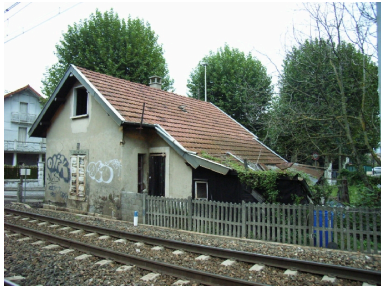
Pignon droit IVR82_20087300811NUCA

IVR82_20067300306NUCB