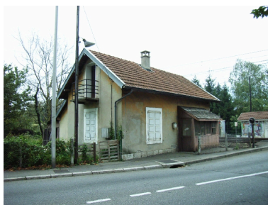
Vue générale IVR82_20087300814NUCA