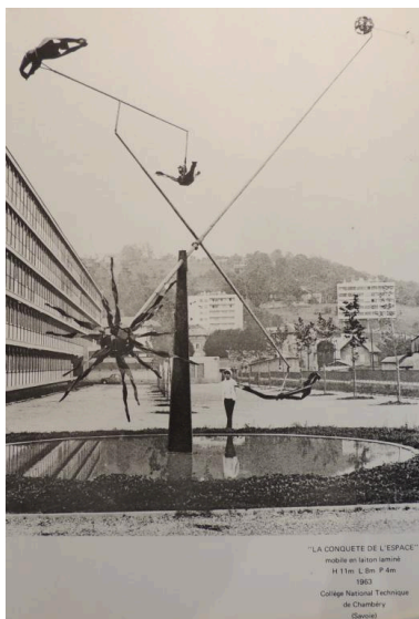
L'œuvre in situ, photographie de 1963.