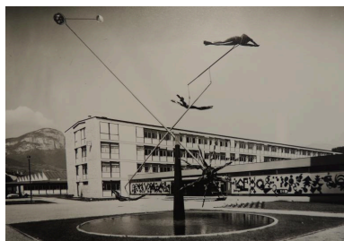
L'œuvre in situ, carte postale de 1963.