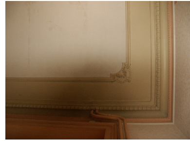
Plafond de la salle à manger IVR82_20047300060NUCA