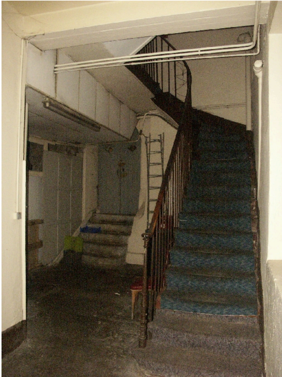
Escalier d'accès au sous-sol