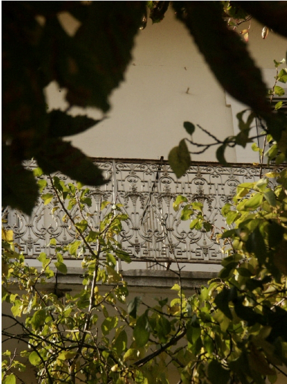
Aile nord : détail du balcon du 1er étage sur jardin