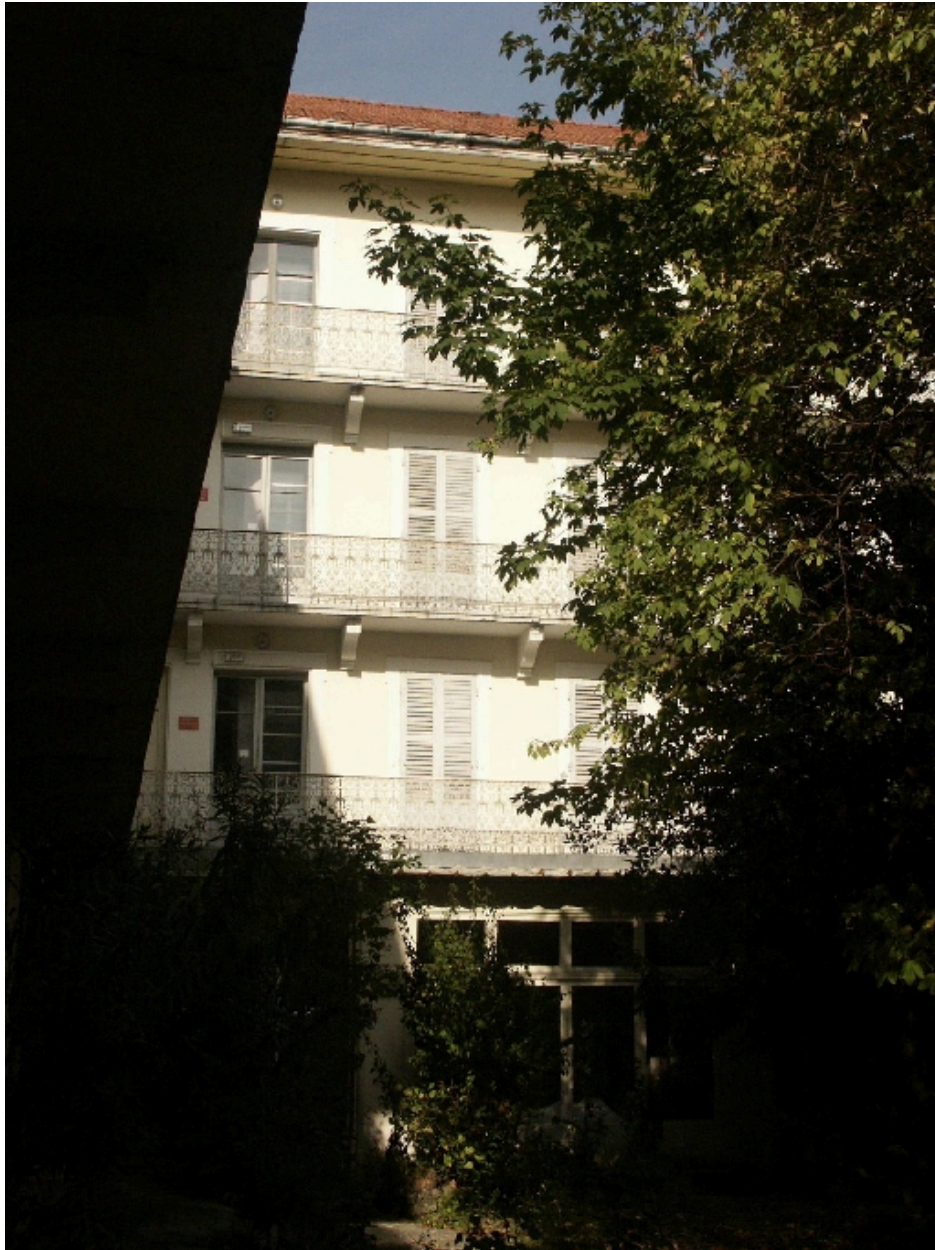
Aile nord : façade sur jardin