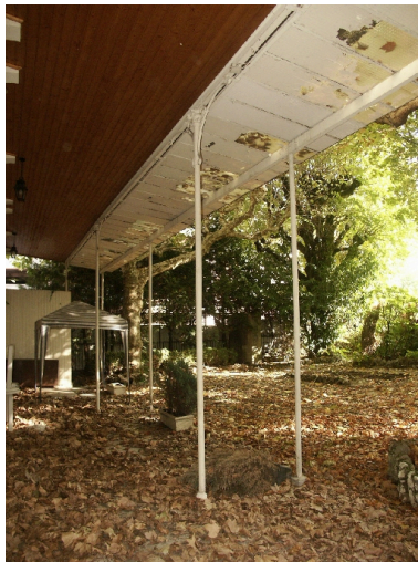
Vue du jardin