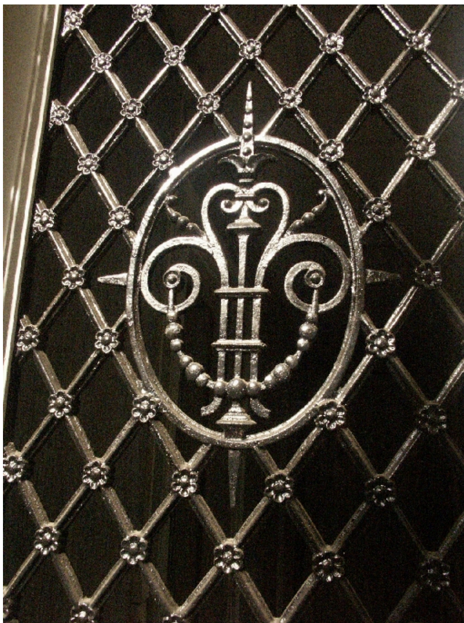
Détail de la porte du 1er étage sur balcon : motif de ferronnerie