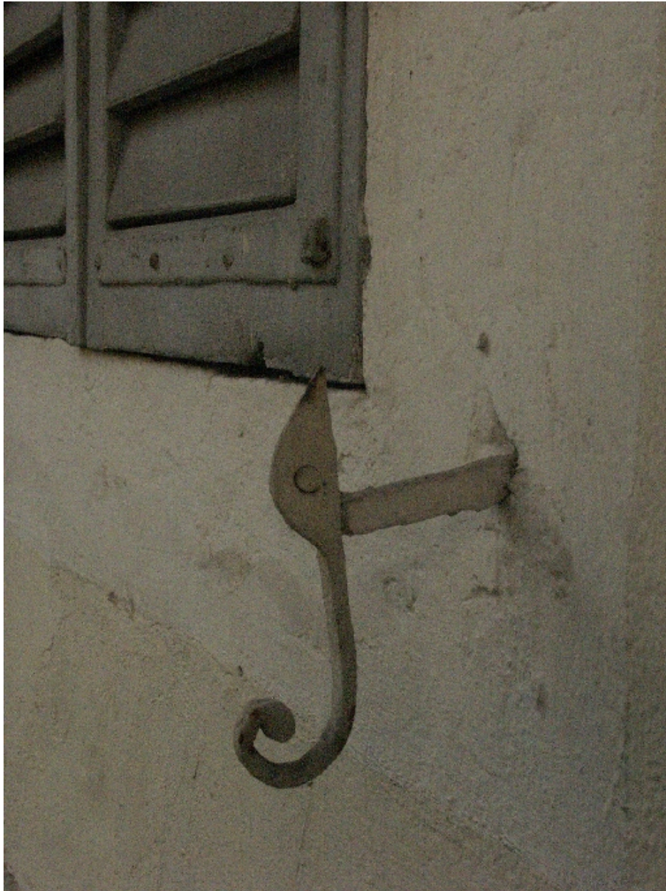
Détail d'un fixe-persiennes