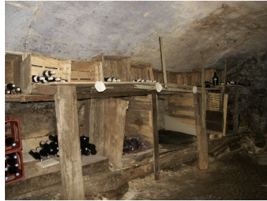
Détail d'une cave IVR82_20047300084NUCA