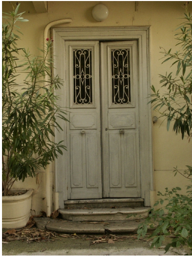
Porte de l'aile nord ouvrant sur le jardin IVR82_20047300044NUCA