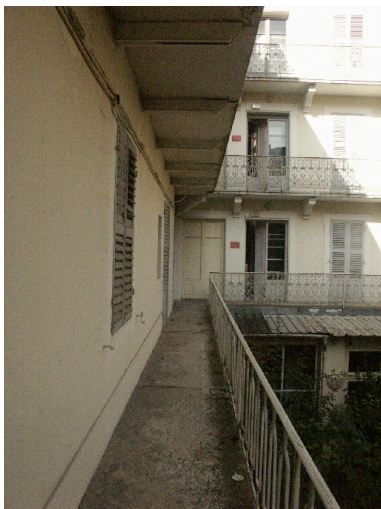
Balcons-galeries sur jardin IVR82_20047300036NUCA