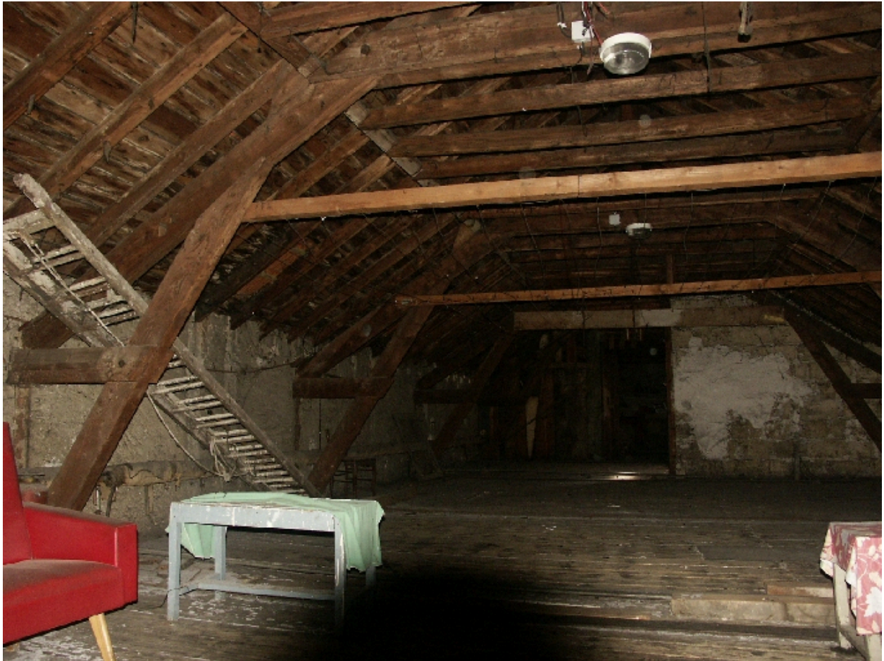
Vue de la charpente