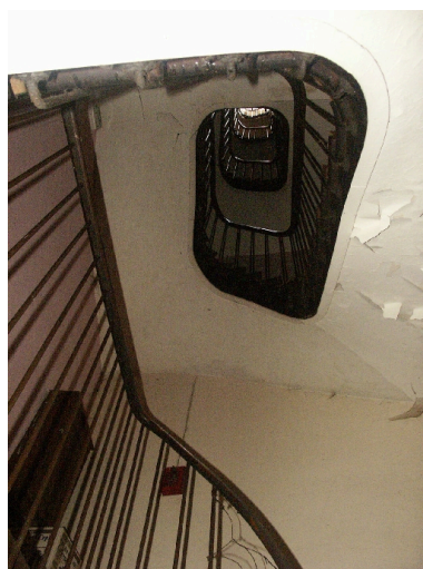
Escalier secondaire