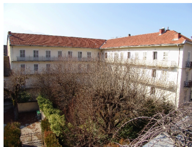
Vue d'ensemble des façades sur jardin