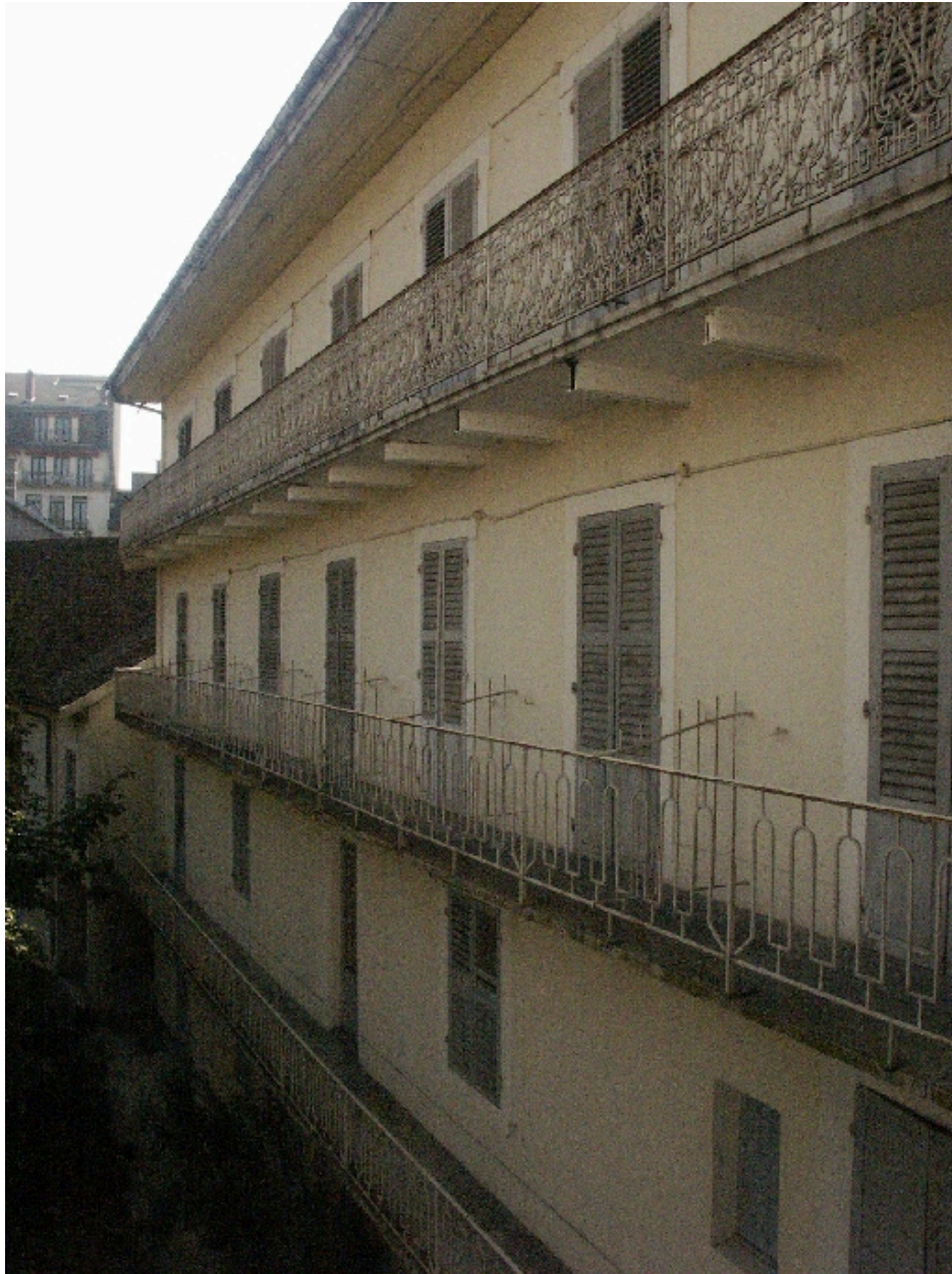
Aile occidentale : façade sur jardin