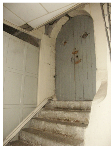
Porte du sous-sol