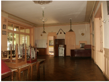
Salle à manger IVR82_20047300058NUCA