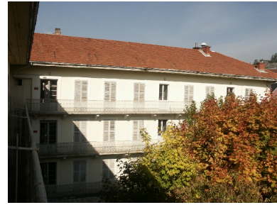
Aile nord : façade sur jardin IVR82_20047300038NUCA