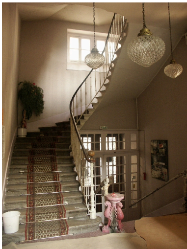
Vue de l'escalier d'honneur depuis le hall