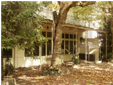
Véranda sur jardin IVR82_20047300040NUCA