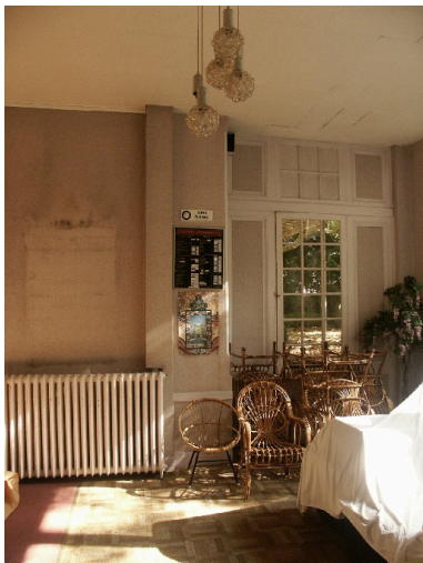
Ancien salon IVR82_20047300055NUCA