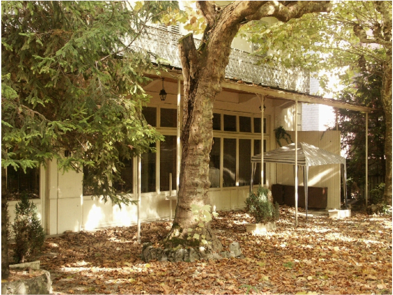
Véranda sur jardin