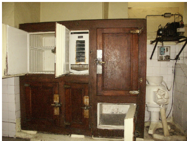
Cuisines : détail des placars-réfrigérants IVR82_20047300067NUCA