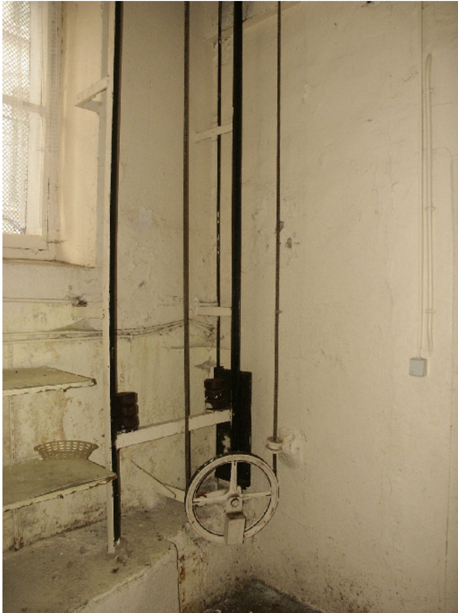
Cuisines : détail du monte-charge