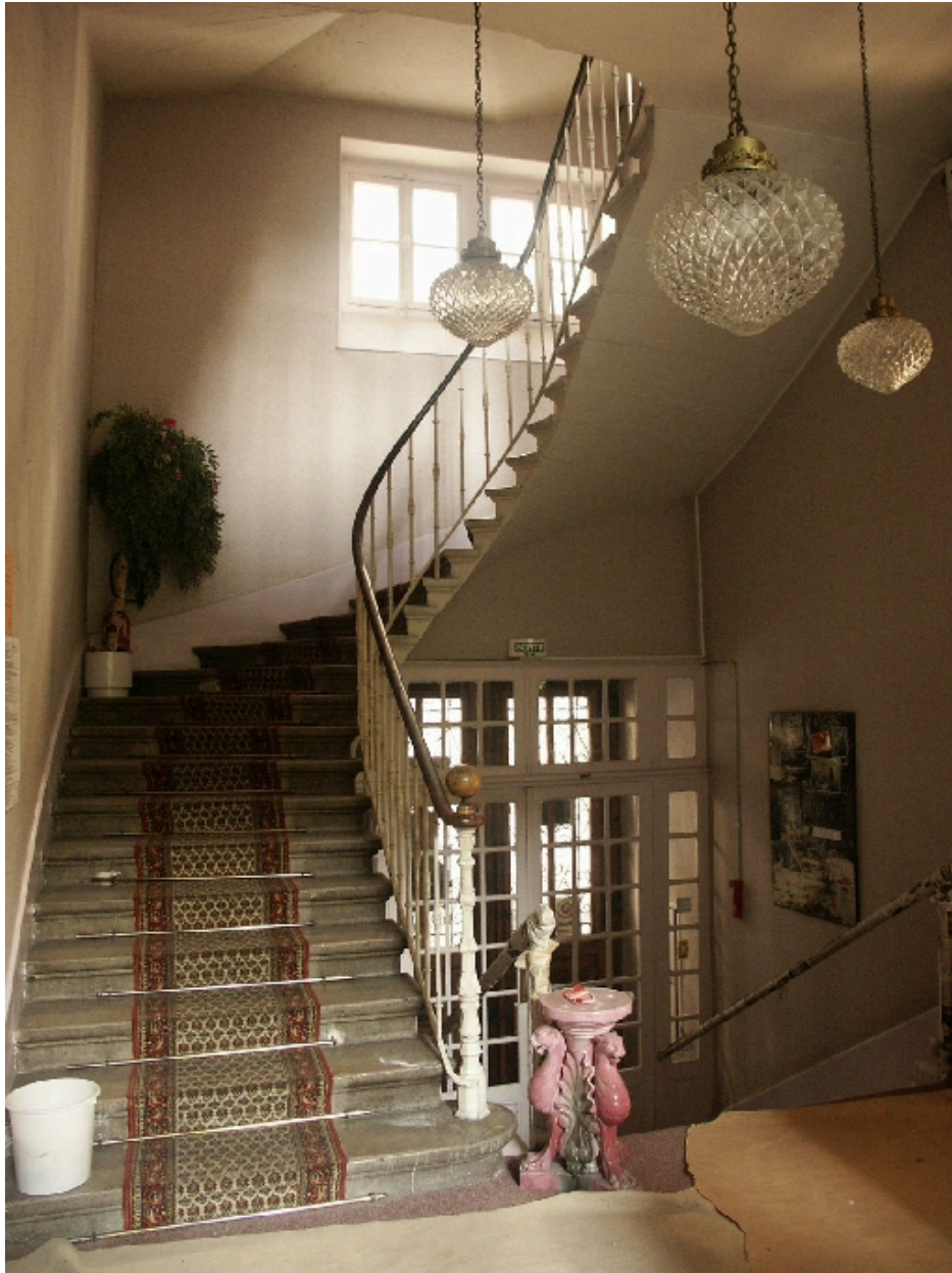
Vue de l'escalier d'honneur depuis le hall