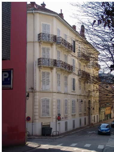
Façade sur la rue Daquin IVR82_20047300032NUCA