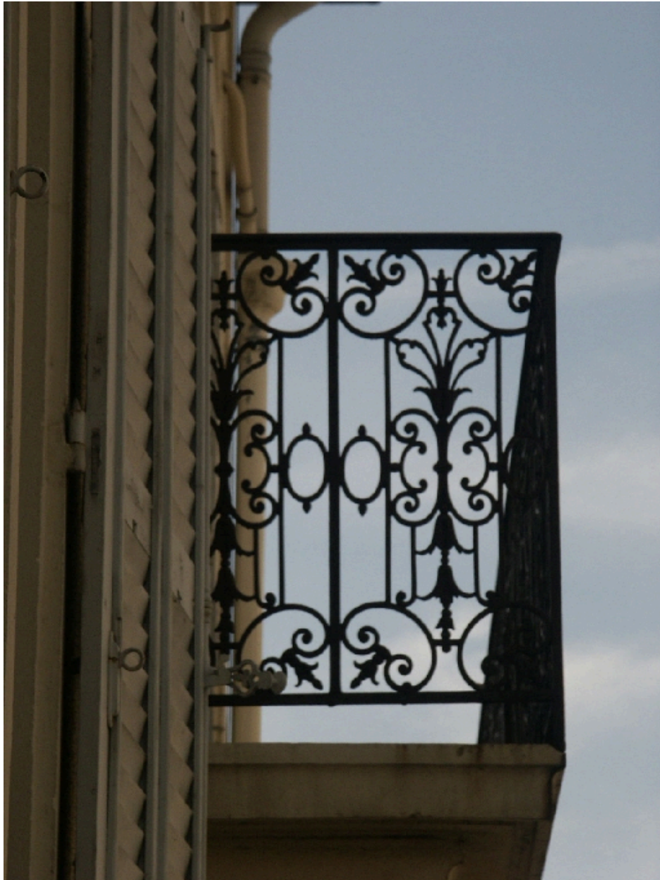
Détail de ferronnerie d'un balcon sur rue