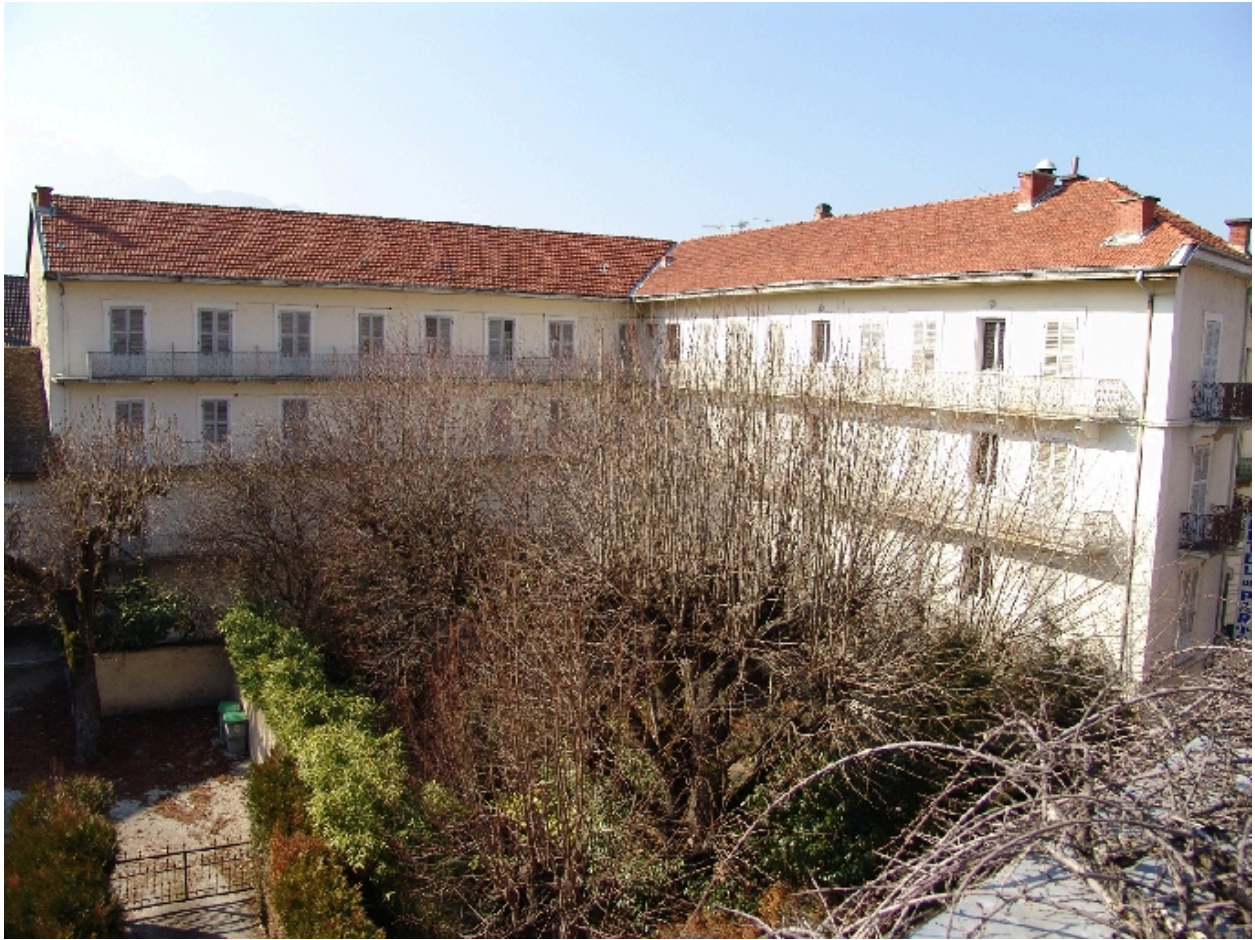
Vue d'ensemble des façades sur jardin