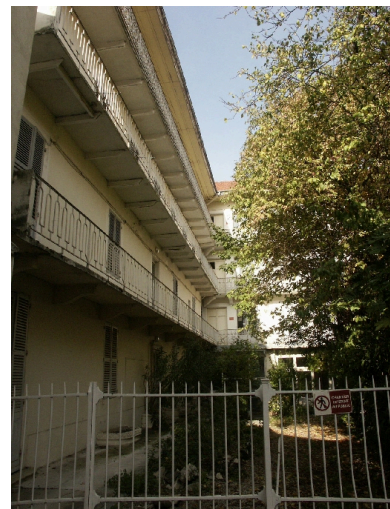
Aile occidentale : façade sur jardin