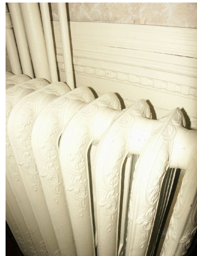
Ancien salon : détail d'un radiateur IVR82_20047300057NUCA