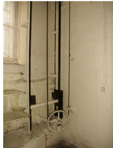
Cuisines : détail du monte-charge