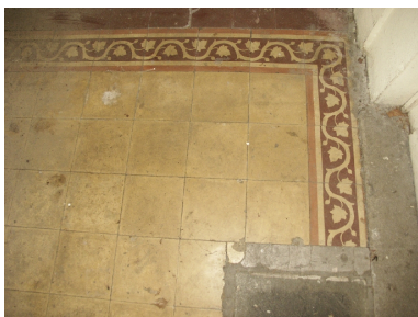
Détail du carrelage du vestibule