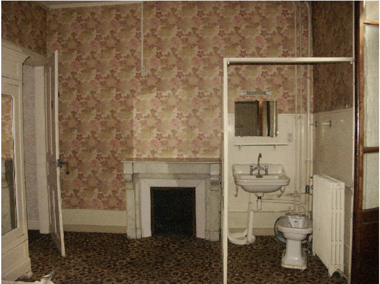
Chambre de l'aile nord