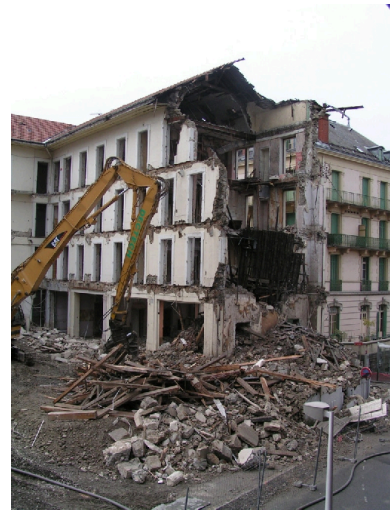
Démolition de l'hôtel en 2005