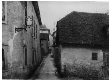
Façade de l'hôtel Tony, vers 1870