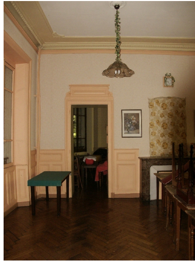
Détail de la salle à manger IVR82_20047300059NUCA