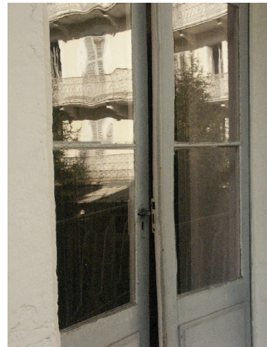
Porte-fenêtre de l'étage IVR82_20047300069NUCA