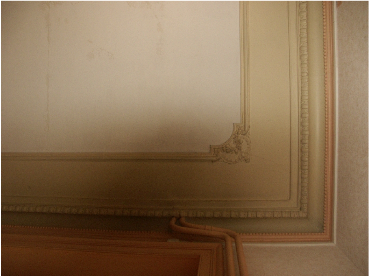
Plafond de la salle à manger