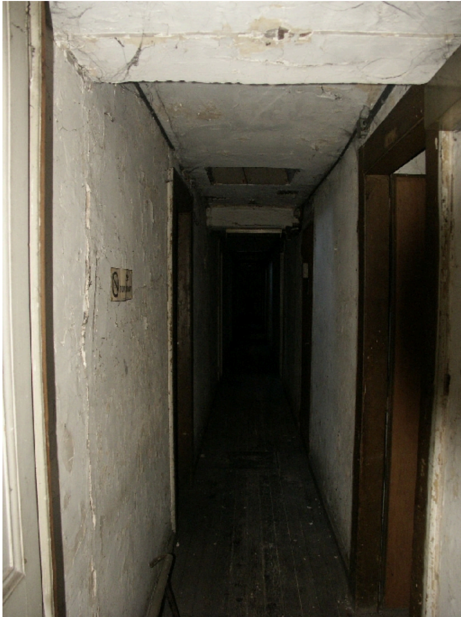
Couloir de l'étage de comble