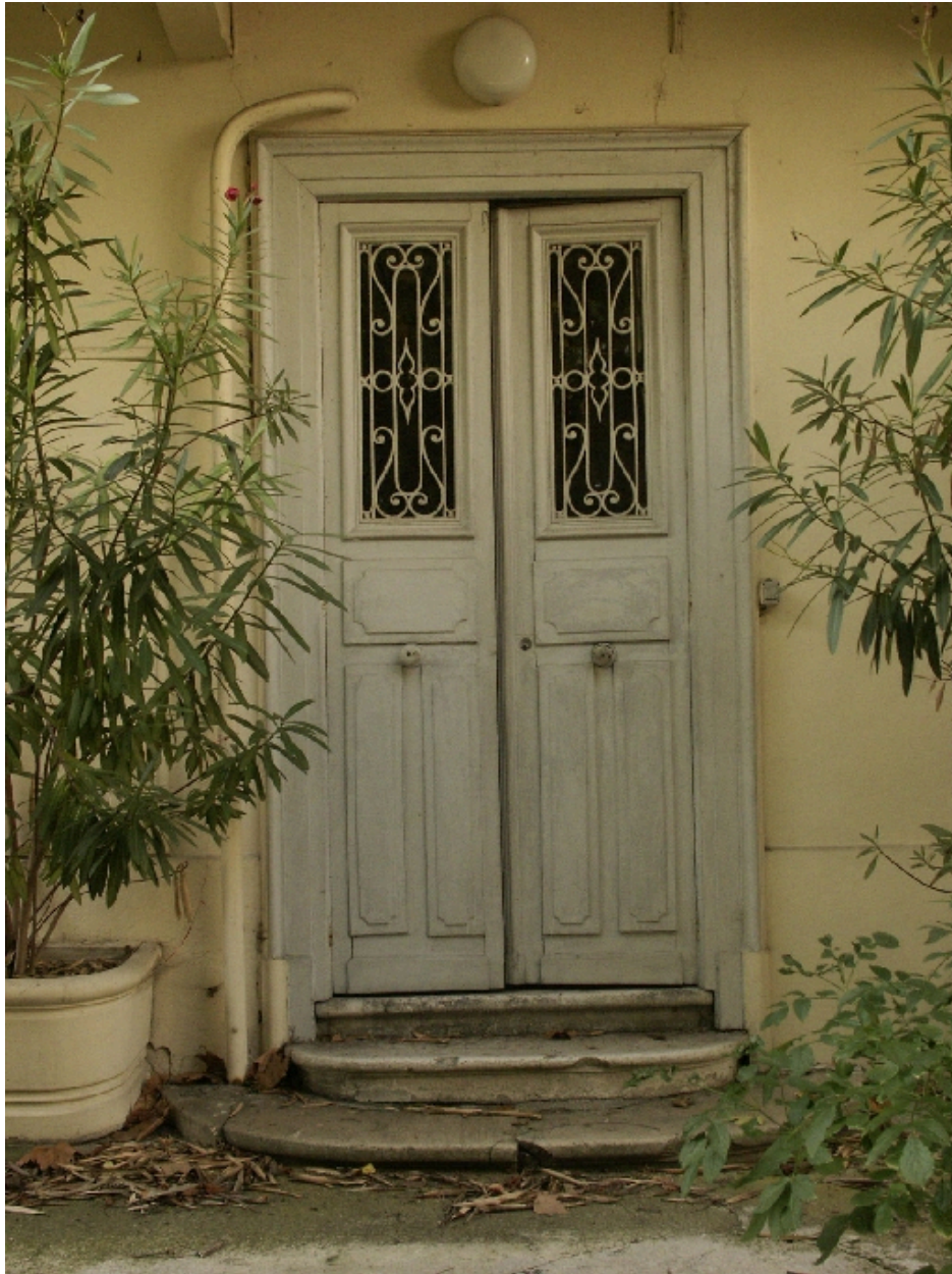
Porte de l'aile nord ouvrant sur le jardin