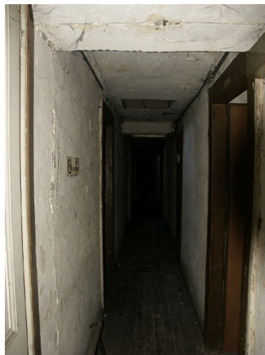
Couloir de l'étage de comble IVR82_20047300082NUCA