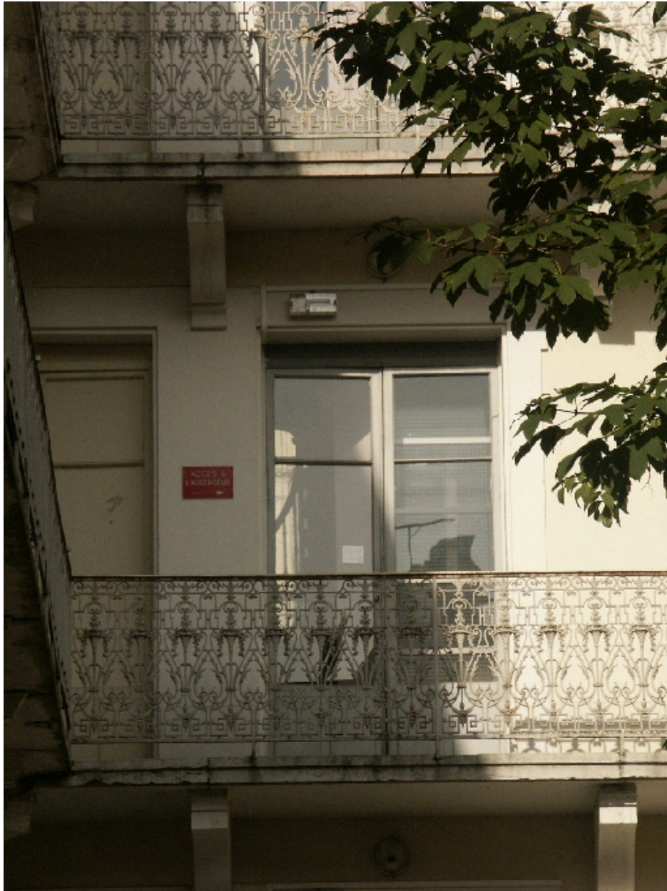
Aile nord : balcons sur jardin