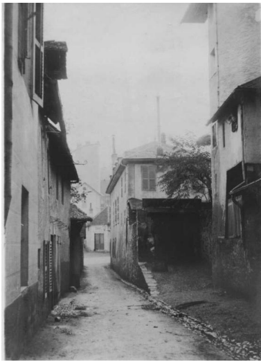
Hôtel Tony, vers 1870 IVR82_20147300060NUCB