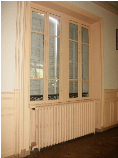
Salle à manger : détail des fenêtres IVR82_20047300061NUCA