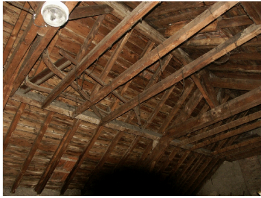
Détail de la charpente IVR82_20047300086NUCA