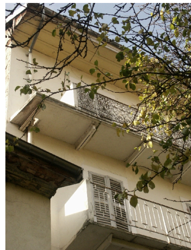
Aile occidentale : détail des balcons sur jardin IVR82_20047300043NUCA