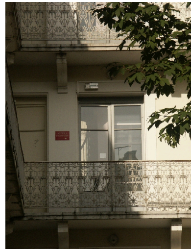
Aile nord : balcons sur jardin