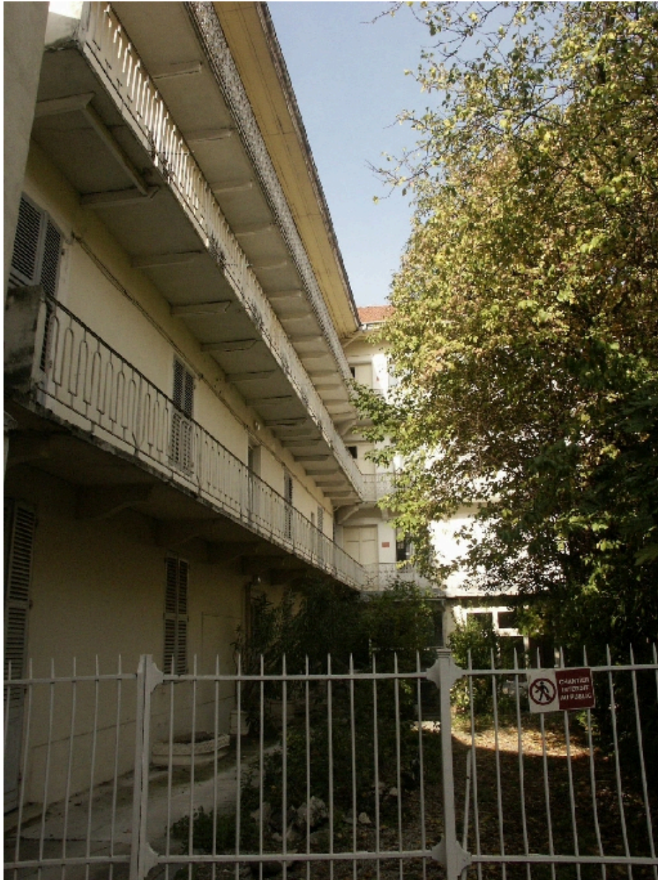
Aile occidentale : façade sur jardin