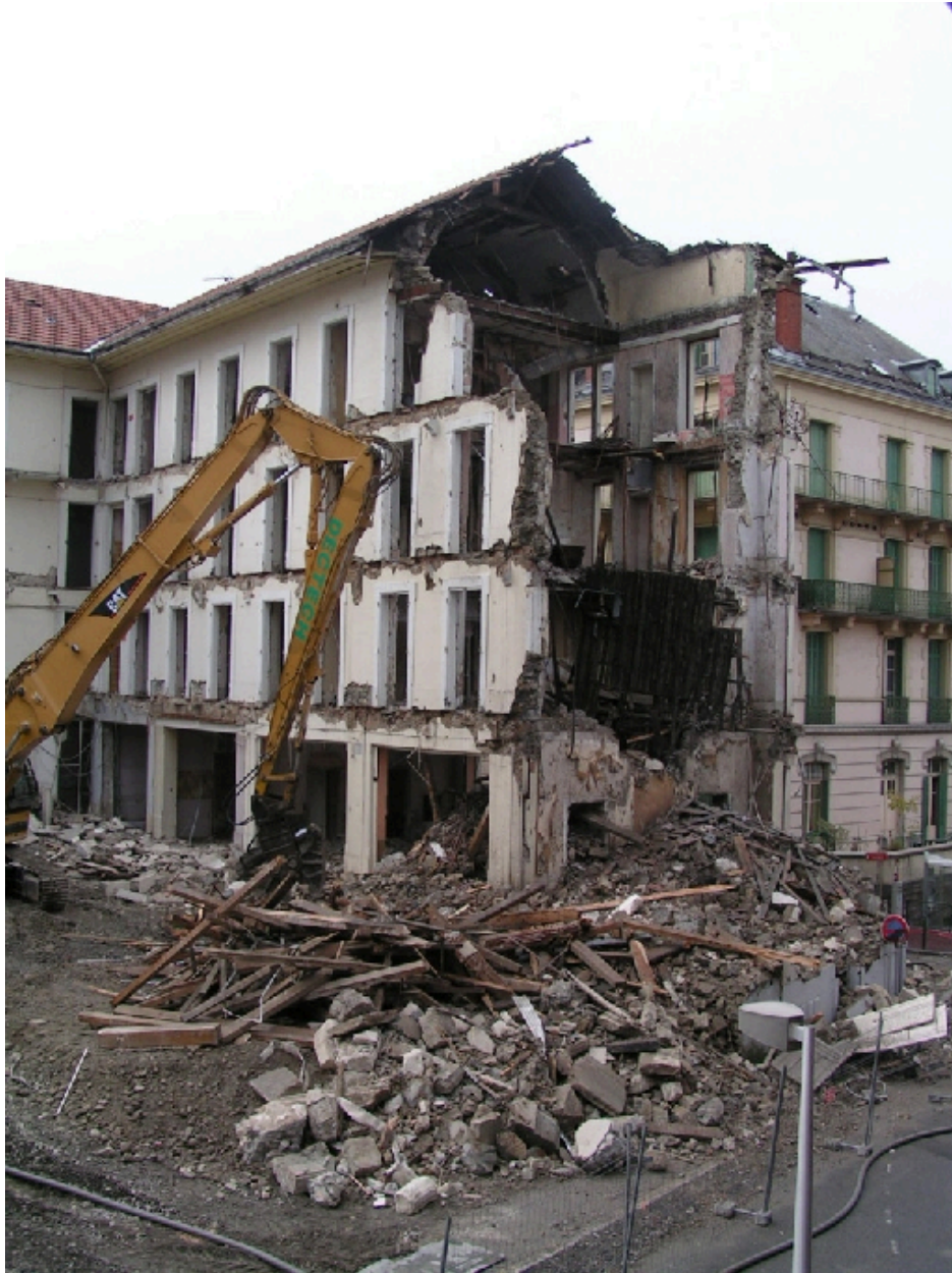
Démolition de l'hôtel en 2005