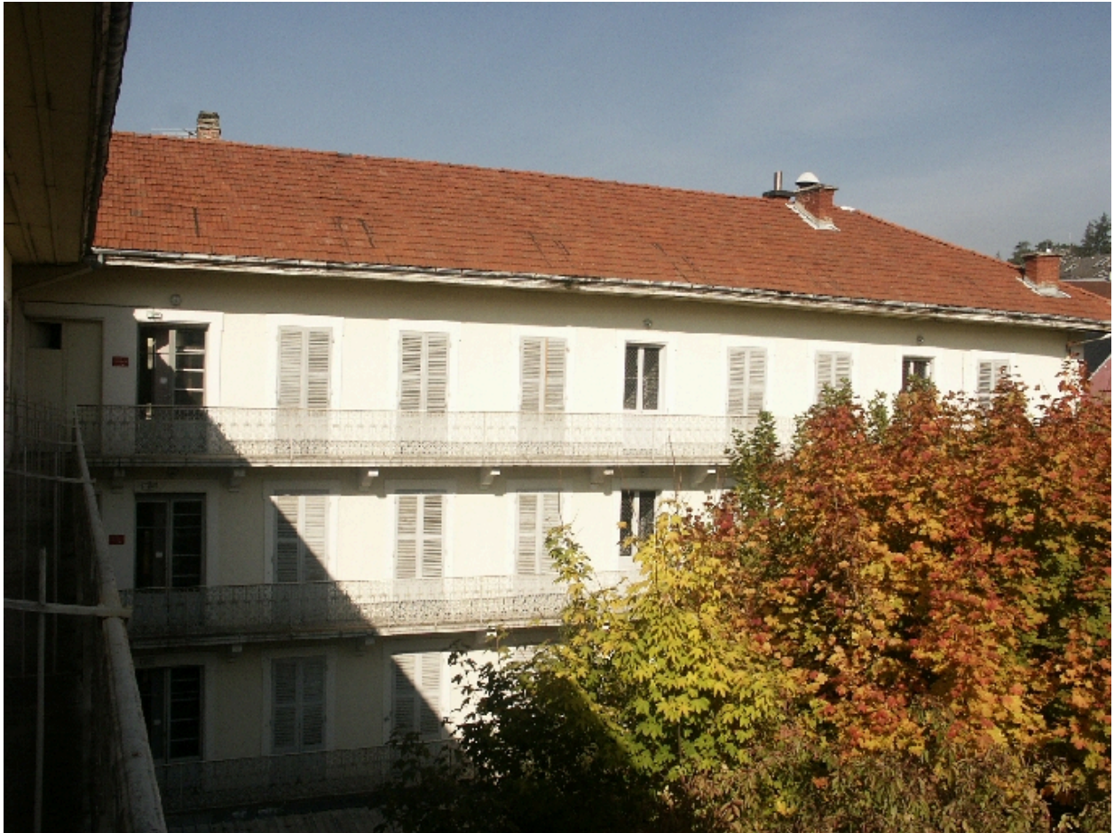
Aile nord : façade sur jardin