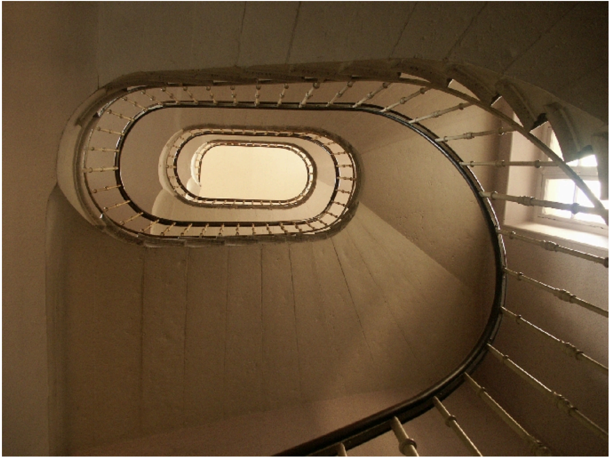
Vue d'ensemble de l'escalier d'honneur depuis le bas