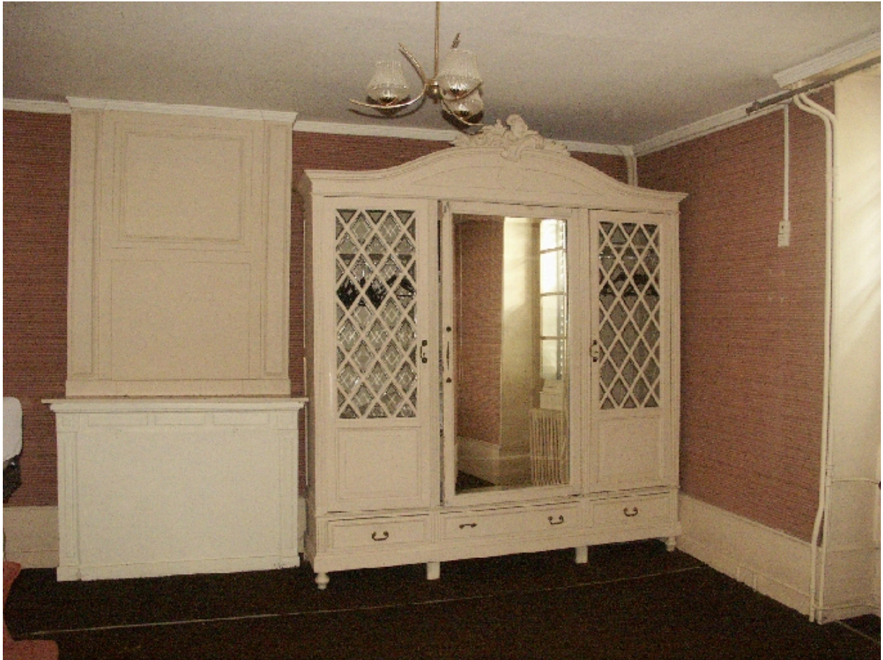
Chambre du premier étage