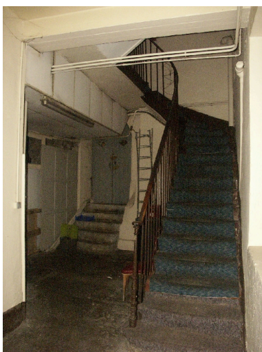
Escalier d'accès au sous-sol