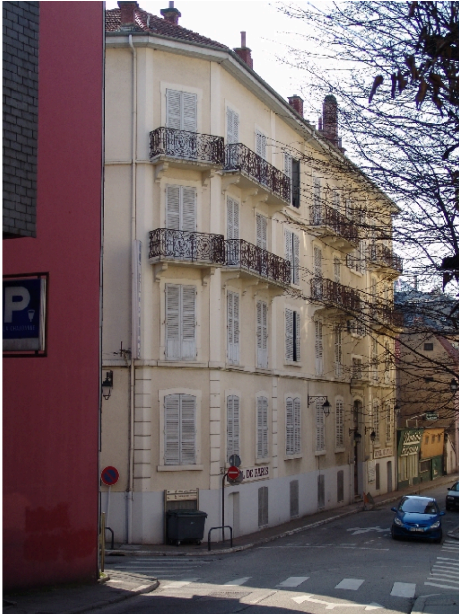
Façade sur la rue Daquin