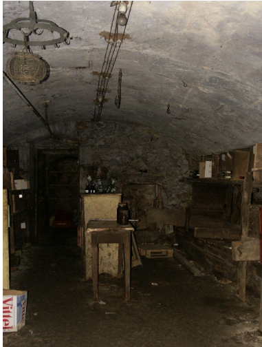
Vue d'une cave IVR82_20047300083NUCA