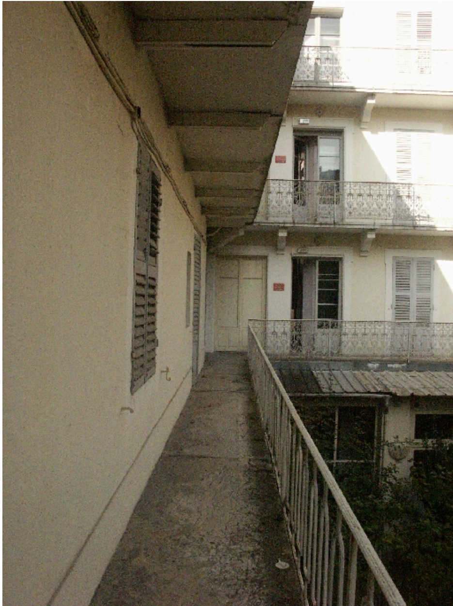
Balcons-galleries sur jardin