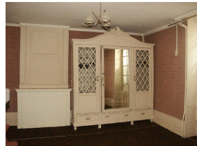
Chambre du premier étage IVR82_20047300063NUCA