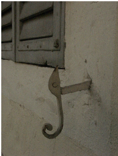
Détail d'un fixe-persiennes IVR82_20047300070NUCA