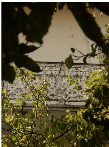
Aile nord : détail du balcon du 1er étage sur jardin IVR82_20047300042NUCA