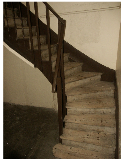
Départ de l'escalier secondaire IVR82_20047300049NUCA