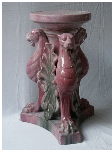
Paire de vases décoratifs encadrant l'entrée du hall : détail d'un support