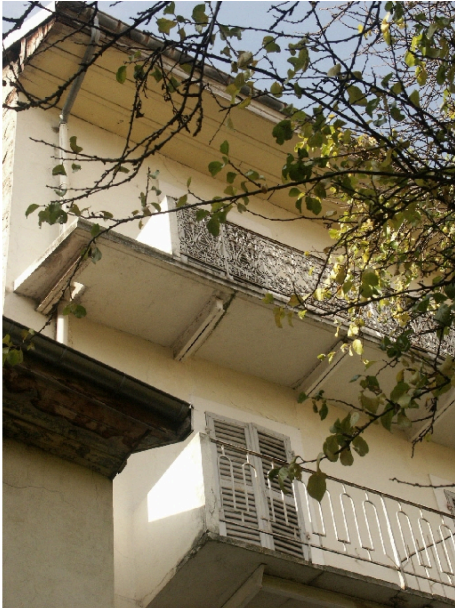
Aile occidentale : détail des balcons sur jardin