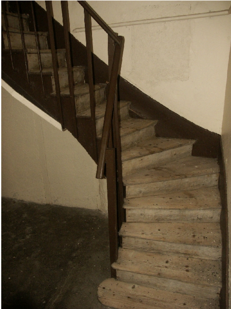
Départ de l'escalier secondaire