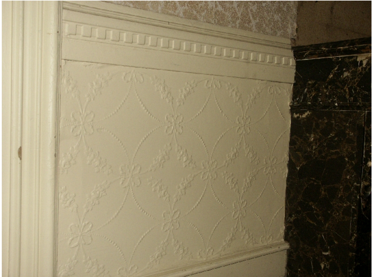
Ancien salon : détail du faux-lambris