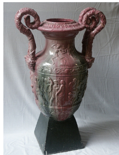
Paire de vases décoratifs encadrant l'entrée du hall : détail d'un vase