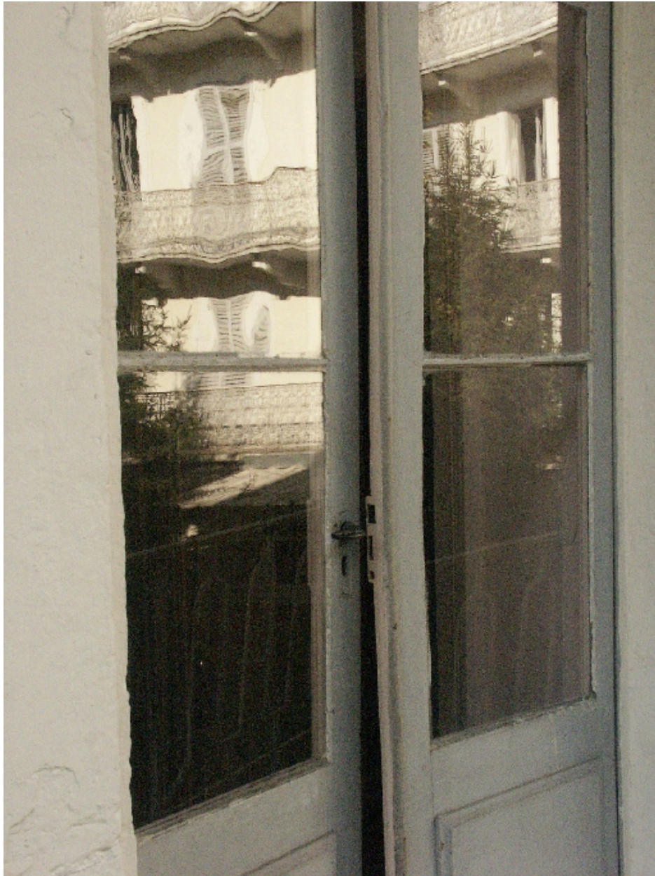
Porte-fenêtre de l'étage