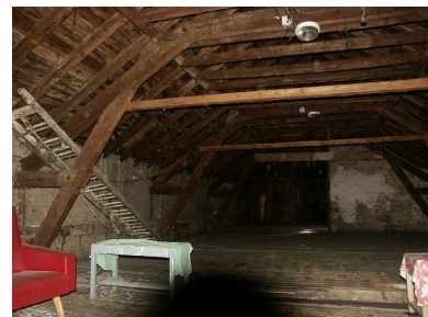
Vue de la charpente IVR82_20047300085NUCA