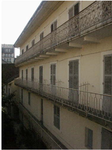
Aile occidentale : façade sur jardin IVR82_20047300037NUCA