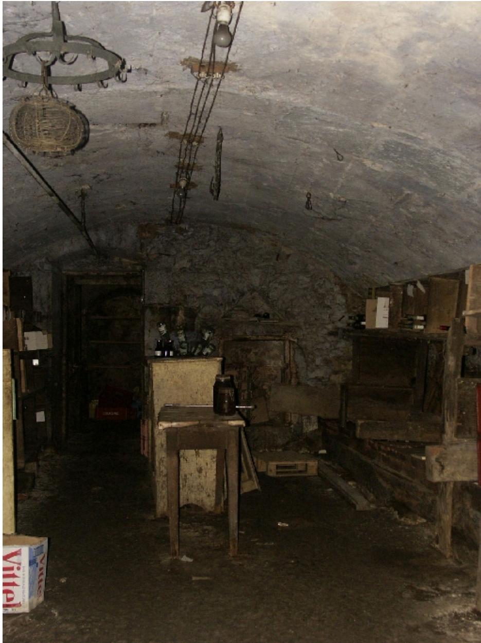
Vue d'une cave