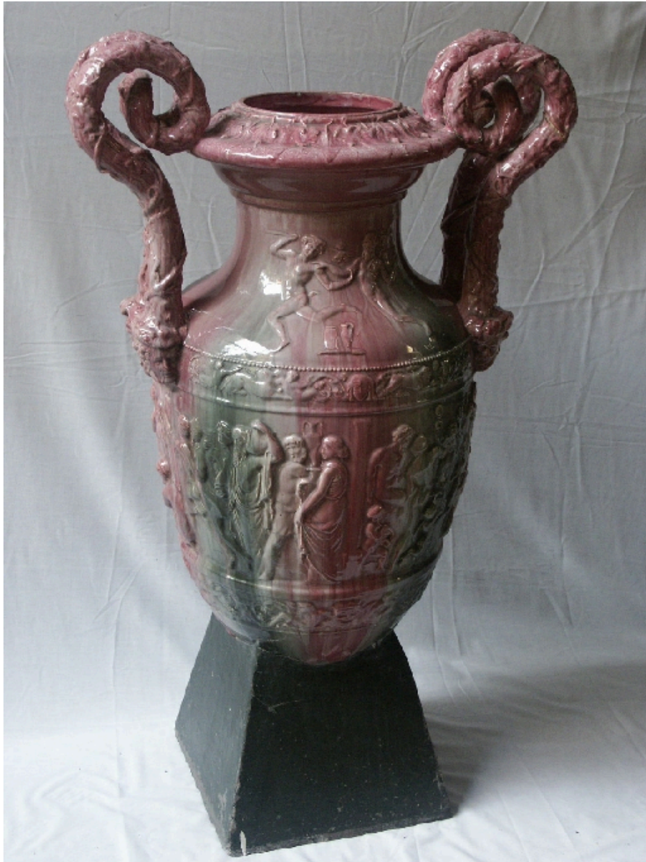
Paire de vases décoratifs encadrant l'entrée du hall : détail d'un vase