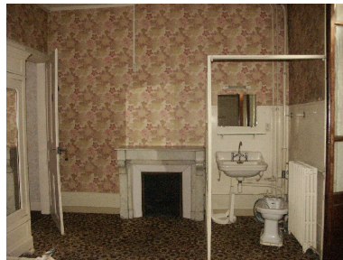
Chambre de l'aile nord