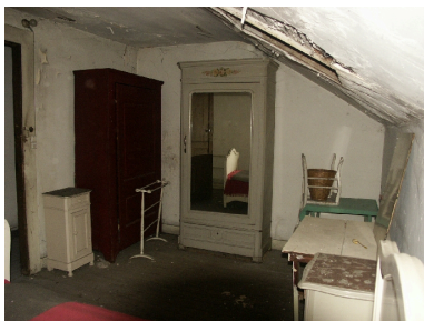
Chambre de l'étage de comble IVR82_20047300081NUCA