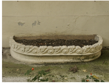
Jardinière IVR82_20047300046NUCA