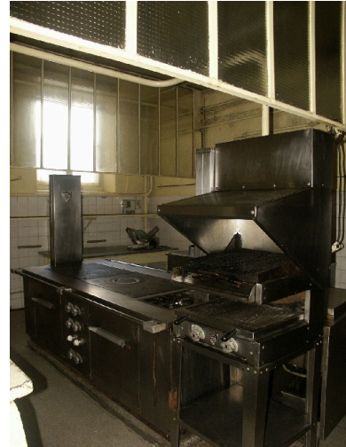
Cuisines IVR82_20047300064NUCA