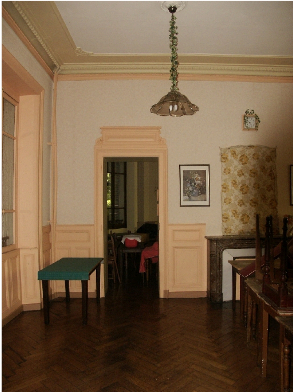
Détail de la salle à manger