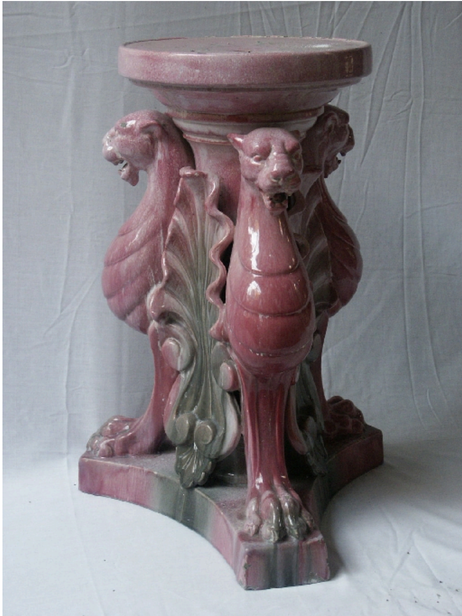
Paire de vases décoratifs encadrant l'entrée du hall : détail d'un support