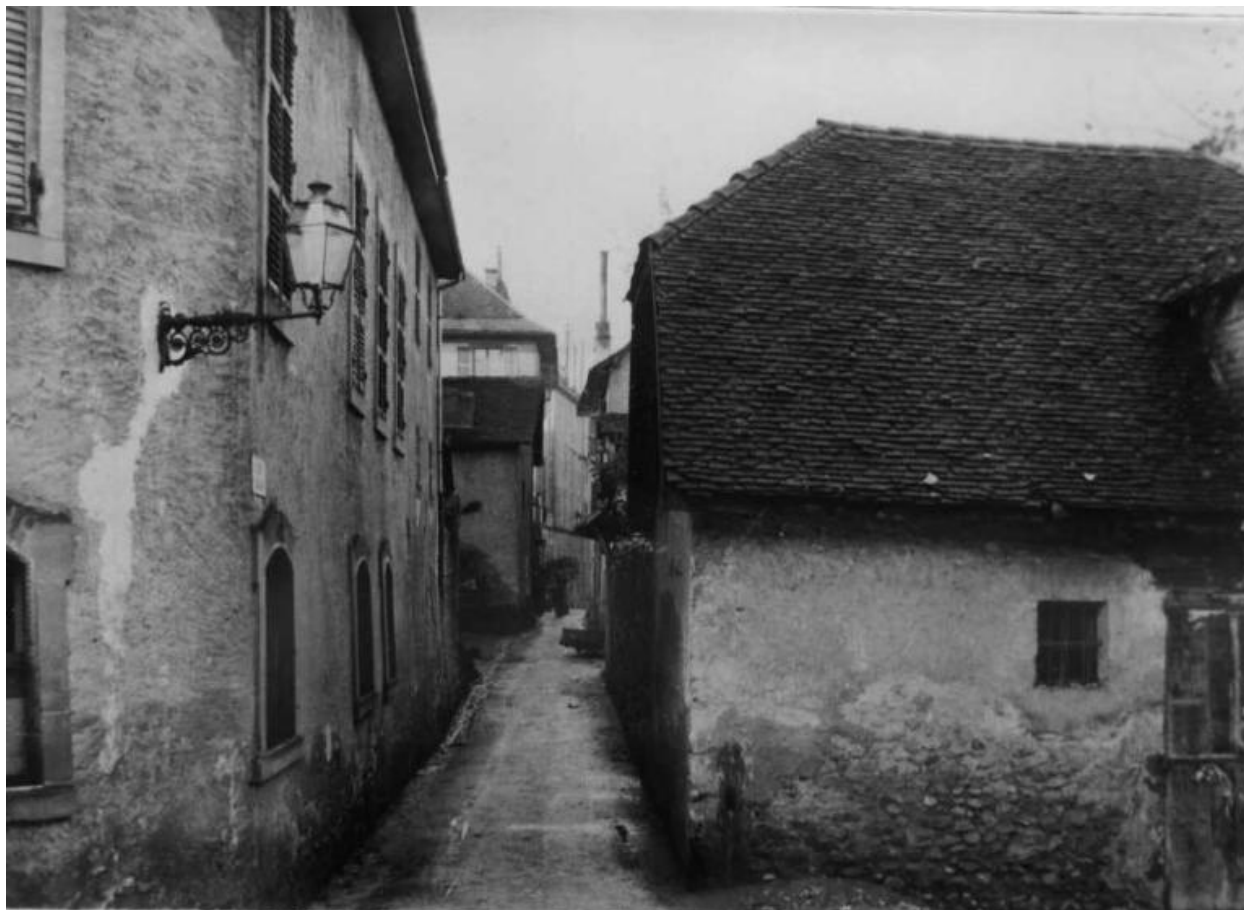
Façade de l'hôtel Tony, vers 1870