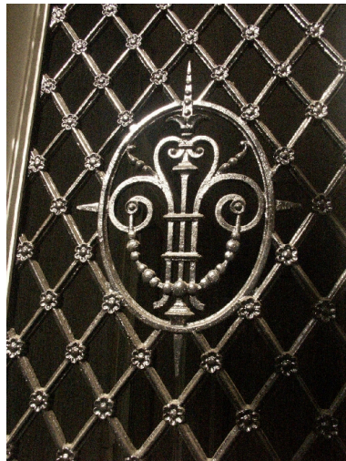
Détail de la porte du 1er étage sur balcon : motif de ferronnerie