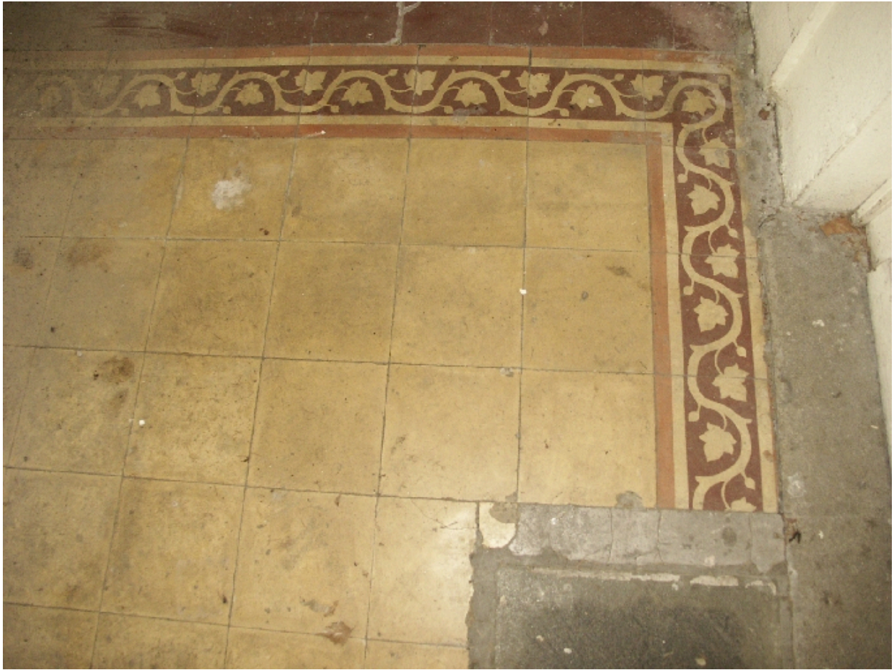
Détail du carrelage du vestibule