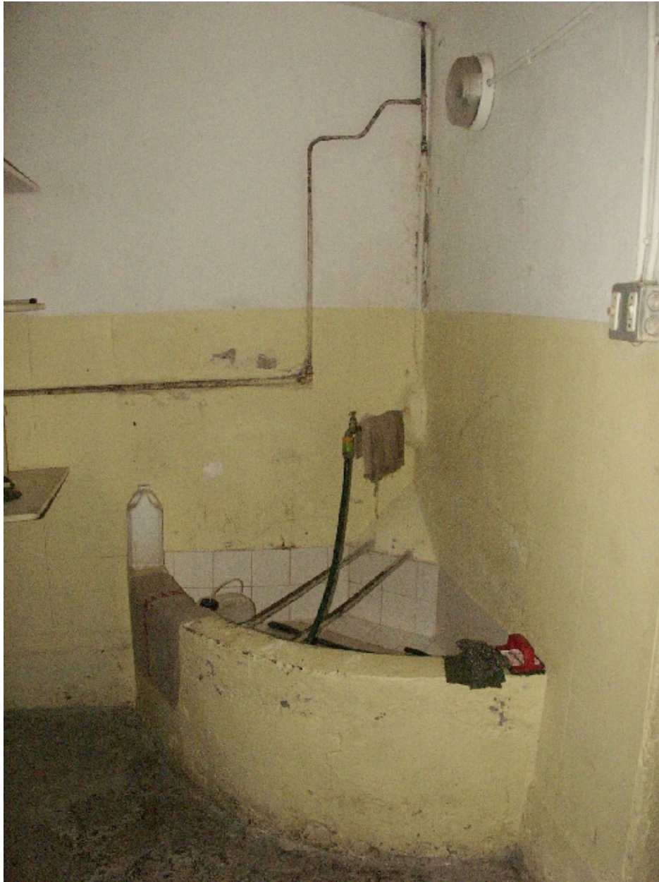
Cuisines : détail du bassin