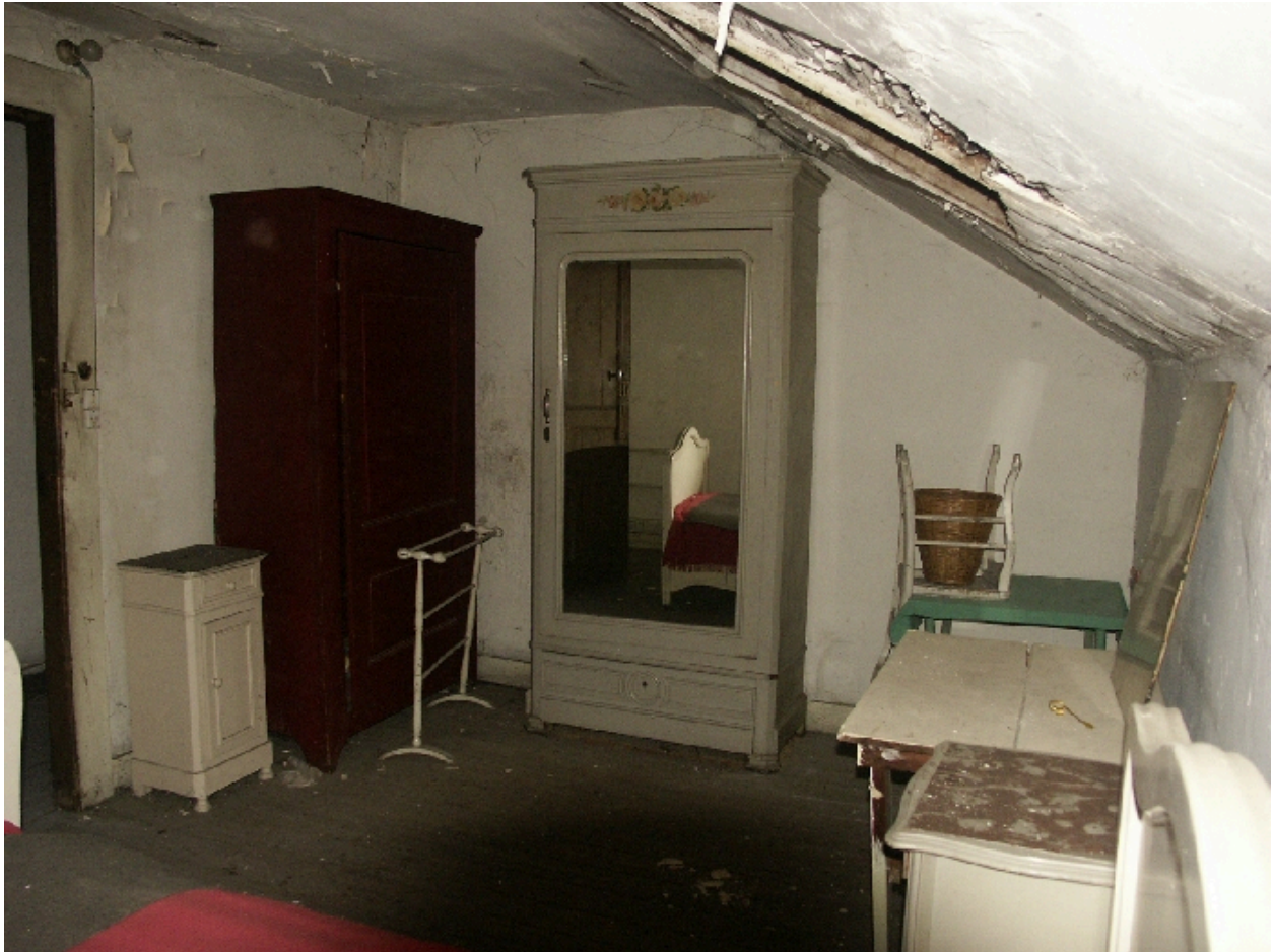
Chambre de l'étage de comble