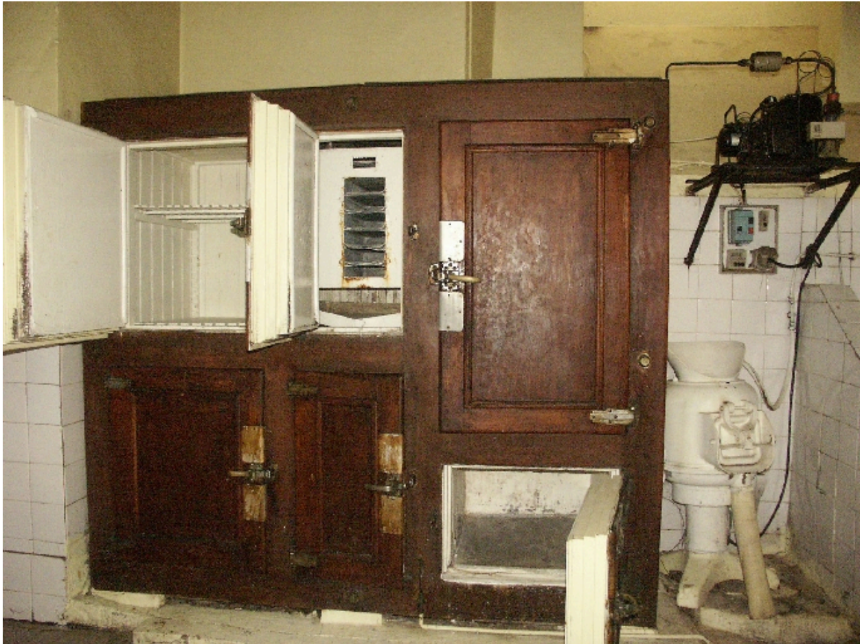
Cuisines : détail des placars-réfrigérants