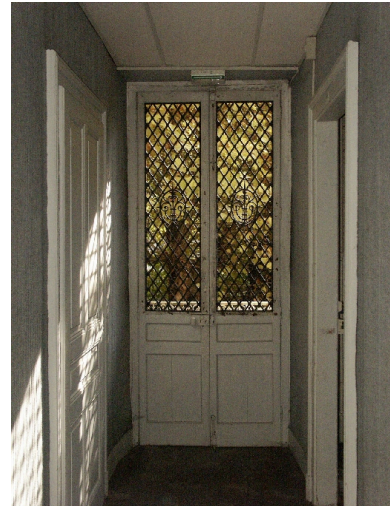
Porte du 1er étage sur balcon-galerie IVR82_20047300053NUCA