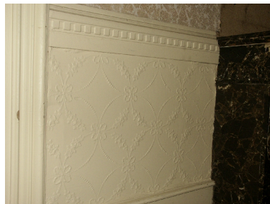
Ancien salon : détail du faux-lambris IVR82_20047300056NUCA