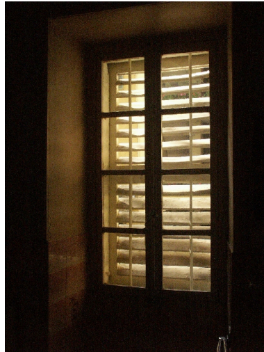
Persiennes d'une chambre IVR82_20047300068NUCA