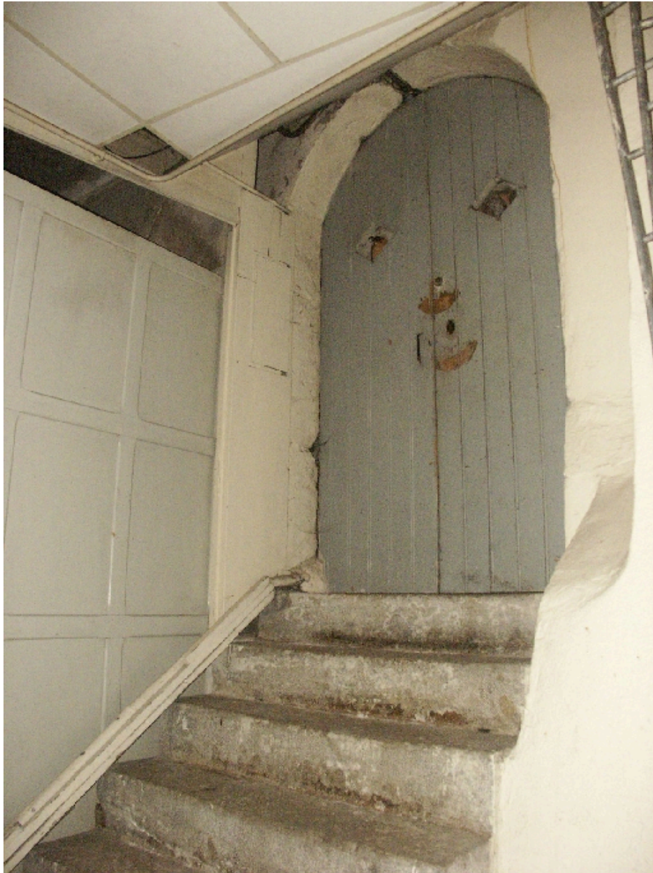
Porte du sous-sol