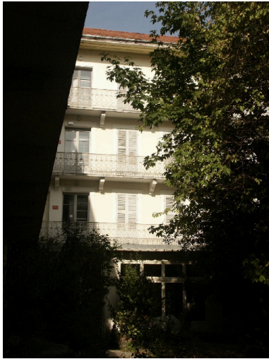
Aile nord : façade sur jardin IVR82_20047300035NUCA