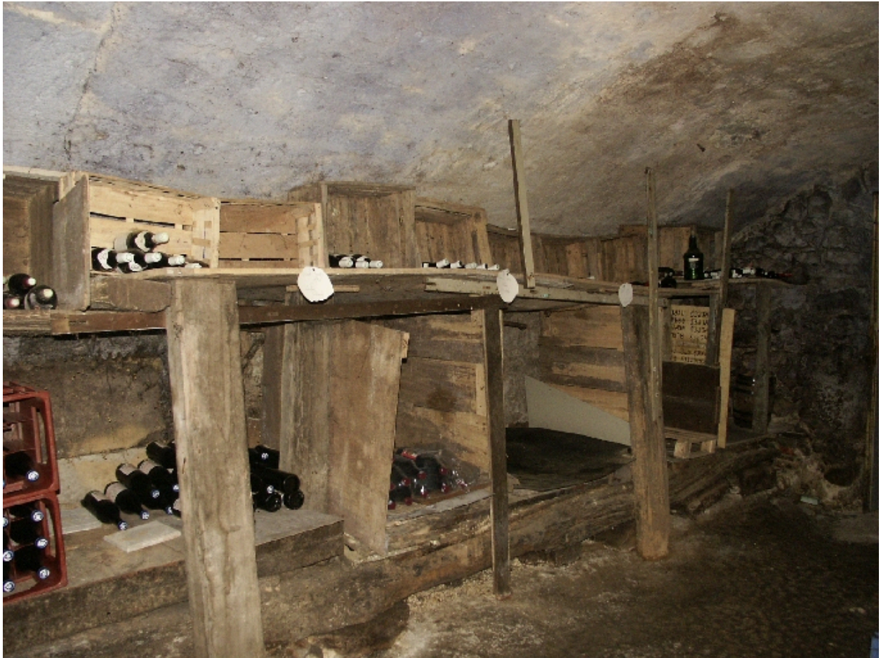
Détail d'une cave