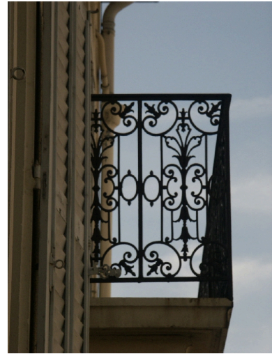
Détail de ferronnerie d'un balcon sur rue IVR82_20047300090NUCA