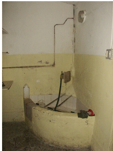
Cuisines : détail du bassin