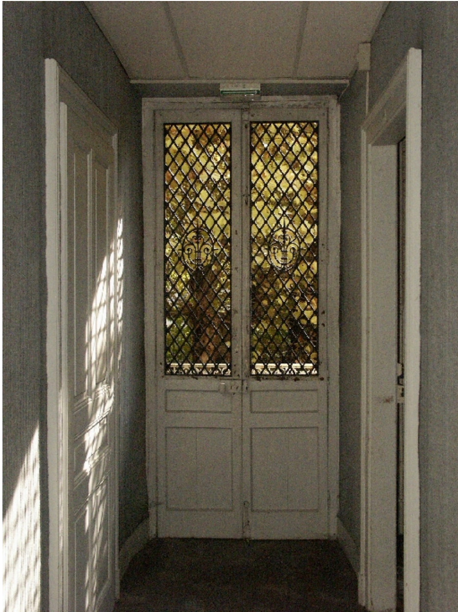
Porte du 1er étage sur balcon-galerie