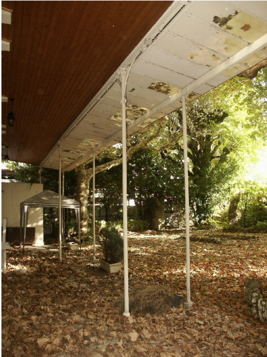
Vue du jardin