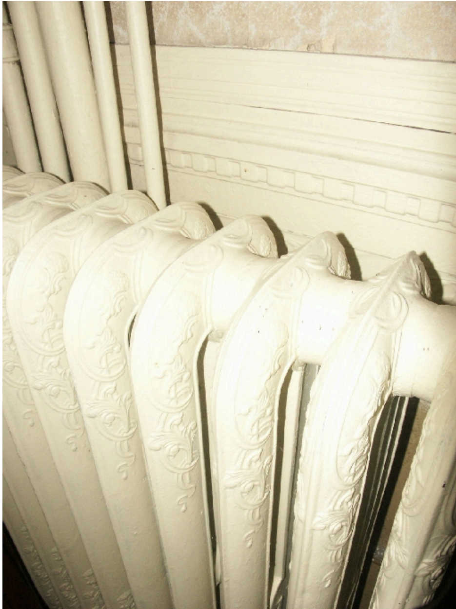
Ancien salon : détail d'un radiateur