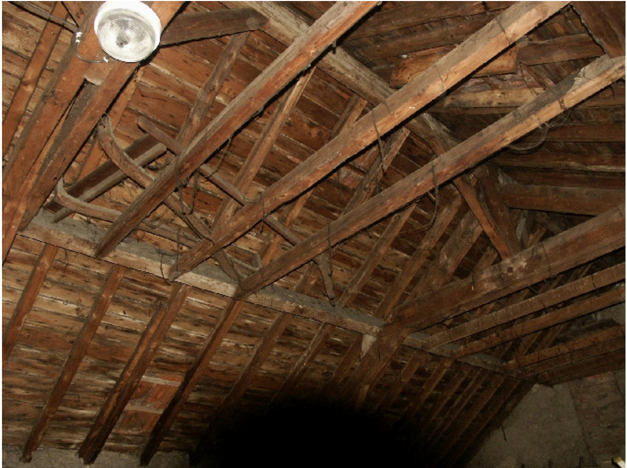
Détail de la charpente