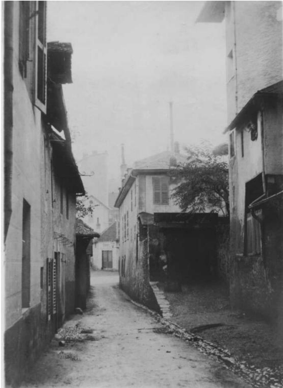
Hôtel Tony, vers 1870