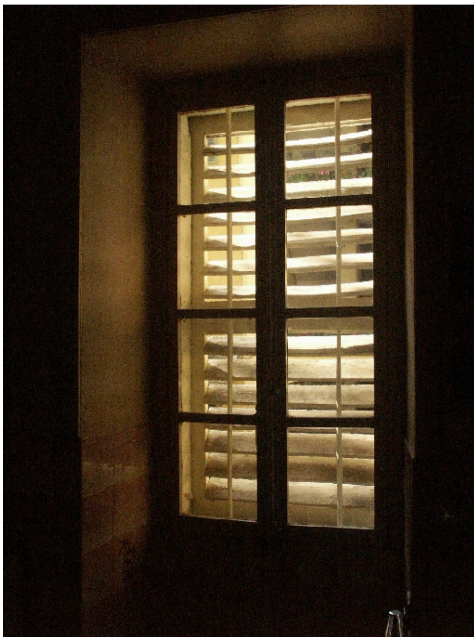
Persiennes d'une chambre