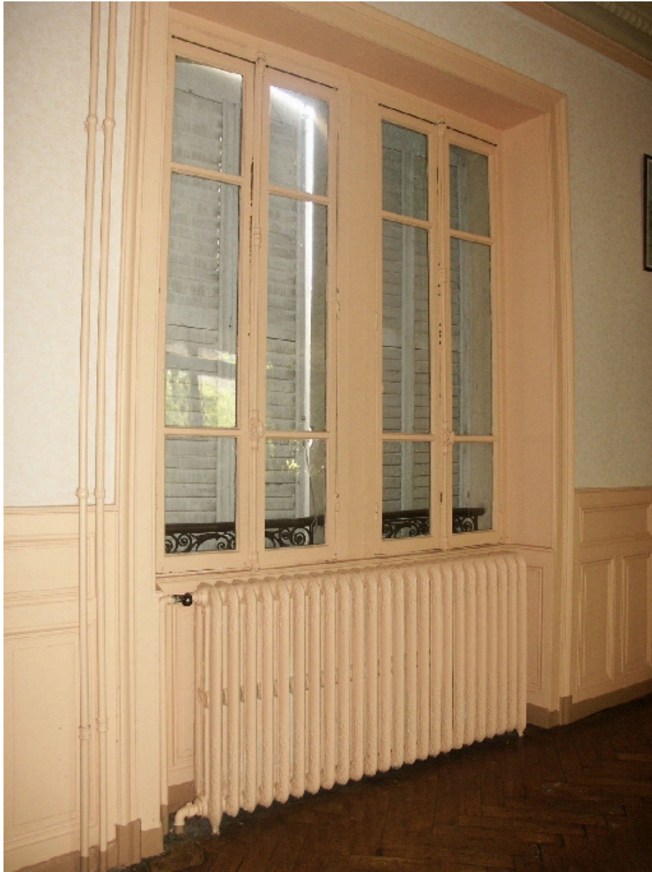
Salle à manger : détail des fenêtres