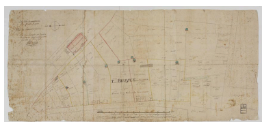
Plan des maisons et jardins, rue Simon Boyer en 1777. Plan, 1777 B Diana Montbrison. C géo 149 (1) IVR82_20064200857NUCA