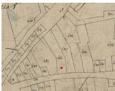
Extrait du plan cadastral de 1809, parcelle E 686 (partie ouest). IVR82_20124201310NUD