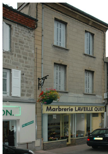
Vue générale. IVR82_20124201311NUCA