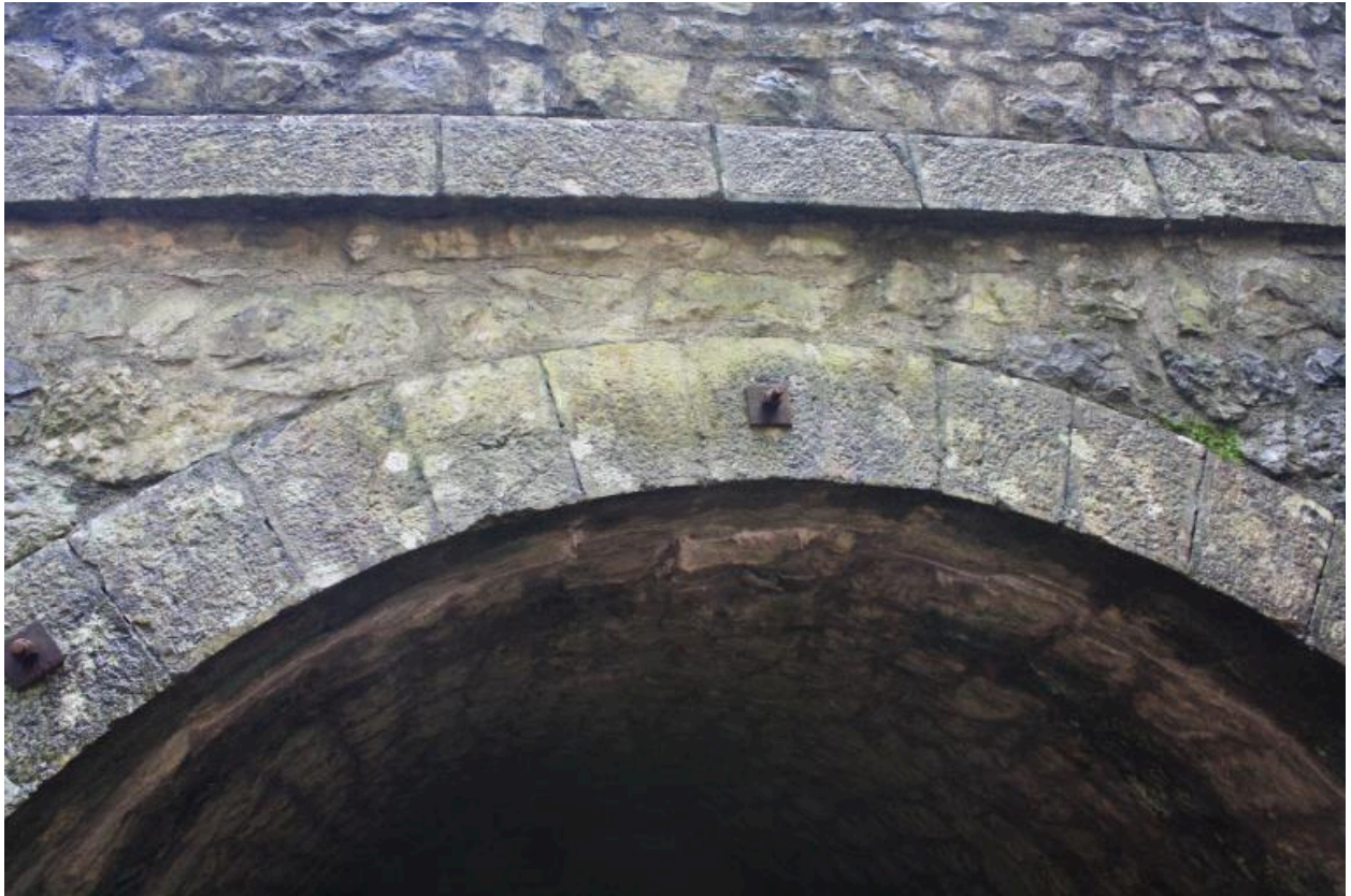
Pont de Trélachaud, détail de la voûte