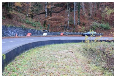
Pont de Trélachaud, contexte, chaussée et garde corps IVR84_20207401552NUCA