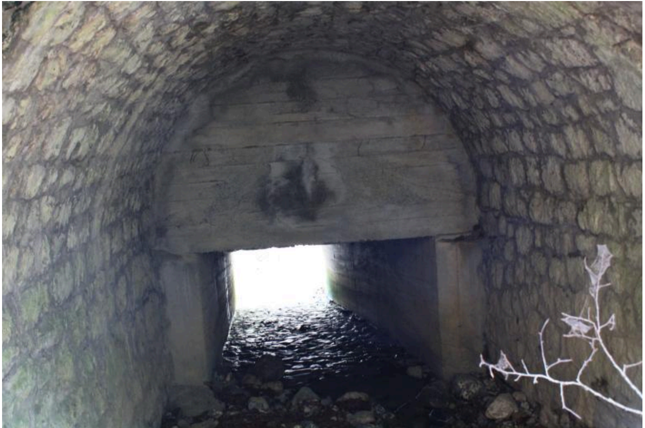
Pont de Trélachaud, intrados et élargissement béton