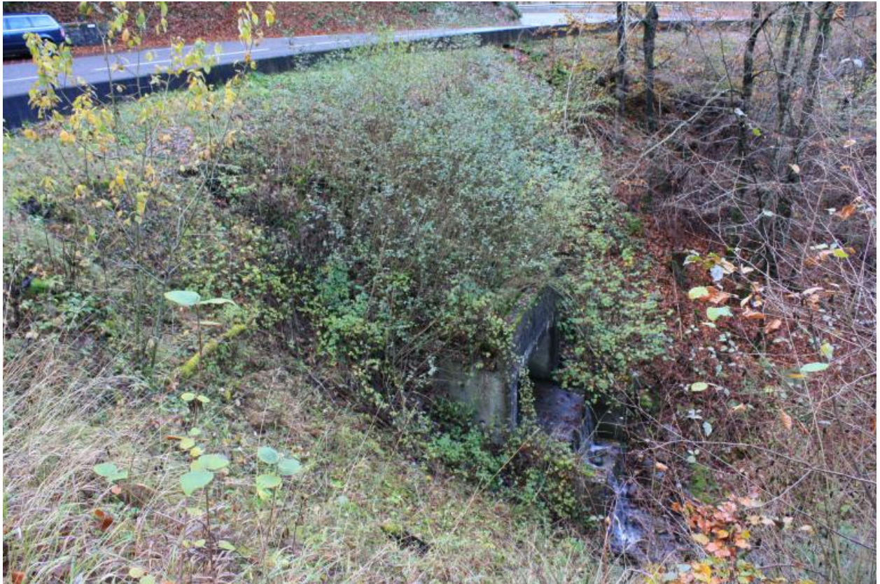
Pont de Trélachaud, face en aval