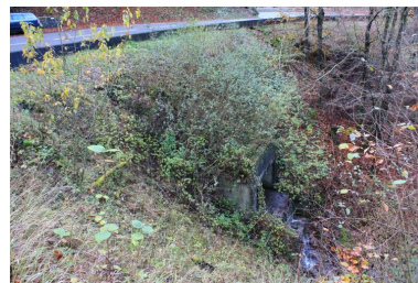
Pont de Trélachaud, face en aval IVR84_20207401551NUCA