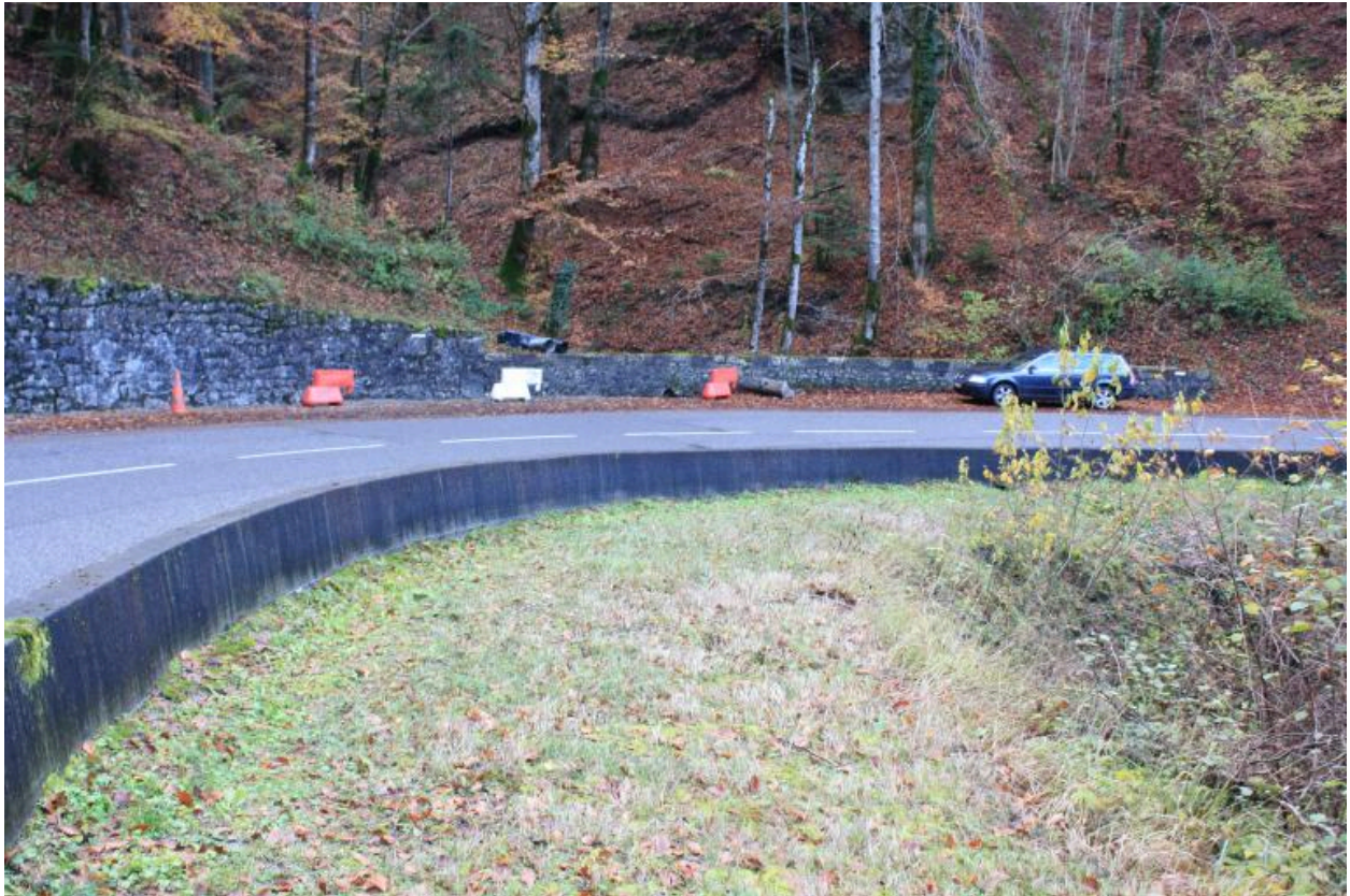
Pont de Trélachaud, contexte, chaussée et gardes corps