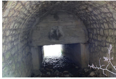
Pont de Trélachaud, intrados et élargissement béton IVR84_20207401556NUCA