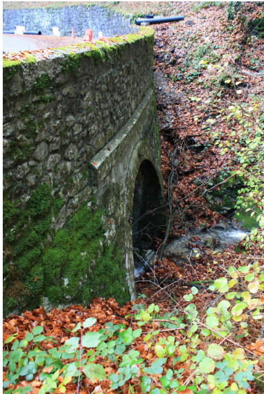
Pont de Trélachaud, tympan amont