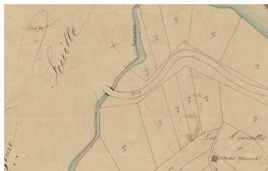
Pont de trélachaud, extrait du cadastre de 1868 IVR84_20207401557NUCA