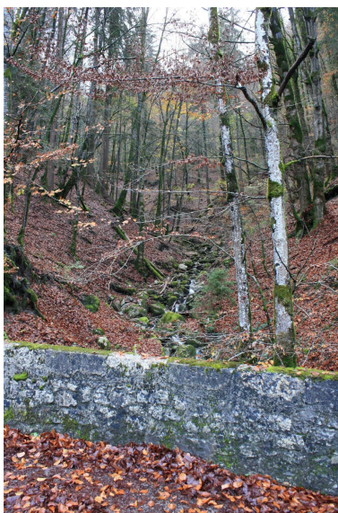
Pont de Trélachaud, contexte et garde corps amont IVR84_20207401553NUCA