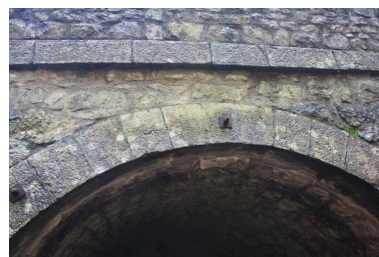
Pont de Trélachaud, détail de la voûte IVR84_20207401554NUCA