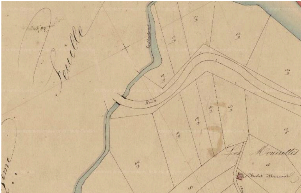
Pont de trélachaud, extrait du cadastre de 1868