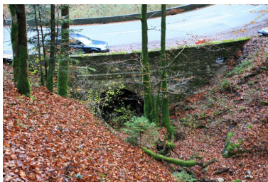
Pont de Trélachaud, face amont IVR84_20207401500NUCA