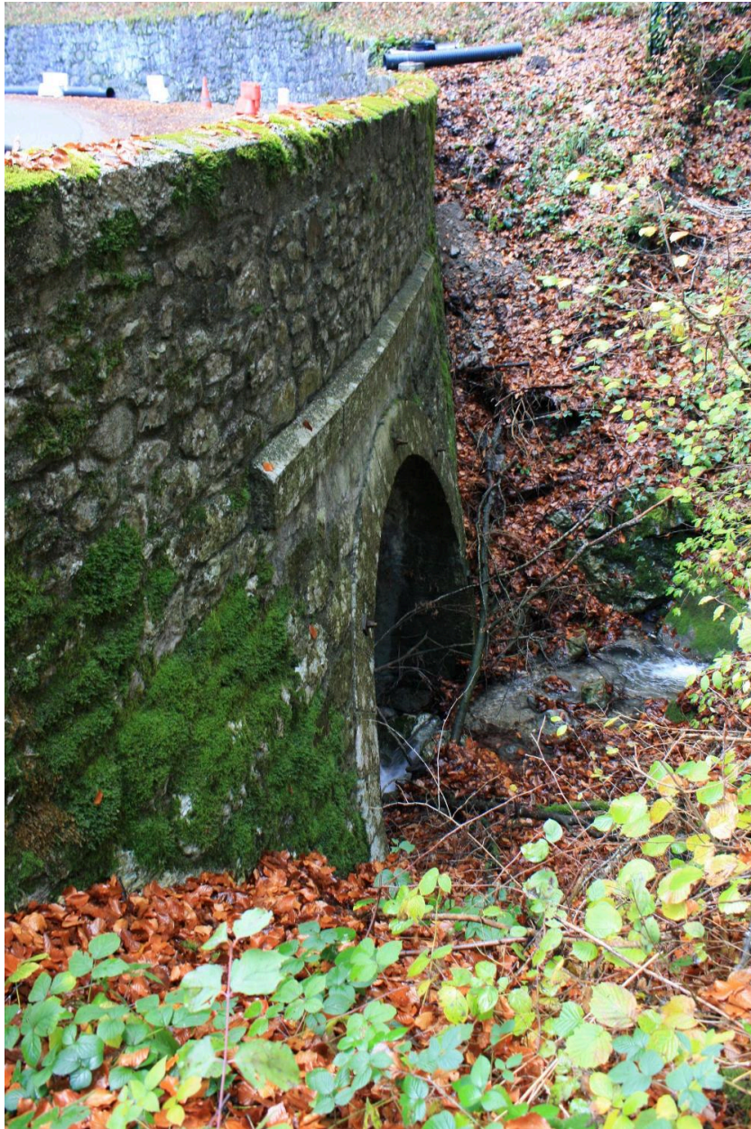
Pont de Trélachaud, tympan amont