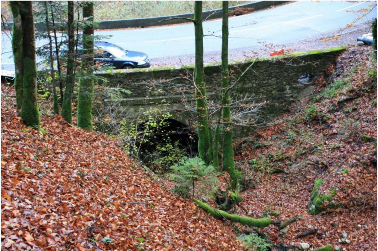
Pont de Trélachaud, face amont