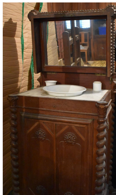
Vue de détail de la toilette d'homme IVR84_20216301426NUC4A