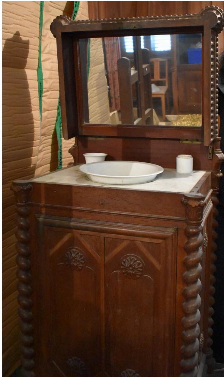
Vue de détail de la toilette d'homme