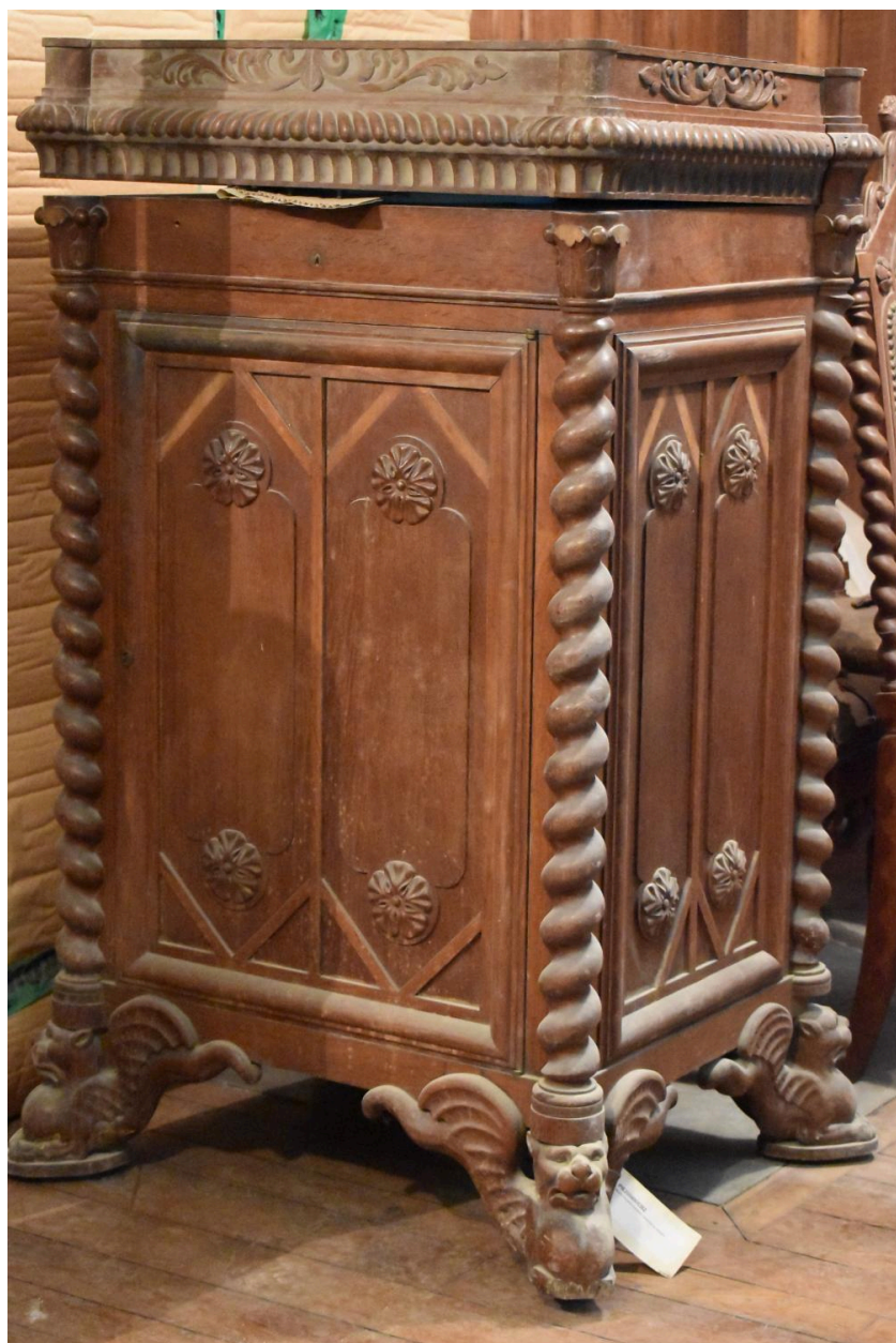
Vue générale de la toilette d'homme fermée