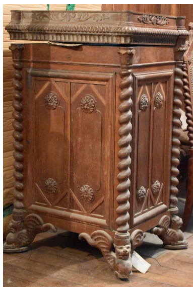
Vue générale de la toilette d'homme fermée IVR84_20216301424NUC4A