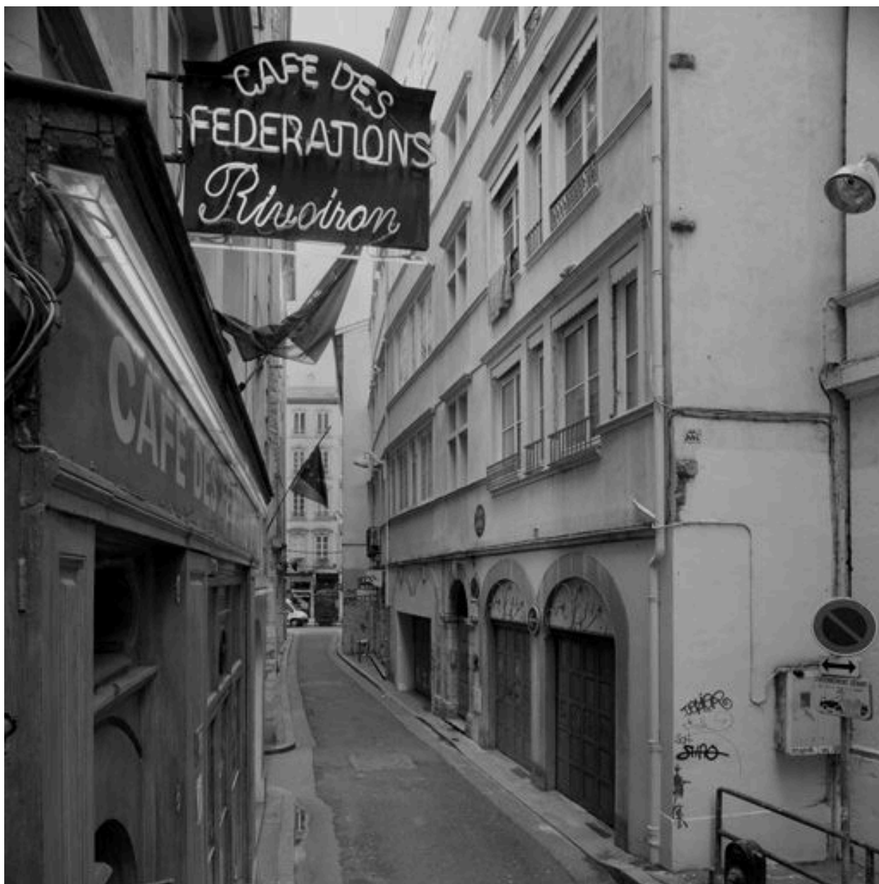
Vue générale des façades sur la rue du Major-Martin