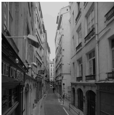
Façades des deux immeubles du 5, rue du Major-Martin