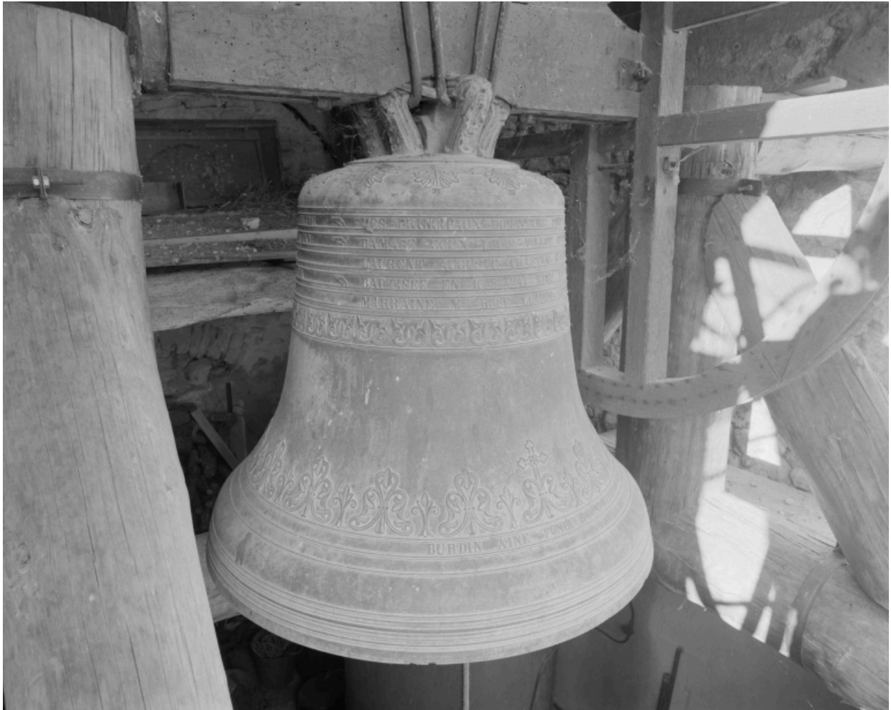
Vue prise du sud-ouest.