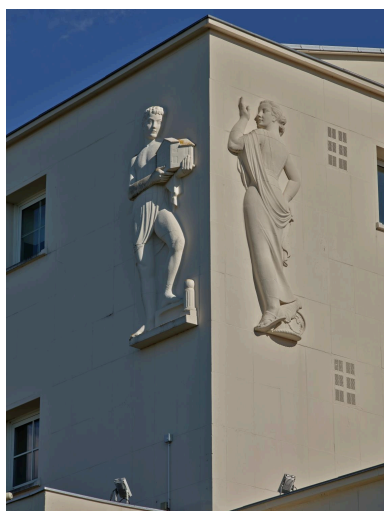
Les Arts ménagers et les Arts de la toilette féminine en 2025 IVR84_20250300347NUC4A