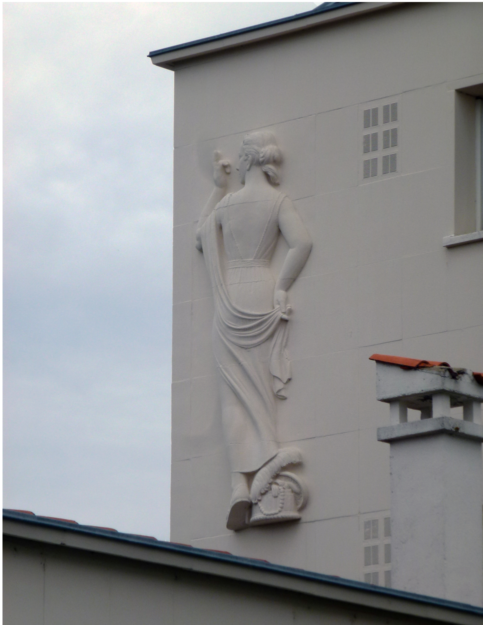
Les Arts de la toilette féminine