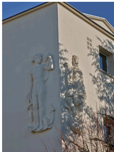
L'Abondance et les Echanges en 2025 IVR84_20250300344NUC4A