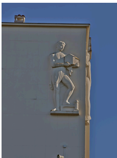
Les Arts ménagers en 2025 IVR84_20250300345NUC4A