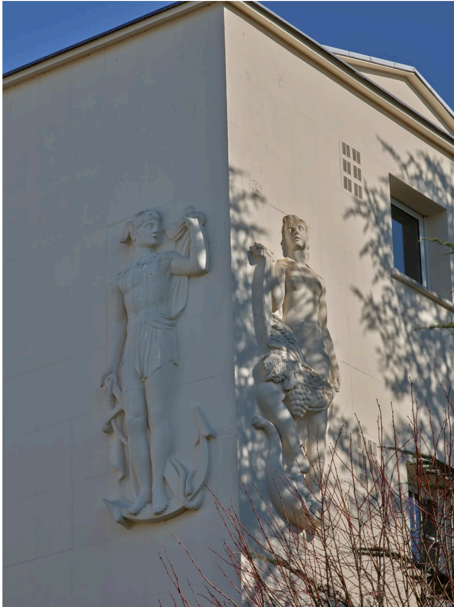
L'Abondance et les Echanges en 2025