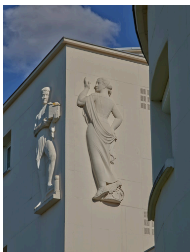
Les Arts de la toilette féminine en 2025 IVR84_20250300346NUC4A