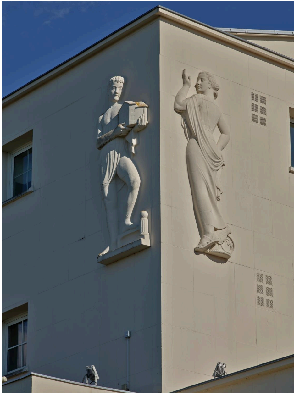
Les Arts ménagers et les Arts de la toilette féminine en 2025