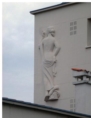
Les Arts de la toilette féminine IVR84_20250300210NUCA