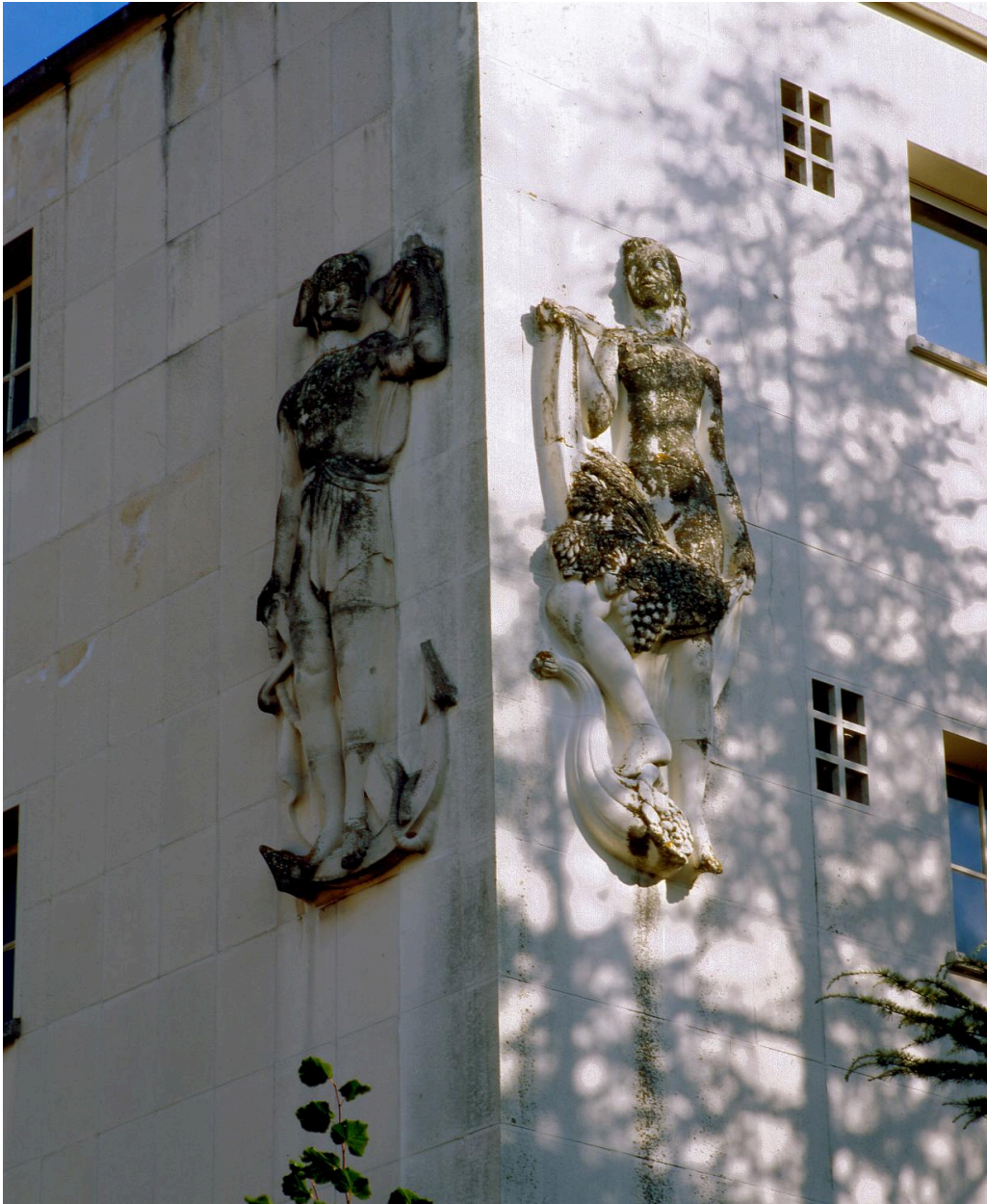
Vue d'ensemble : L'Abondance et les Echanges, en 2007