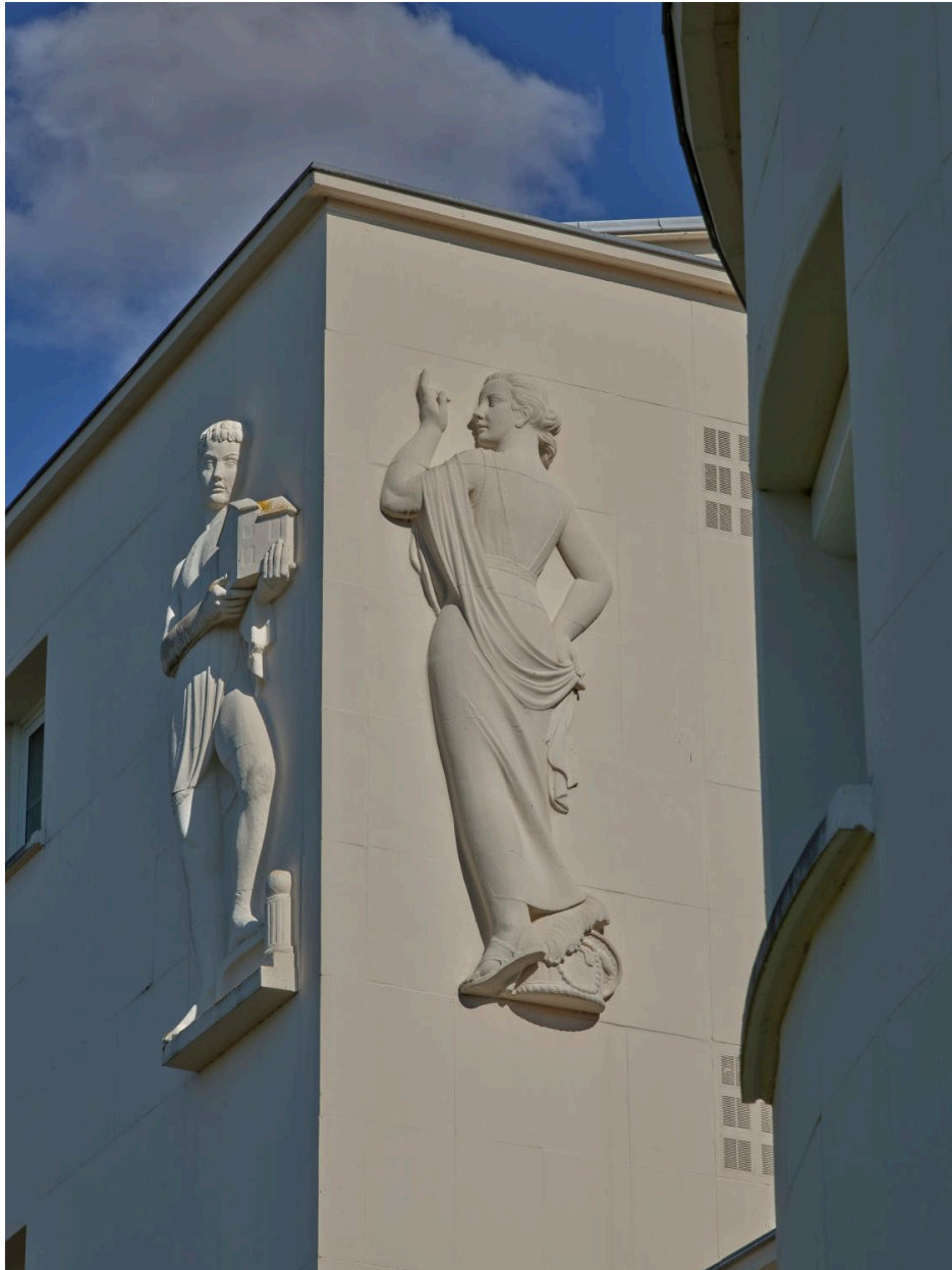
Les Arts de la toilette féminine en 2025