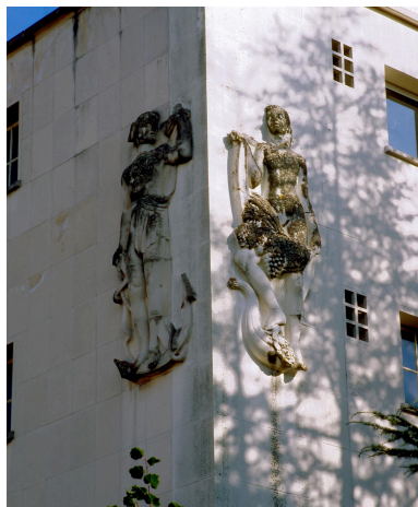
Vue d'ensemble : L'Abondance et les Echanges, en 2007 IVR83_20070300023XA