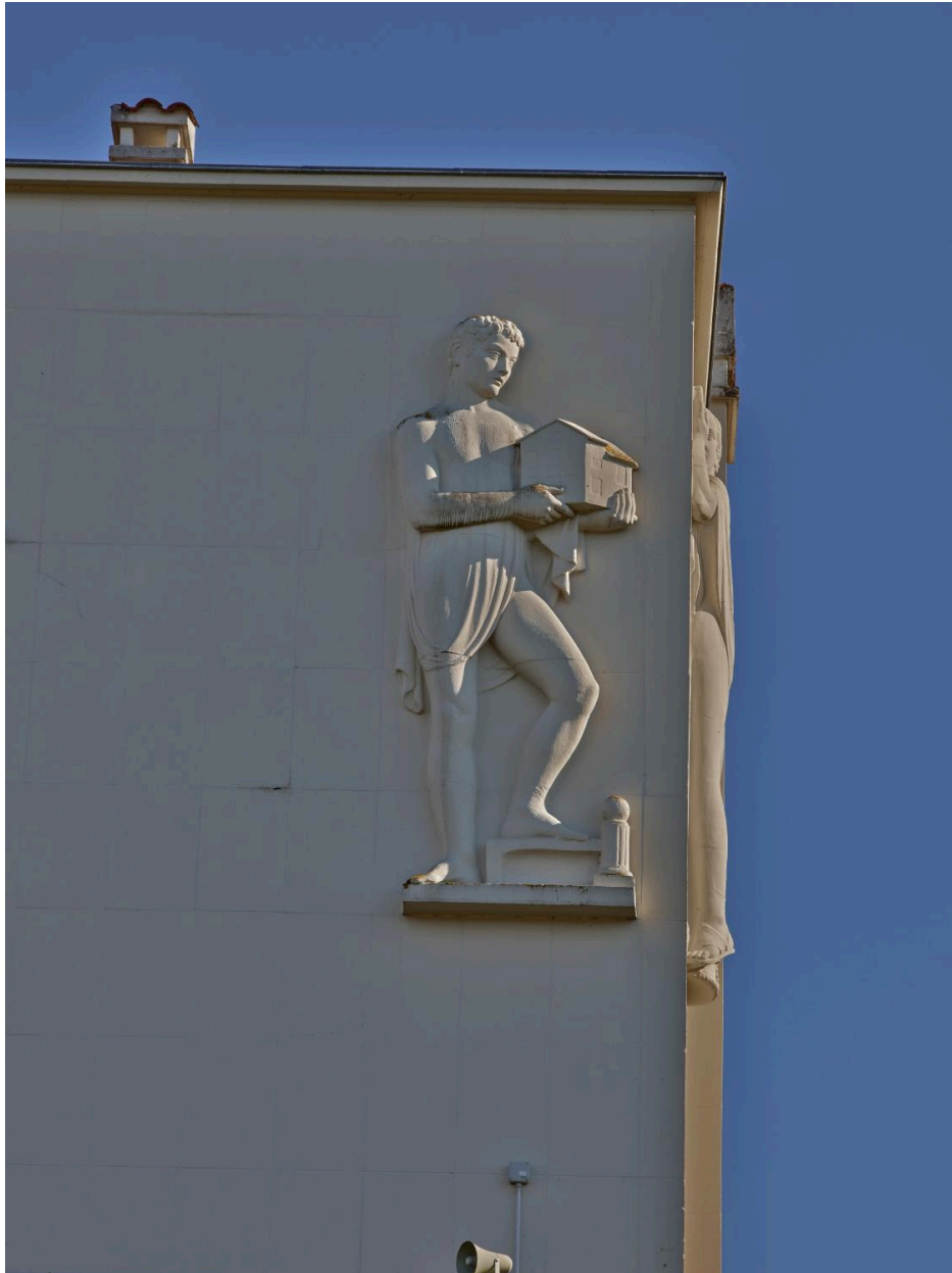
Les Arts ménagers en 2025