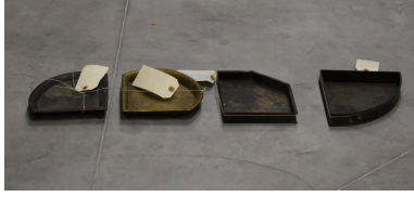
Vue générale IVR84_20226301093NUC4A