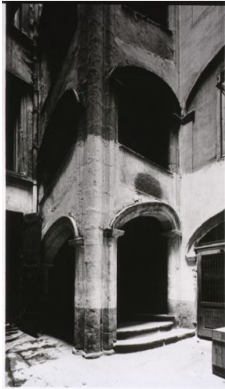
Détail de la cour et de l'escalier, par Jules Sylvestre, ca 1900