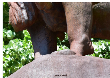
Nom de la fonderie d'art IVR84_20226300808NUCA