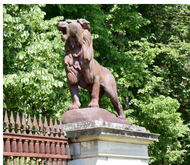
Vue générale IVR84_20226300806NUCA