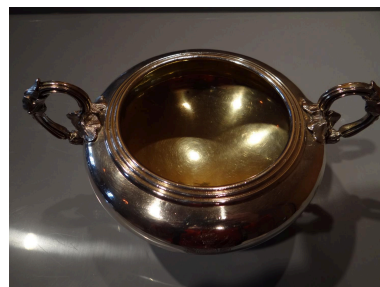
Vue de dessus IVR84_20216301354NUC4A