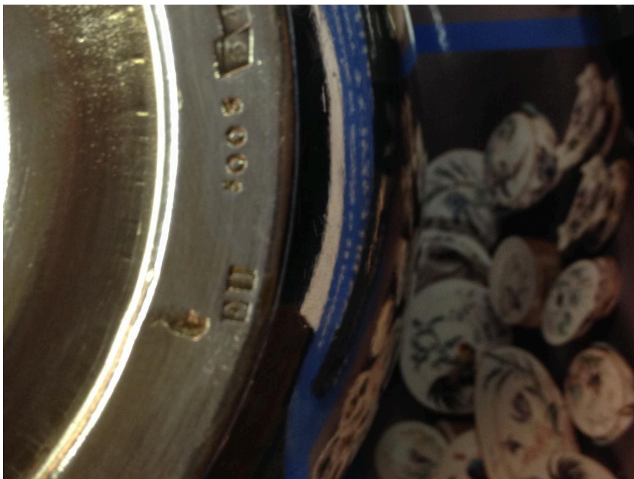
Détail des inscriptions