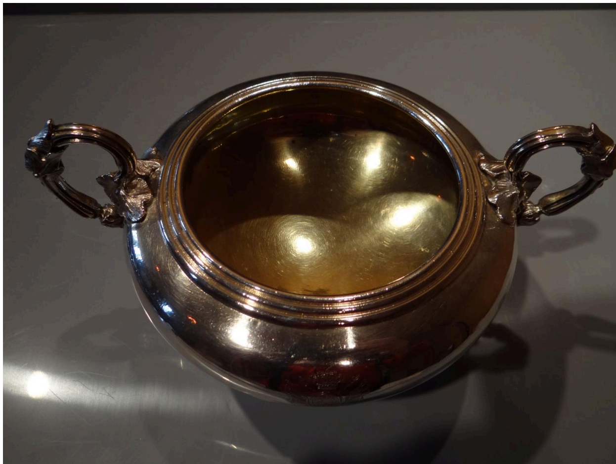
Vue de dessus