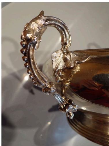
Vue d'une anse IVR84_20216301353NUC4A