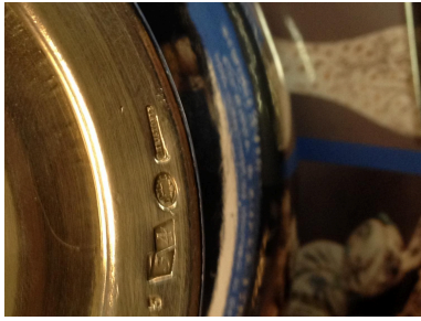
Détail des inscriptions IVR84_20216301356NUC4A