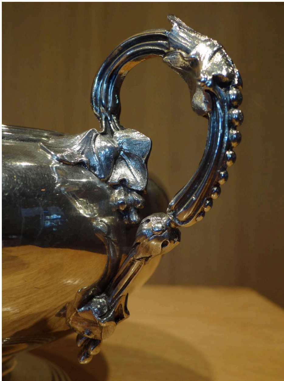
Vue d'une anse