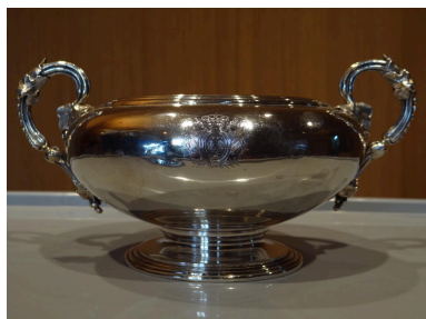
Vue générale IVR84_20216301352NUC4A