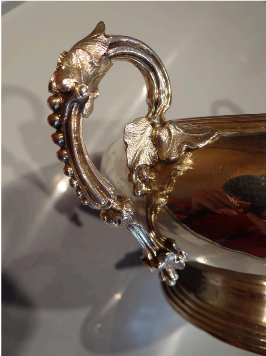
Vue d'une anse