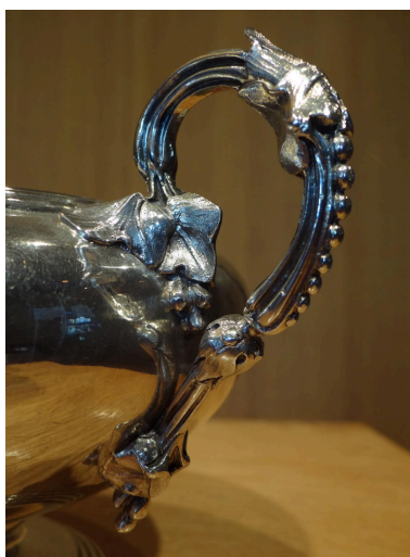
Vue d'une anse