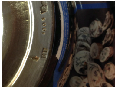
Détail des inscriptions