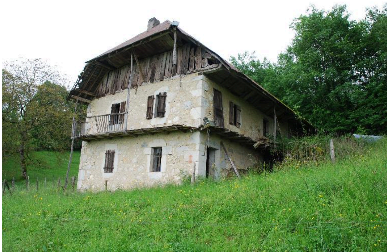
Vue d'ensemble de la ferme de trois quart avant droit.