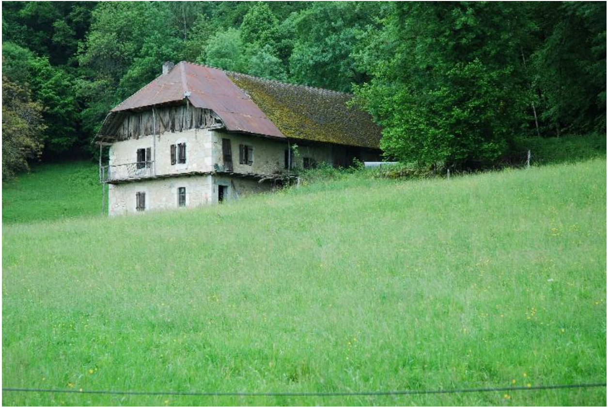
Vue générale de la ferme dans son site