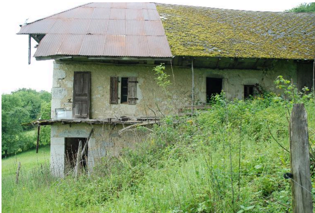
Vue générale de la façade latérale de face.