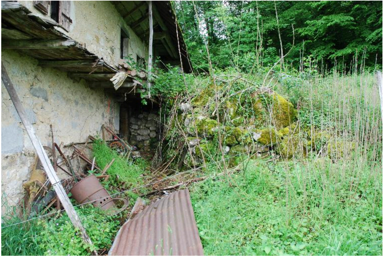
Entrée de la cave située dans la façade latérale droite.