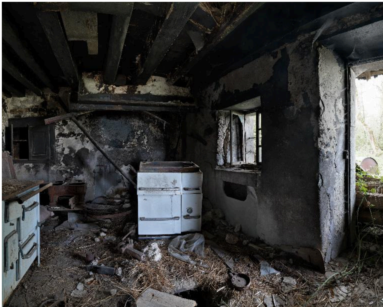
Vue d'ensemble intérieure de la cuisine.