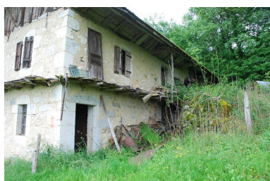
Vue générale de la façade latérale droite de trois quart. IVR82_20157302534NUCA