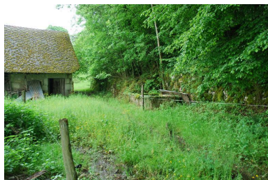
Vue d'ensemble du bassin se trouvant sur l'arrière de la ferme.