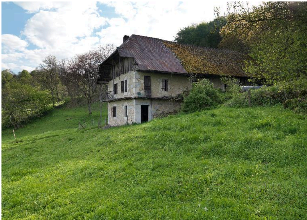
Vue d'ensemble de trois-quart avant gauche.