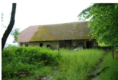
Vue d'ensemble de la façade latérale droite, partie amont avec la grange et l'étable.