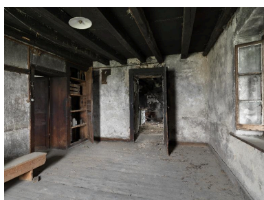
Vue d'ensemble d'une chambre. IVR82_20157303914NUCAQ