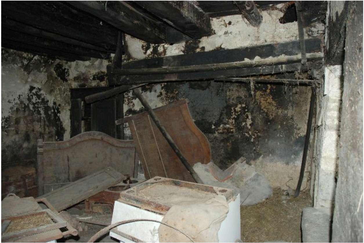
Vue intérieure de la cuisine du logis, cheminée monumentale.