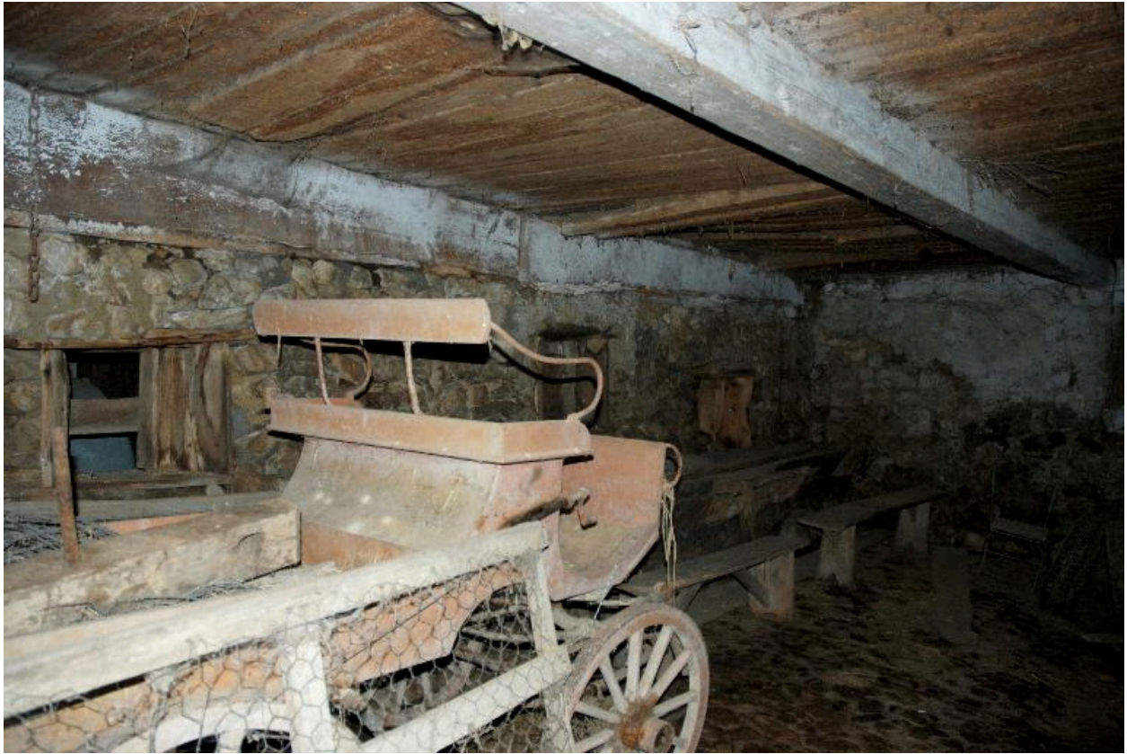
Vue partielle intérieure de l'étable.