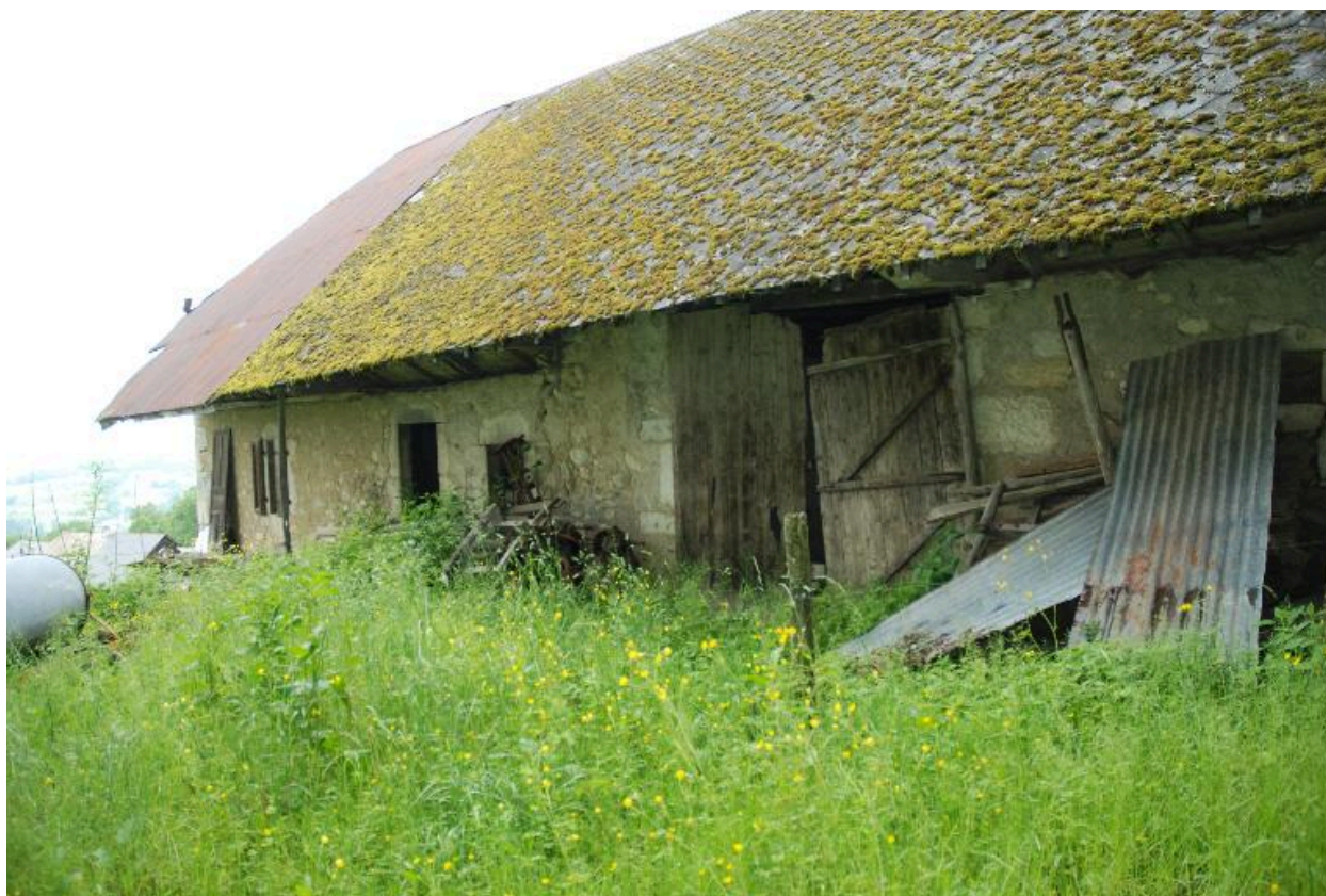
Vue partielle de la partie latérale droite, portes de la grange.