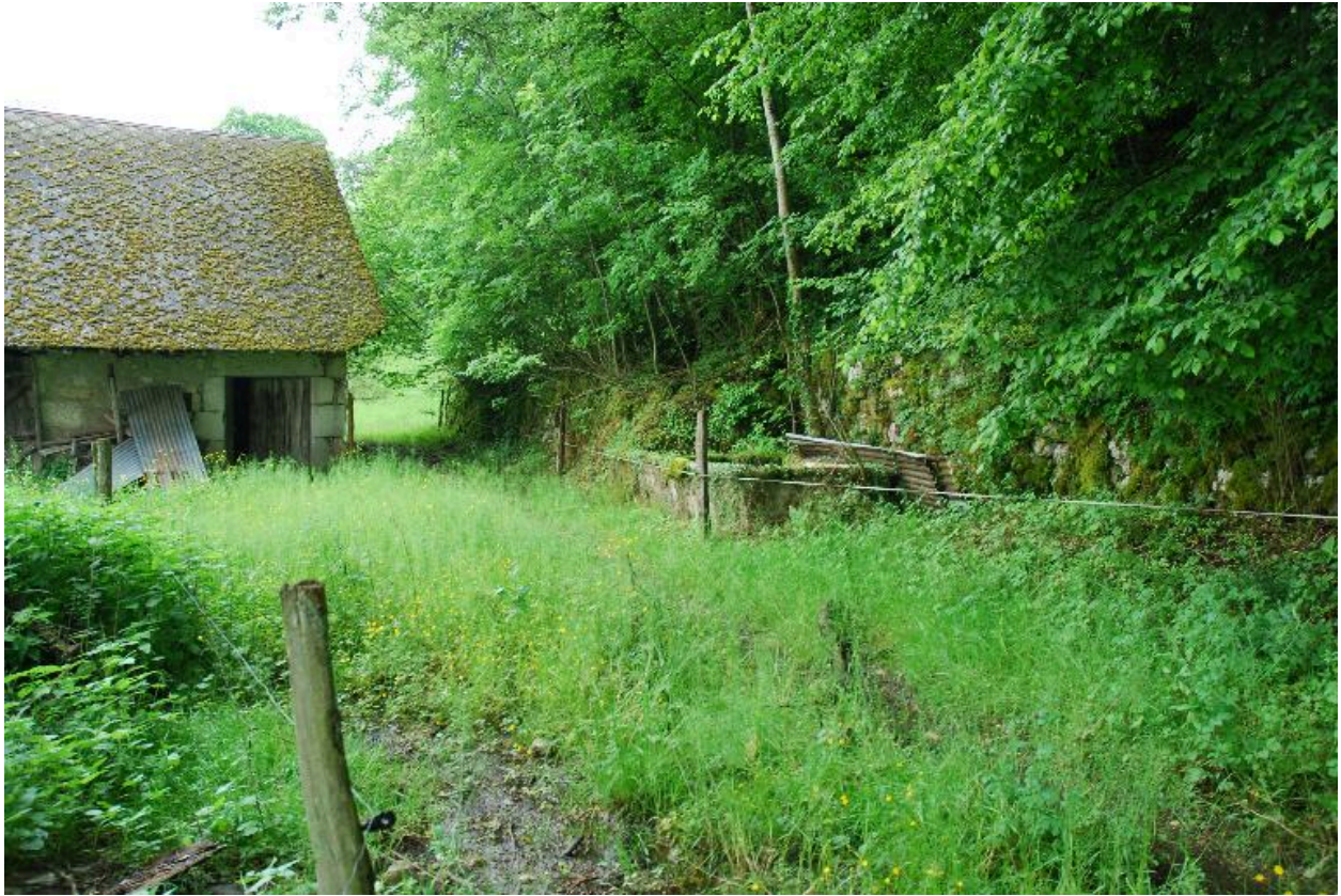
Vue d'ensemble du bassin se trouvant sur l'arrière de la ferme.