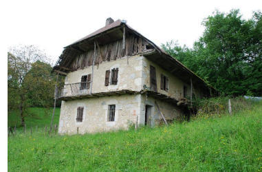
Vue d'ensemble de la ferme de trois quart avant droit. IVR82_20157302533NUCA