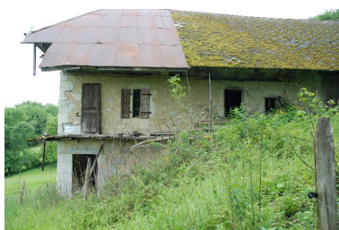
Vue générale de la façade latérale de face.