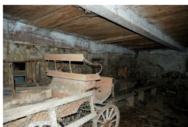
Vue partielle intérieure de l'étable.