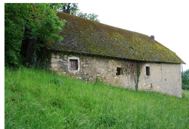
Vue d'ensemble de la façade latérale arrière.