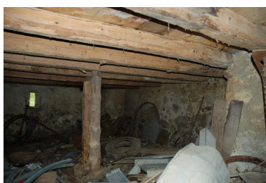
Vue partielle intérieure de l'étable.