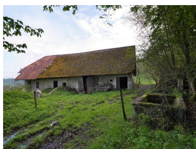
Vue d'ensemble de face. IVR82_20157303897NUCAQ