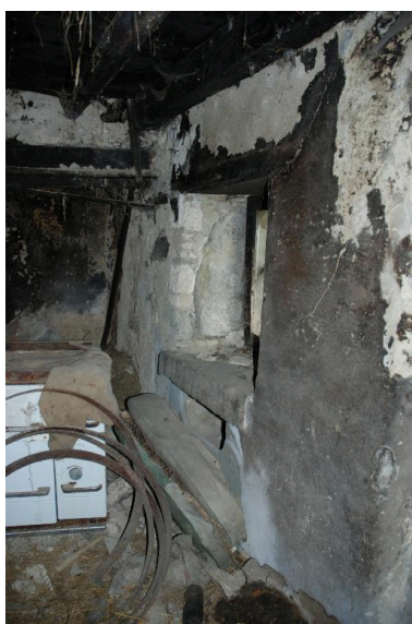
Vue intérieure de la cuisine du logis, potager. IVR82_20157302543NUCA