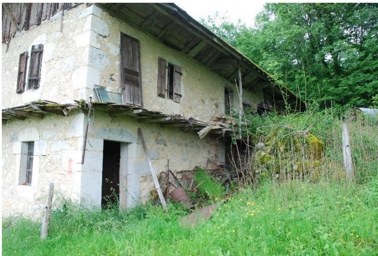
Vue générale de la façade latérale droite de trois quart.