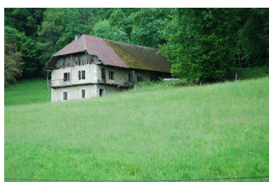
Vue générale de la ferme dans son site IVR82_20157302532NUCA