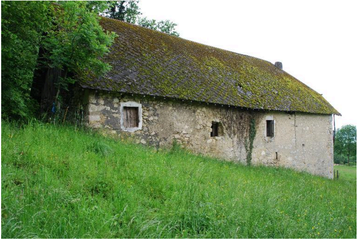
Vue d'ensemble de la façade latérale arrière.