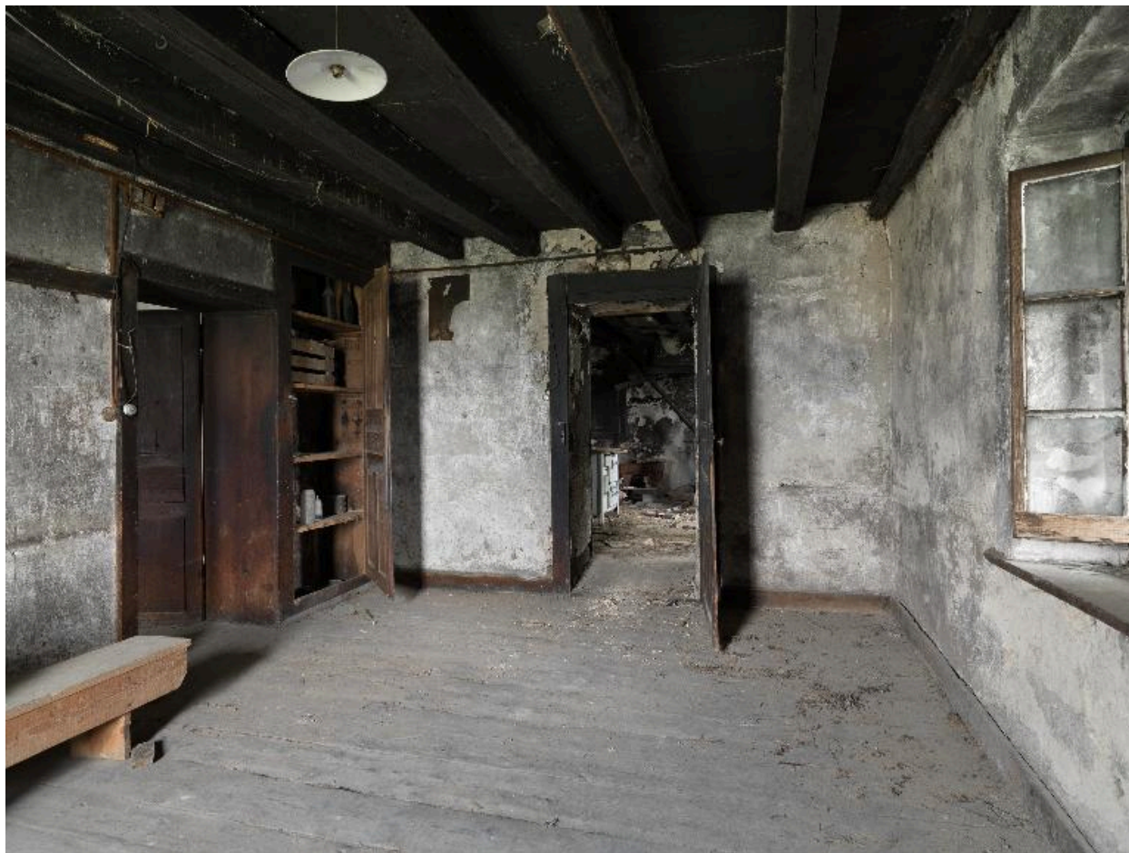
Vue d'ensemble d'une chambre.