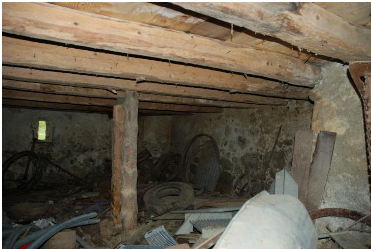
Vue partielle intérieure de l'étable.