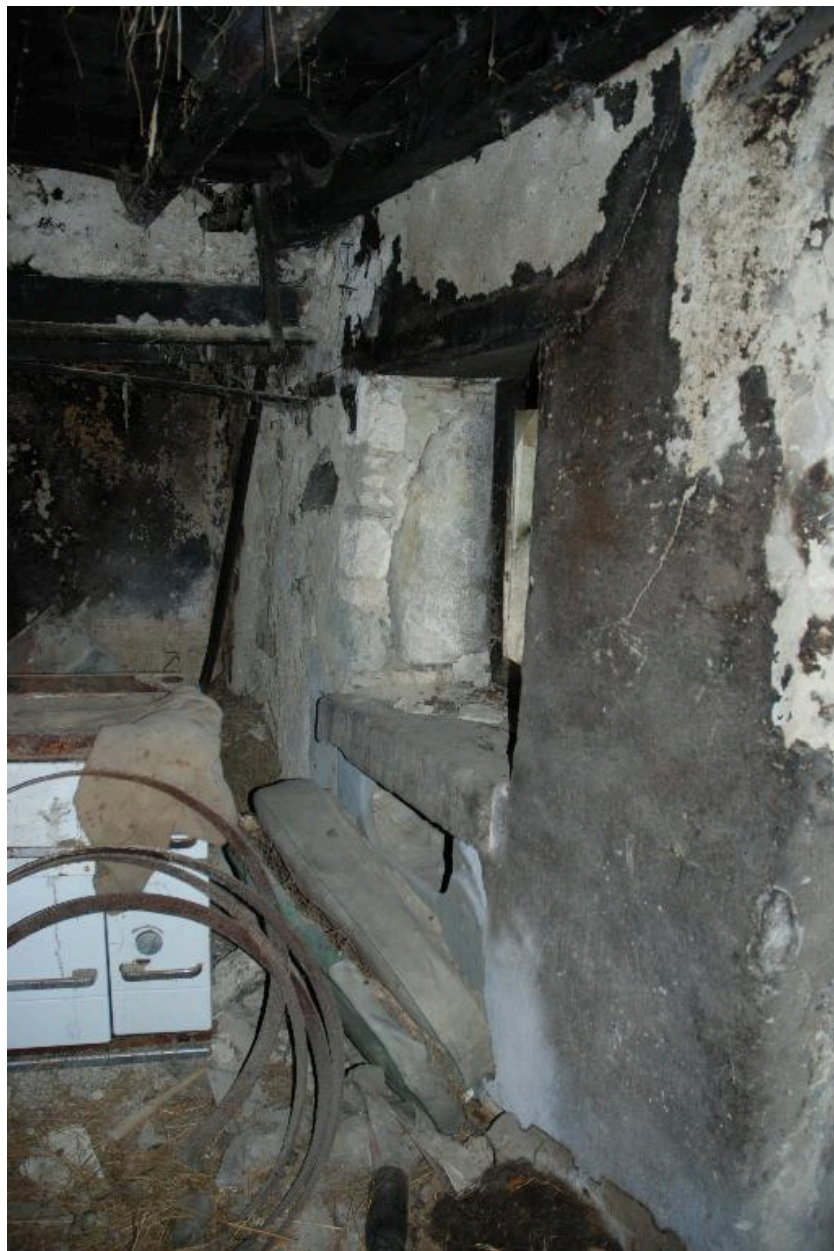
Vue intérieure de la cuisine du logis, potager.