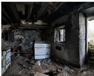
Vue d'ensemble intérieure de la cuisine. IVR82_20157303901NUCAQ