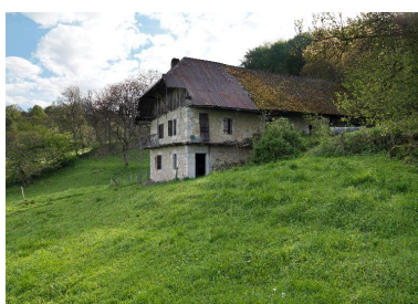
Vue d'ensemble de trois-quart avant gauche.