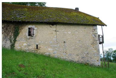
Vue partielle de la façade latérale arrière. IVR82_20157302541NUCA