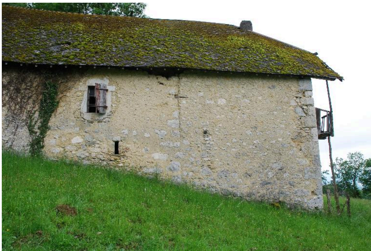
Vue partielle de la façade latérale arrière.