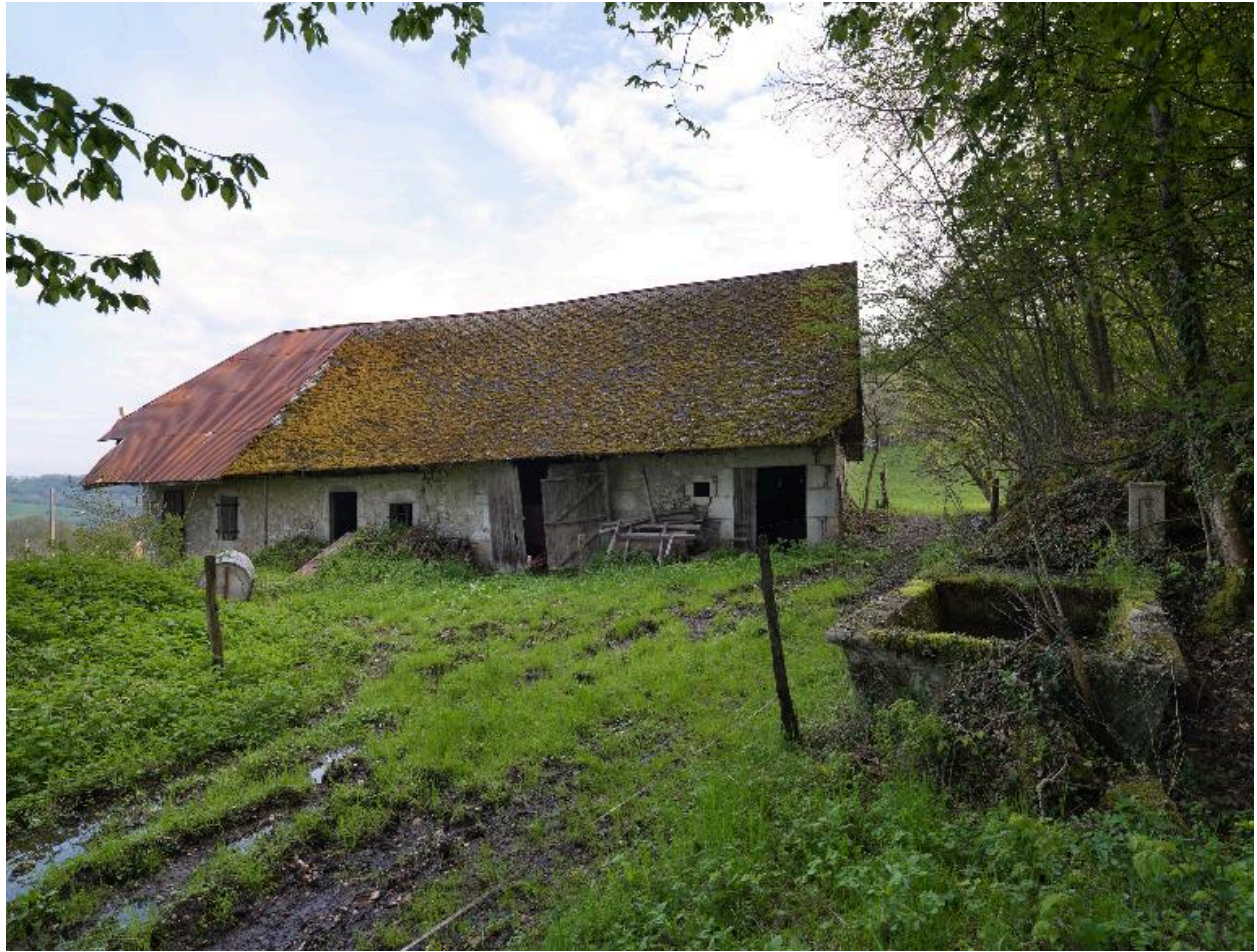
Vue d'ensemble de face.