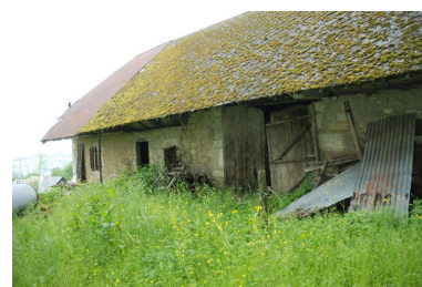
Vue partielle de la partie latérale droite, portes de la grange. IVR82_20157302538NUCA