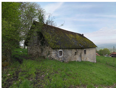
Vue d'ensemble de trois-quart arrière gauche. IVR82_20157303894NUCAQ