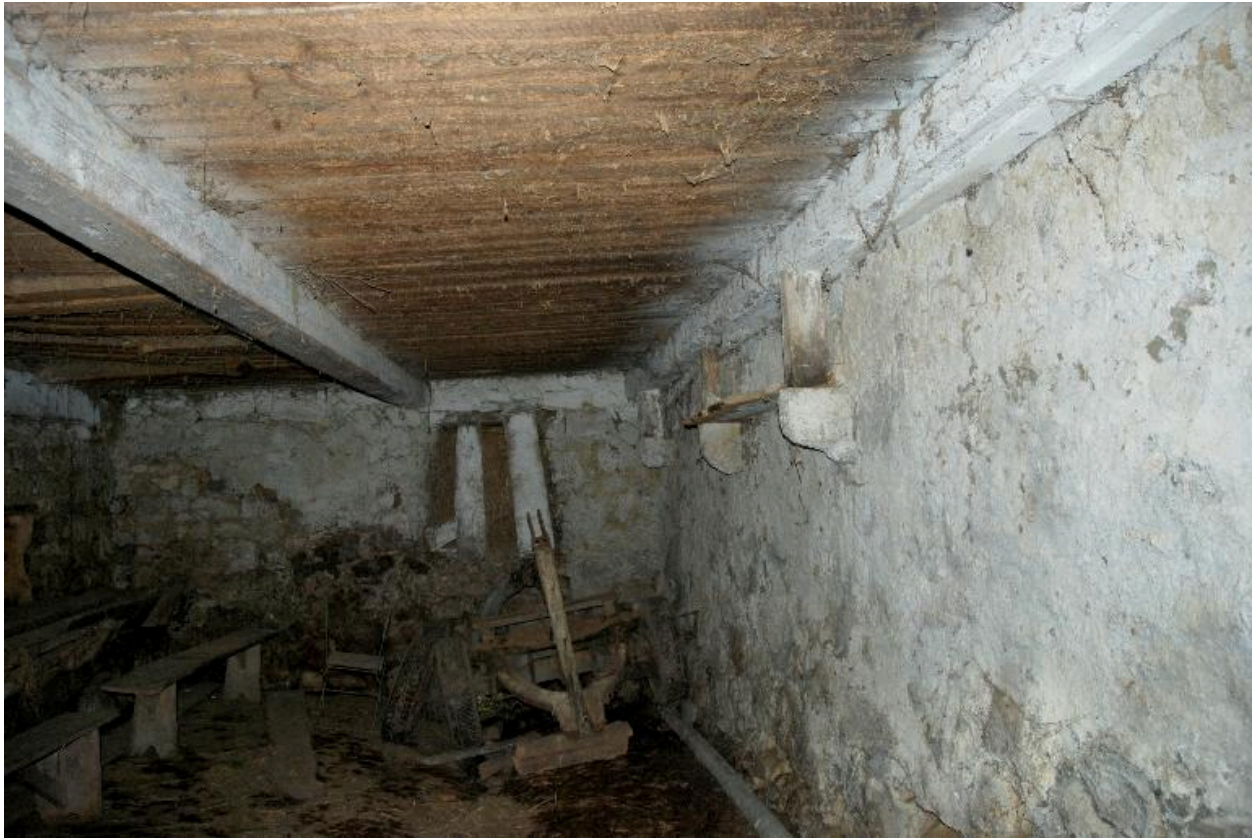
Vue partielle intérieure de la cave.