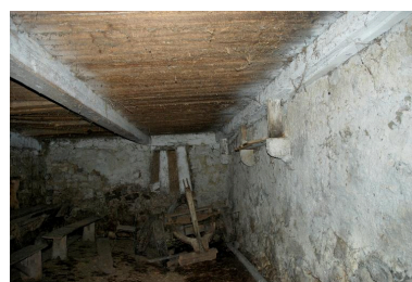
Vue partielle intérieure de la cave.