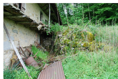
Entrée de la cave située dans la façade latérale droite. IVR82_20157302536NUCA