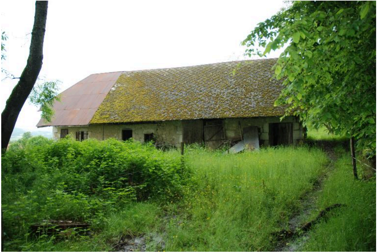
Vue d'ensemble de la façade latérale droite, partie amont avec la grange et l'étable.