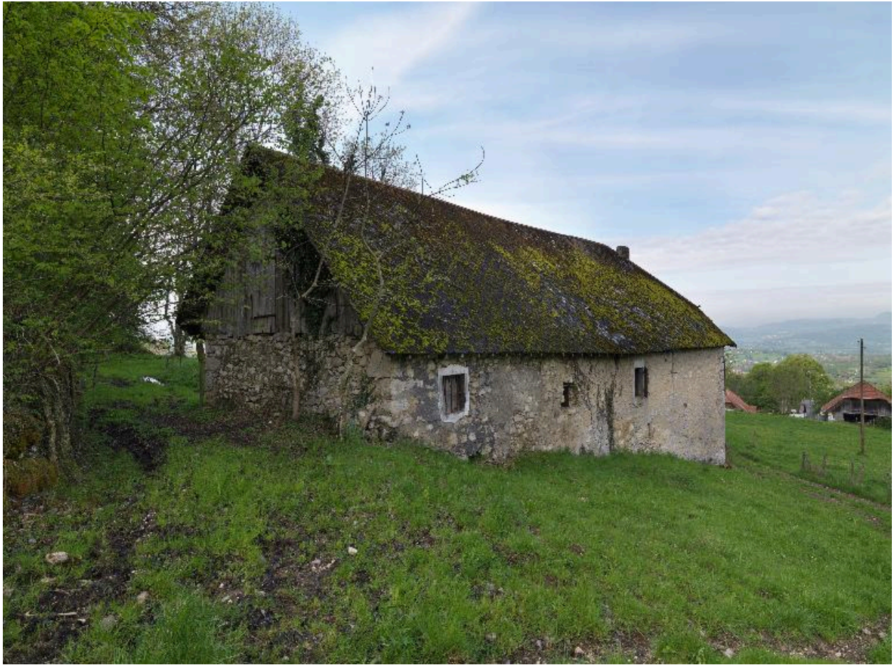
Vue d'ensemble de trois-quart arrière gauche.