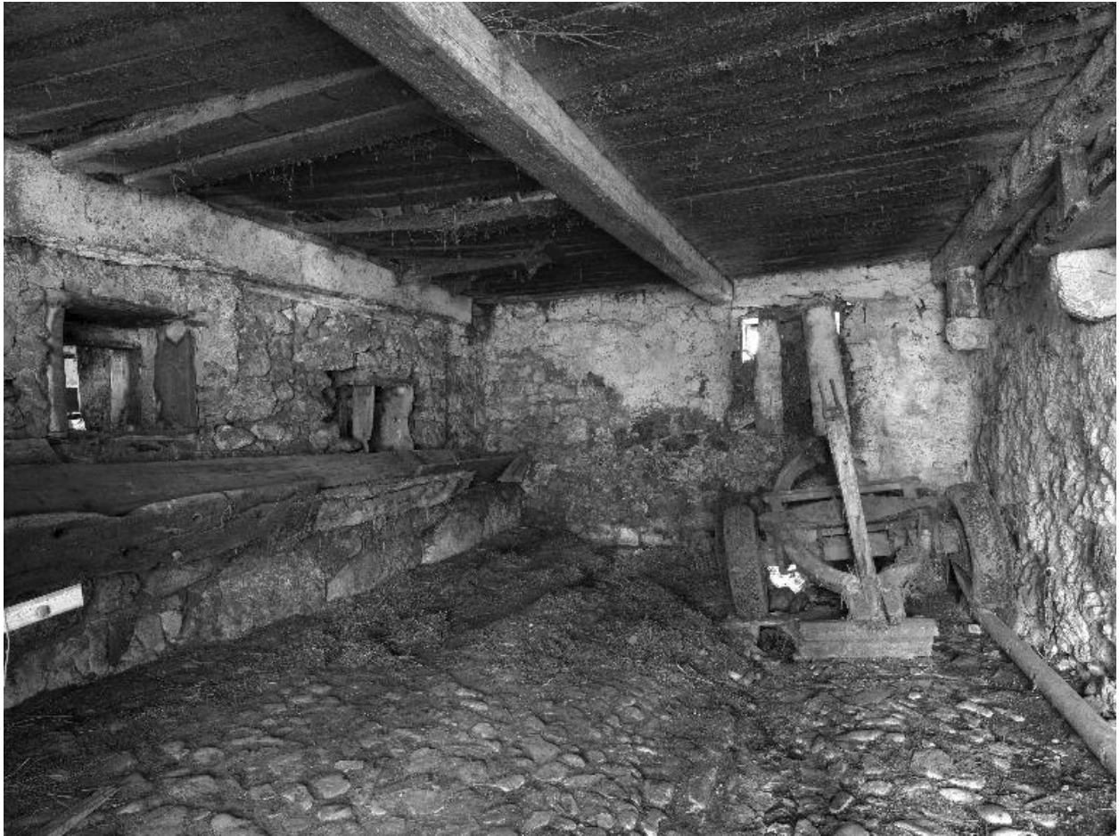
Vue d'ensemble de l'étable.