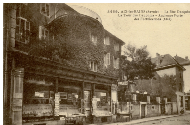
Vue générale IVR82_20057300204NUCB