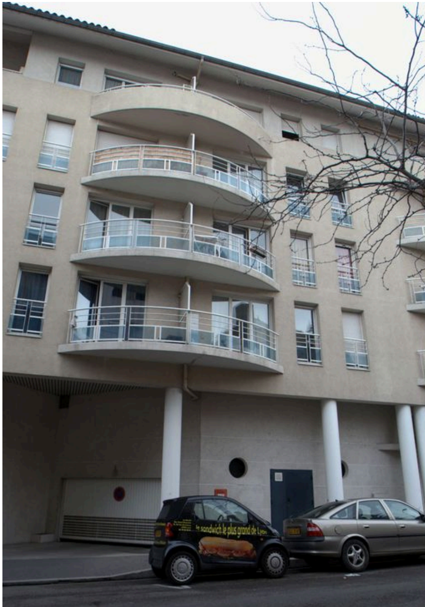
Entrée et détail des balcons