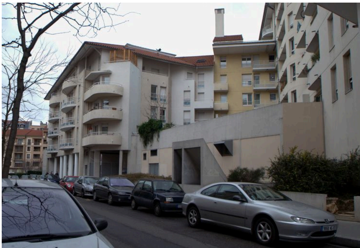
Elévation antérieure, vue d'ensemble depuis l'est