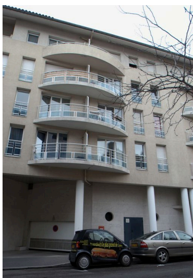
Entrée et détail des balcons IVR82_20116901713NUCA