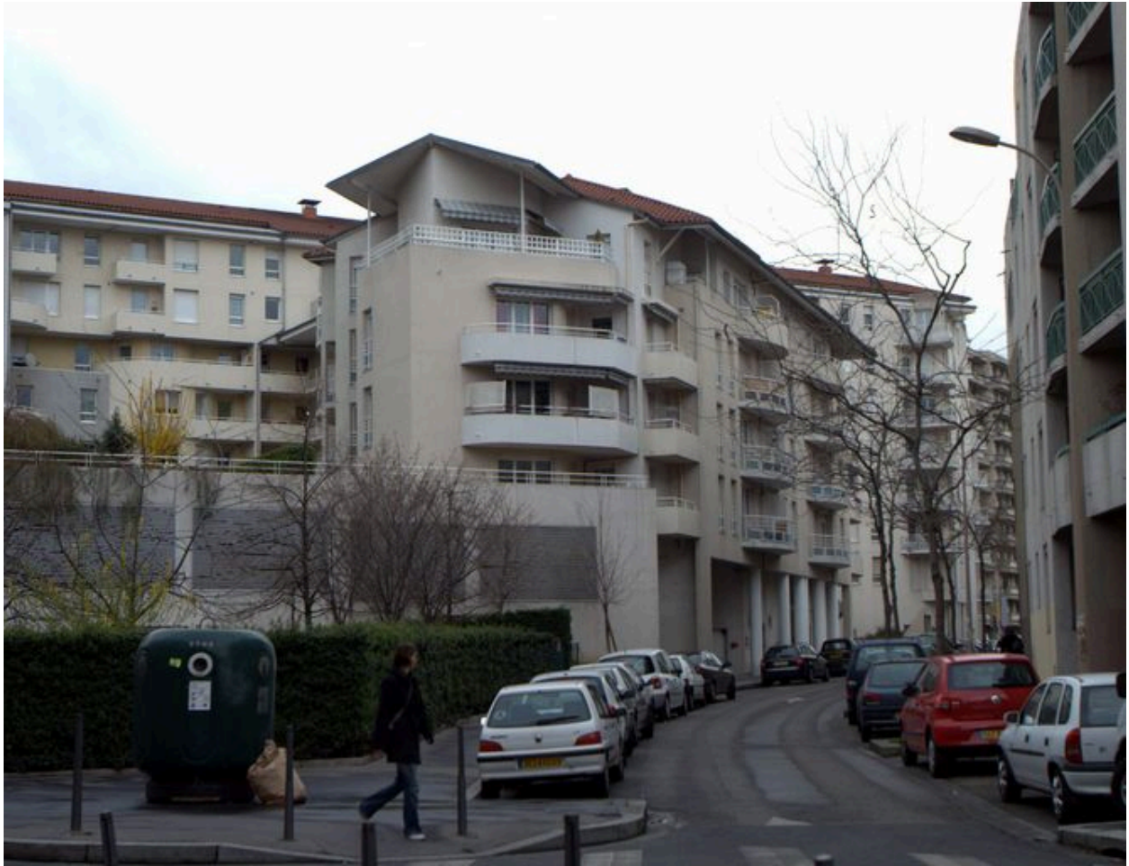
Elévation antérieure, vue d'ensemble depuis le sud