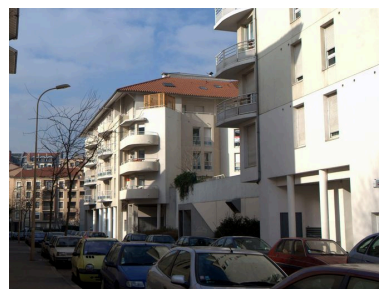
Elévation antérieure, vue partielle depuis l'est