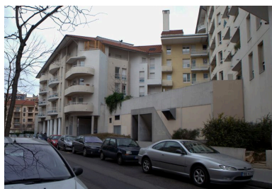
Elévation antérieure, vue d'ensemble depuis l'est IVR82_20116901711NUCA