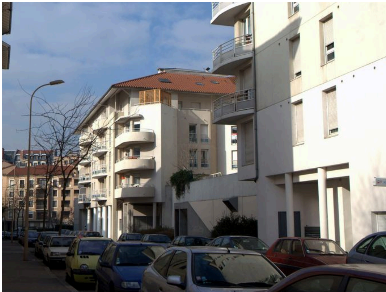
Élévation antérieure, vue partielle depuis l'est