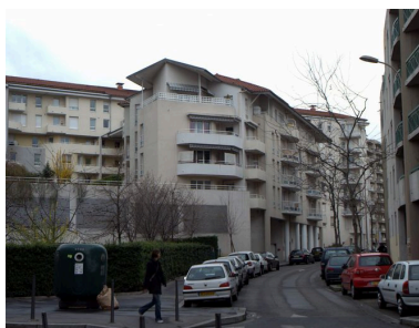
Elévation antérieure, vue d'ensemble depuis le sud