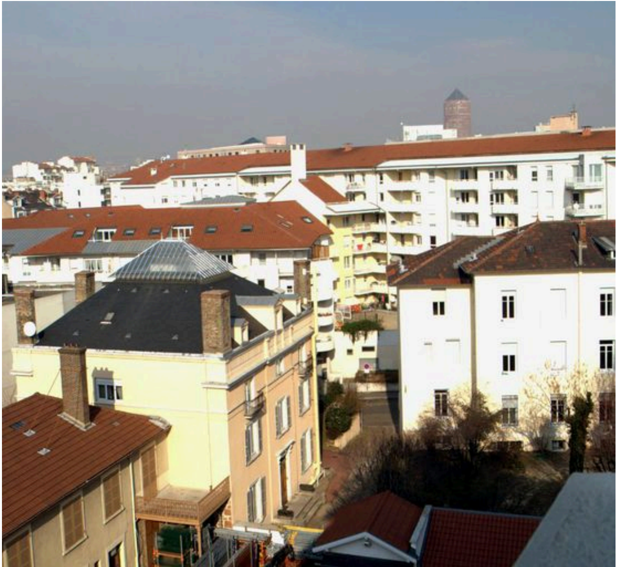
Elévation antérieure, partie supérieure (à l'arrière plan)