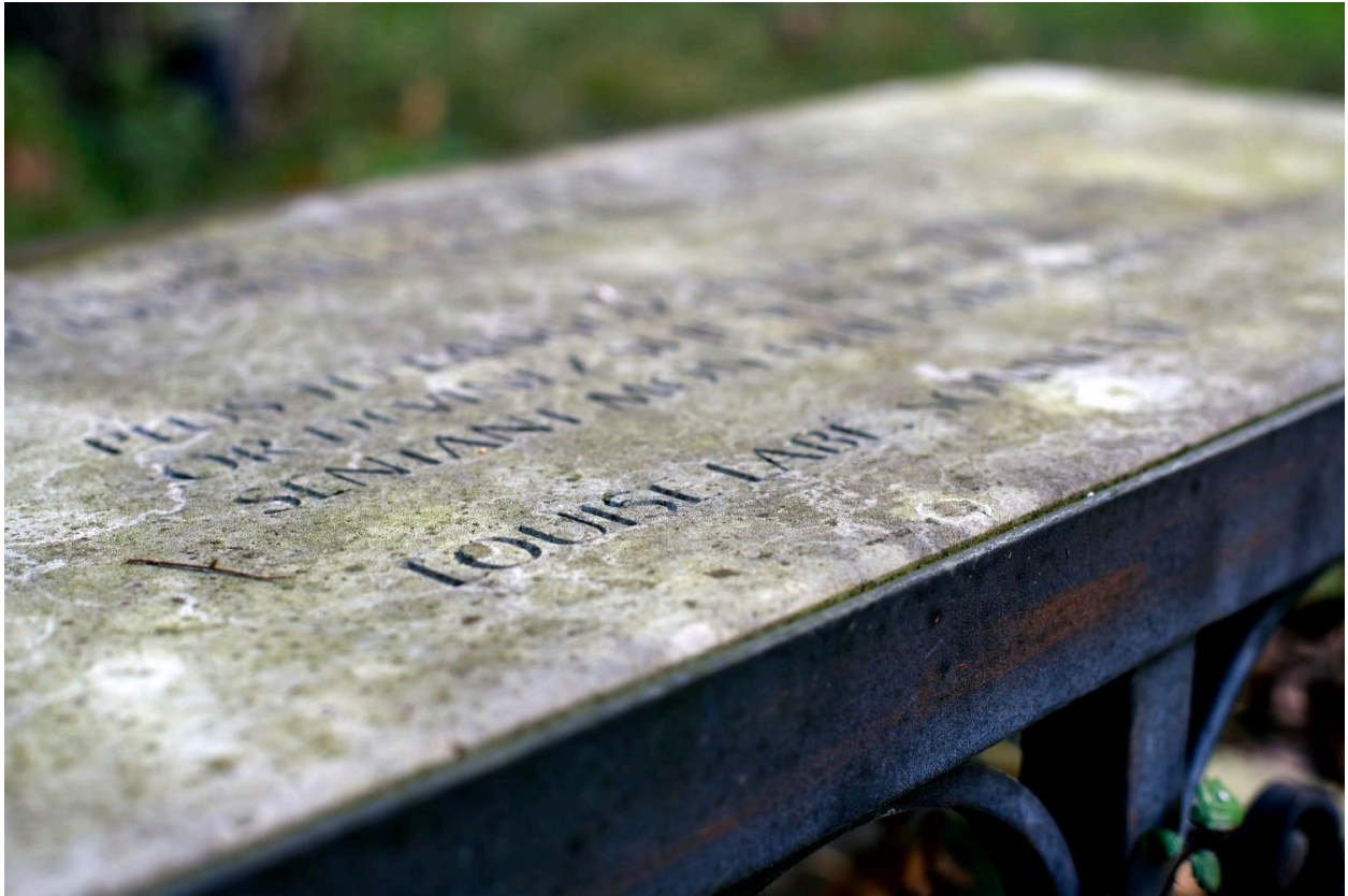
Assise : détail de l'inscription.