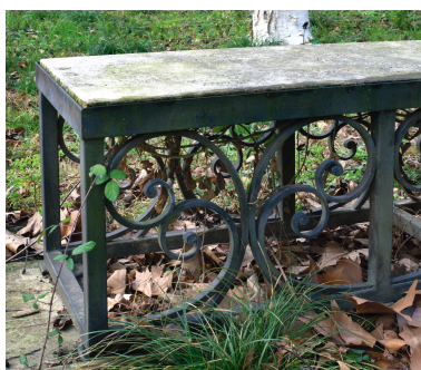
Vue rapprochée : le piétement.