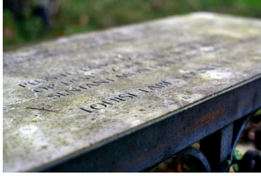
Assise : détail de l'inscription.