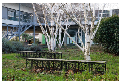
Vue d'ensemble. IVR84_20206900566NUCA