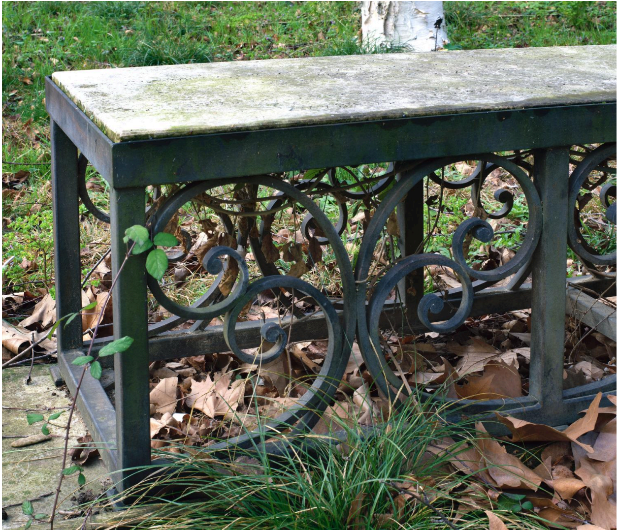
Vue rapprochée : le piètement.