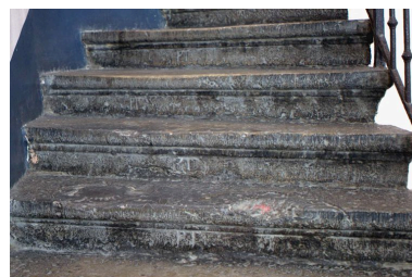
Marques de tâcheron, troisième volée de l'escalier IVR82_20086903100NUCA