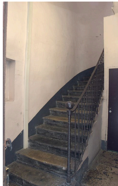
Vue de la première volée de l'escalier IVR82_20086903097NUCA