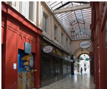
Vue du rez-de-chaussée IVR82_20086902884NUCA