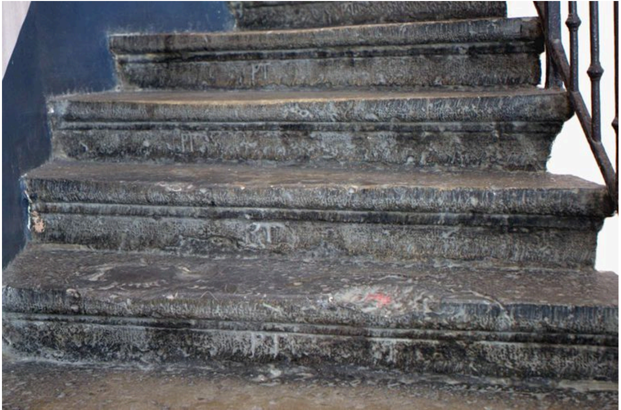
Marques de tâcheron, troisième volée de l'escalier