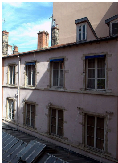
Vue de l'élévation antérieure depuis le sud-est IVR82_20086903096NUCA