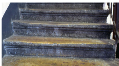
Marques de tâcheron, deuxième volée de l'escalier IVR82_20086903099NUCA