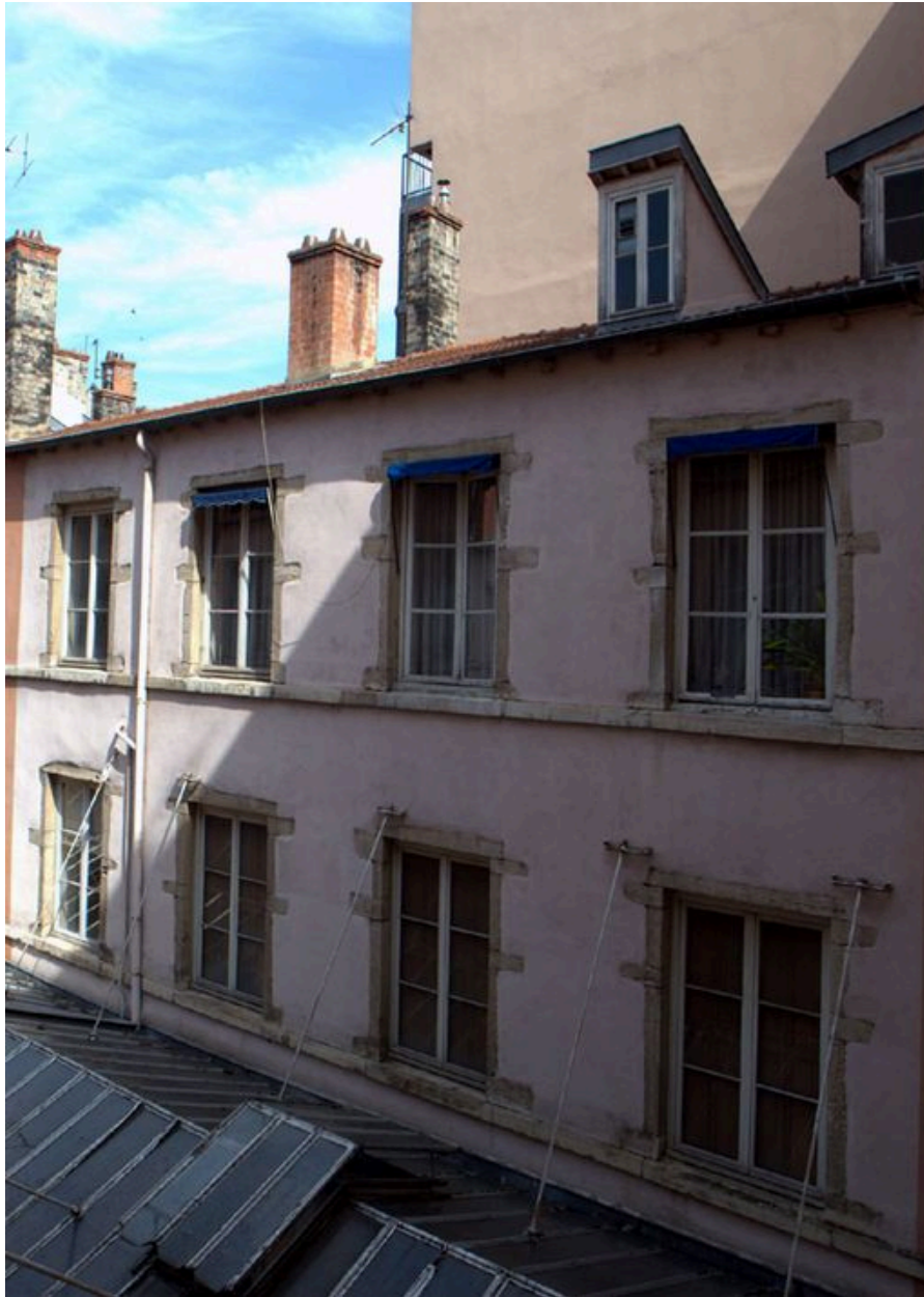
Vue de l'élévation antérieure depuis le sud-est