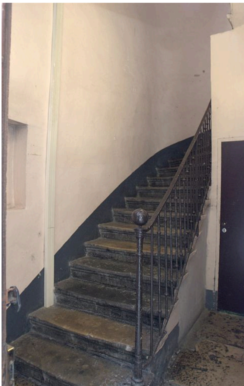
Vue de la première volée de l'escalier