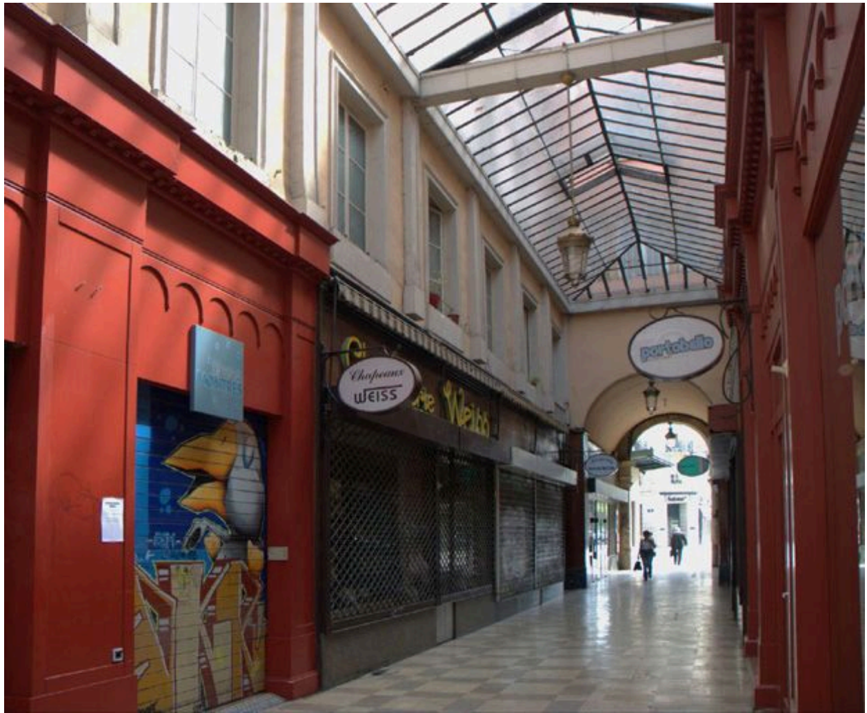
Vue du rez-de-chaussée