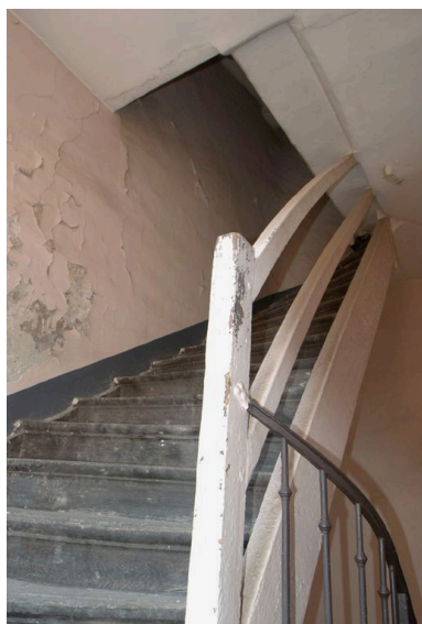
Vue de la dernière volée de l'escalier IVR82_20086903098NUCA