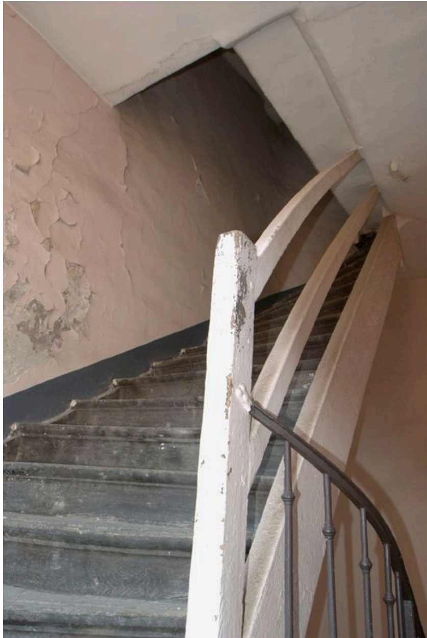
Vue de la dernière volée de l'escalier