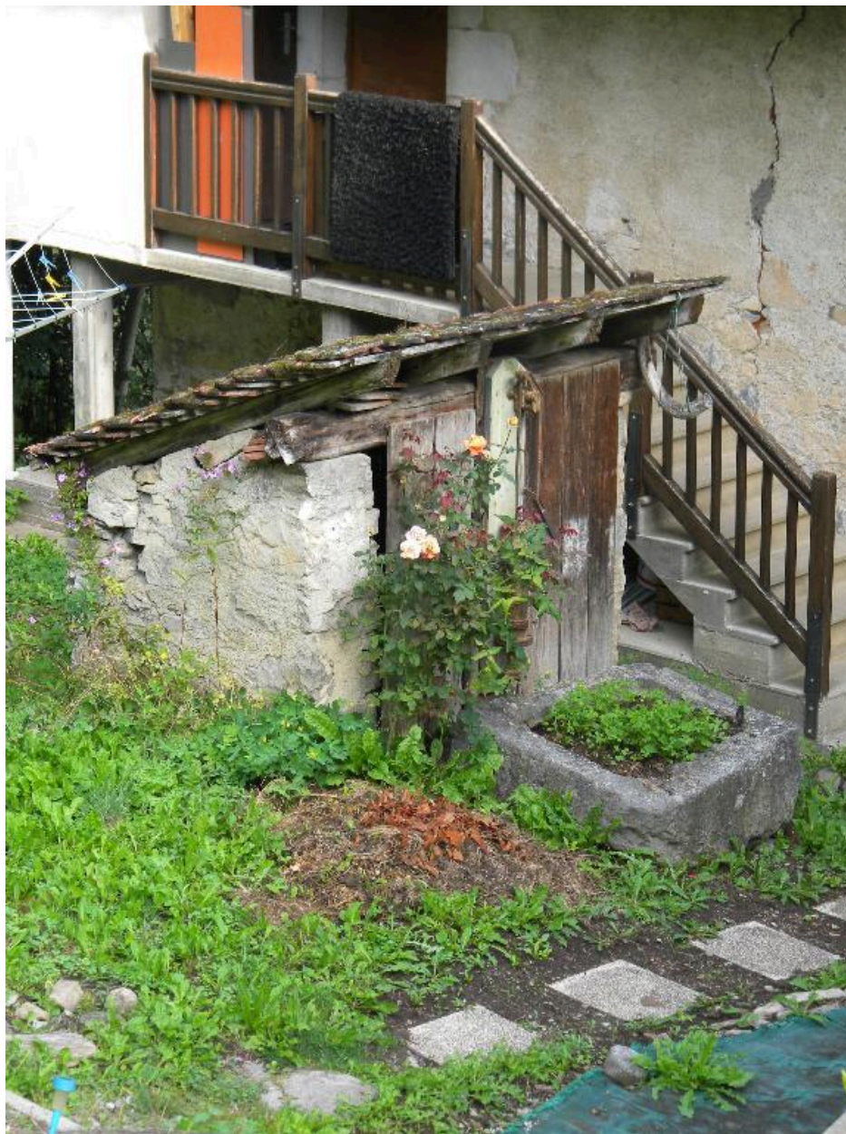
Vue du puits situé devant le bâtiment du four à pain.