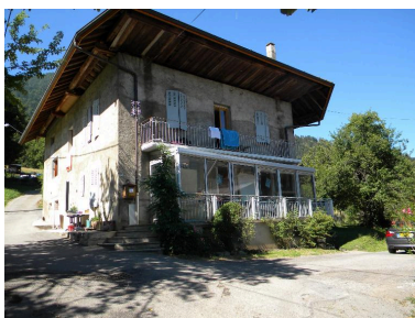
Vue de trois quarts d'une maison modifiée (2008 F4 2324). IVR82_20137401119NUCA