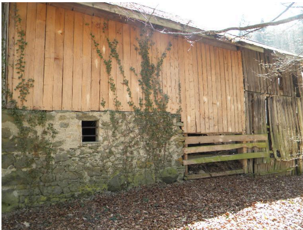
Vue de la façade arrière d'une grange-étable isolée (2008 F6 749).