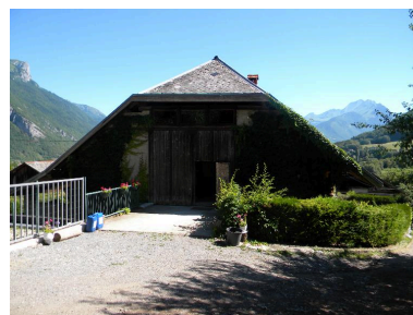
Vue du pignon sud-ouest avec accès au fenil d'une ancienne ferme (2008 F4 603)