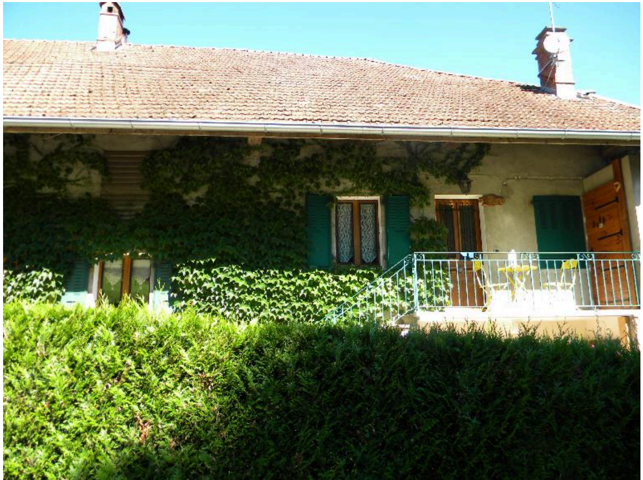
Vue de la façade d'une ancienne ferme (2008 F4 603).