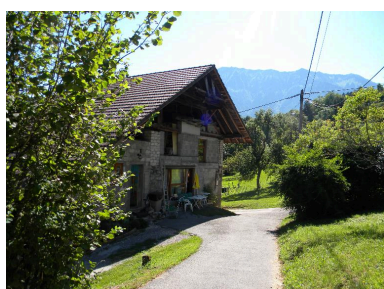
Vue de la façade arrière d'une maison modifiée (2008 F4 2324). IVR82_20137401121NUCA