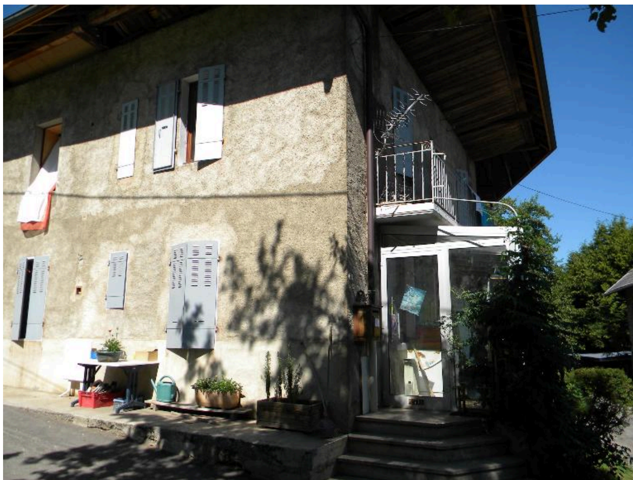
Vue de la façade est d'une maison transformée (2008 F4 2324).