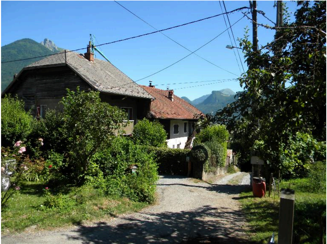
Vue d'un alignement de ferme en bas du hameau (2008 F4 2385, 2387).