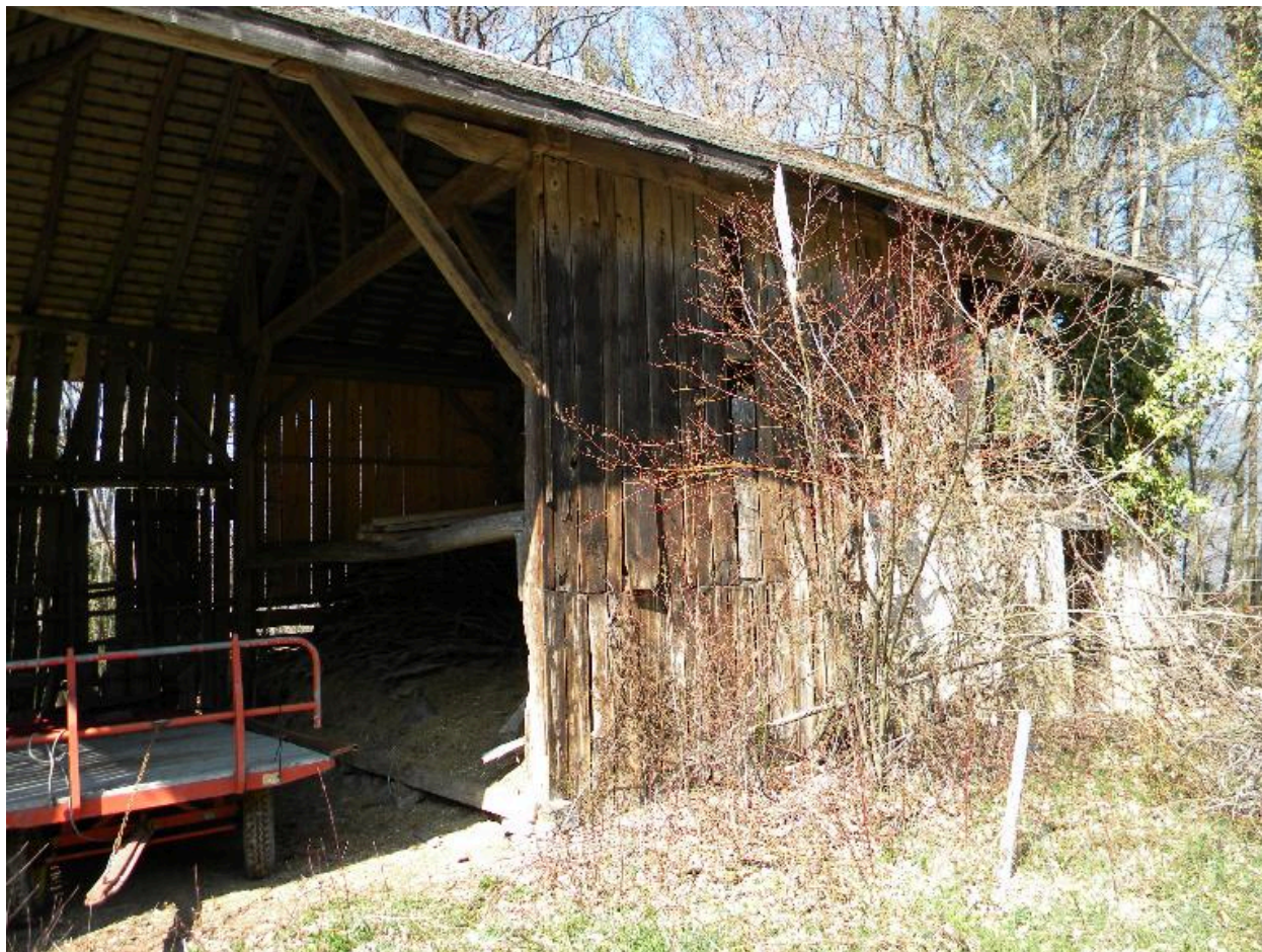
Vue de la façade principale d'une grange étable isolée (2008 F6 749).