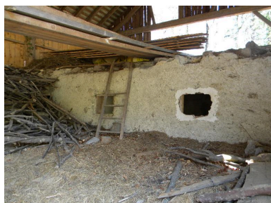
Vue des vestiges des trapes pour passer le foin dans l'étable dans une grange étable isolée (2008 F6 749).