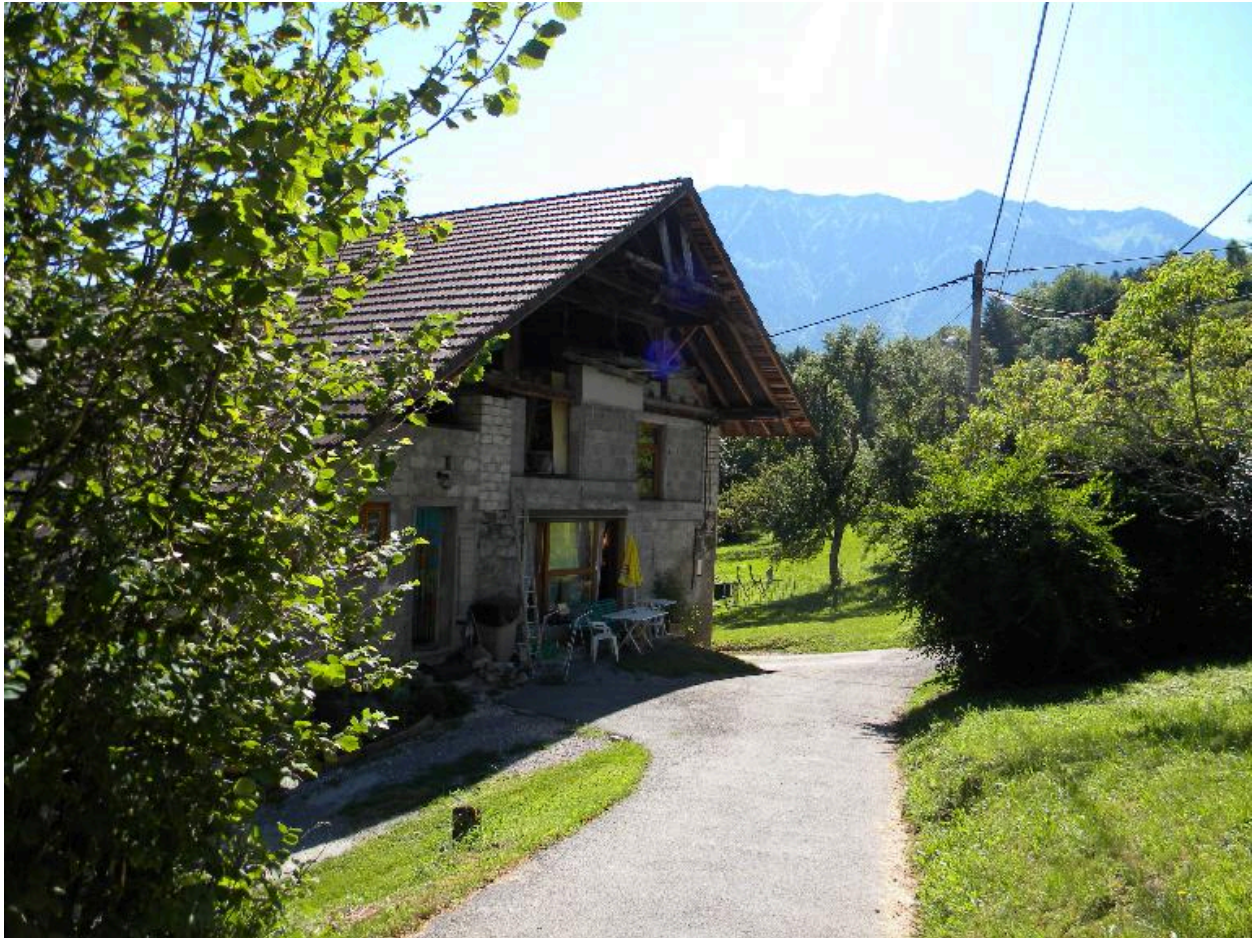
Vue de la façade arrière d'une maison modifiée (2008 F4 2324).