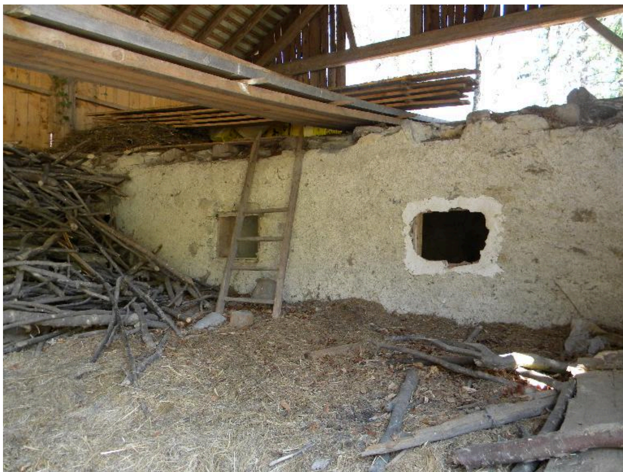
Vue des vestiges des trapes pour passer le foin dans l'étable dans une grange étable isolée (2008 F6 749).