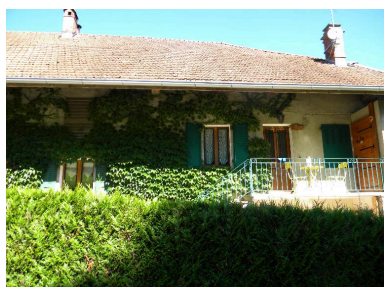
Vue de la façade d'une ancienne ferme (2008 F4 603).