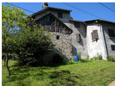
Vue d'un grenier accolé à une construction récente (2008 F4 604).