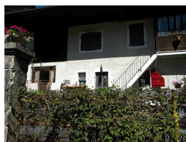
Vue de la façade d'une ferme mitoyenne en bas du hameau (2008 F4 2387). IVR82_20137401123NUCA