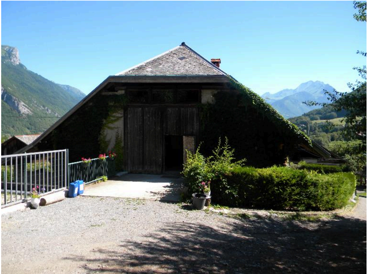
Vue du pignon sud-ouest avec accès au fenil d'une ancienne ferme (2008 F4 603)