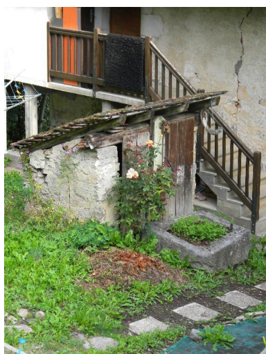
Vue du puits situé devant le bâtiment du four à pain.