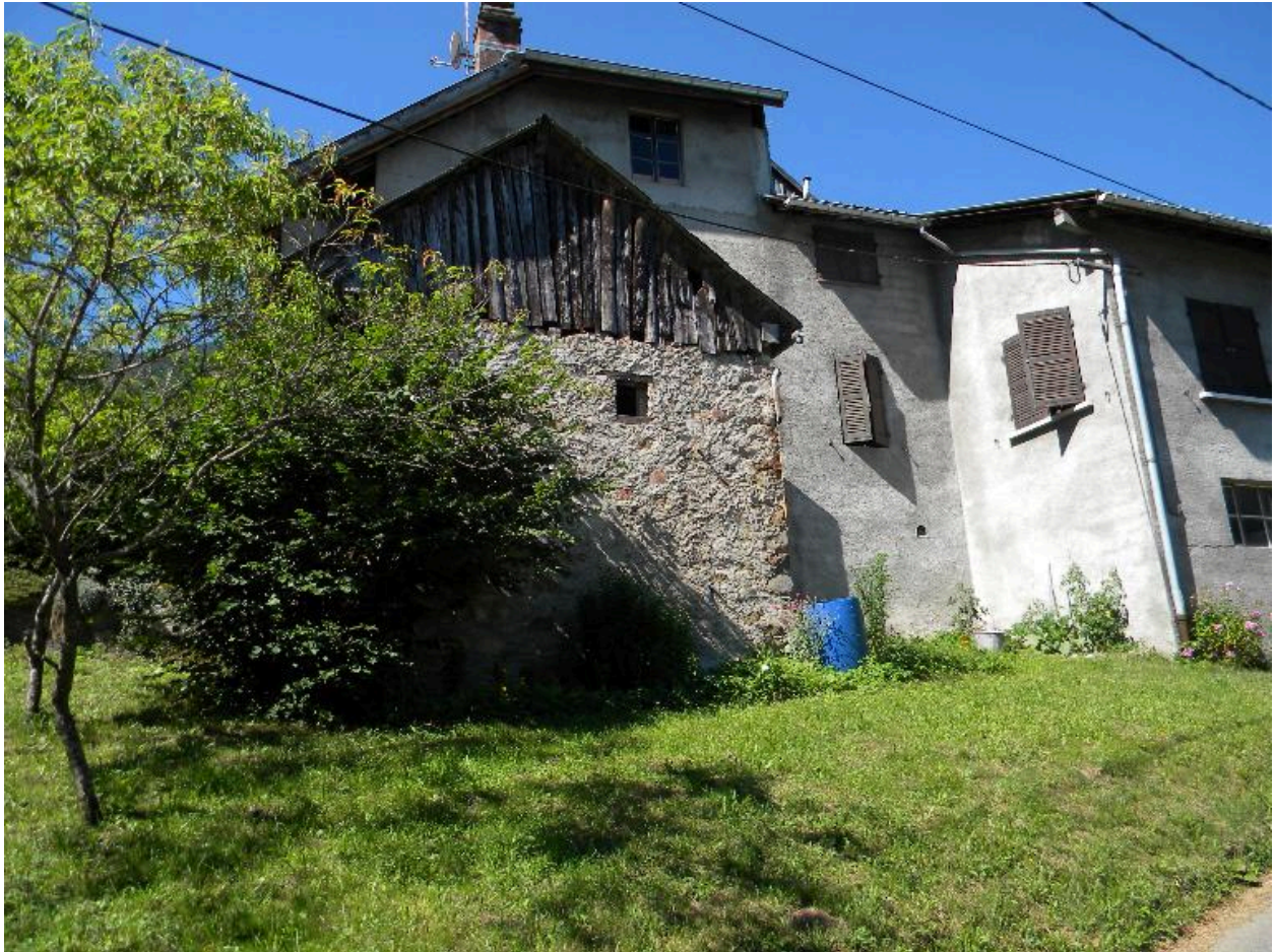
Vue d'un grenier accolé à une construction récente (2008 F4 604).