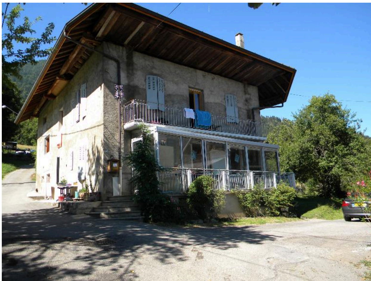
Vue de trois quarts d'une maison modifiée (2008 F4 2324).