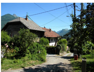
Vue d'un alignement de ferme en bas du hameau (2008 F4 2385, 2387). IVR82_20137401122NUCA