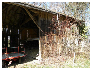
Vue de la façade principale d'une grange étable isolée (2008 F6 749). IVR82_20137401111NUCA