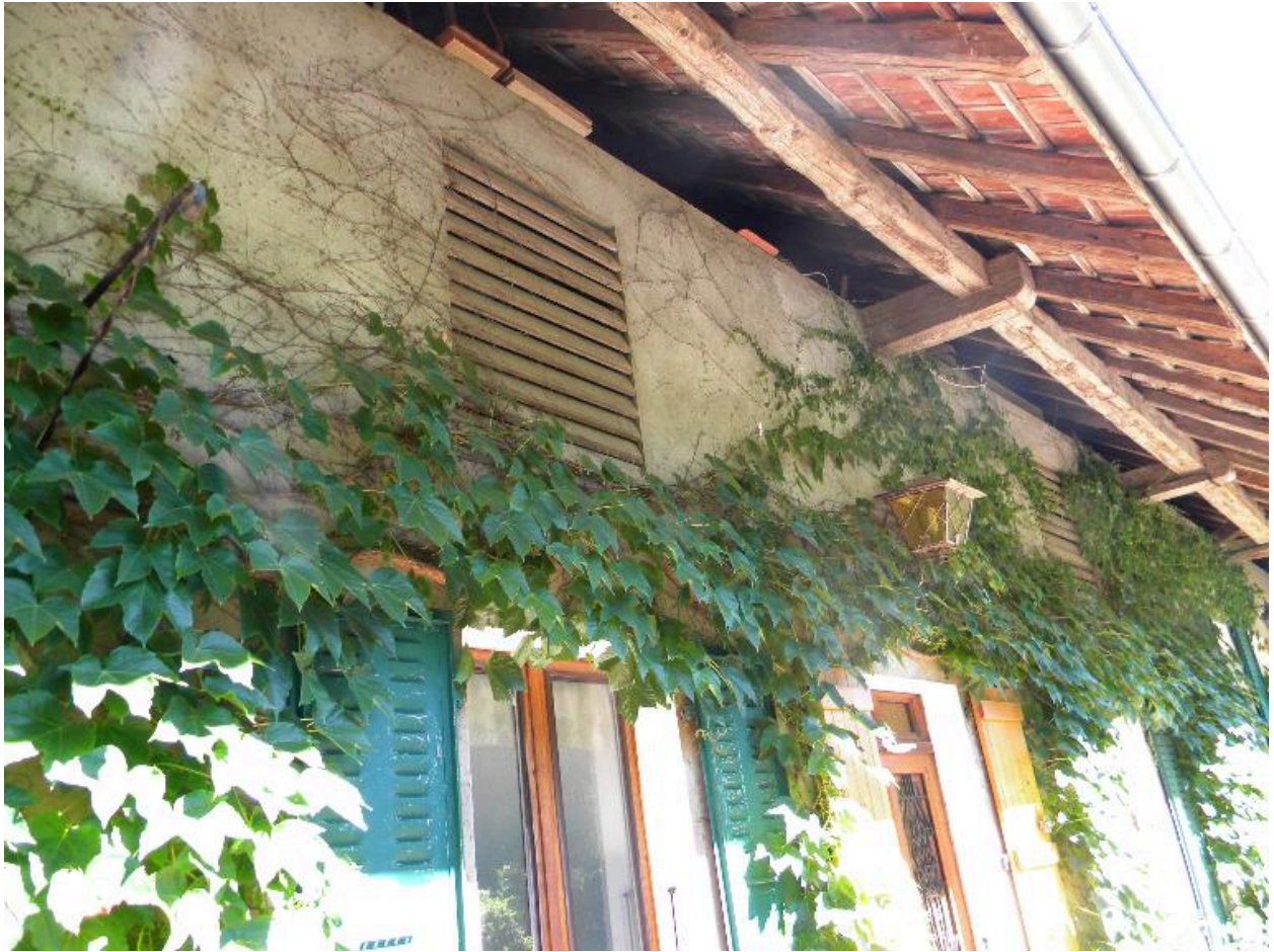
Vue des poutres solives sous le débord de toit (2008 F4 603).