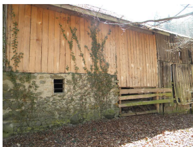
Vue de la façade arrière d'une grange-étable isolée (2008 F6 749). IVR82_20137401113NUCA