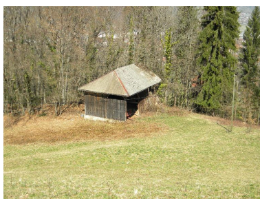
Vue générale d'une grange étable isolée (2008 F6 749).