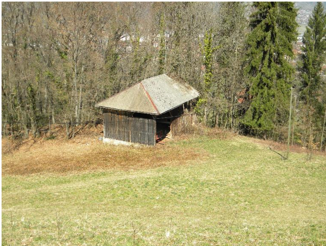
Vue générale d'une grange étable isolée (2008 F6 749).