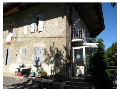
Vue de la façade est d'une maison transformée (2008 F4 2324). IVR82_20137401120NUCA