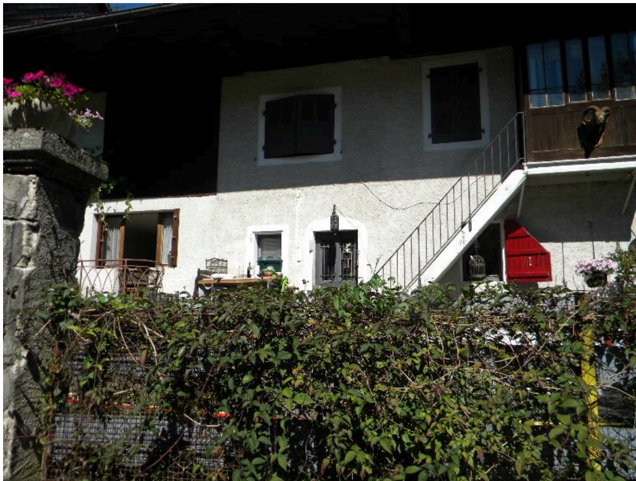
Vue de la façade d'une ferme mitoyenne en bas du hameau (2008 F4 2387).