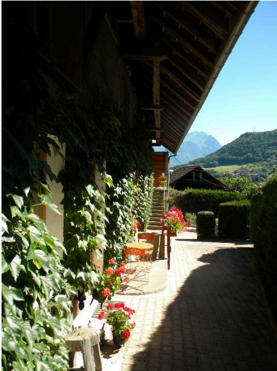
Détail de la façade d'une ancienne ferme (2008 F4 603).