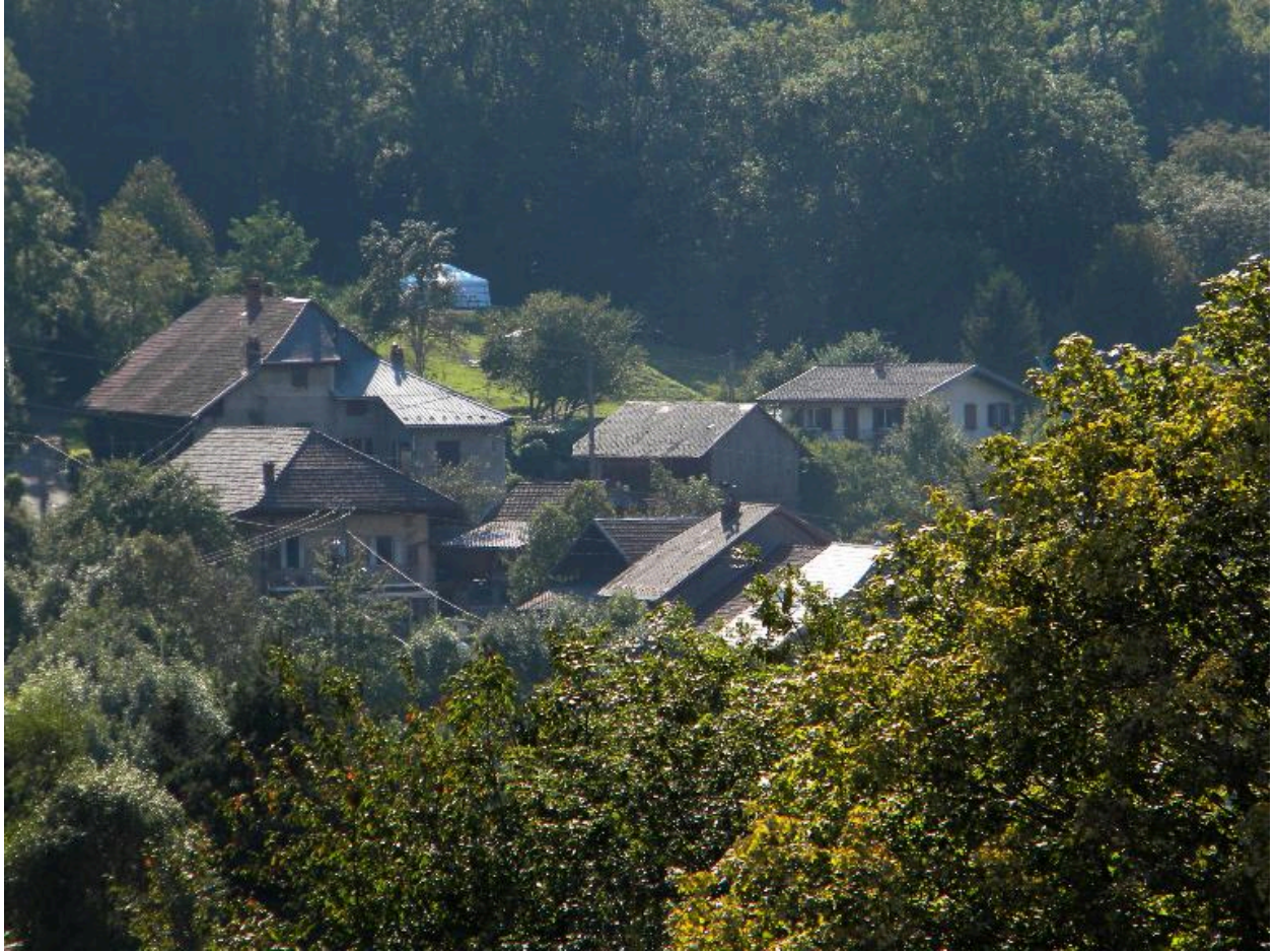
Vue d'ensemble du hameau de Lachat depuis Chambellon