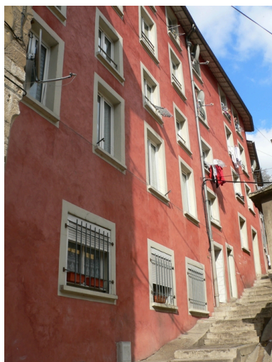
Façade sur rue IVR82_20093800426NUCA