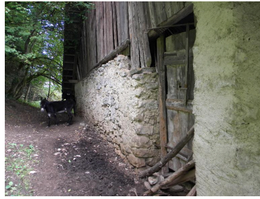
Vue de la façade arrière.