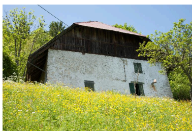
Vue de la façade principale depuis la route.