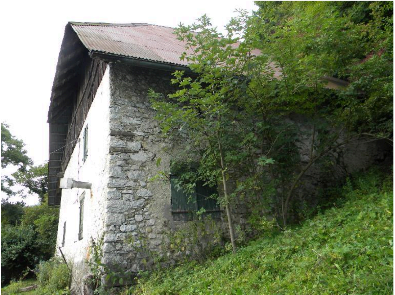
Vue de la façade nord.