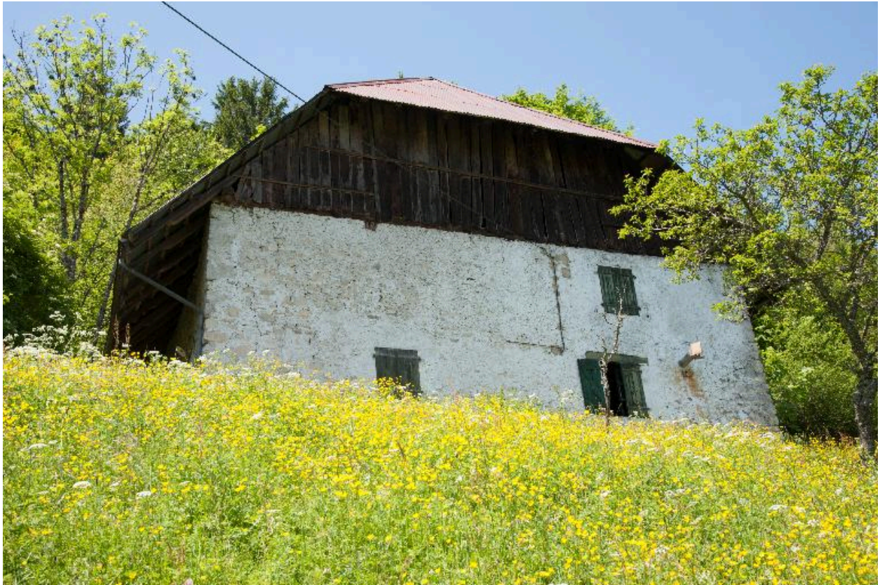
Vue de la façade principale depuis la route.