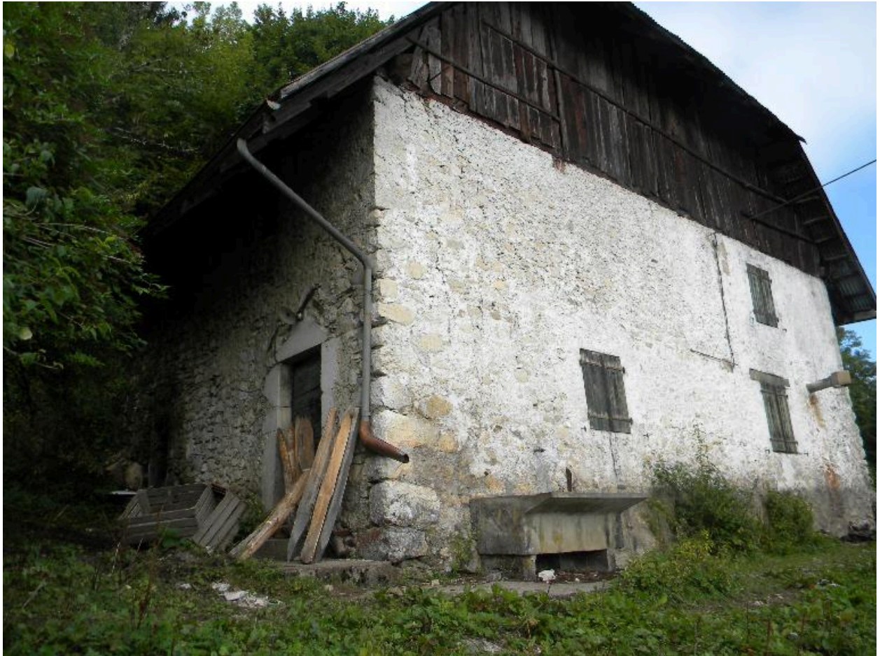
Vue de trois-quarts depuis le sud.