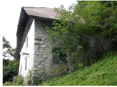
Vue de la façade nord. IVR82_20137401192NUCA