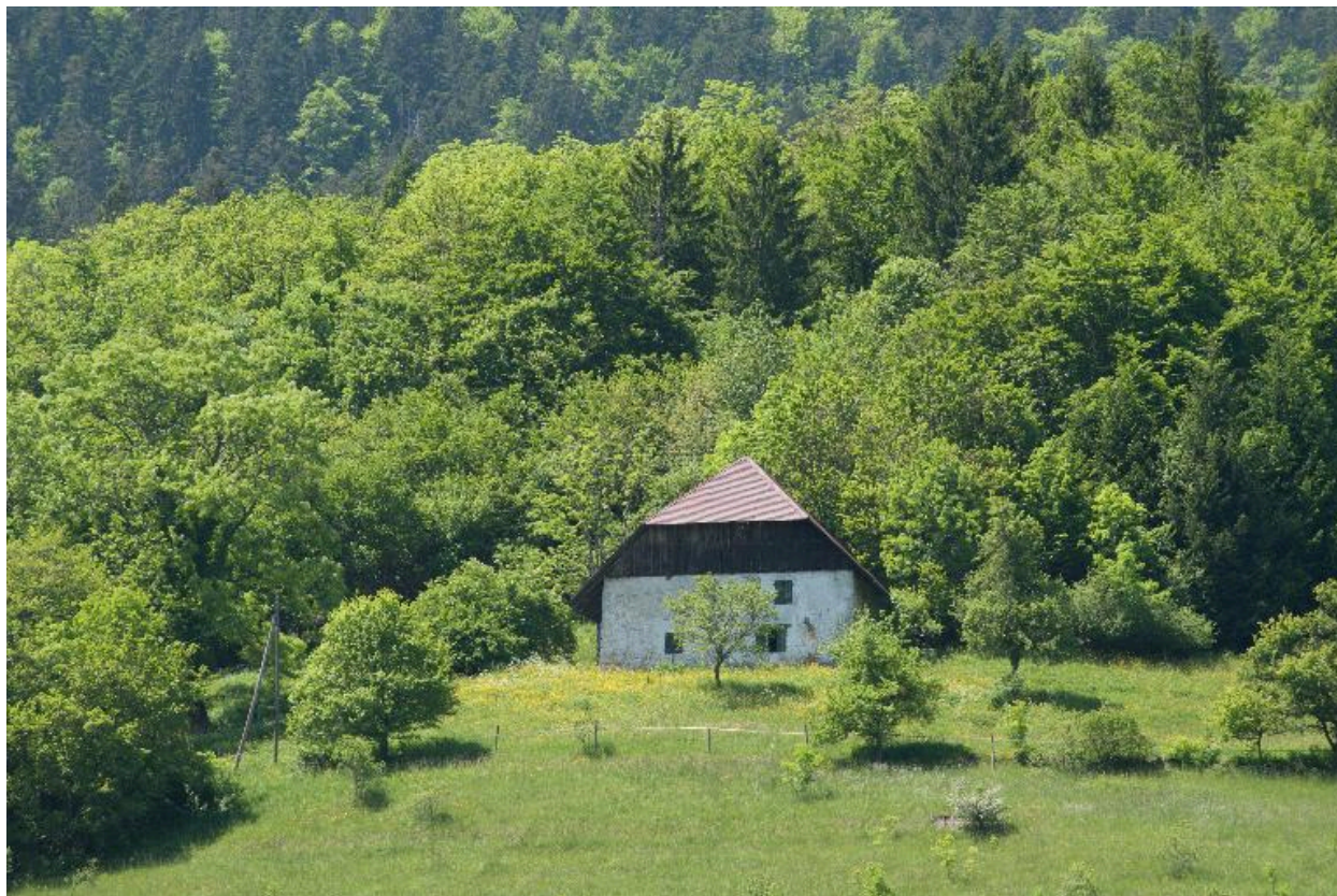
Vue d'ensemble de la ferme dans son environnement