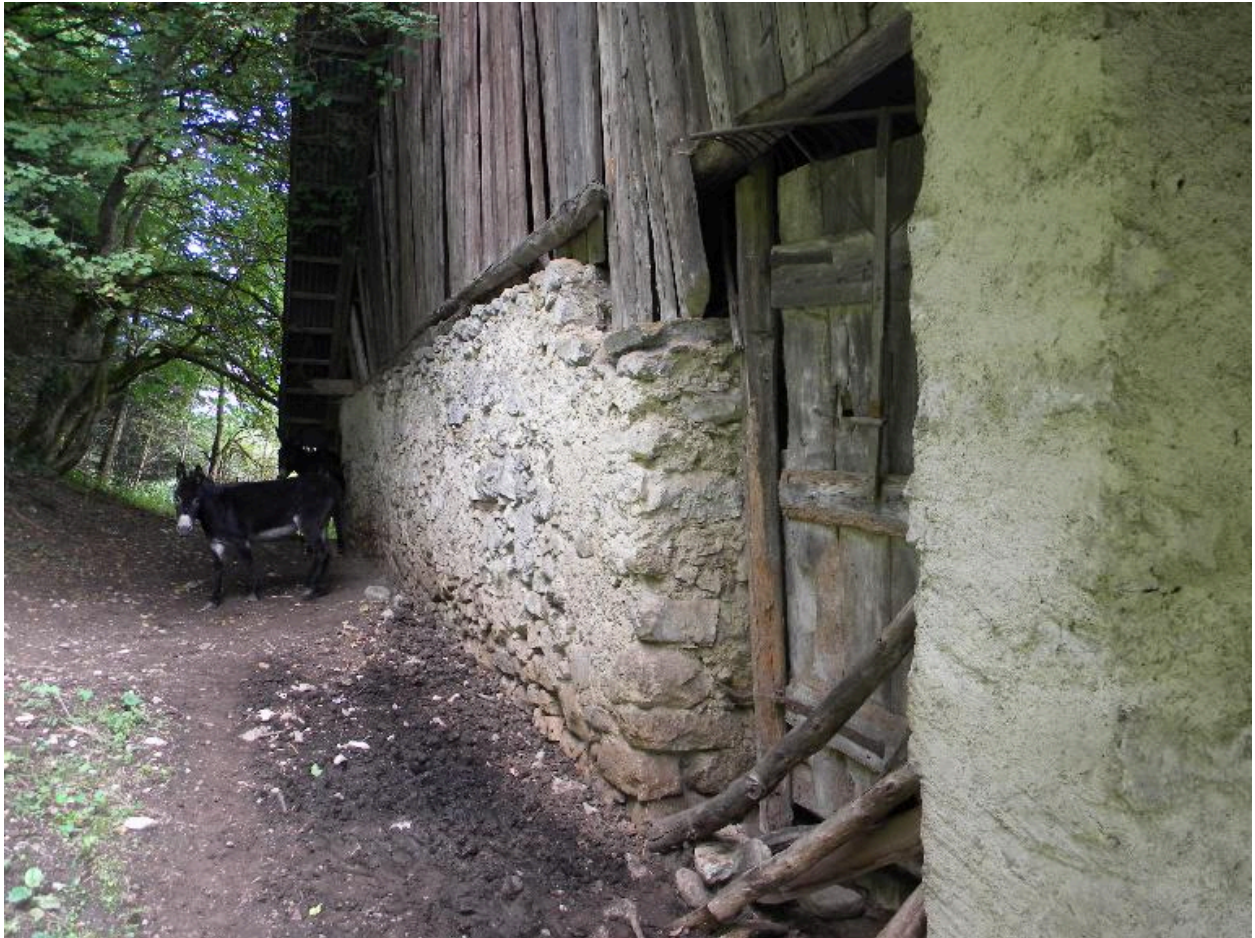
Vue de la façade arrière.