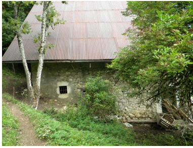
Vue de la façade sud. IVR82_20137401190NUCA