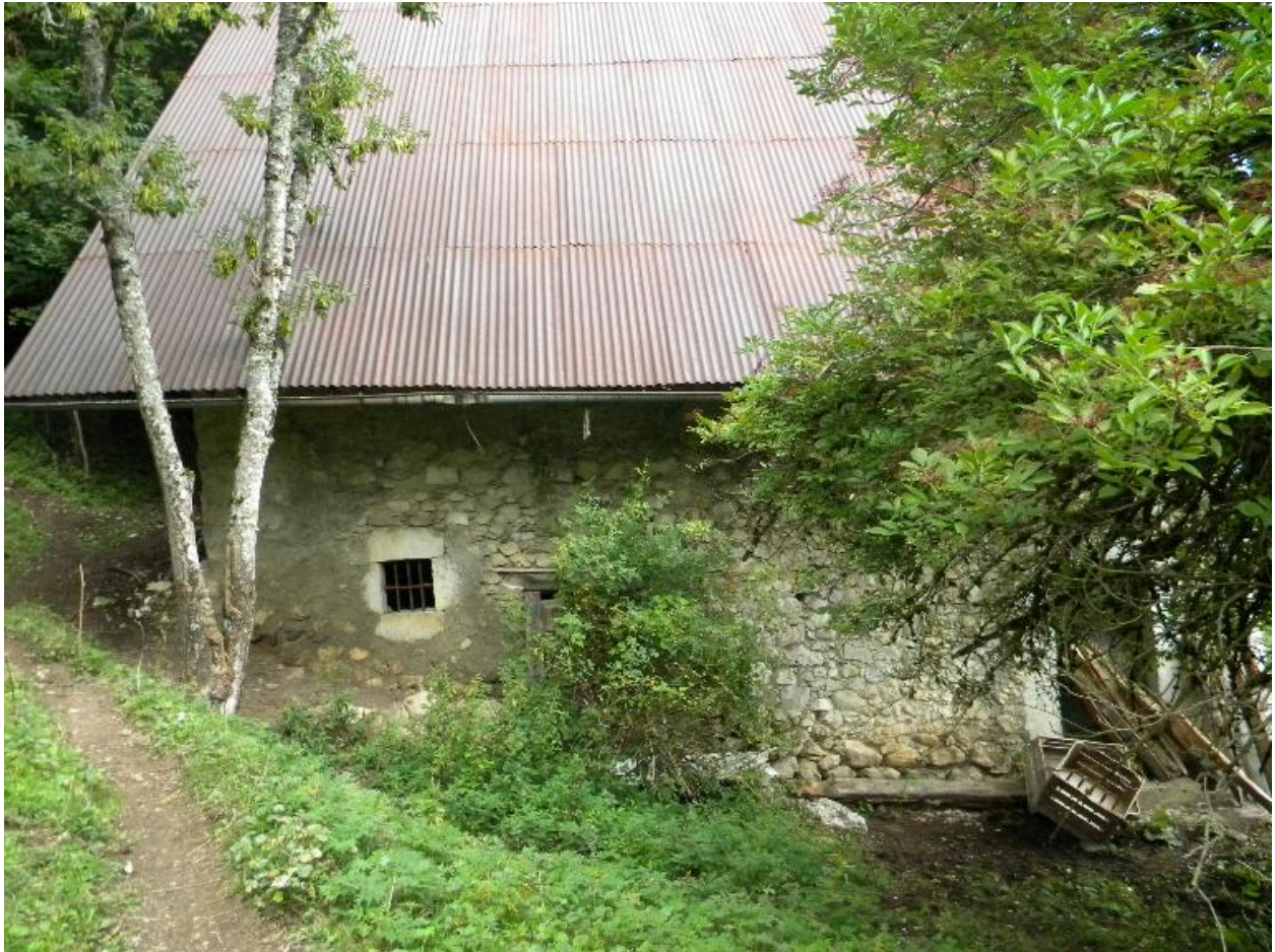
Vue de la façade sud.