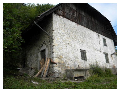
Vue de trois-quarts depuis le sud. IVR82_20137401189NUCA