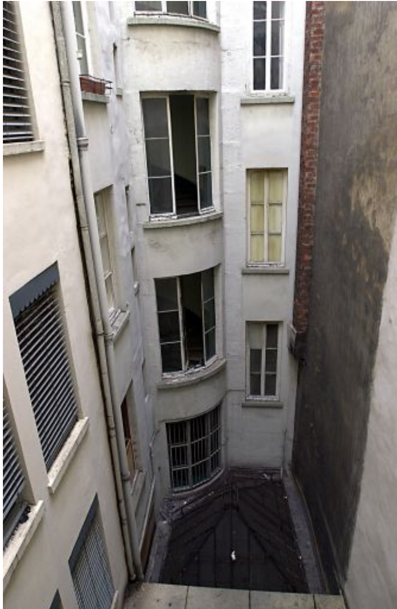
Façade sur cour et cage d'escalier