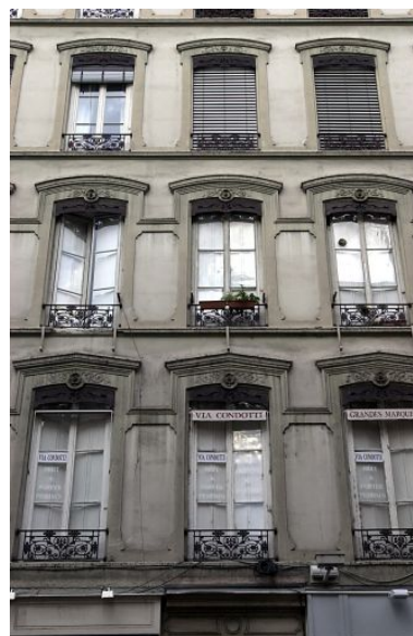
Façade sur rue, détail IVR82_20046900266NUCA