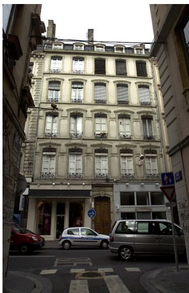
Façade sur rue, vue générale IVR82_20046900265NUCA