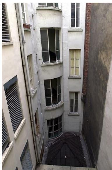
Façade sur cour et cage d'escalier IVR82_20046900267NUCA