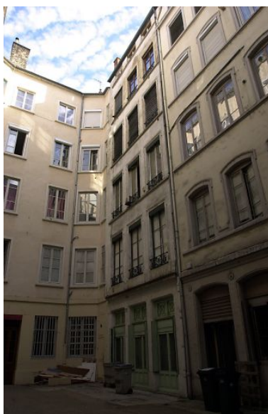
Elévation arrière sur la cour commune de l'immeuble 8, rue du Plâtre IVR82_20046900268NUCA