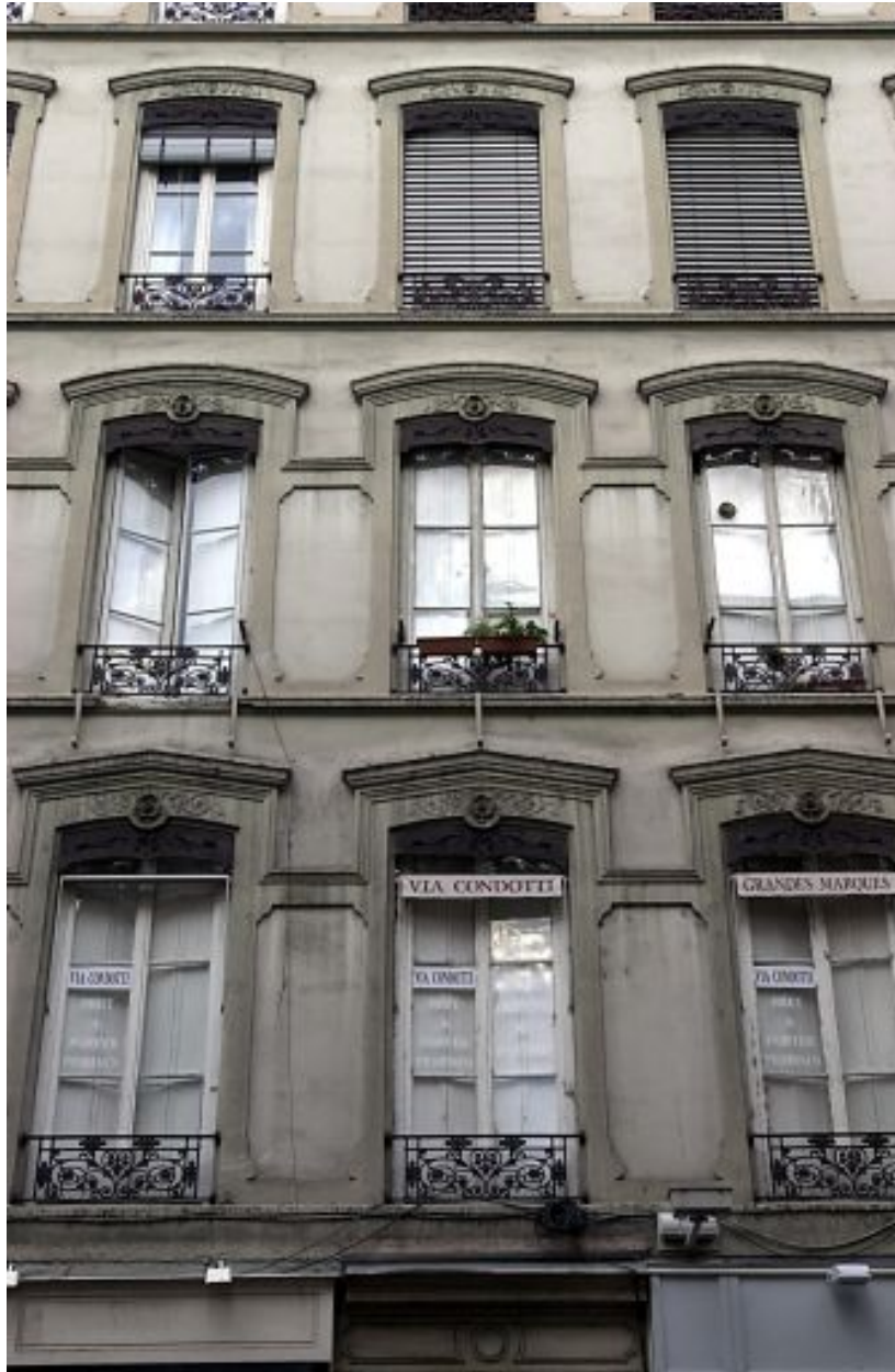
Façade sur rue, détail