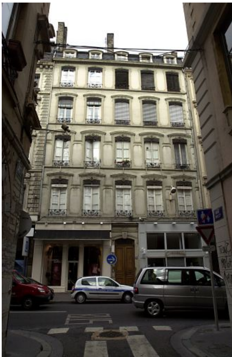
Façade sur rue, vue générale