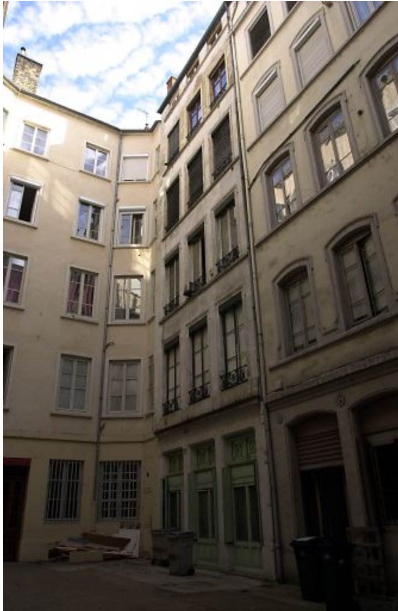
Elévation arrière sur la cour commune de l'immeuble 8, rue du Plâtre