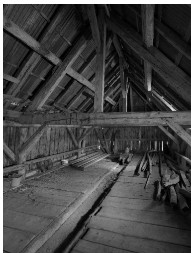
Vue de la charpente de l'étable.