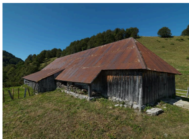
Vue d'ensemble de l'étable.