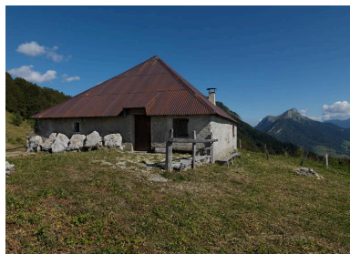
Vue du bâtiment d'habitation. IVR84_20167305808NUCAQ