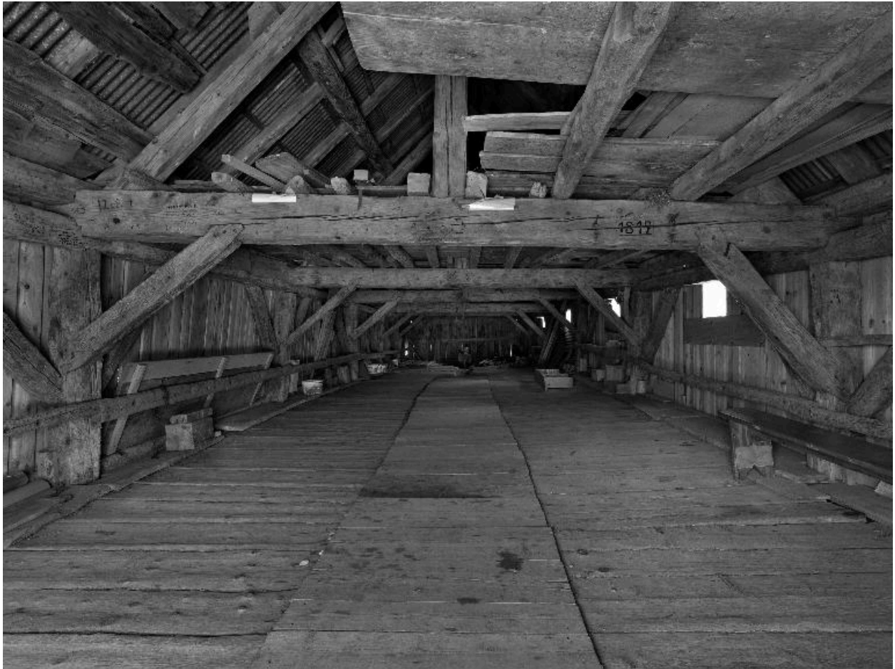
Vue intérieure de l'étable.