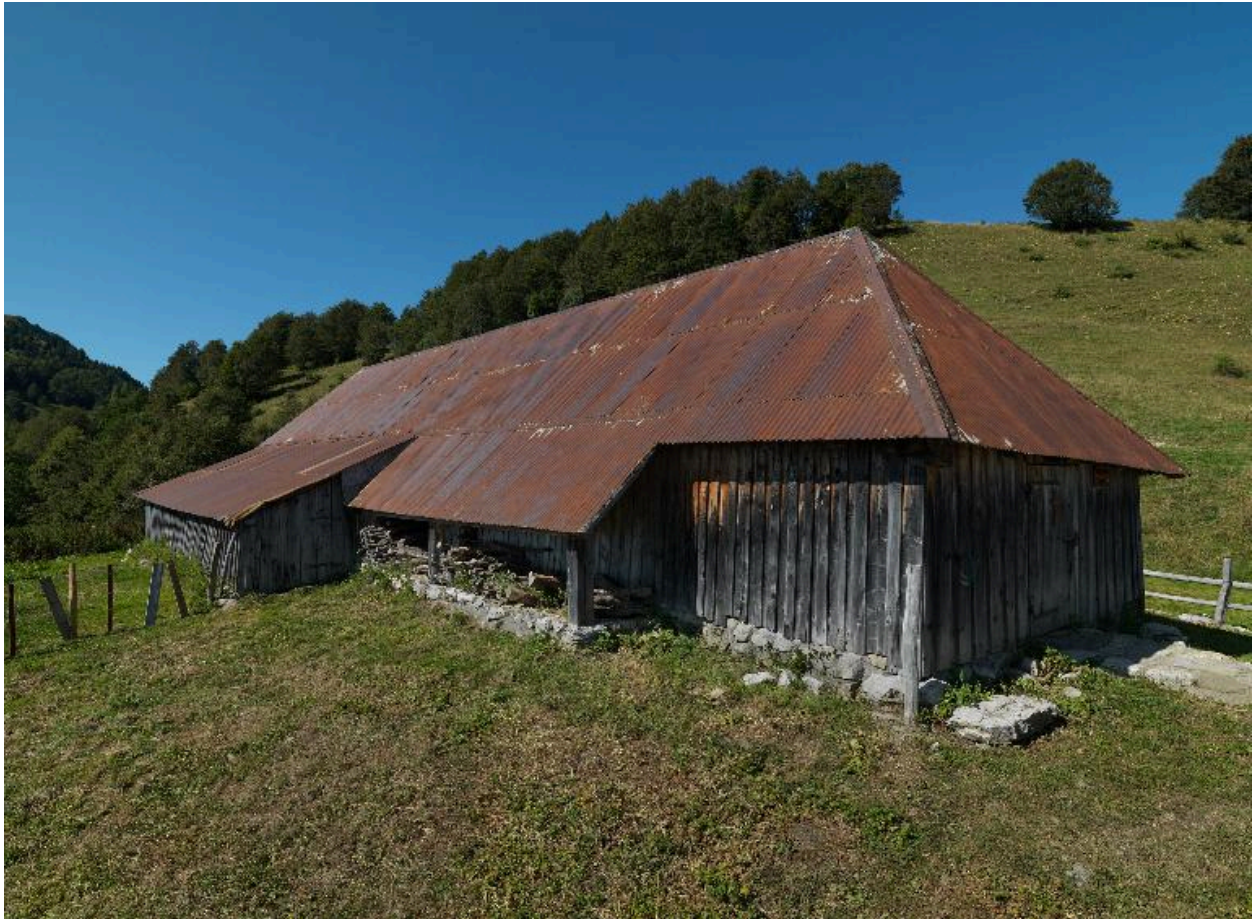
Vue d'ensemble de l'étable.