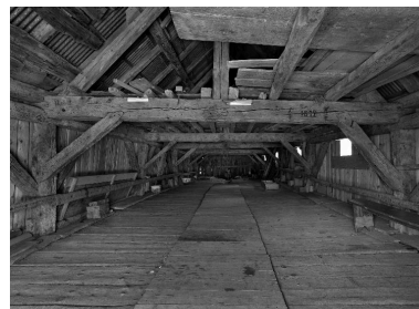
Vue intérieure de l'étable.