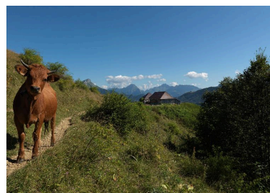
Vue des chalets avec une vache tarine en premier plan.