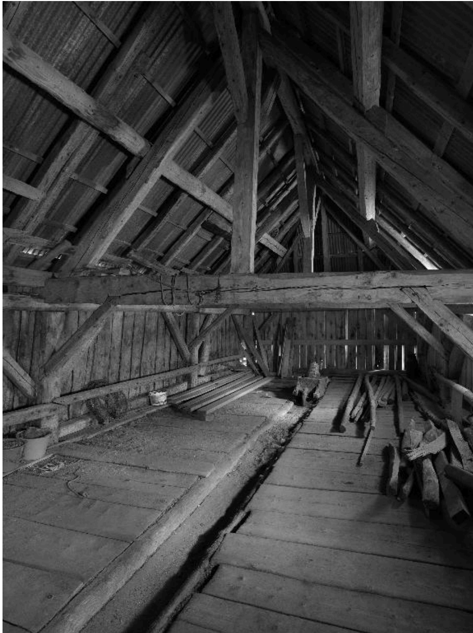
Vue de la charpente de l'étable.