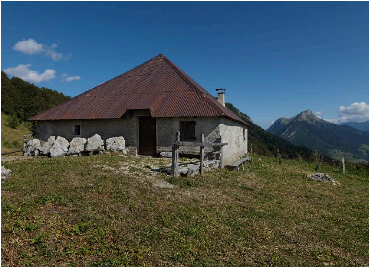
Vue du bâtiment d'habitation.