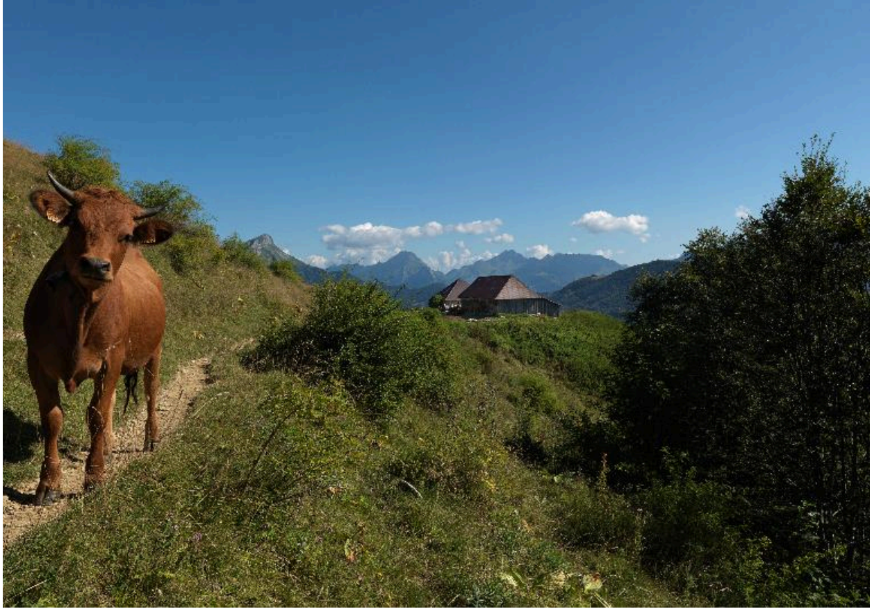
Vue des chalets avec une vache tarine en premier plan.