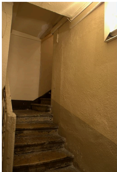
La première volée de l'escalier en pierre