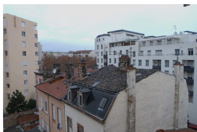
Vue des toits des immeubles 186 et 188-190 grande rue de la Guillotière IVR82_20126902433NUCA