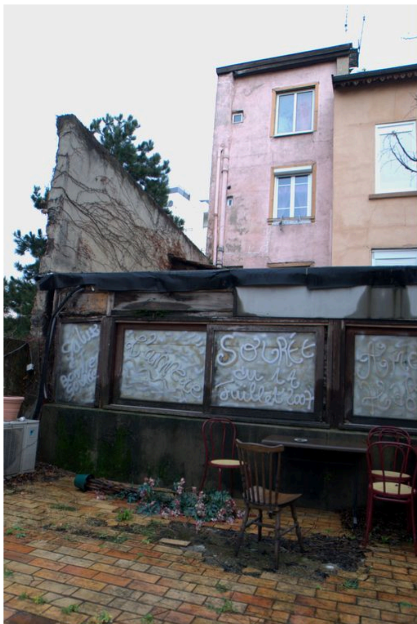
Elévation postérieure depuis le sud-est