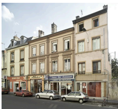
Vue d'ensemble depuis le nord-ouest IVR82_20076902437NUCA