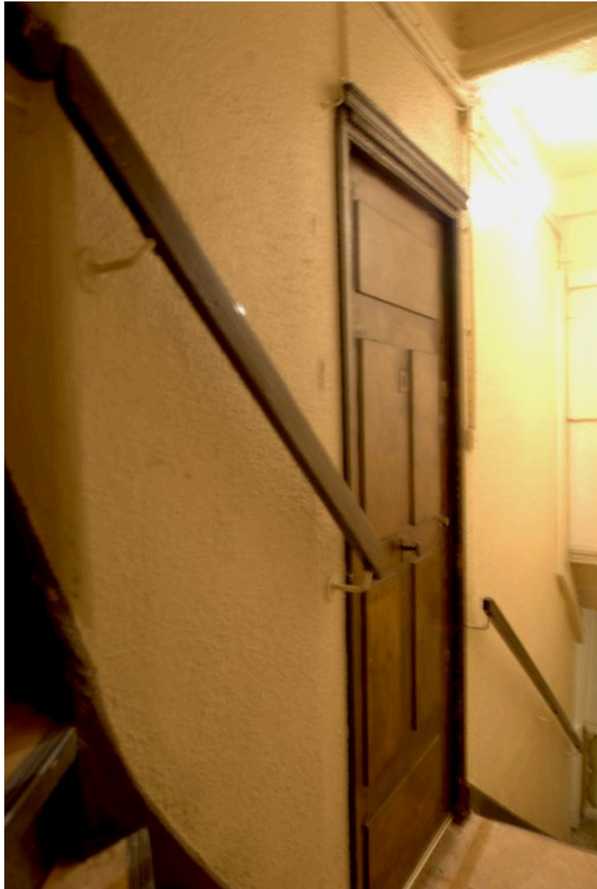
Porte palière à chambranle souligné d'une rangée de denticules