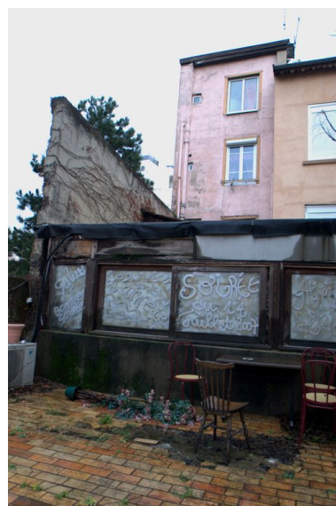
Elévation postérieure depuis le sud-est IVR82_20086900829NUCA