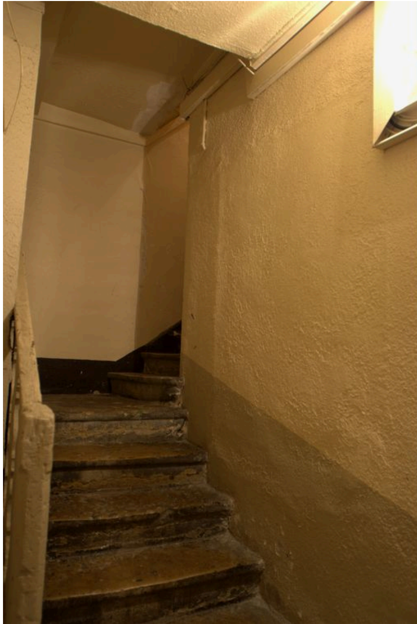
La première volée de l'escalier en pierre