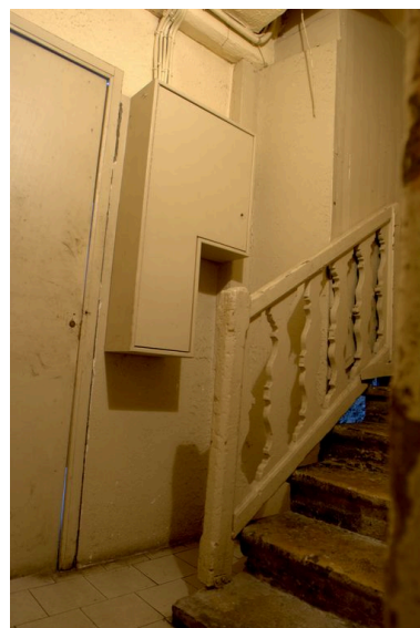
Le départ de l'escalier et la rampe à balustres plats