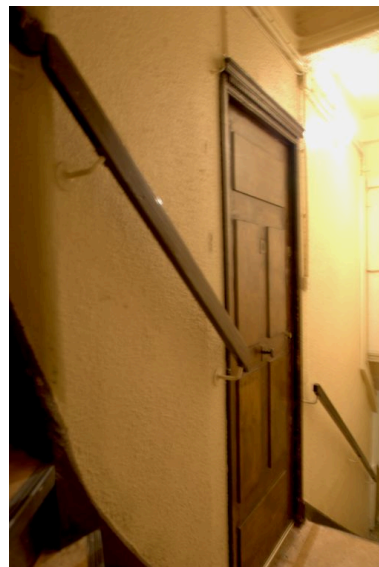
Porte palière à chambranle souligné d'une rangée de denticules IVR82_20086900827NUCA