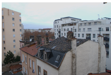
Vue des toits des immeubles 186 et 188-190 grande rue de la Guillotière