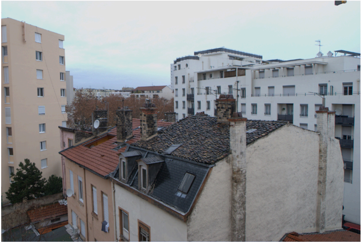
Vue des toits des immeubles 186 et 188-190 grande rue de la Guillotière