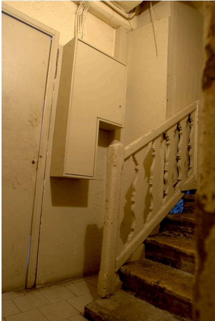
Le départ de l'escalier et la rampe à balustres plats