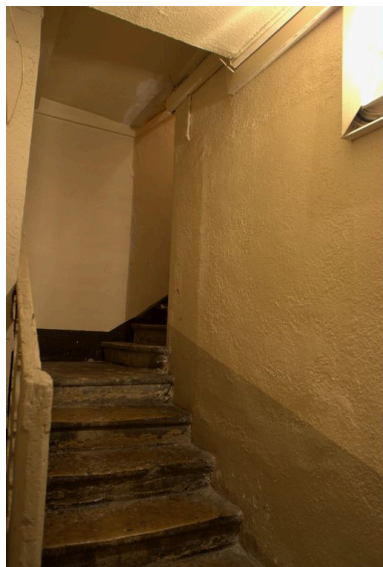
La première volée de l'escalier en pierre IVR82_20086900825NUCA

IVR82_20086900824NUCA