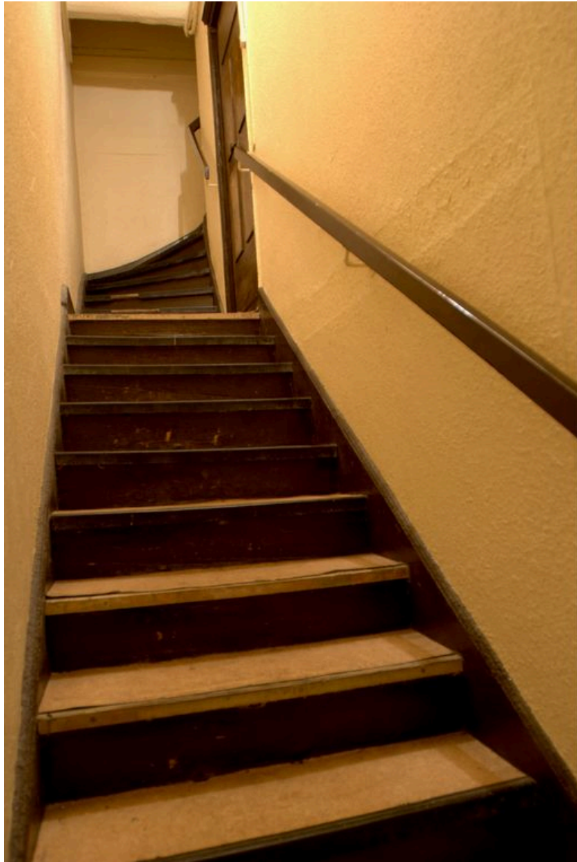
L'escalier en bois vers le 2e étage