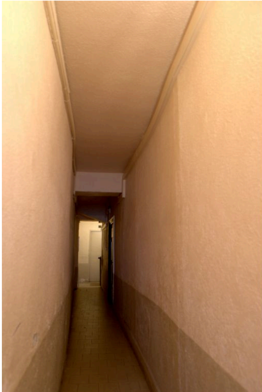
Le couloir depuis la porte d'entrée