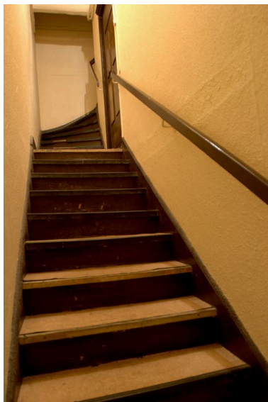
L'escalier en bois vers le 2e étage IVR82_20086900826NUCA