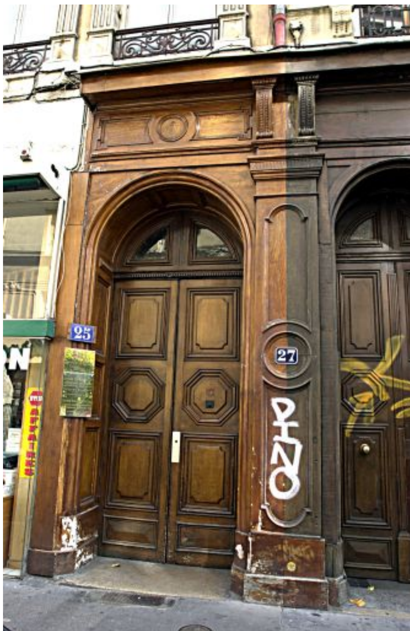
Façade principale, détail de la porte