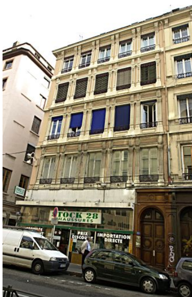
Façade principale, vue générale IVR82_20046900174NUCA