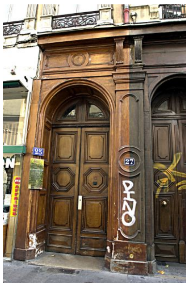
Façade principale, détail de la porte IVR82_20046900176NUCA