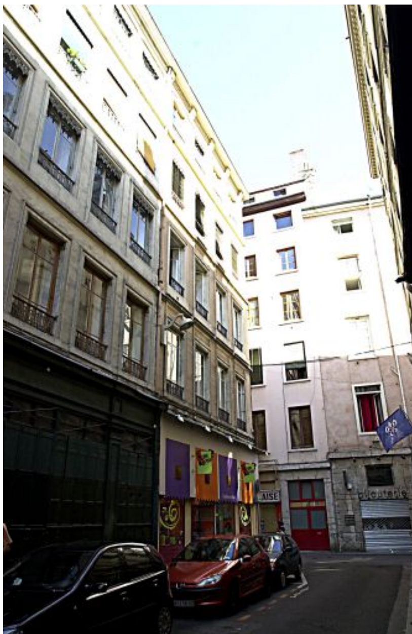
Façade sur la rue Pléney