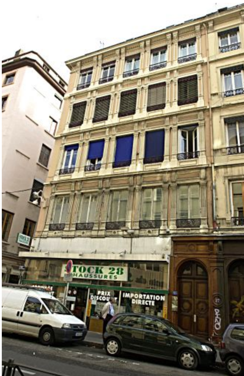
Façade principale, vue générale