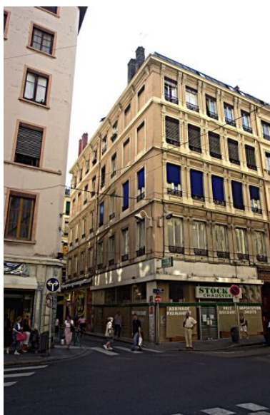
Façades sur la rue du Plâtre et la rue Paul-Chenavard IVR82_20046900177NUCA