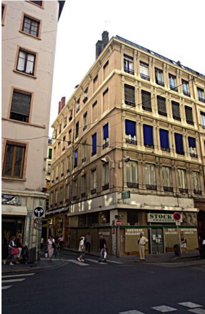
Façades sur la rue du Plâtre et la rue Paul-Chenavard