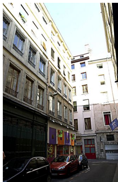
Façade sur la rue Pléney IVR82_20046900178NUCA