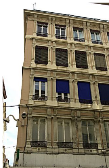
Façade principale, détail de l'élévation IVR82_20046900175NUCA