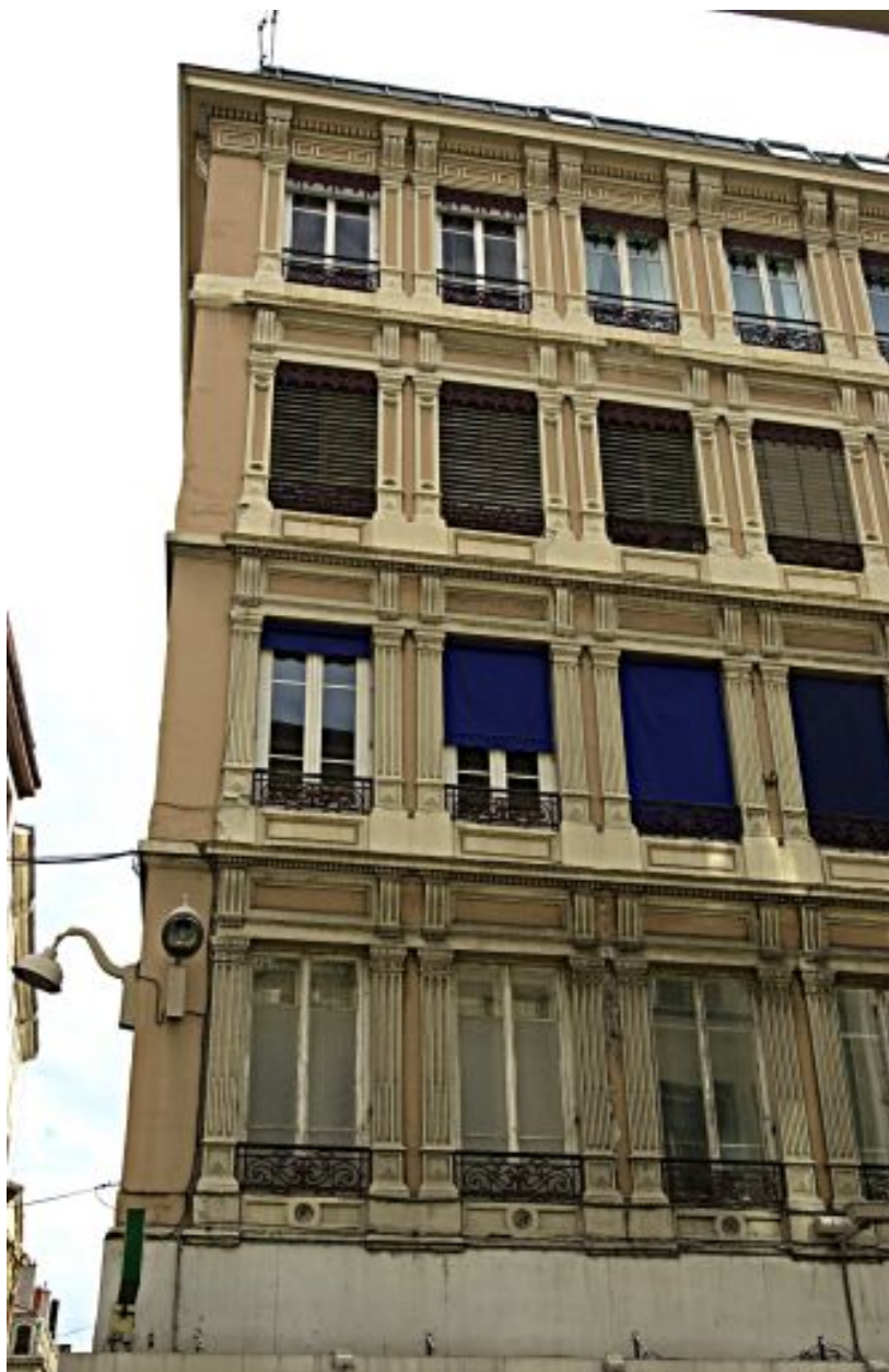
Façade principale, détail de l'élévation