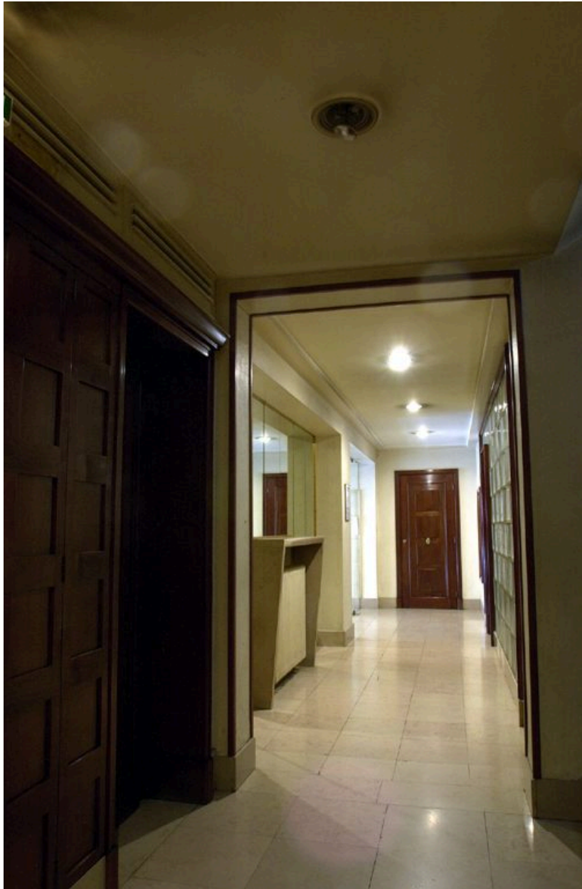
L'allée depuis l'ascenseur vers le hall