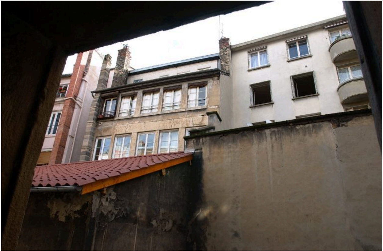
A droite, vue partielle de l'élévation postérieure depuis le 3e étage de l'immeuble accessible par le 5 rue Ferrandière (AE 53 sud)