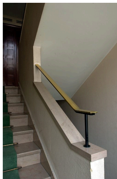
L'escalier