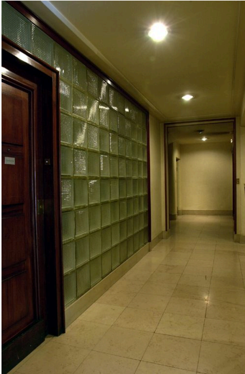
L'allée depuis le hall d'entrée vers l'ascenseur et l'escalier