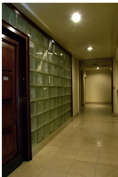
L'allée depuis le hall d'entrée vers l'ascenseur et l'escalier