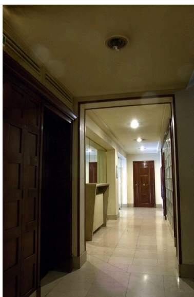
L'allée depuis l'ascenseur vers le hall IVR82_20046905324NUCA