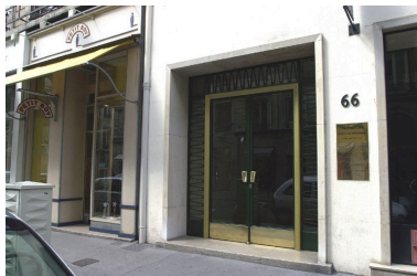
La porte IVR82_20046905321NUCA