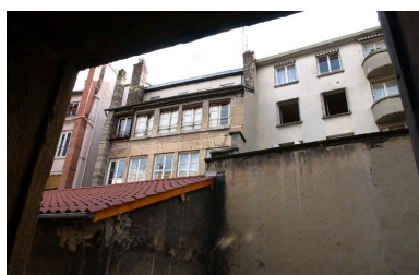
A droite, vue partielle de l'élévation postérieure depuis le 3e étage de l'immeuble accessible par le 5 rue Ferrandière (AE 53 sud) IVR82_20046905354NUCA