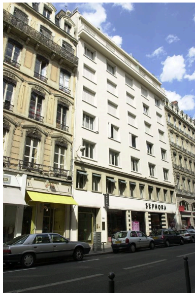
Vue générale IVR82_20046905320NUCA