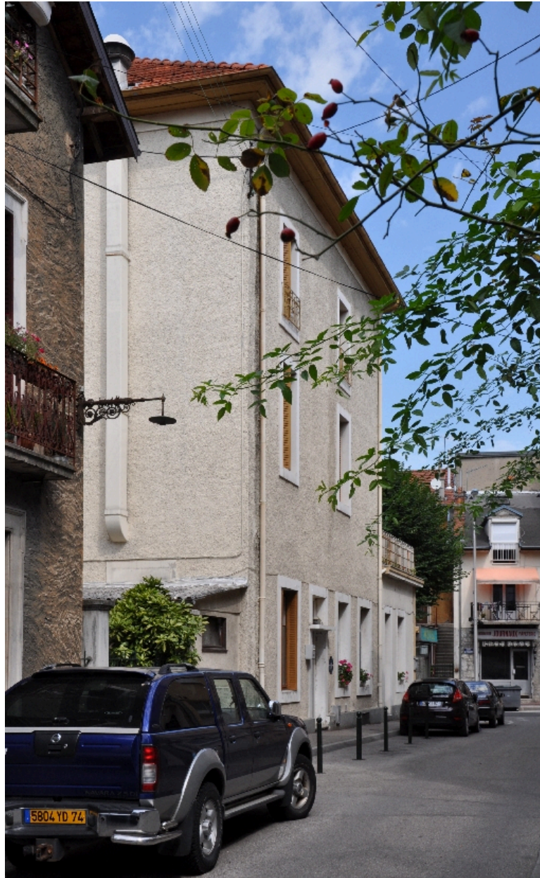
Façade postérieure et latérale