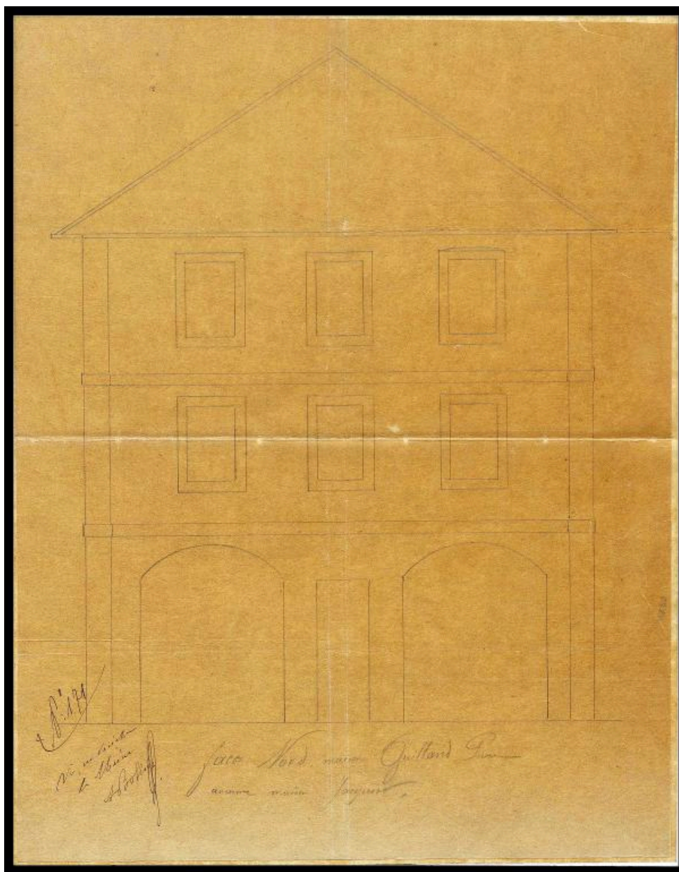
Façade nord, 1880