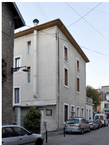
Façades postérieure et latérale gauche IVR82_20097301081NUCA