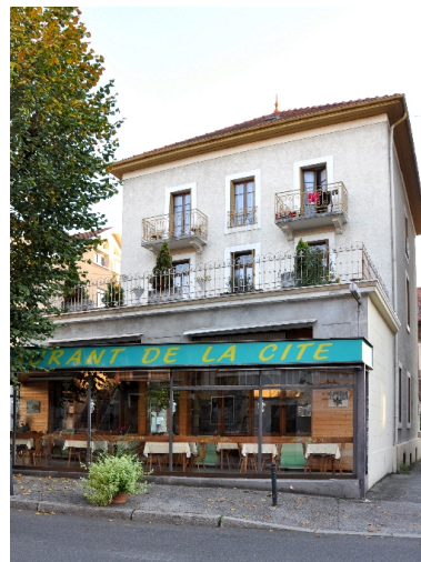
Façade IVR82_20097301079NUCA