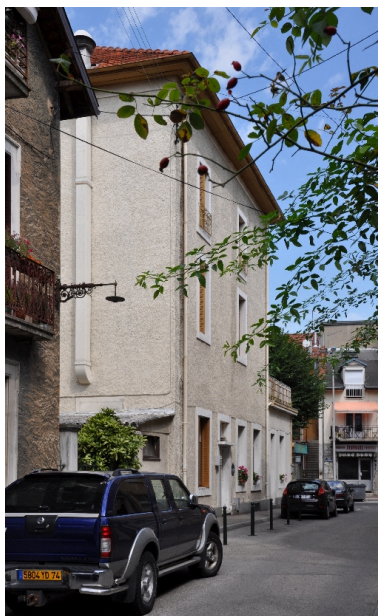
Façade postérieure et latérale