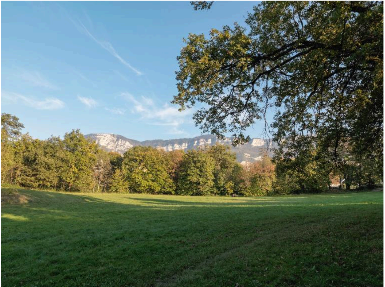
Le bois Vidal, vue vers l'est