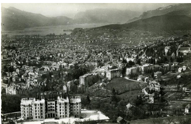
Vue générale aérienne, vers 1940 IVR82_20147300905NUCB