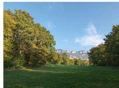
Le bois Vidal, vue depuis l'ouest IVR82_20147304800NUCAQ