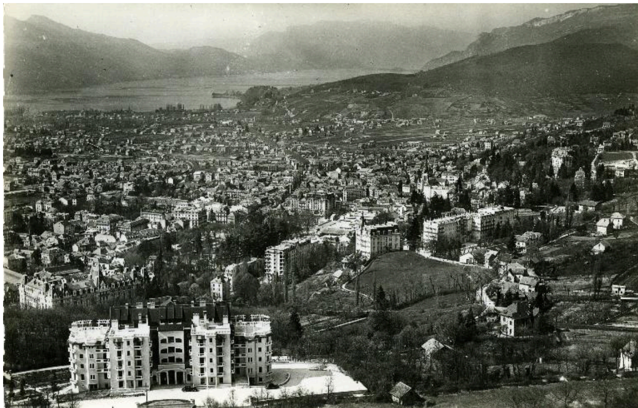
Vue générale aérienne, vers 1940