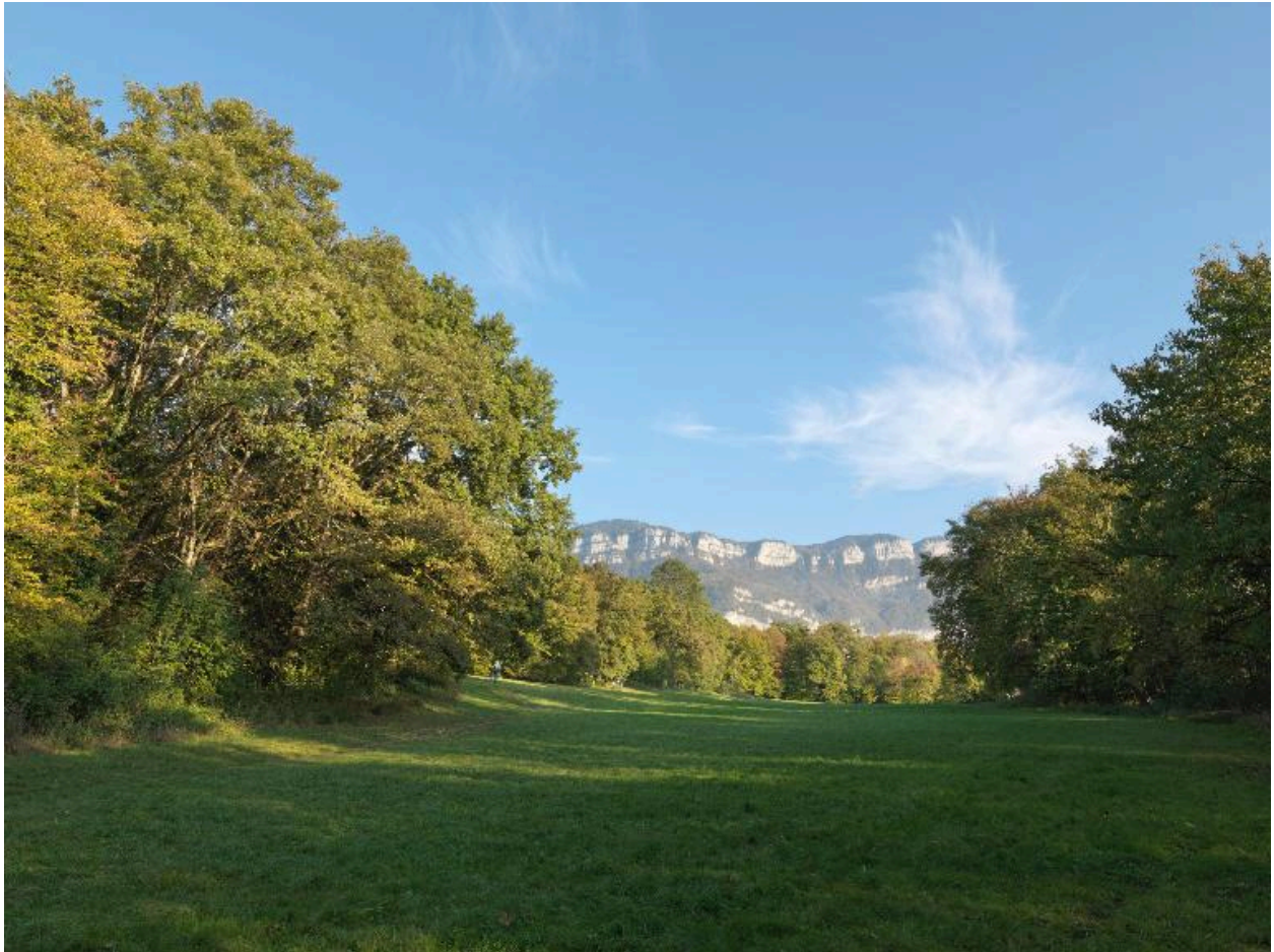
Le bois Vidal, vue depuis l'ouest