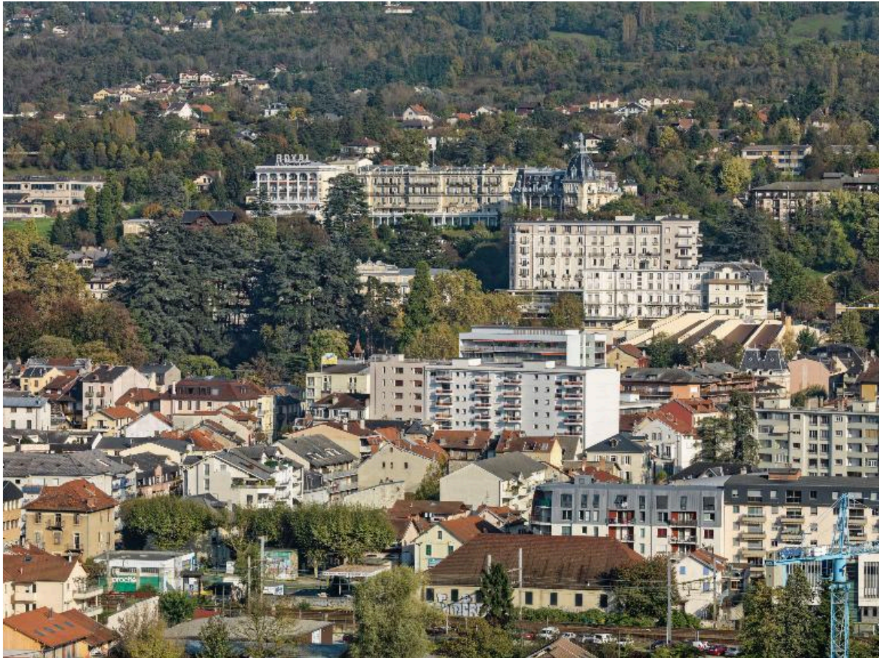
Les palaces Rossignoli, l'hôtel d'Albion et la villa Beau-Site (2e plan)