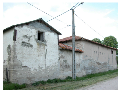
Vue de la ferme, depuis le sud-est.