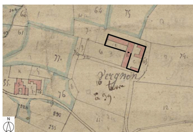
Plan de situation, d'après le cadastre de [1809], section A, échelle originale 1:5000. Plan cadastral, dit cadastre napoléonien. Dessin au crayon, plume et lavis d'encre colorées sur papier, 1809. IVR82_20134202966NUD