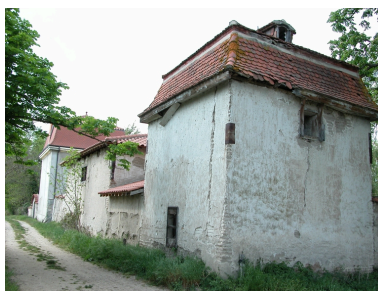
Vue d'ensemble du bâtiment sud des communs, depuis le sud.