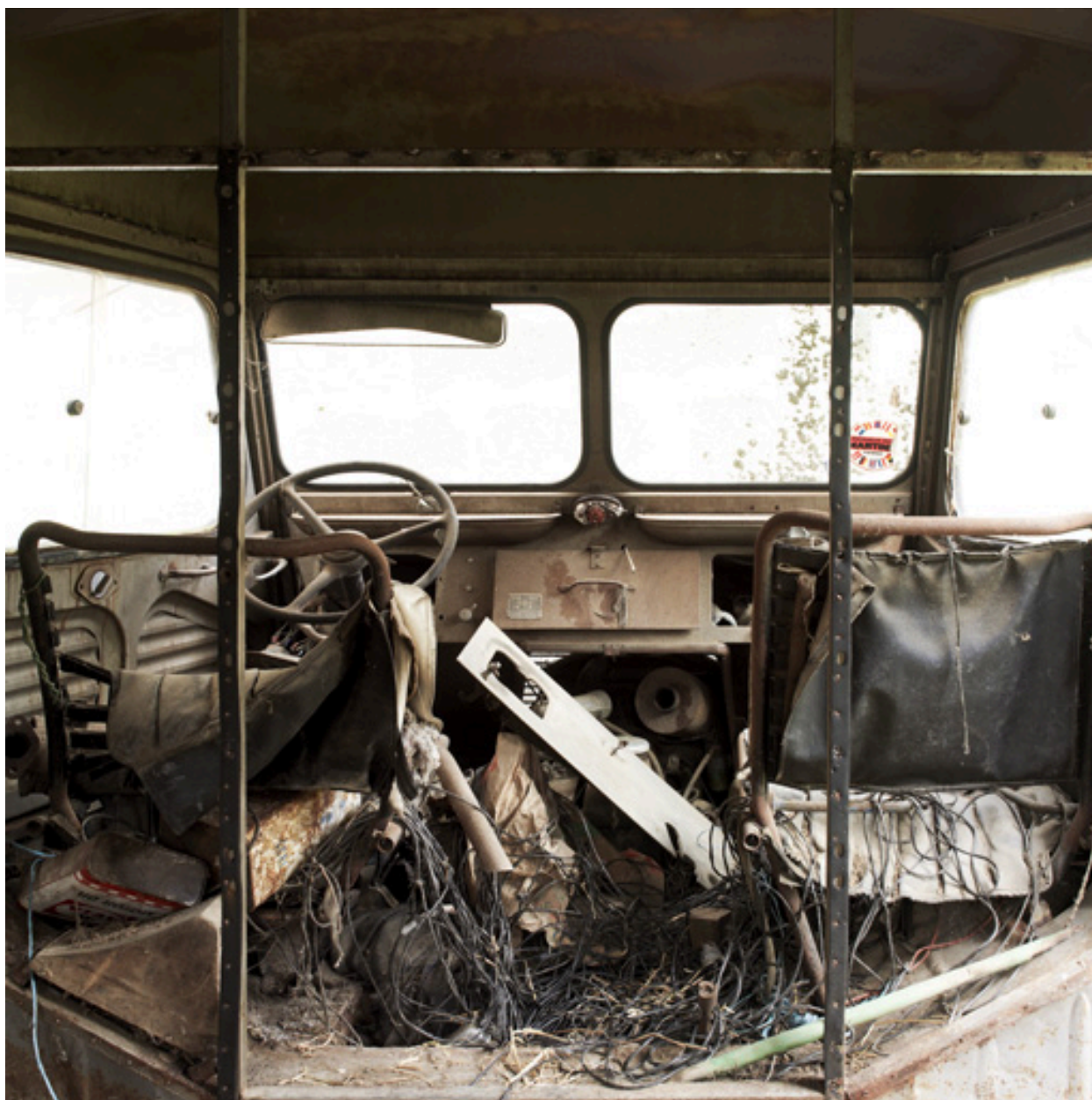
Vue intérieure de la camionnette dans la cour de la ferme.