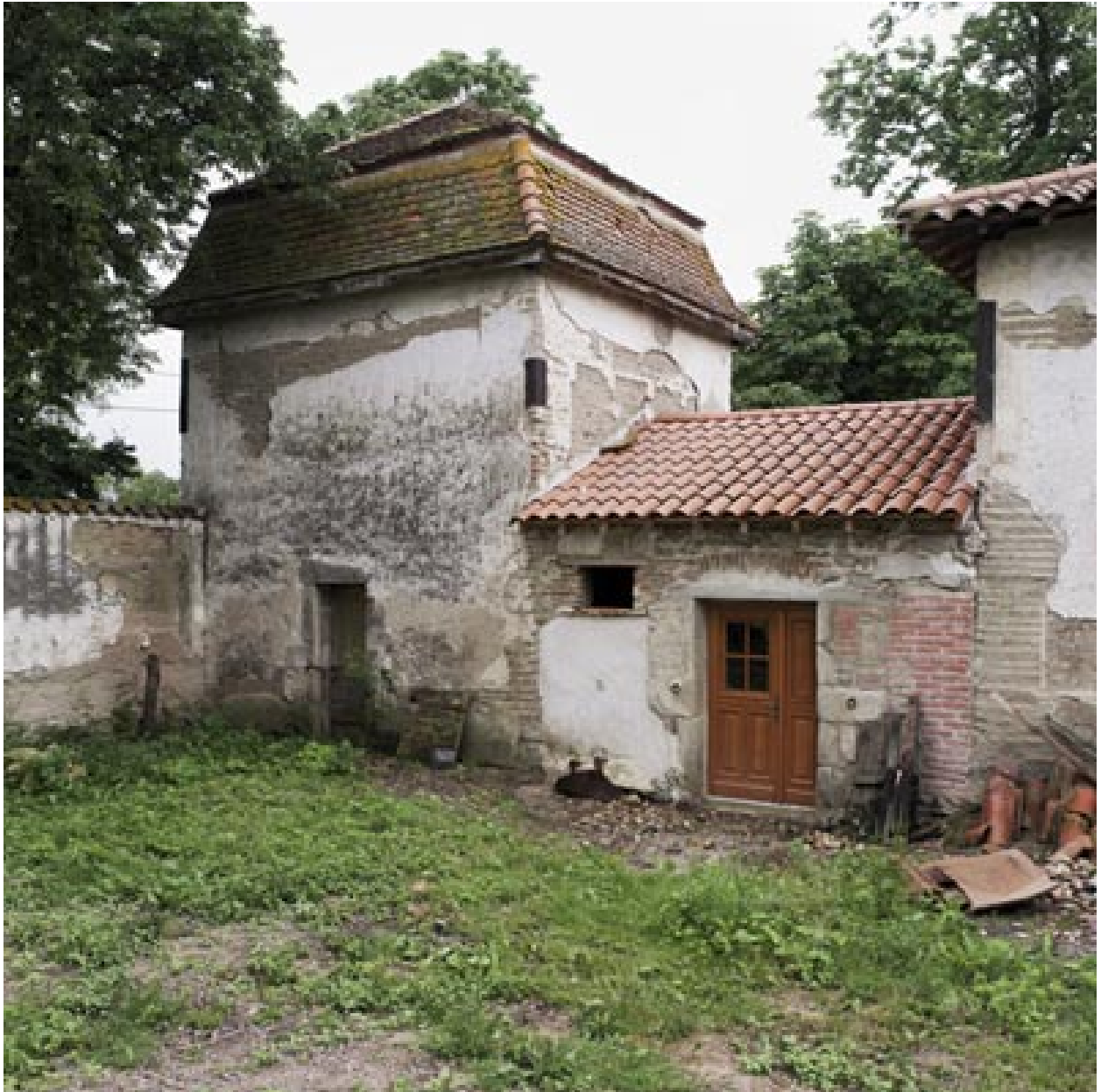
Vue d'ensemble du bâtiment sud des communs, depuis l'avant-cour.