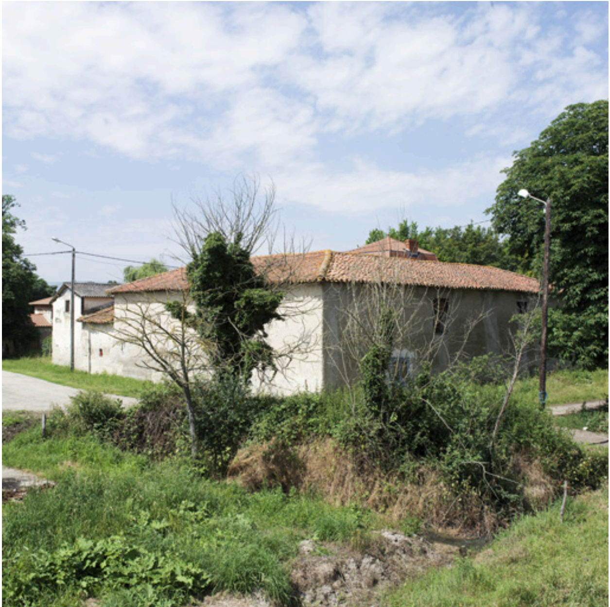
Vue générale de la ferme, depuis le nord-est.