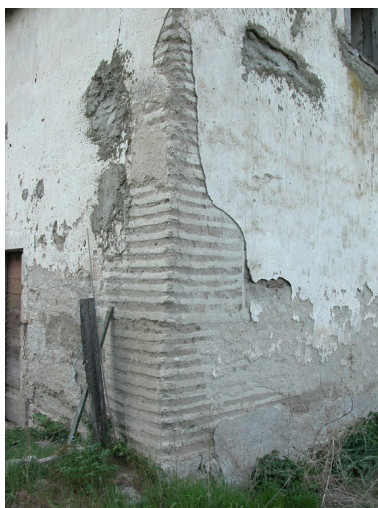
Détail de l'angle sud du bâtiment entre communs et ferme, depuis l'avant-cour. IVR82_20134202942NUCA