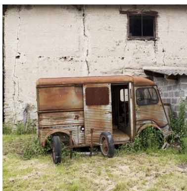
Vue intérieure de la cour de la ferme.