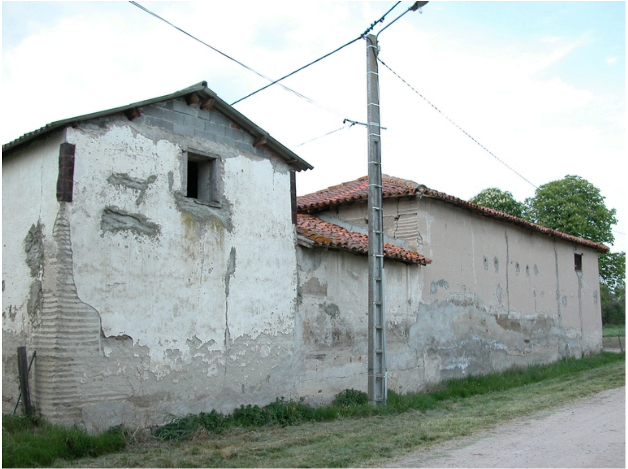
Vue de la ferme, depuis le sud-est.