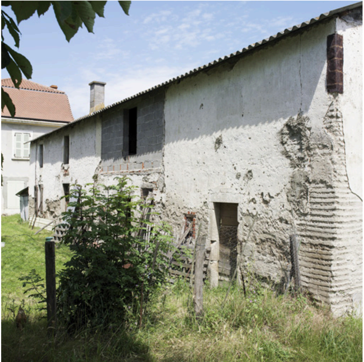
Vue du bâtiment entre communs et ferme, depuis l'avant-cour.