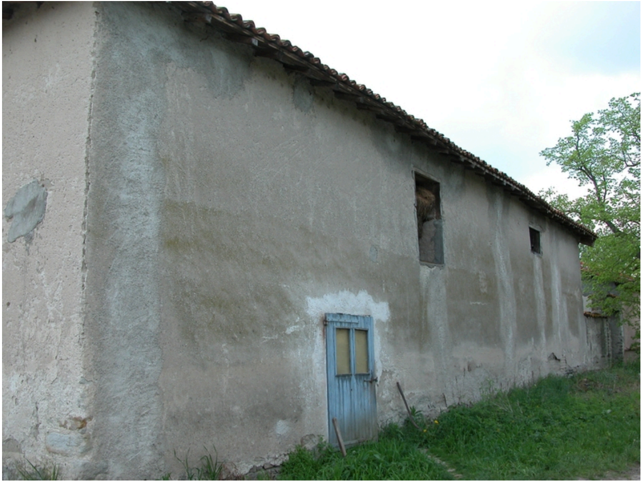
Vue de l'élévation nord de la grange-étable.