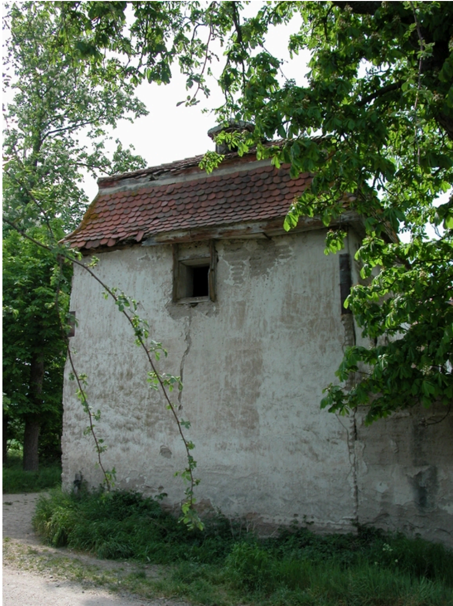
Vue du pigeonnier sud, depuis le sud-est.