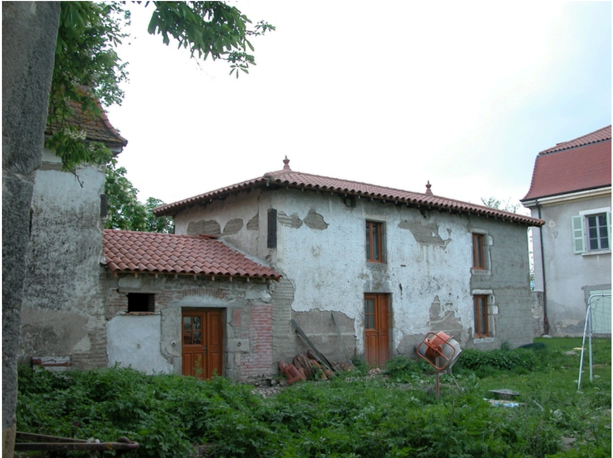
Vue d'ensemble du bâtiment sud des communs, depuis l'avant-cour.