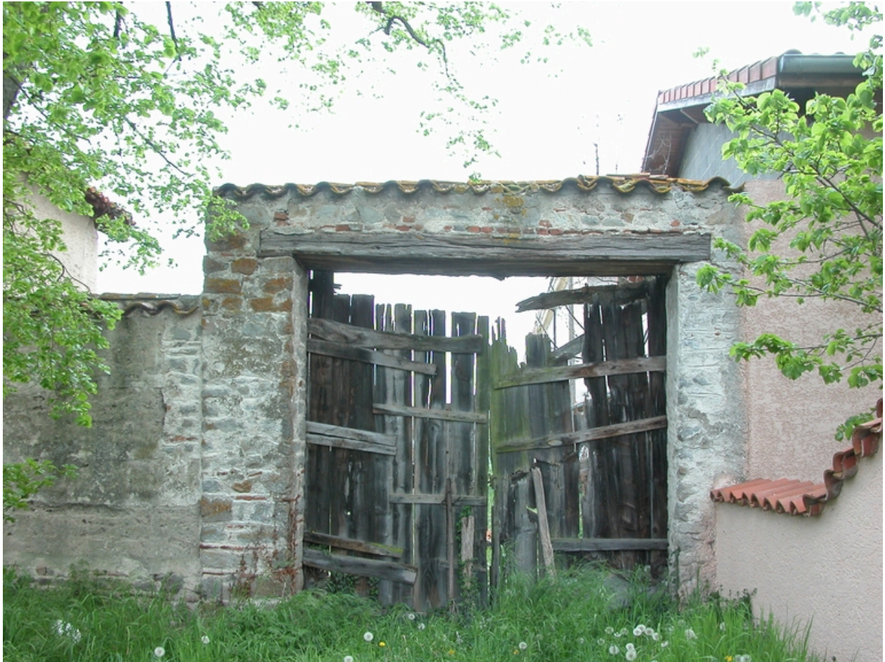
Vue du portail nord de la cour de la ferme.