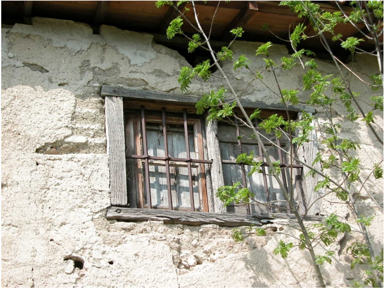
Détail d'une fenêtre de l'étage de l'habitation sud des communs, côté sud.