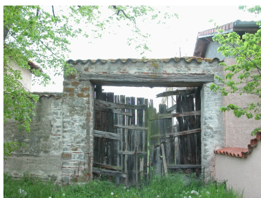
Vue du portail nord de la cour de la ferme. IVR82_20134202945NUCA