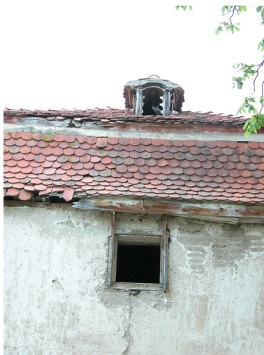
Détail du pigeonnier sud, depuis le sud-est : fenêtres d'envol. IVR82_20134202947NUCA