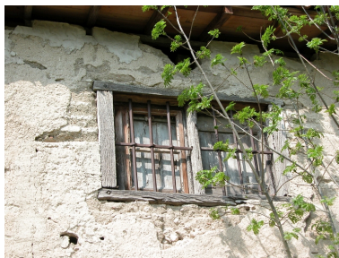
Détail d'une fenêtre de l'étage de l'habitation sud des communs, côté sud.