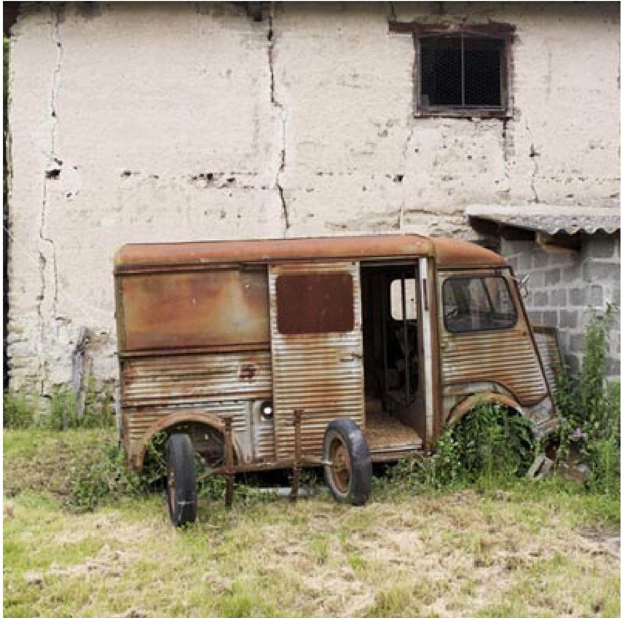
Vue intérieure de la cour de la ferme.