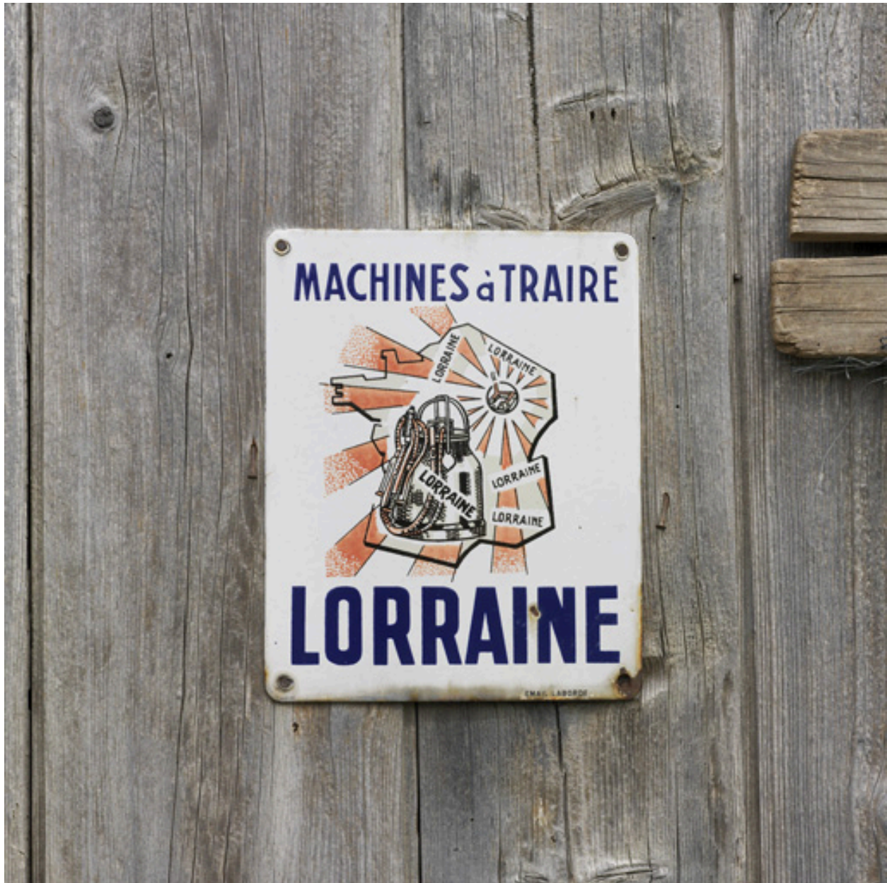
Détail d'une plaque en émail sur la porte de l'étable (Machines à traire Lorraine).