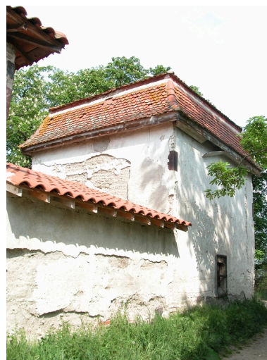
Vue du pigeonnier et du bâtiment sud des communs, depuis le sud-ouest. IVR82_20134202949NUCA