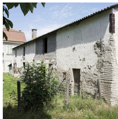
Vue du bâtiment entre communs et ferme, depuis l'avant-cour.