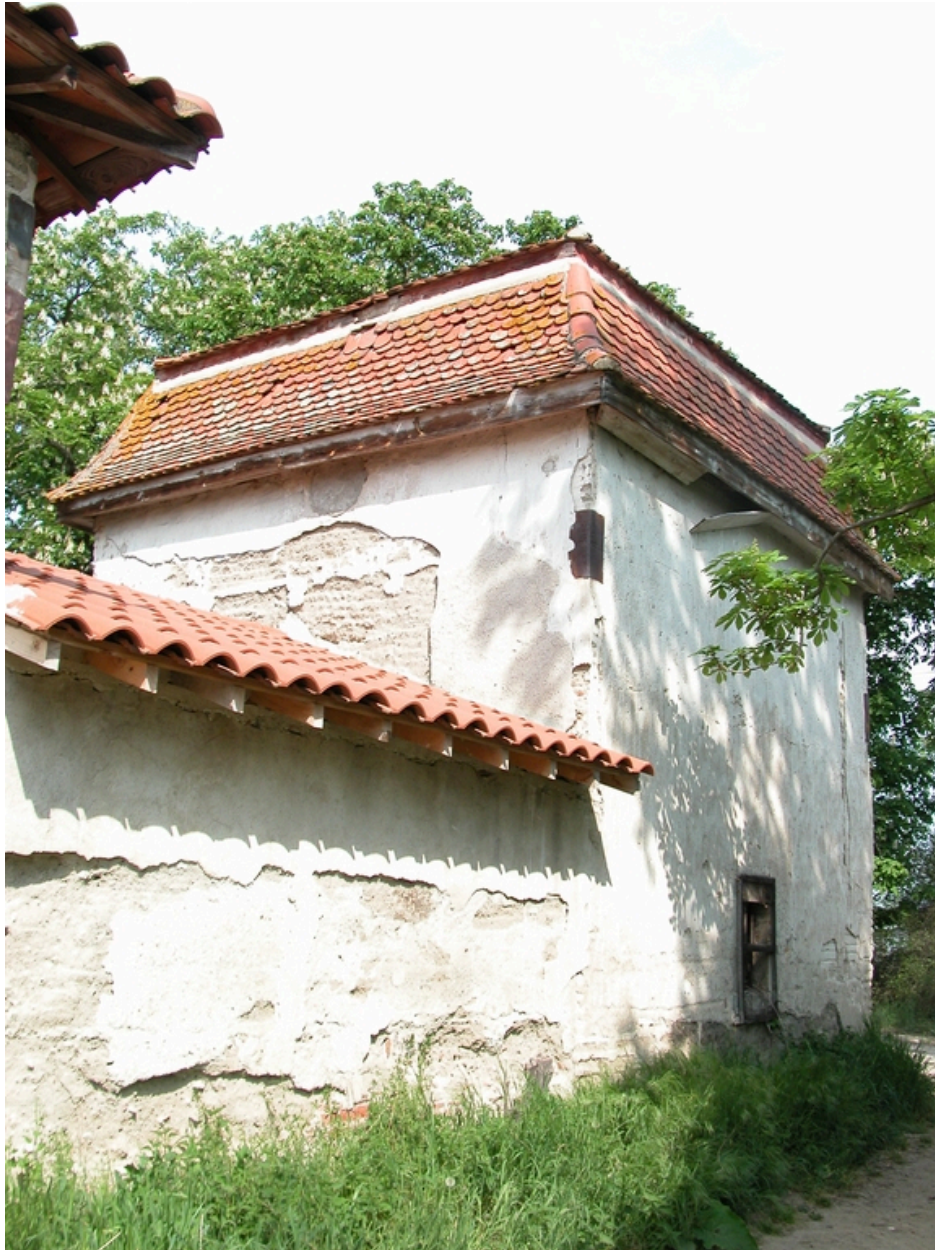
Vue du pigeonnier et du bâtiment sud des communs, depuis le sud-ouest.