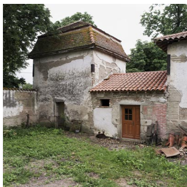
Vue d'ensemble du bâtiment sud des communs, depuis l'avant-cour. IVR82_20074200132NUCA