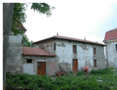
Vue d'ensemble du bâtiment sud des communs, depuis l'avant-cour. IVR82_20134202939NUCA