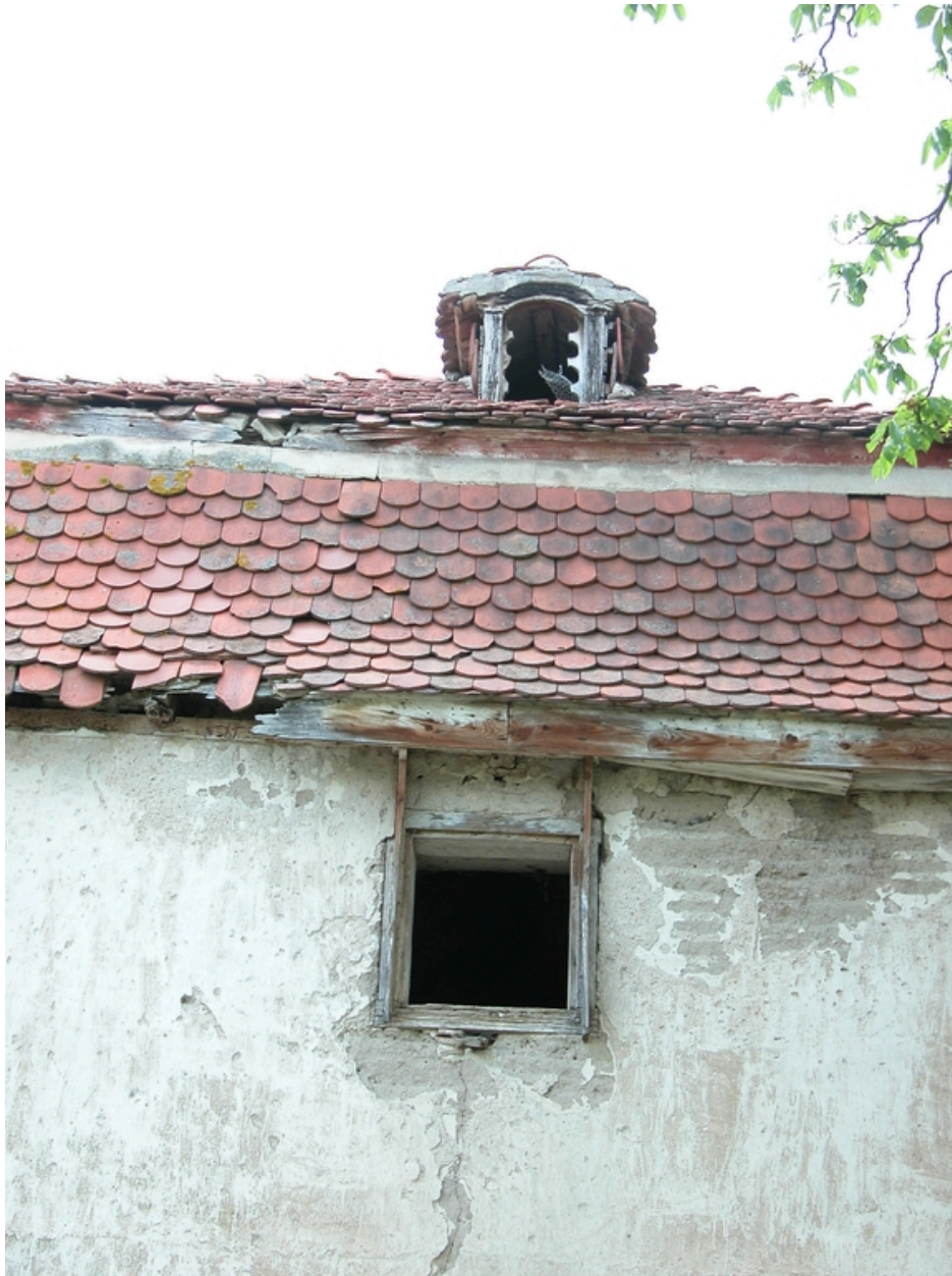
Détail du pigeonnier sud, depuis le sud-est : fenêtres d'envol.