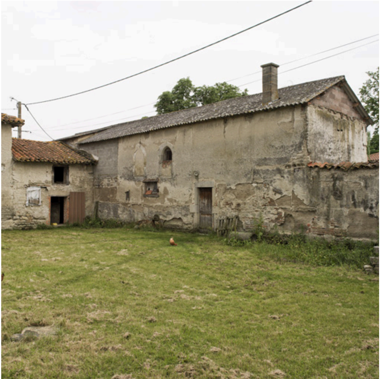
Vue de l'habitation du fermier, côté cour de ferme.