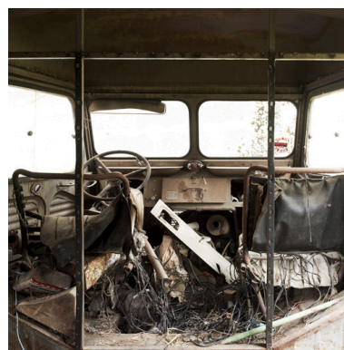
Vue intérieure de la camionnette dans la cour de la ferme.