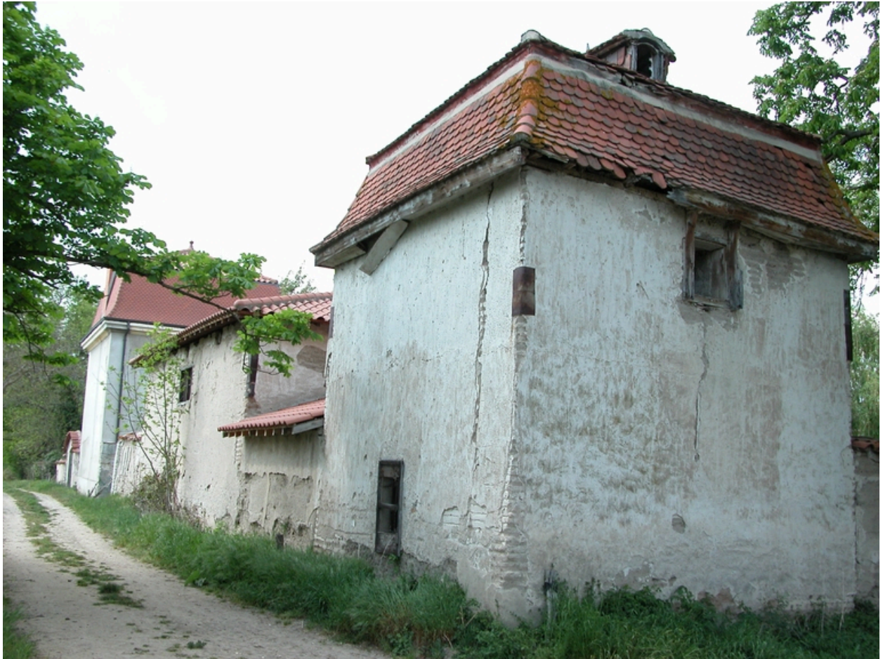
Vue d'ensemble du bâtiment sud des communs, depuis le sud.