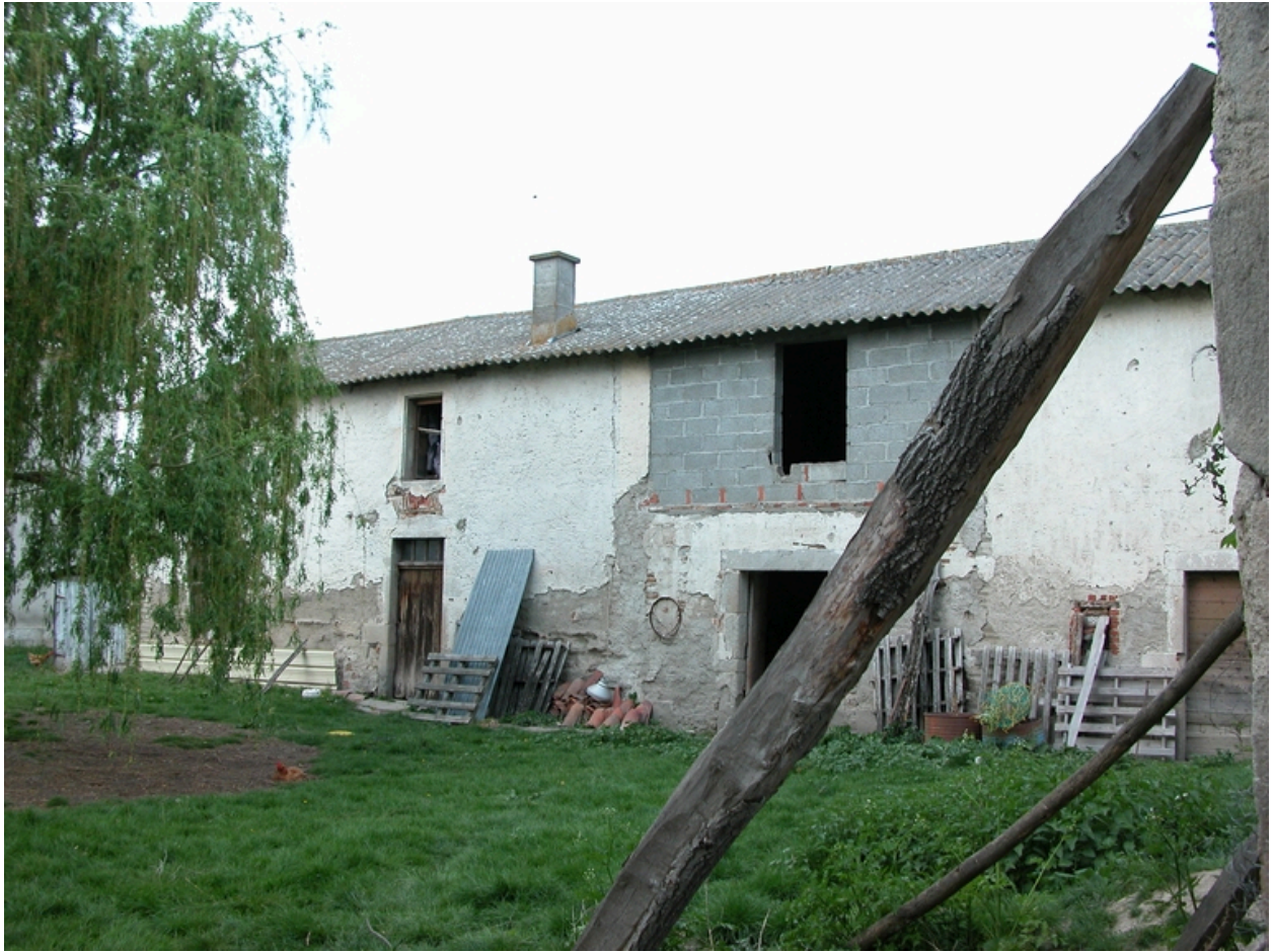
Vue du bâtiment entre communs et ferme, depuis l'avant-cour.