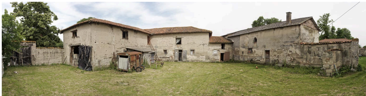
Vue générale intérieure de la cour de la ferme.