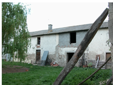
Vue du bâtiment entre communs et ferme, depuis l'avant-cour. IVR82_20134202941NUCA