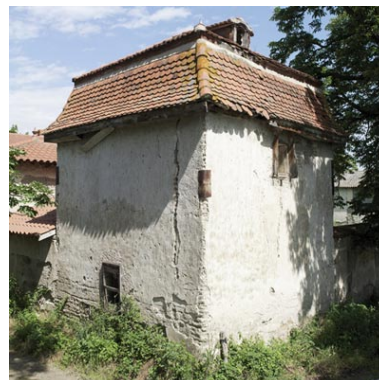
Vue du pigeonnier sud, depuis le sud. IVR82_20074200094NUCA