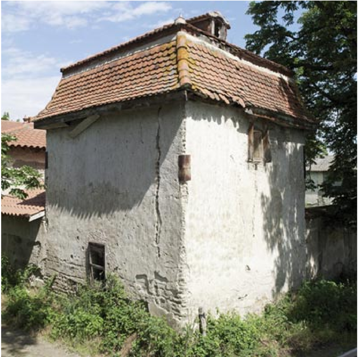
Vue du pigeonnier sud, depuis le sud.