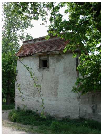
Vue du pigeonnier sud, depuis le sud-est. IVR82_20134202946NUCA