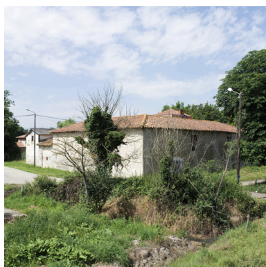
Vue générale de la ferme, depuis le nord-est. IVR82_20074200093NUCA