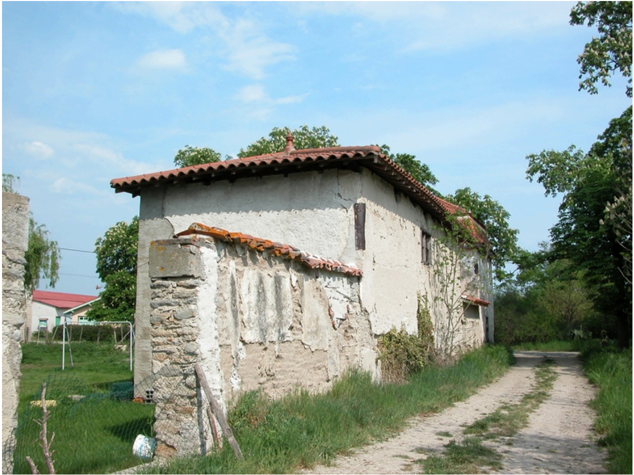
Vue d'ensemble du bâtiment sud des communs, depuis l'ouest.