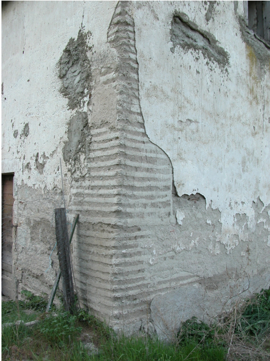
Détail de l'angle sud du bâtiment entre communs et ferme, depuis l'avant-cour.