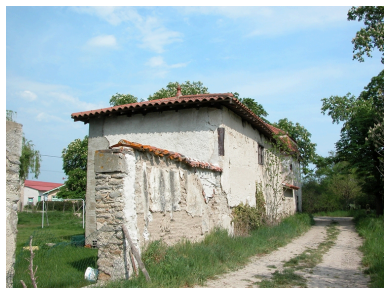
Vue d'ensemble du bâtiment sud des communs, depuis l'ouest.