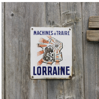
Détail d'une plaque en émail sur la porte de l'étable (Machines à traire Lorraine).