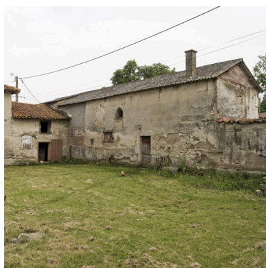
Vue de l'habitation du fermier, côté cour de ferme. IVR82_20074200112NUCA