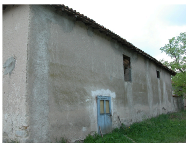
Vue de l'élévation nord de la grange-étable. IVR82_20134202944NUCA