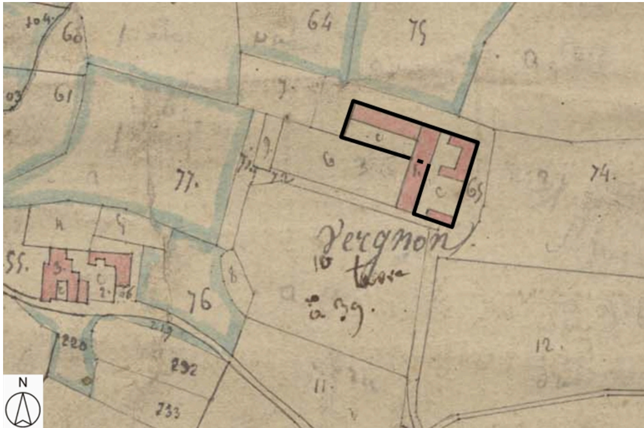
Plan de situation, d'après le cadastre de [1809], section A, échelle originale 1:5000 Plan cadastral, dit cadastre napoléonien Dessin au crayon, plume et lavis d'encre colorées sur papier, 1809. AD Loire. 3P-1682VT