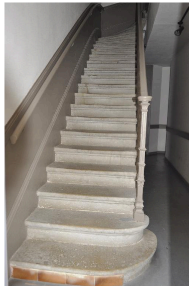
Vue intérieure : première volée de l'escalier en revers de façade