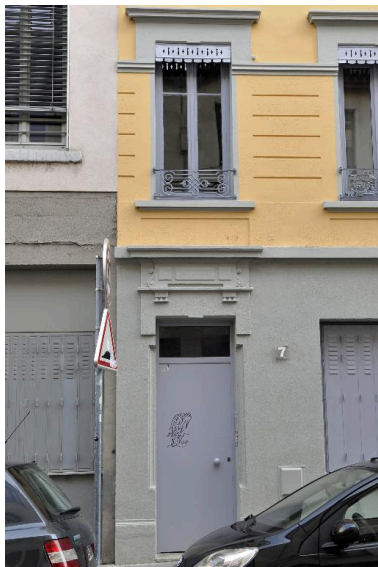
Vue rapprochée de la porte