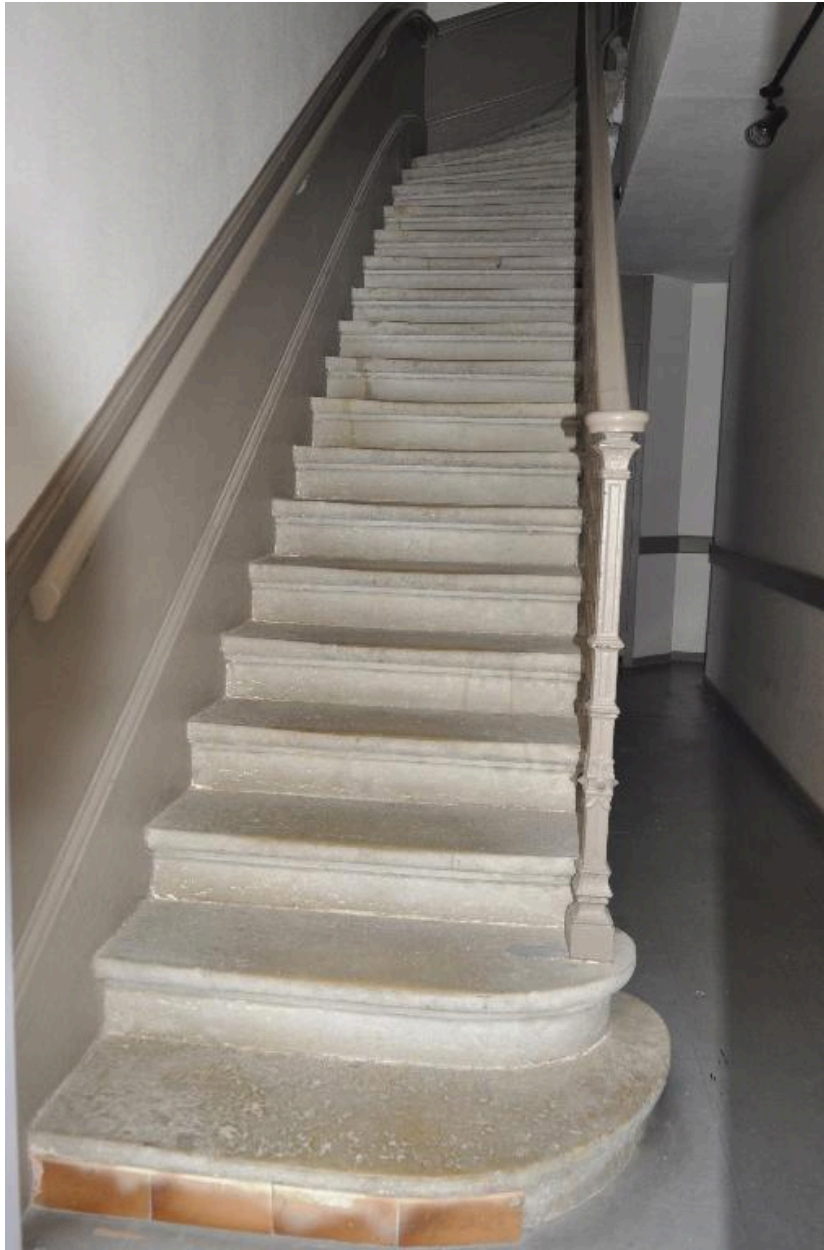
Vue intérieure : première volée de l'escalier en revers de façade