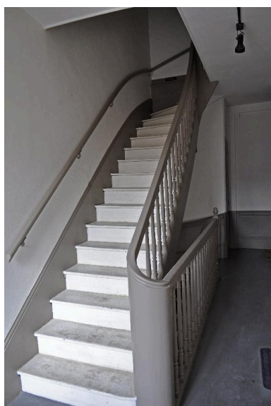
Vue intérieure : escalier en bois au dernier étage IVR84_20166902252NUCA