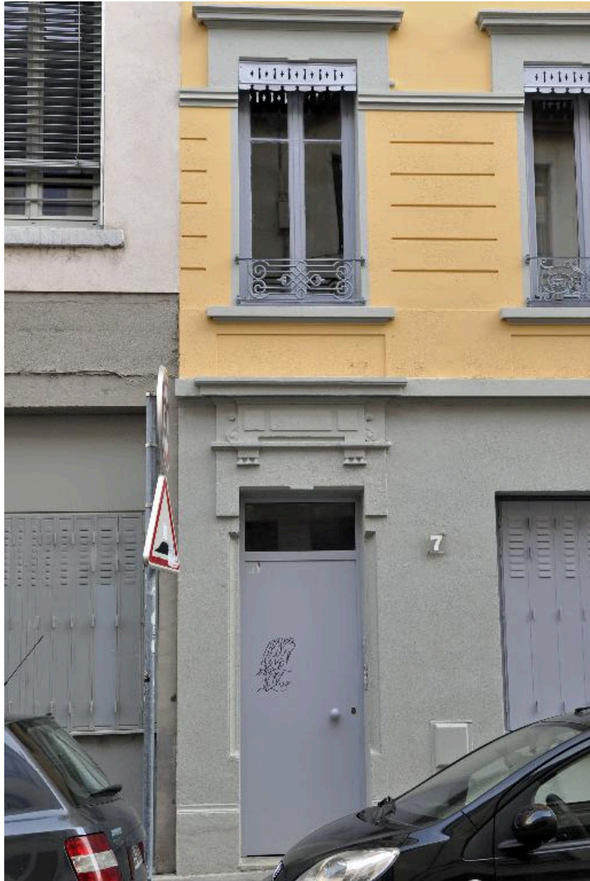
Vue rapprochée de la porte