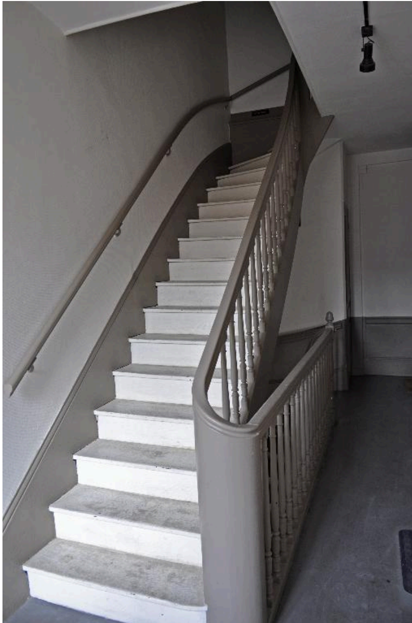
Vue intérieure : escalier en bois au dernier étage