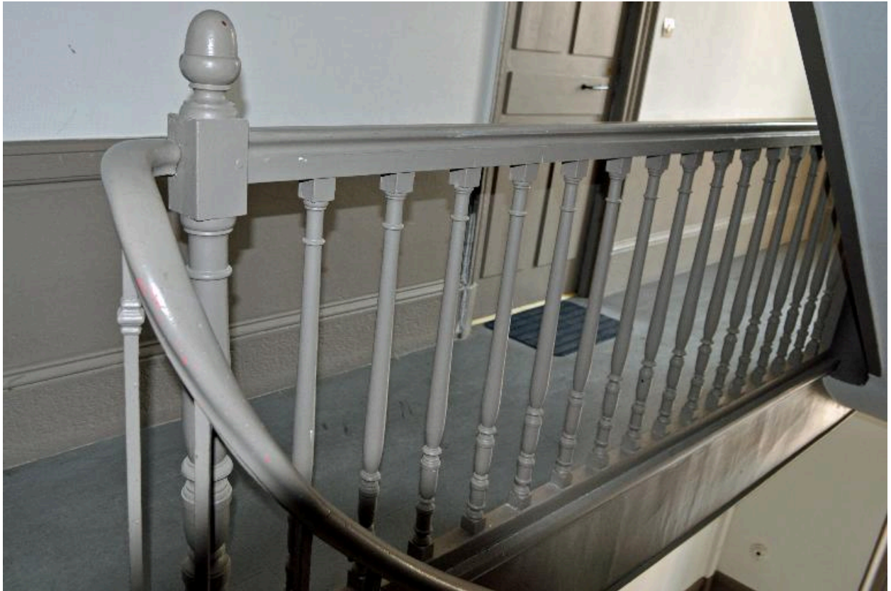
Vue intérieure, garde-corps en bois du deuxième palier