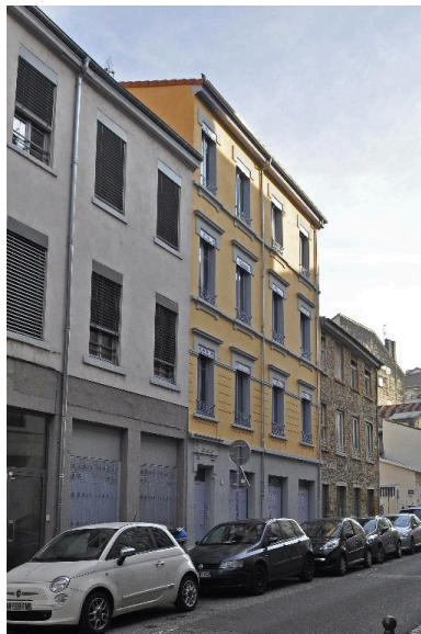
Vue d'ensemble depuis l'ouest IVR84_20166902249NUCA