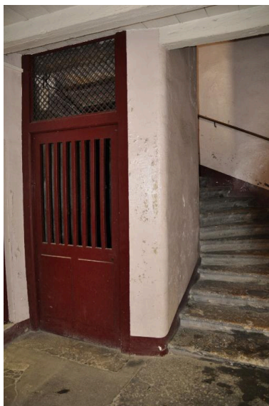
Vue de l'escalier et de la porte d'accès à la cave IVR82_20146900290NUCA