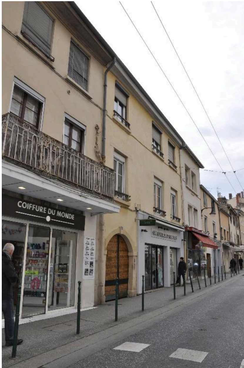
Vue d'ensemble nord ouest