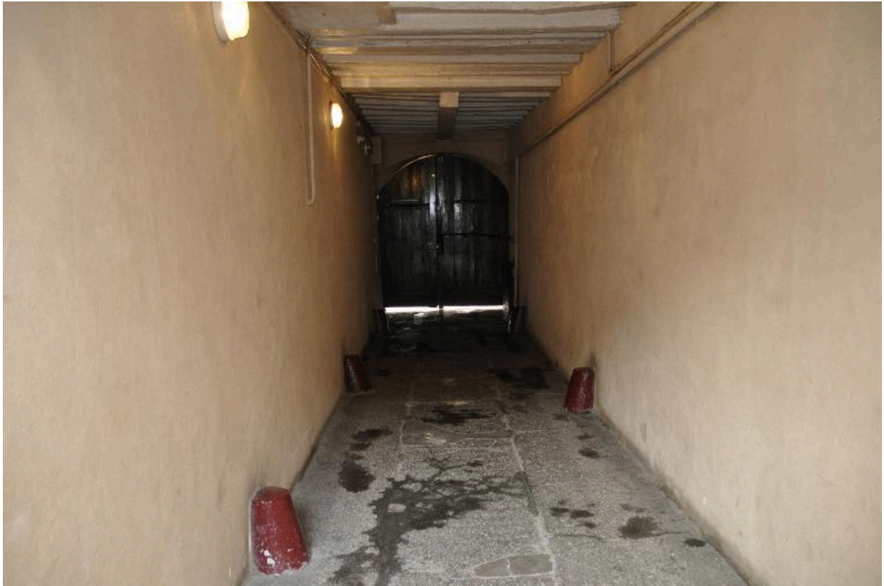
Vue de l'allée depuis la cour