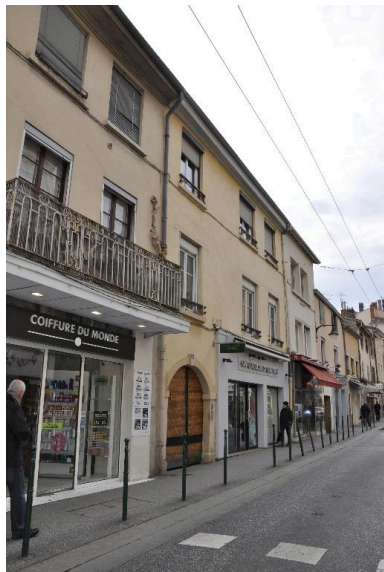
Vue d'ensemble nord ouest IVR82_20146900286NUCA