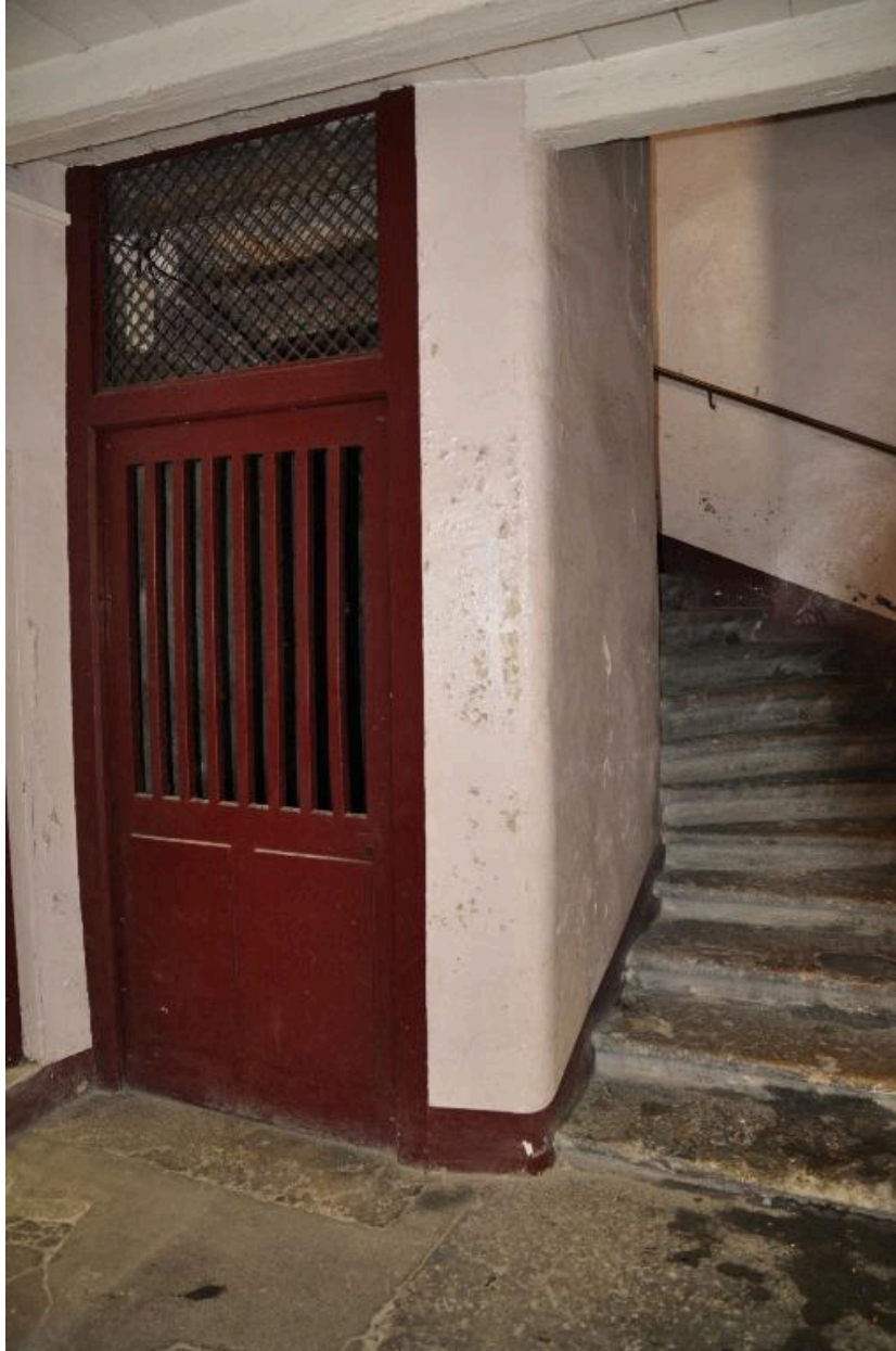
Vue de l'escalier et de la porte d'accès à la cave