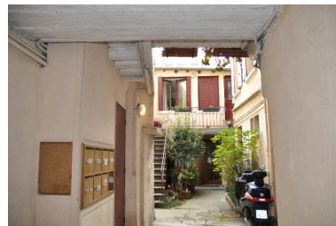
Vue de la cour IVR82_20146900288NUCA