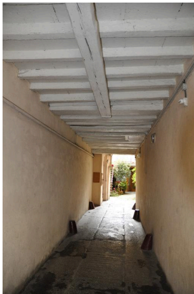
Vue de l'allée IVR82_20146900287NUCA