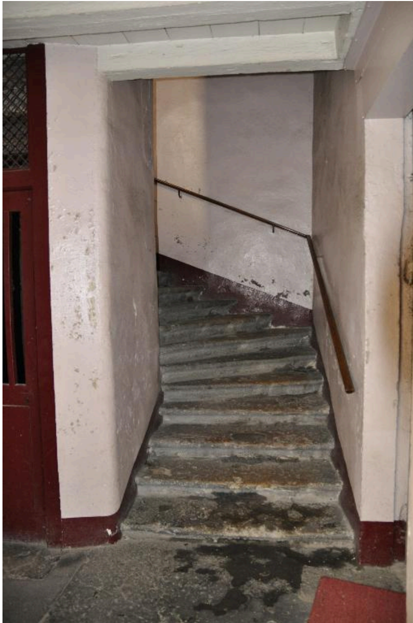
Vue du départ de l'escalier