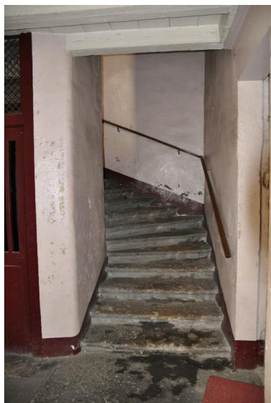
Vue du départ de l'escalier IVR82_20146900289NUCA