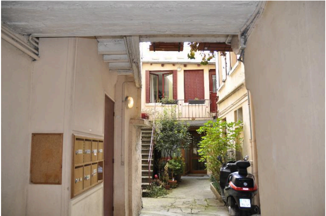
Vue de la cour