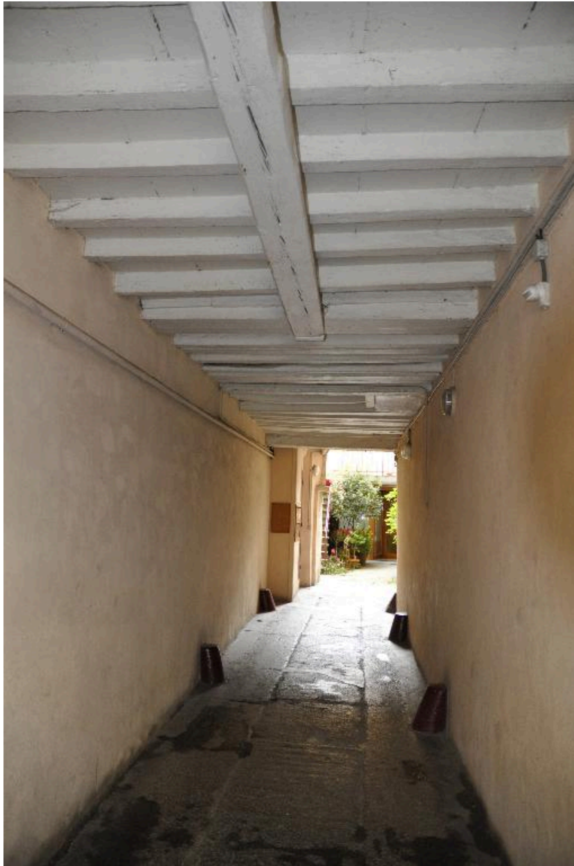
Vue de l'allée