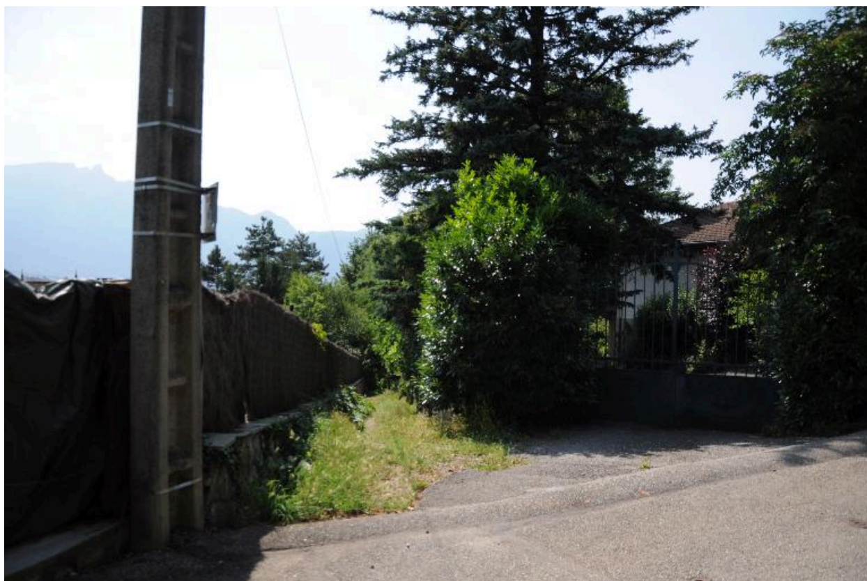
Sentier, partie supérieure, jonction avec le boulevard Mme Mourichon