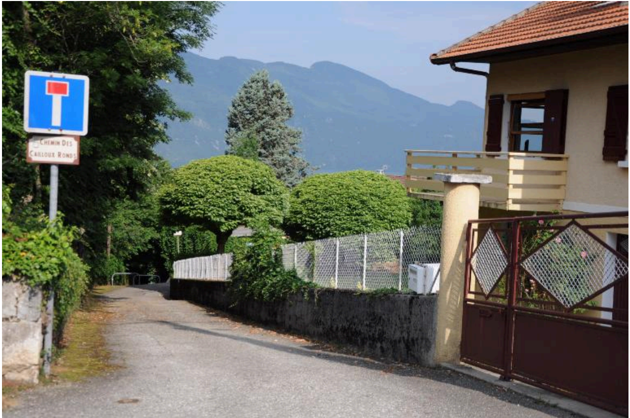
Section goudronnée, partie supérieure, débouché sur le boulevard de Chantemerle