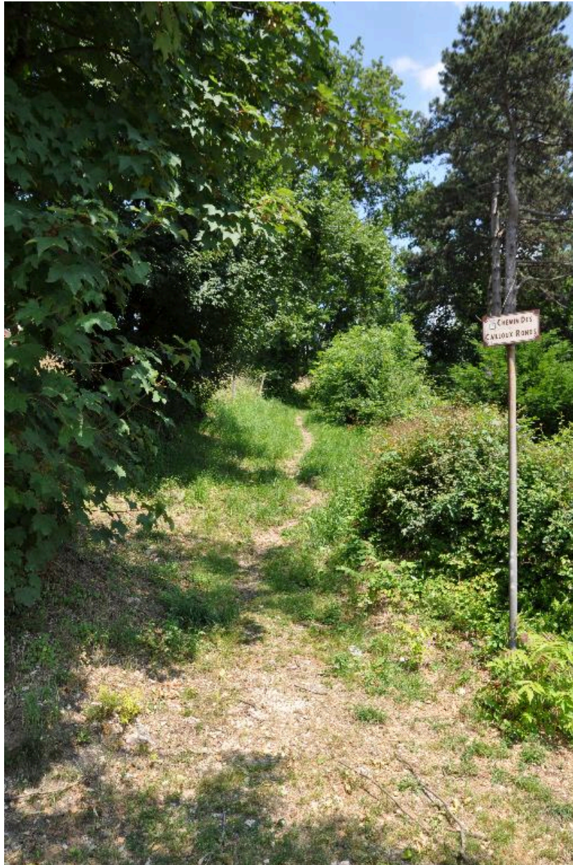
Sentier, partie inférieure, jonction avec le chemin A. Toudouze