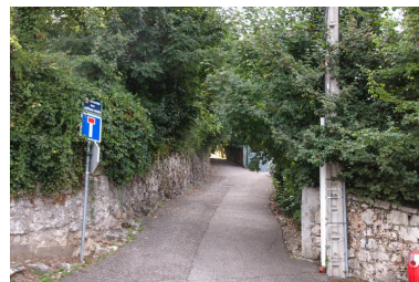
Section goudronnée, partie inférieure IVR82_20137300680NUCA