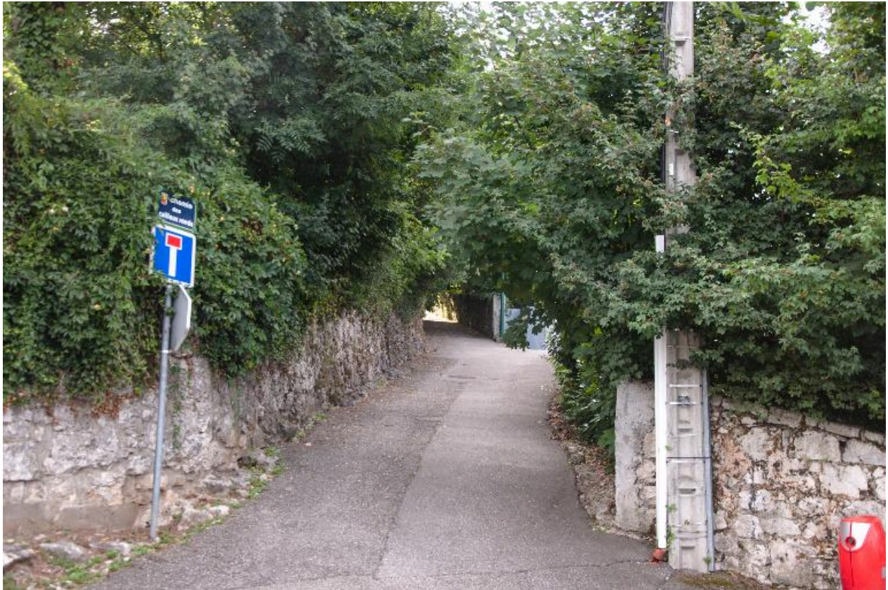
Section goudronnée, partie inférieure