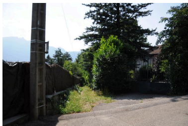
Sentier, partie supérieure, jonction avec le boulevard Mme Mourichon IVR82_20137300679NUCA