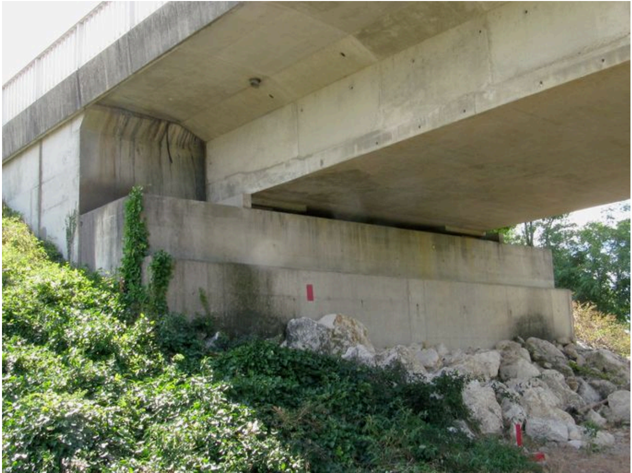
Culée de la rive gauche, face amont