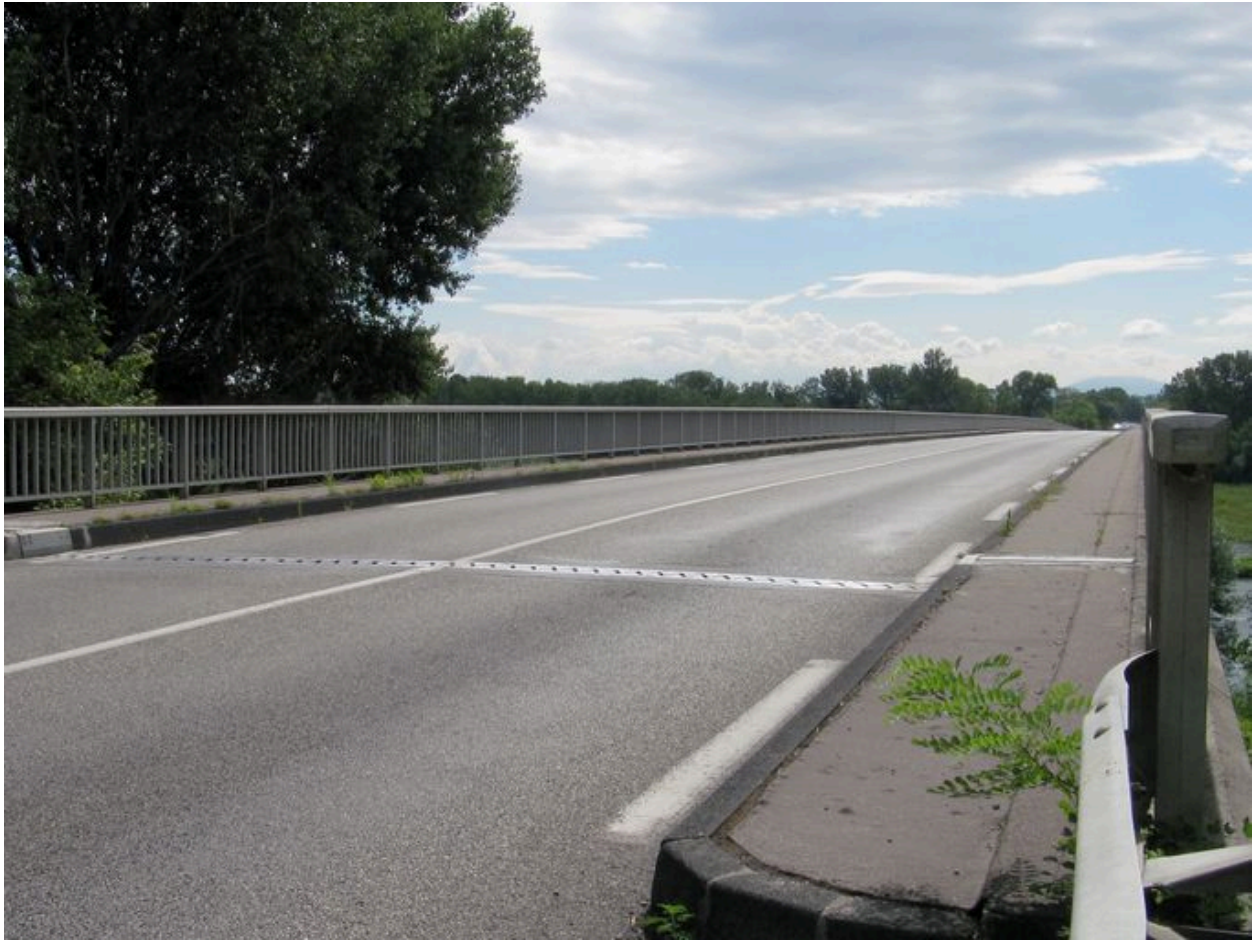
Chaussée (depuis la rive gauche)