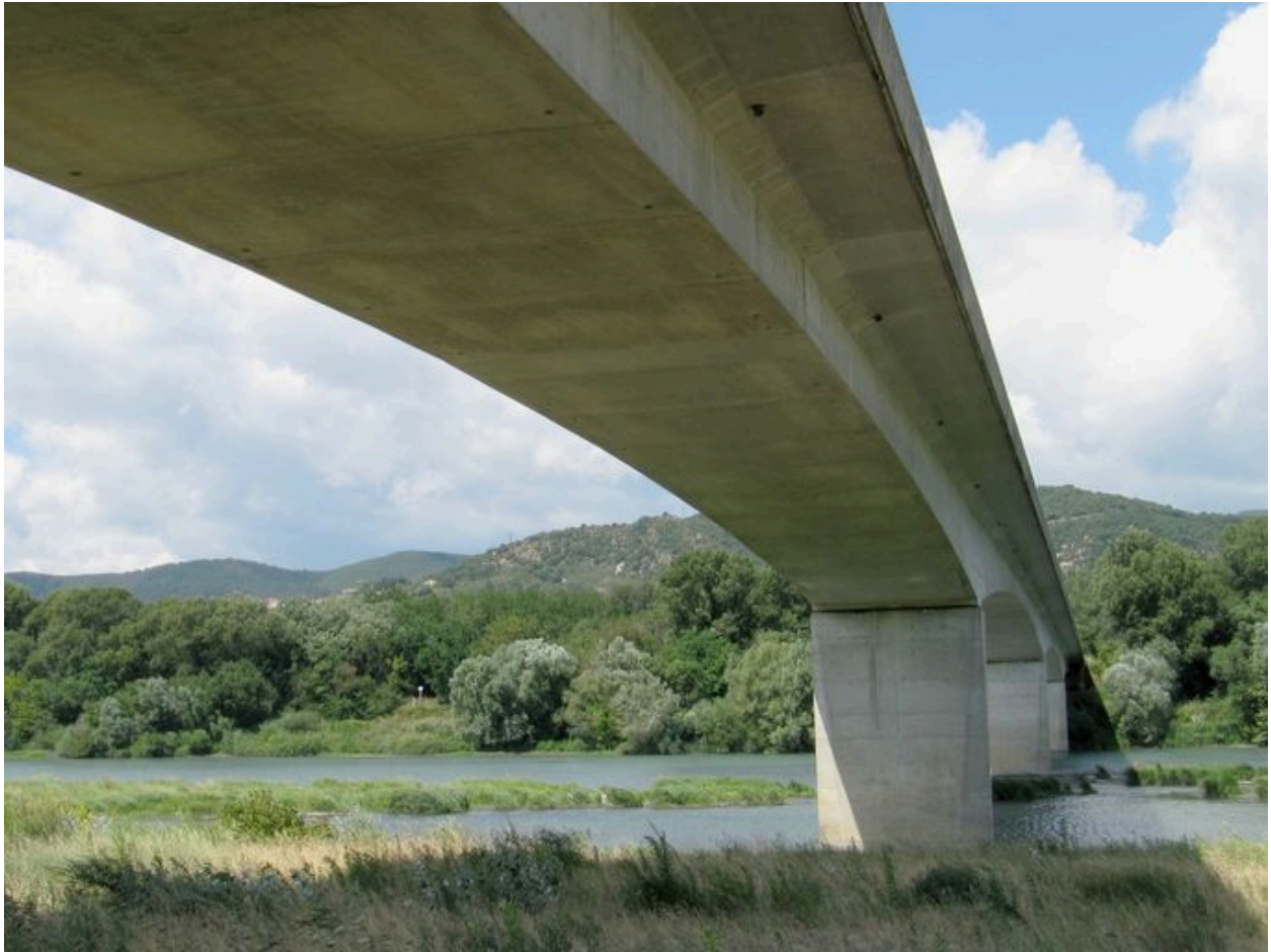
Dessous du tablier, face amont (depuis la rive gauche)