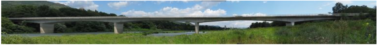
Vue panoramique, face aval (depuis la rive gauche)