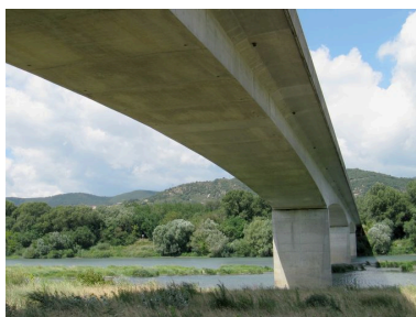
Dessous du tablier, face amont (depuis la rive gauche)