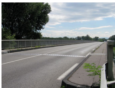
Chaussée (depuis la rive gauche) IVR82_20100700165NUCA