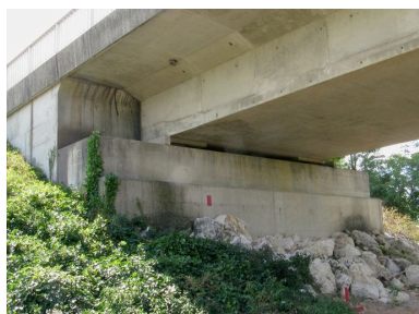
Culée de la rive gauche, face amont IVR82_20100700161NUCA