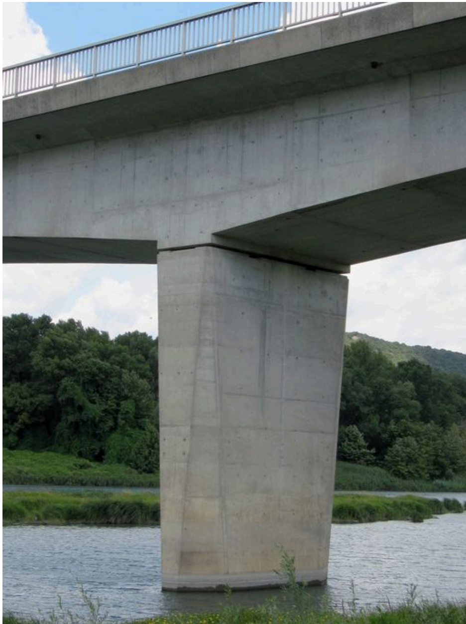
Pile, face aval (depuis la rive gauche)