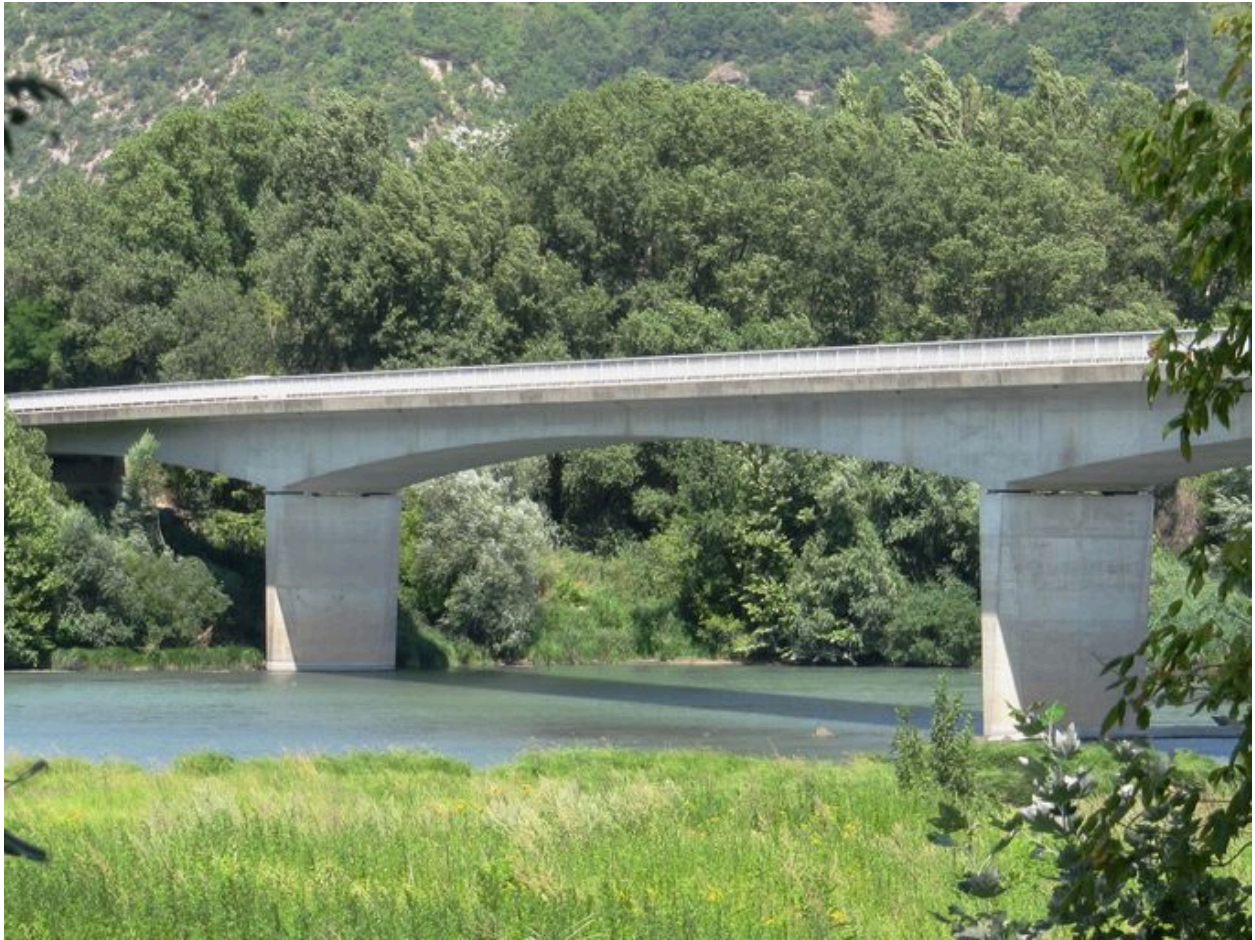
Vue partielle, face aval (depuis la rive gauche)