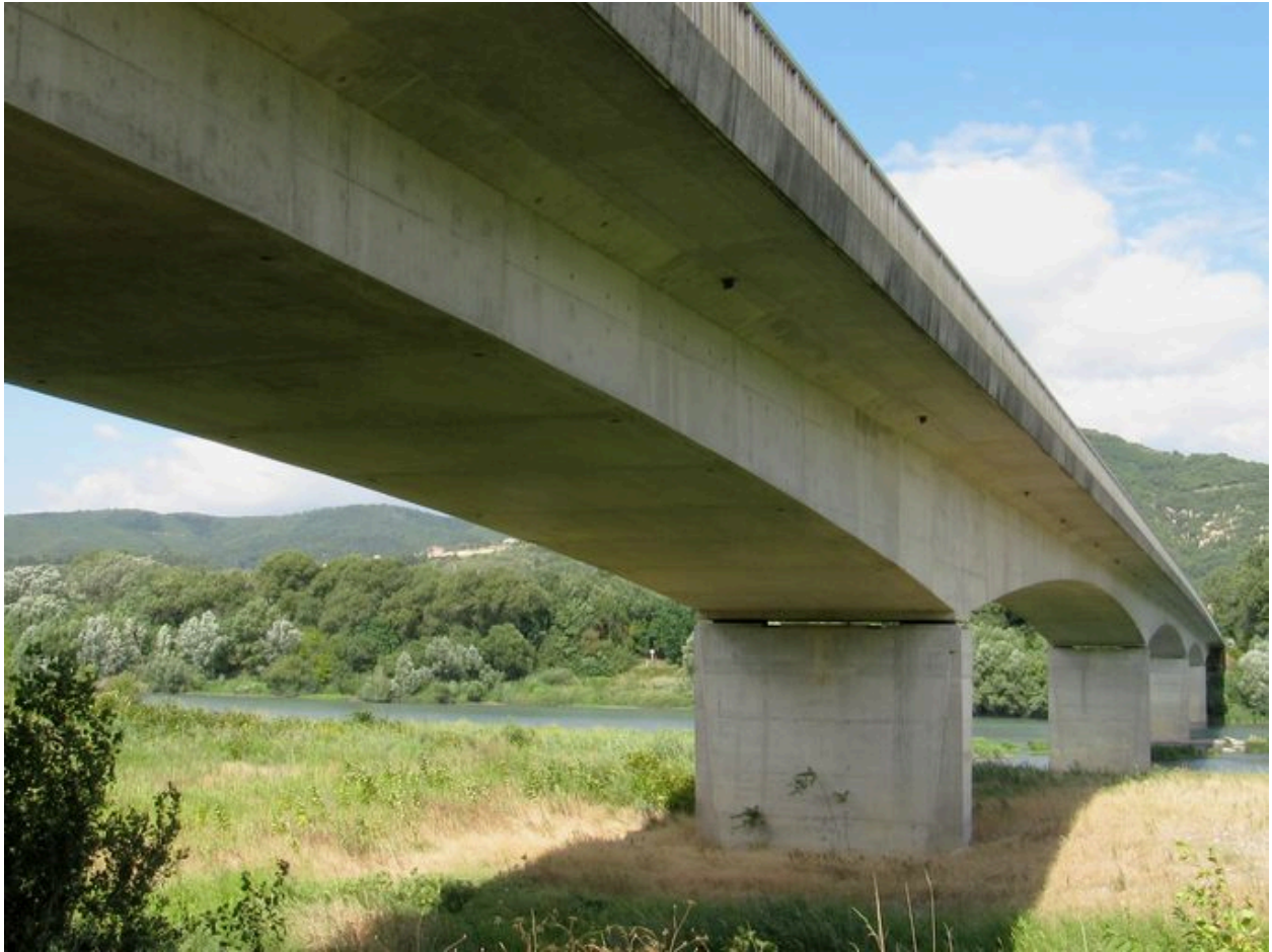
Vue générale, face amont (depuis la rive gauche)