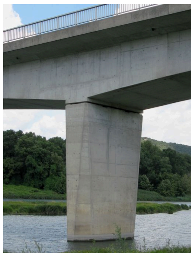
Pile, face aval (depuis la rive gauche) IVR82_20100700164NUCA