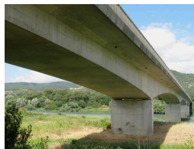
Vue générale, face amont (depuis la rive gauche) IVR82_20100700160NUCA