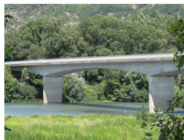
Vue partielle, face aval (depuis la rive gauche) IVR82_20100700163NUCA