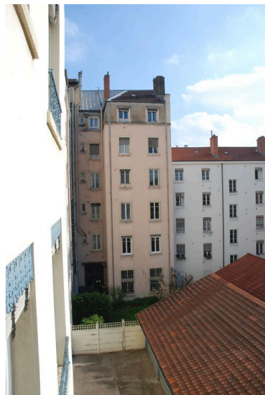
Vue du revers IVR82_20126900991NUCA