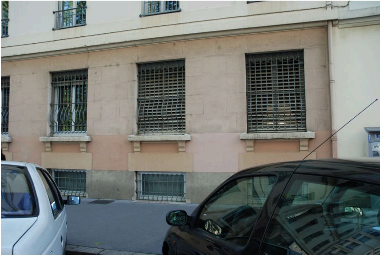
Détail du rez-de-chaussée, rue Cavenne