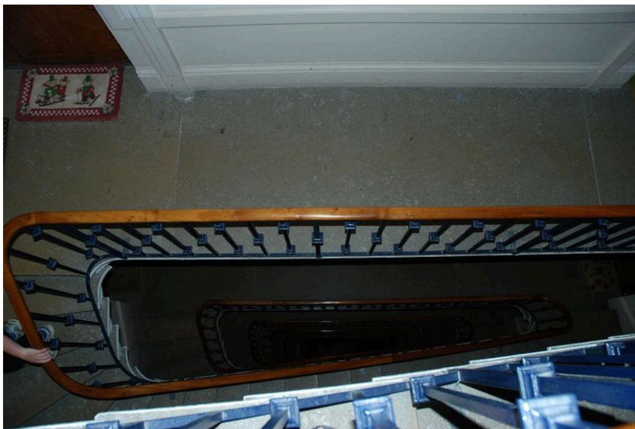
Vue de la cage d'escalier