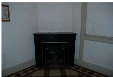
Vue de la cheminée de l'ancienne loge de concierge, transformée en local à boîte aux lettres