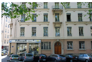
Détail de l'élévation sur la rue Cavenne IVR82_20126900888NUCA