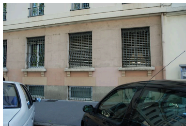
Détail du rez-de-chaussée, rue Cavenne IVR82_20126900891NUCA