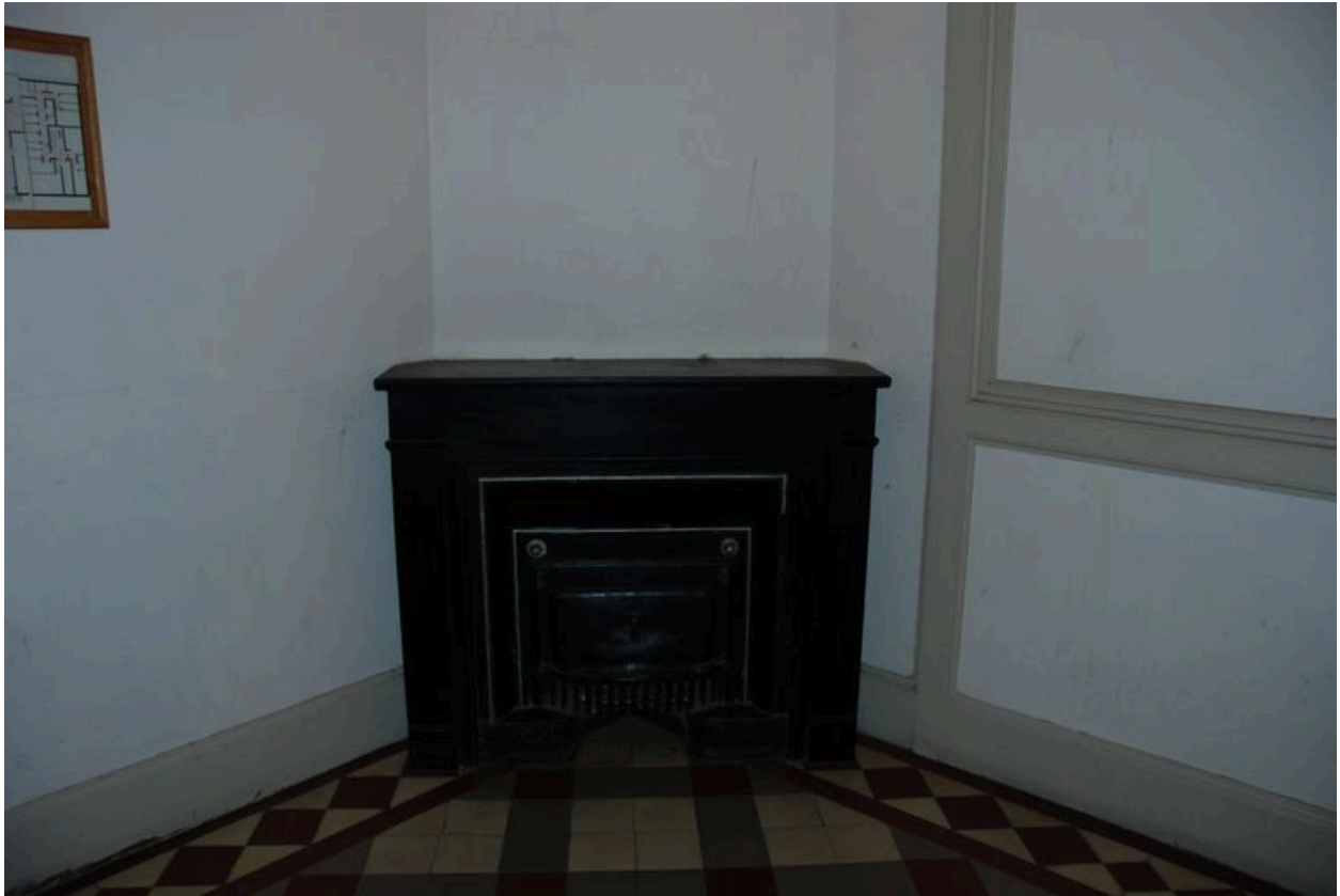
Vue de la cheminée de l'ancienne loge de concierge, transformée en local à boîte aux lettres