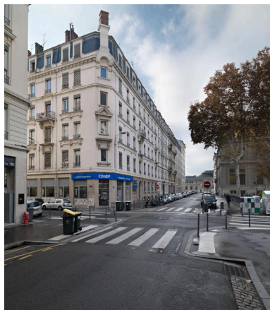
Vue de situation depuis la rue Cavenne