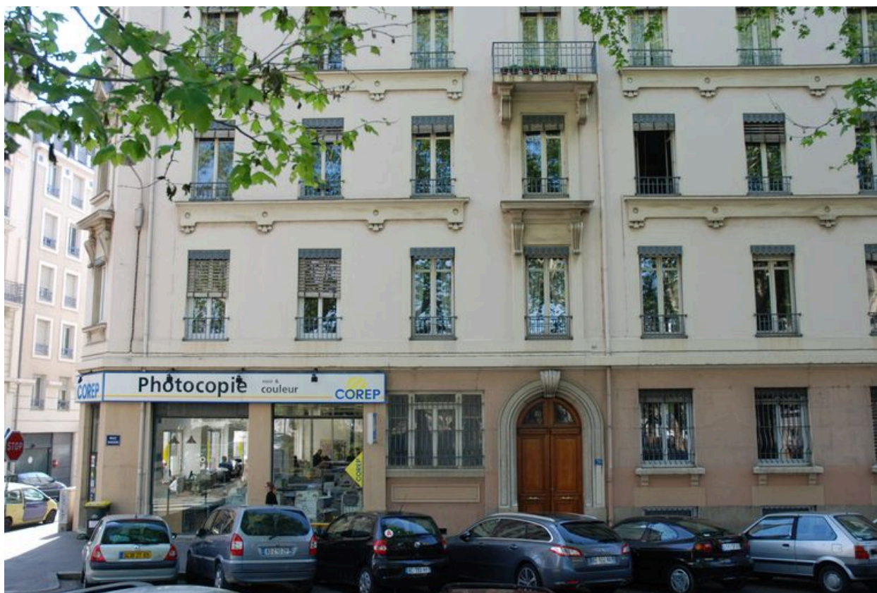
Détail de l'élévation sur la rue Cavenne