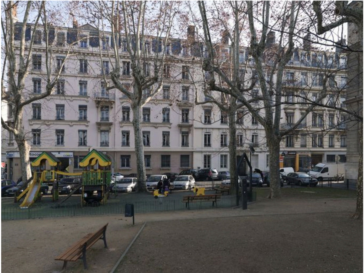
Elévation sur la rue Cavenne, vue générale