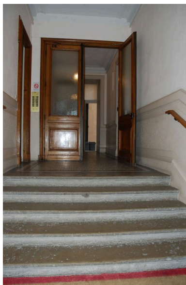
Vue intérieure : vestibule surélevé et porte du sas