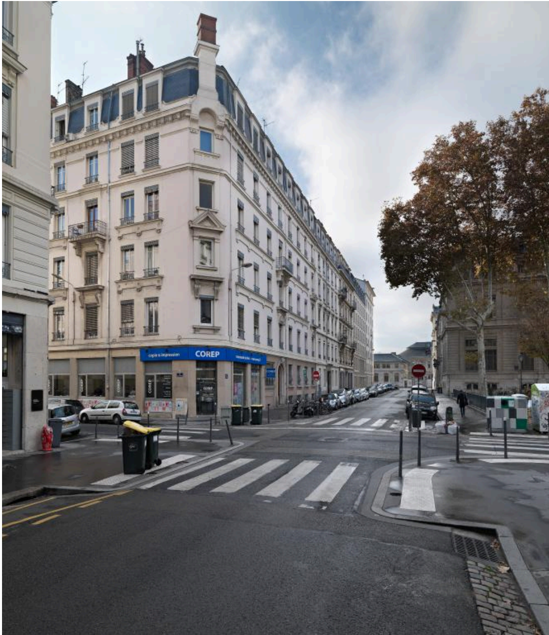
Vue de situation depuis la rue Cavenne