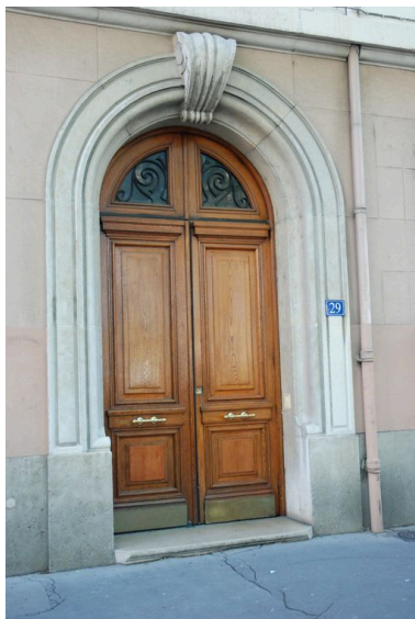
Détail de la porte d'entrée (rue Cavenne)