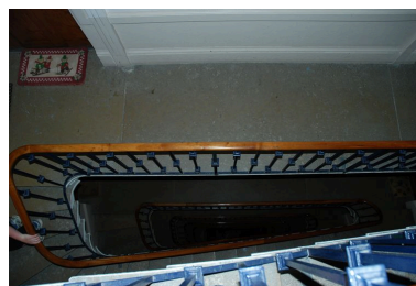
Vue de la cage d'escalier