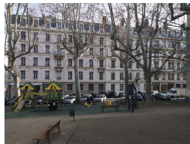
Elévation sur la rue Cavenne, vue générale IVR82_20126902019NUCA