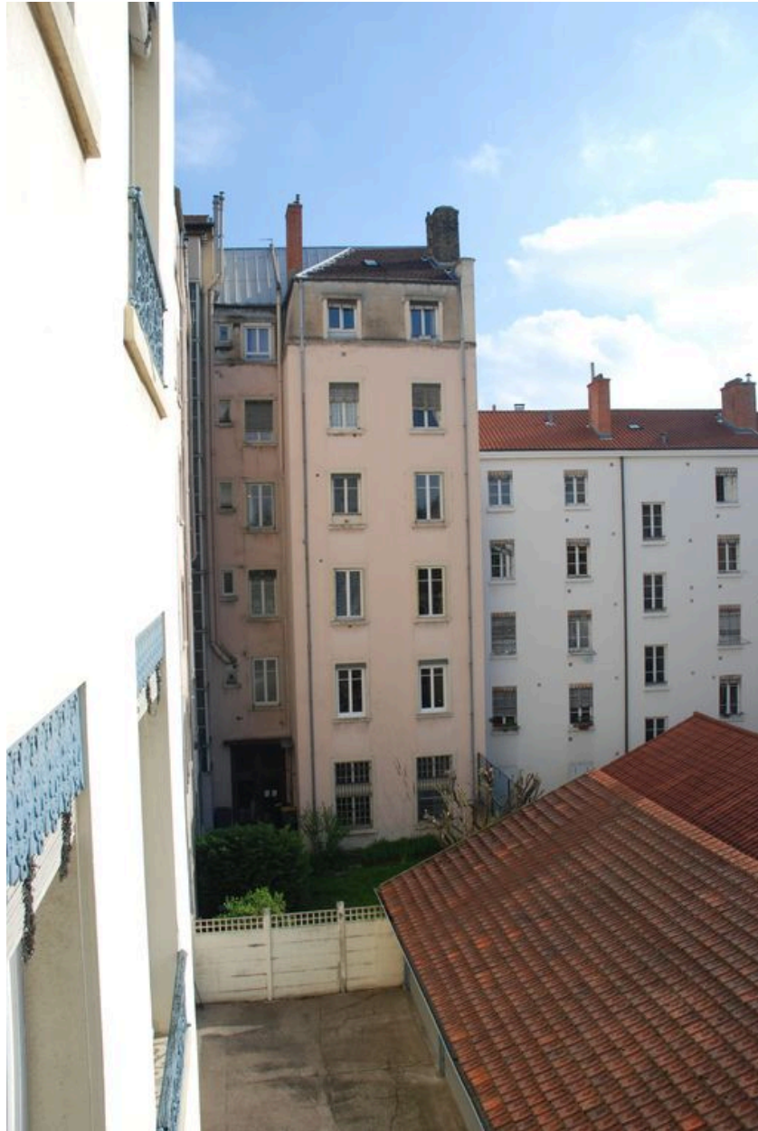
Vue du revers