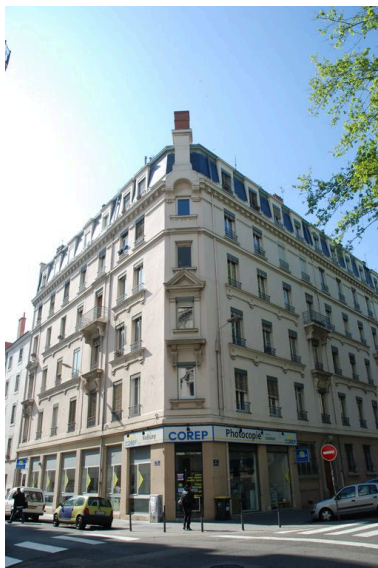
Vue générale IVR82_20126900887NUCA