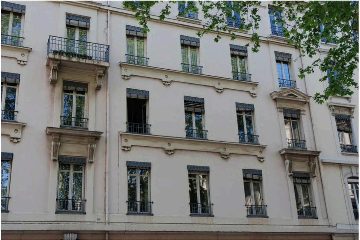
Détail de l'élévation sur la rue Cavenne