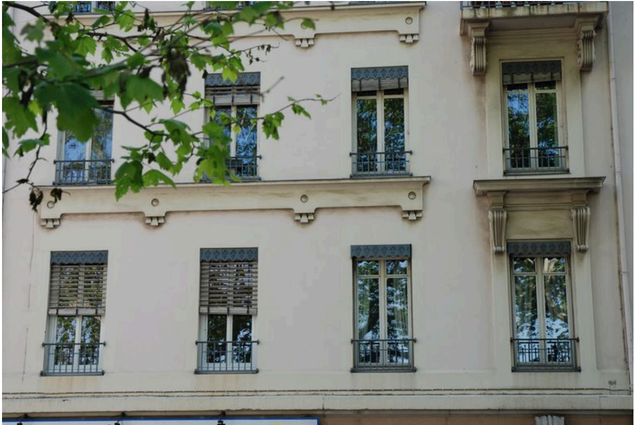
Détail de l'élévation sur la rue Cavenne