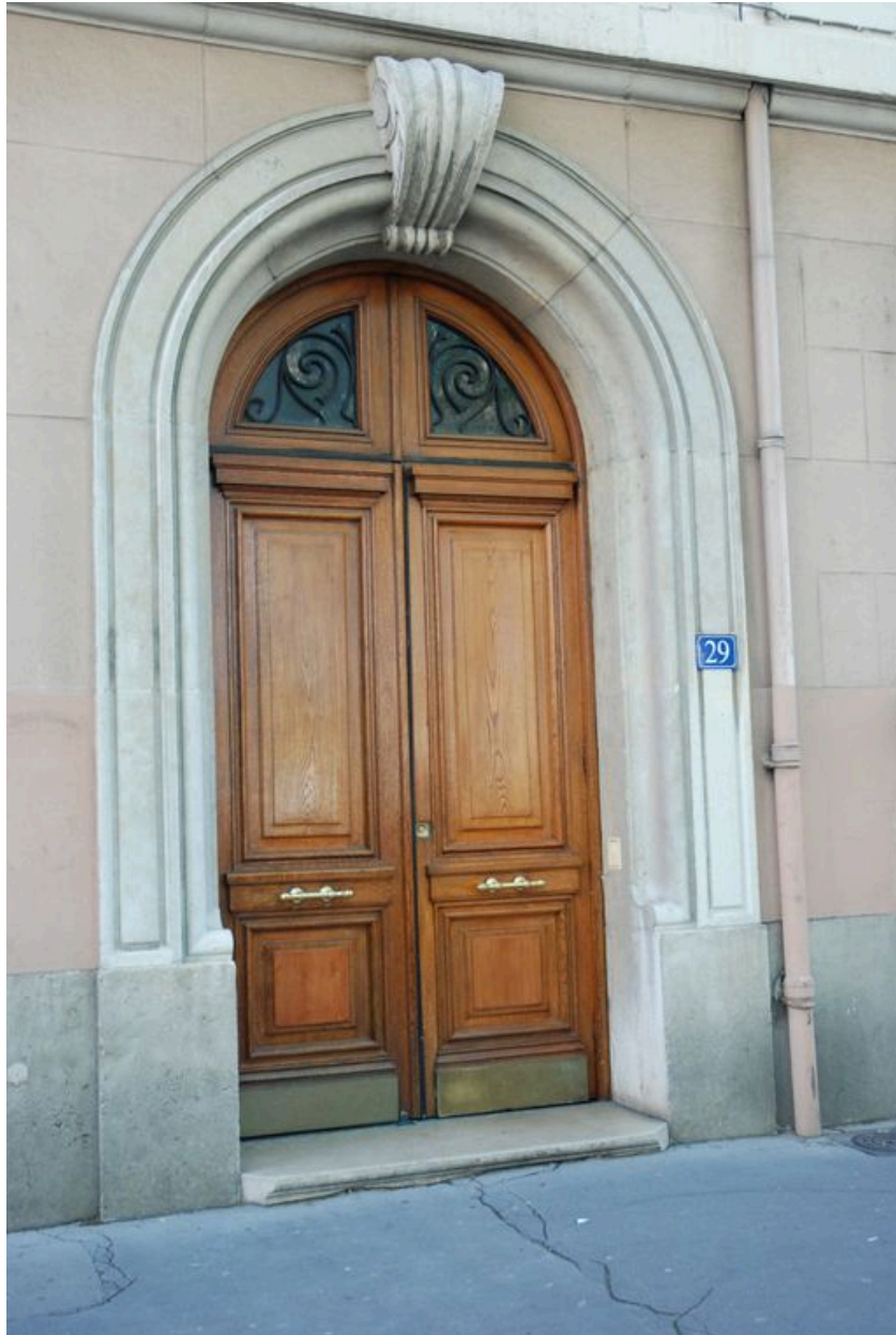
Détail de la porte d'entrée (rue Cavenne)