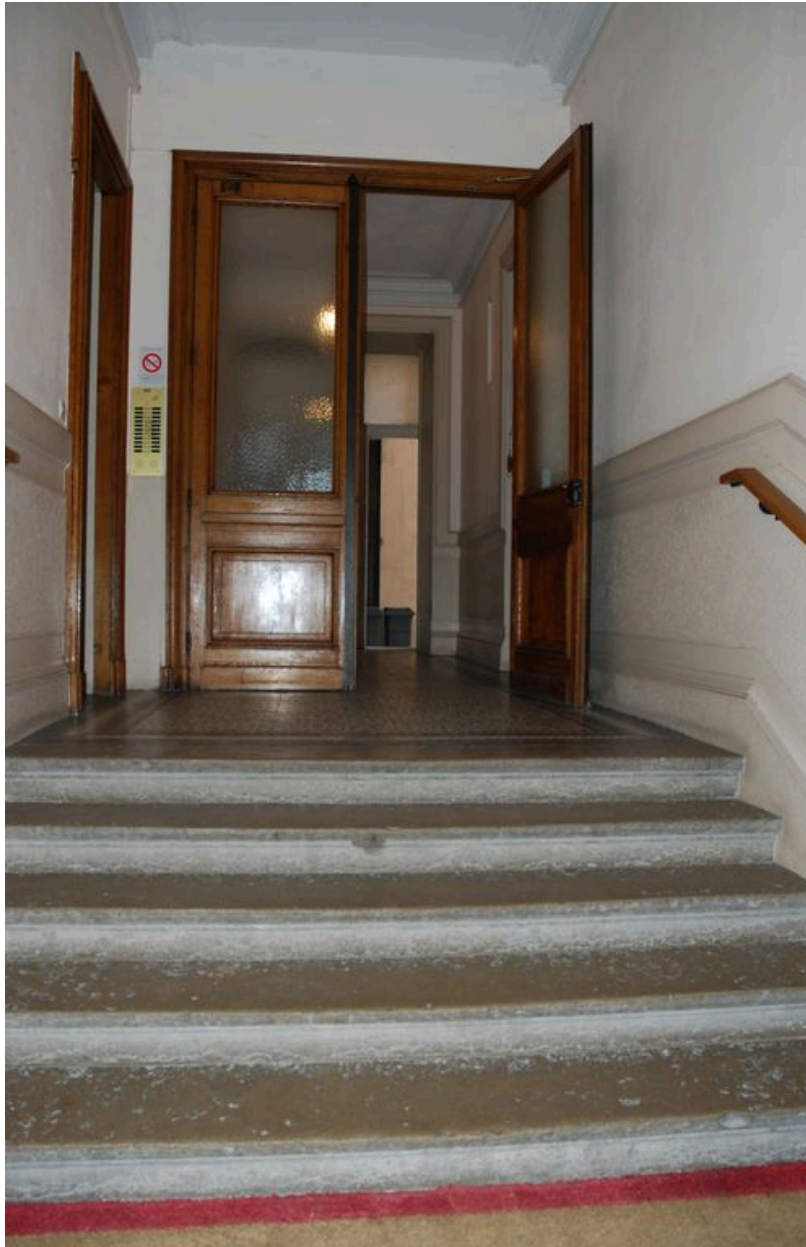
Vue intérieure : vestibule surélevé et porte du sas