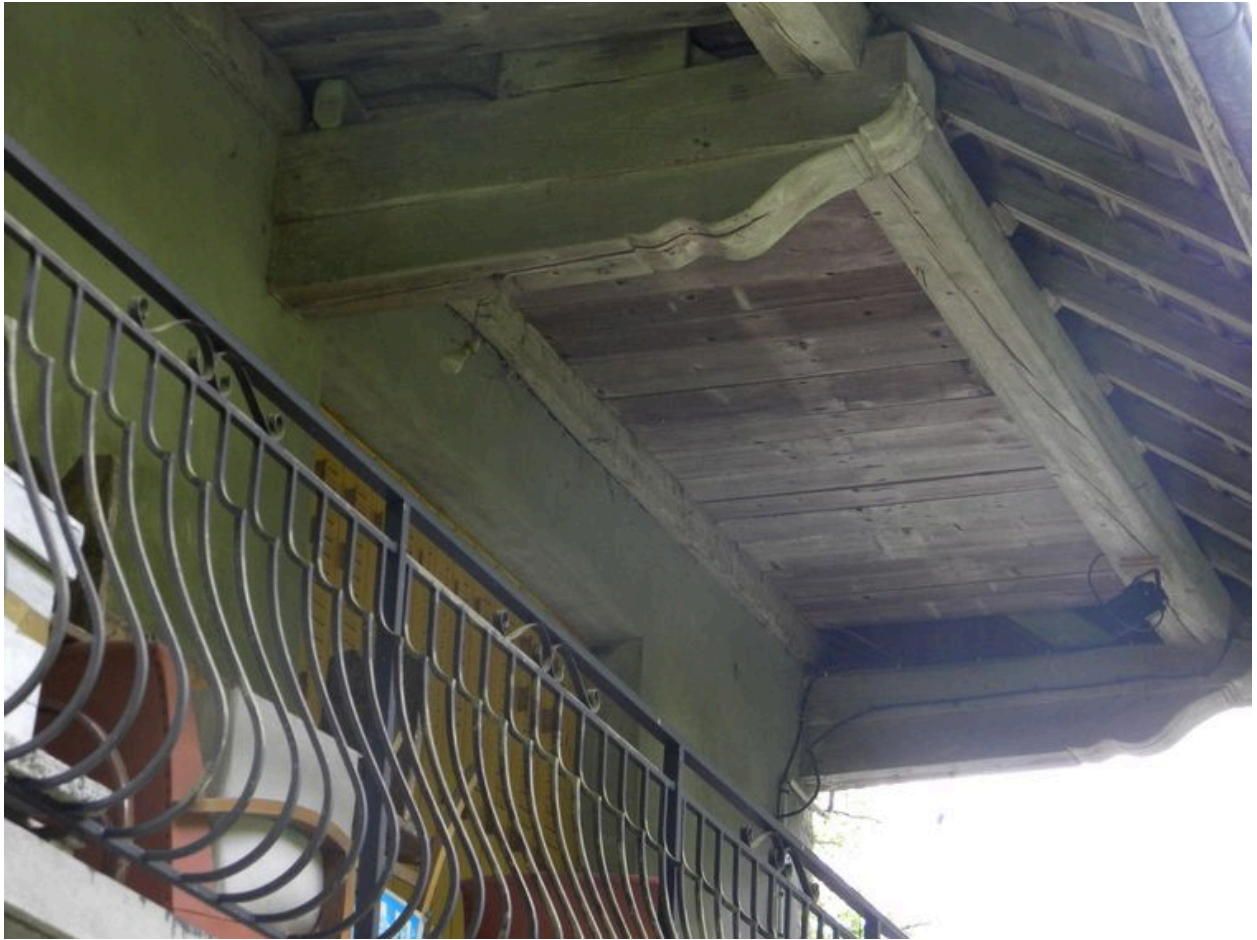
Détail des solives de charpente.