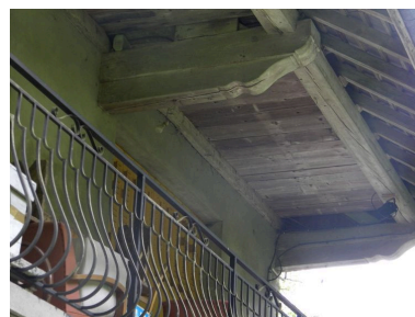
Détail des solives de charpente. IVR82_20117400503NUCA