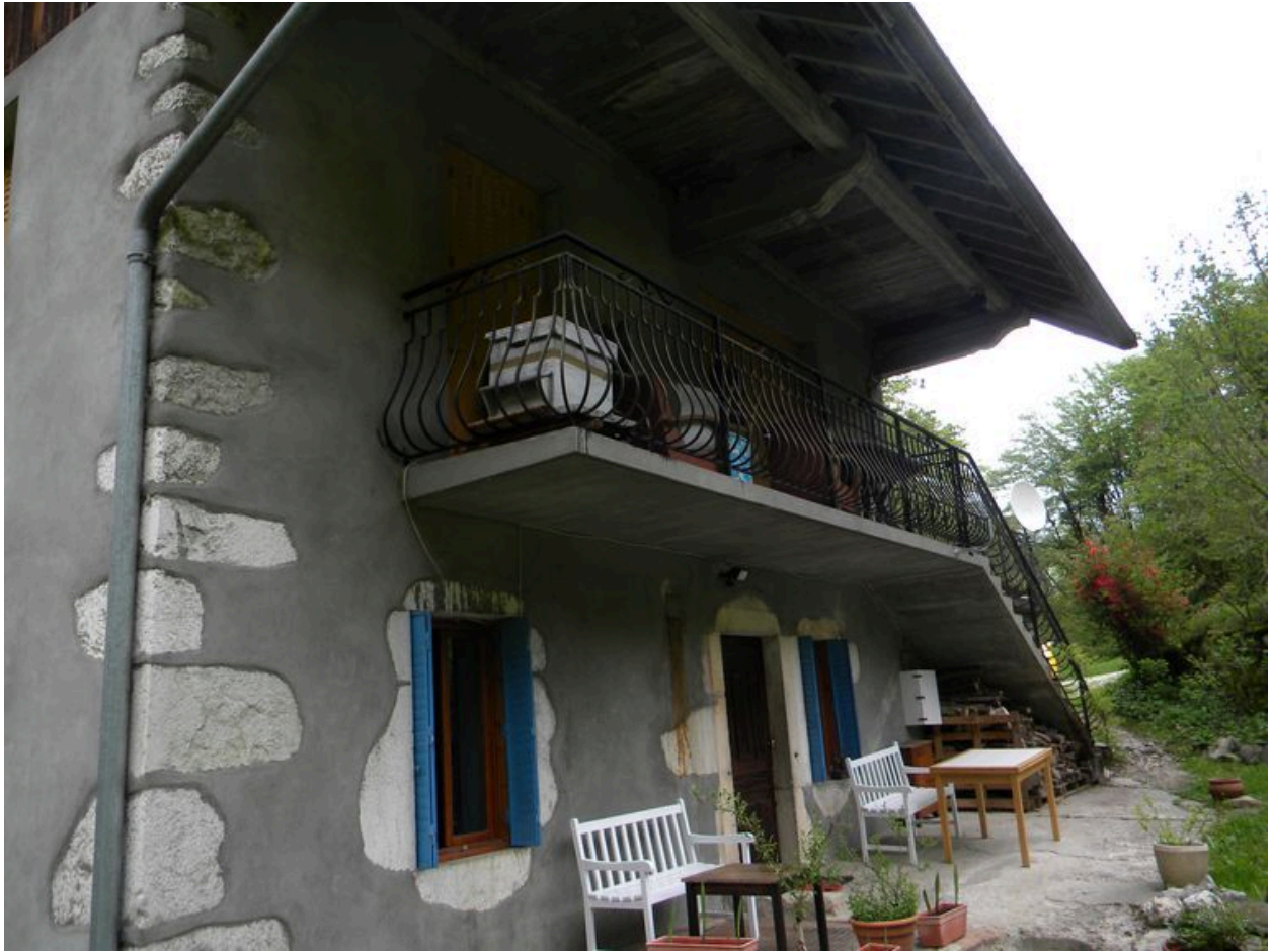
Vue générale de la façade principale du martinet.