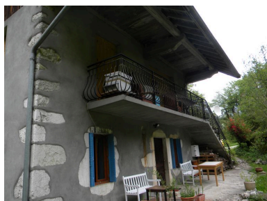
Vue générale de la façade principale du martinet.