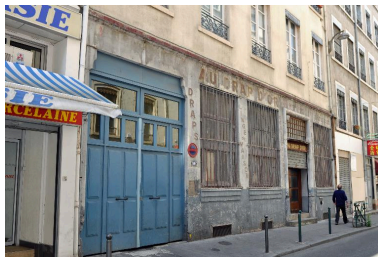
Élévation sur rue : vue rapprochée du rez-de-chaussée, ancienne enseigne "Au Drap d'or".