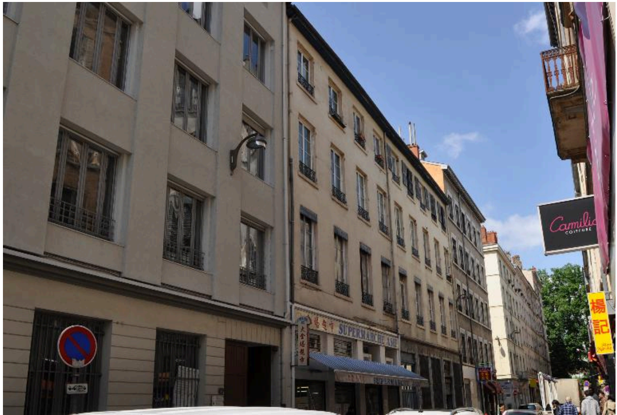
Vue d'ensemble, élévation sur rue