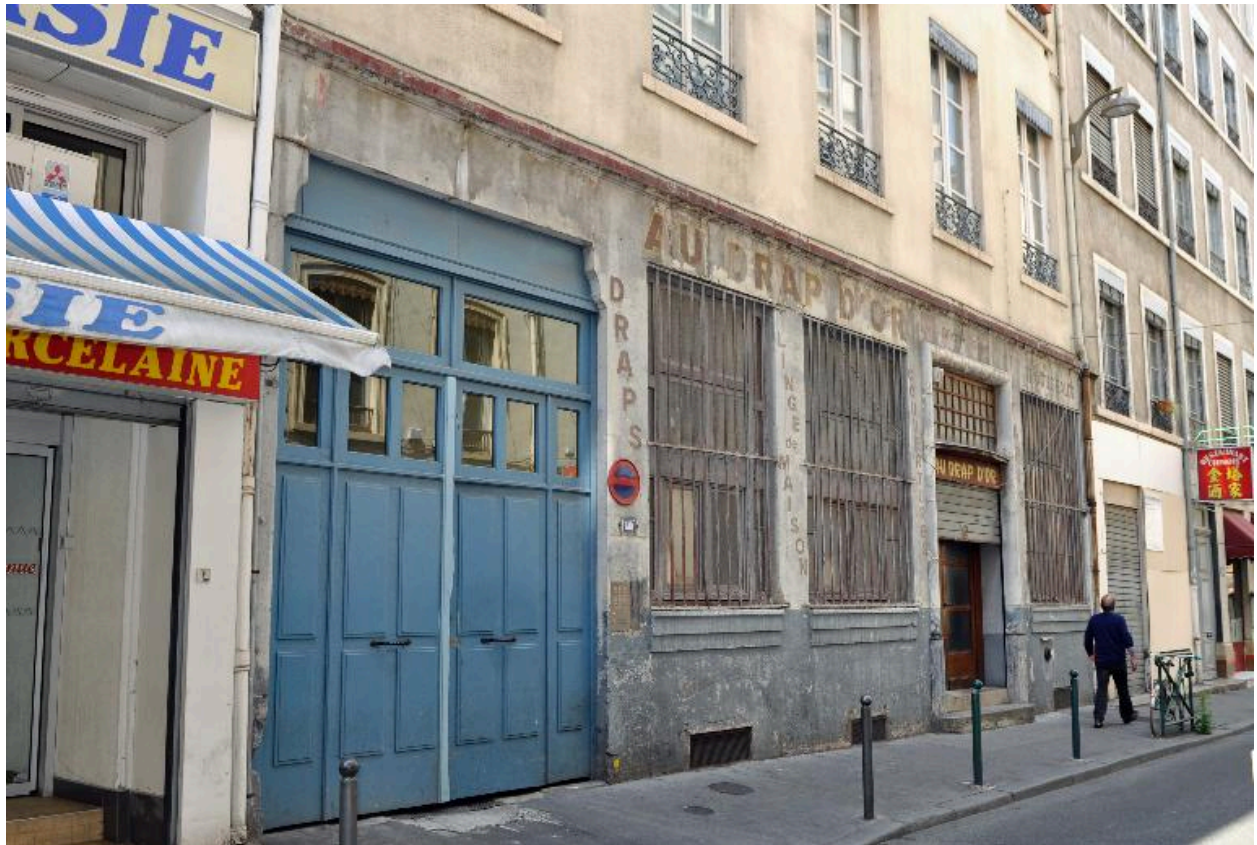
Elévation sur rue : vue rapprochée du rez-de-chaussée, ancienne enseigne "Au Drap d'or".