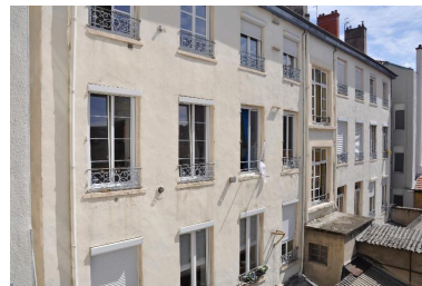
Vue générale, élévation sur cour IVR82_20156901089NUCA