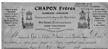
Papier à en-tête du plombier-zingueur (ornements pour l'architecture) CHAPON, situé 12 rue Passet (Archives de l'archidiocèse de Lyon, I 1212, 1918).