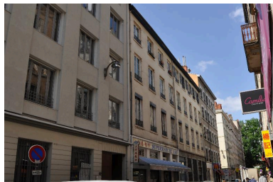
Vue d'ensemble, élévation sur rue IVR82_20156901087NUCA