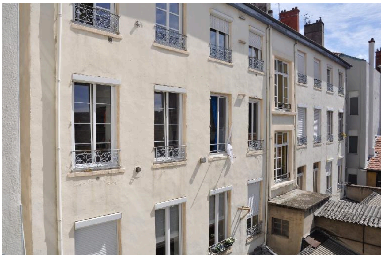
Vue générale, élévation sur cour