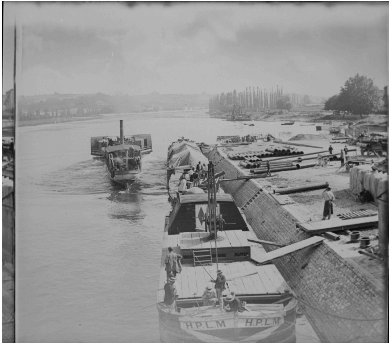
A Frans. Quai du port de Frans, vue depuis le pont (côté Villefranche). vers 1900, plaque de verre 9x9.