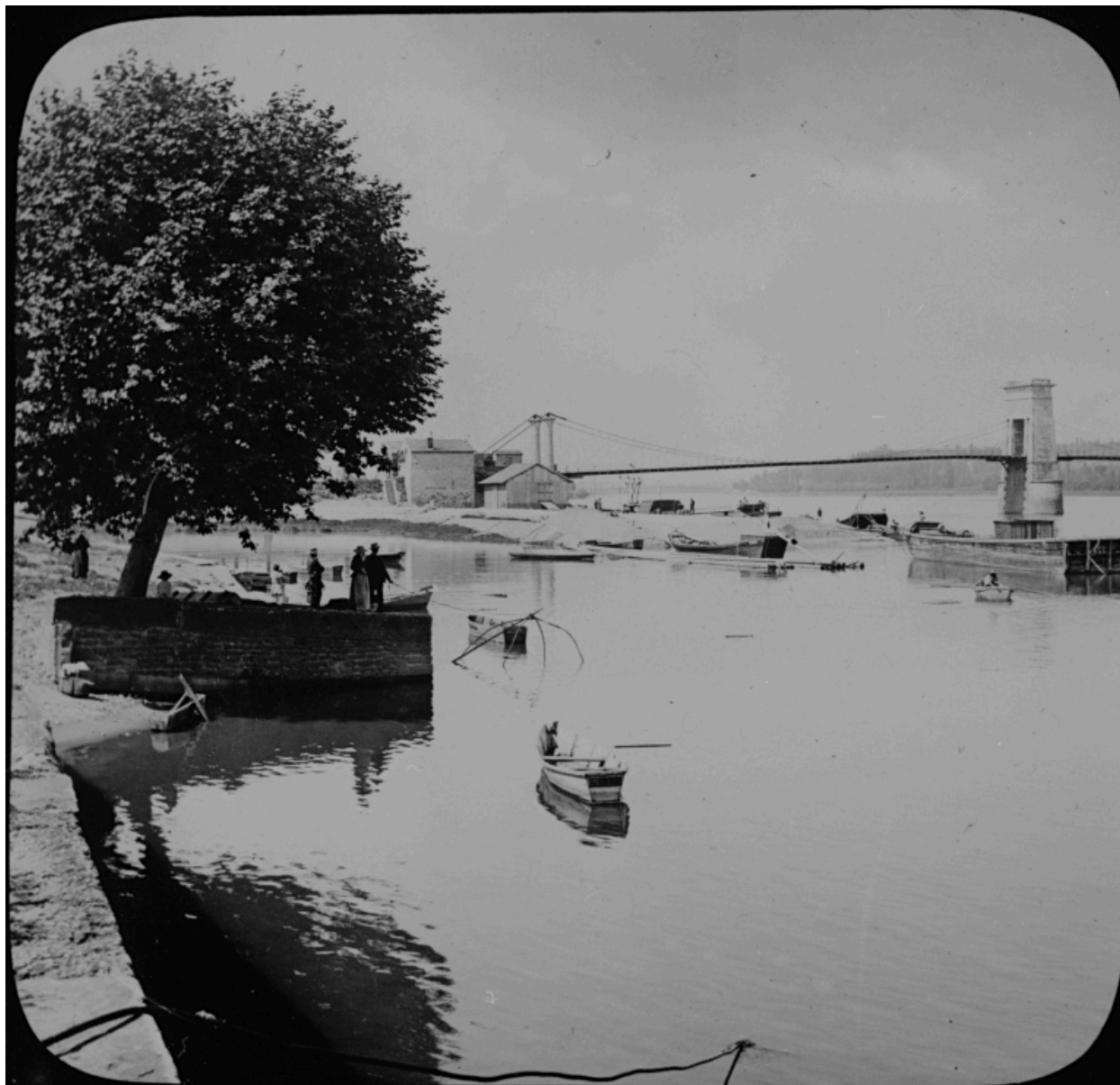
Frans : vue de l'ancien pont sur la Saône et du port depuis la rive gauche. Photogr. par [Berthier], avant 1900.