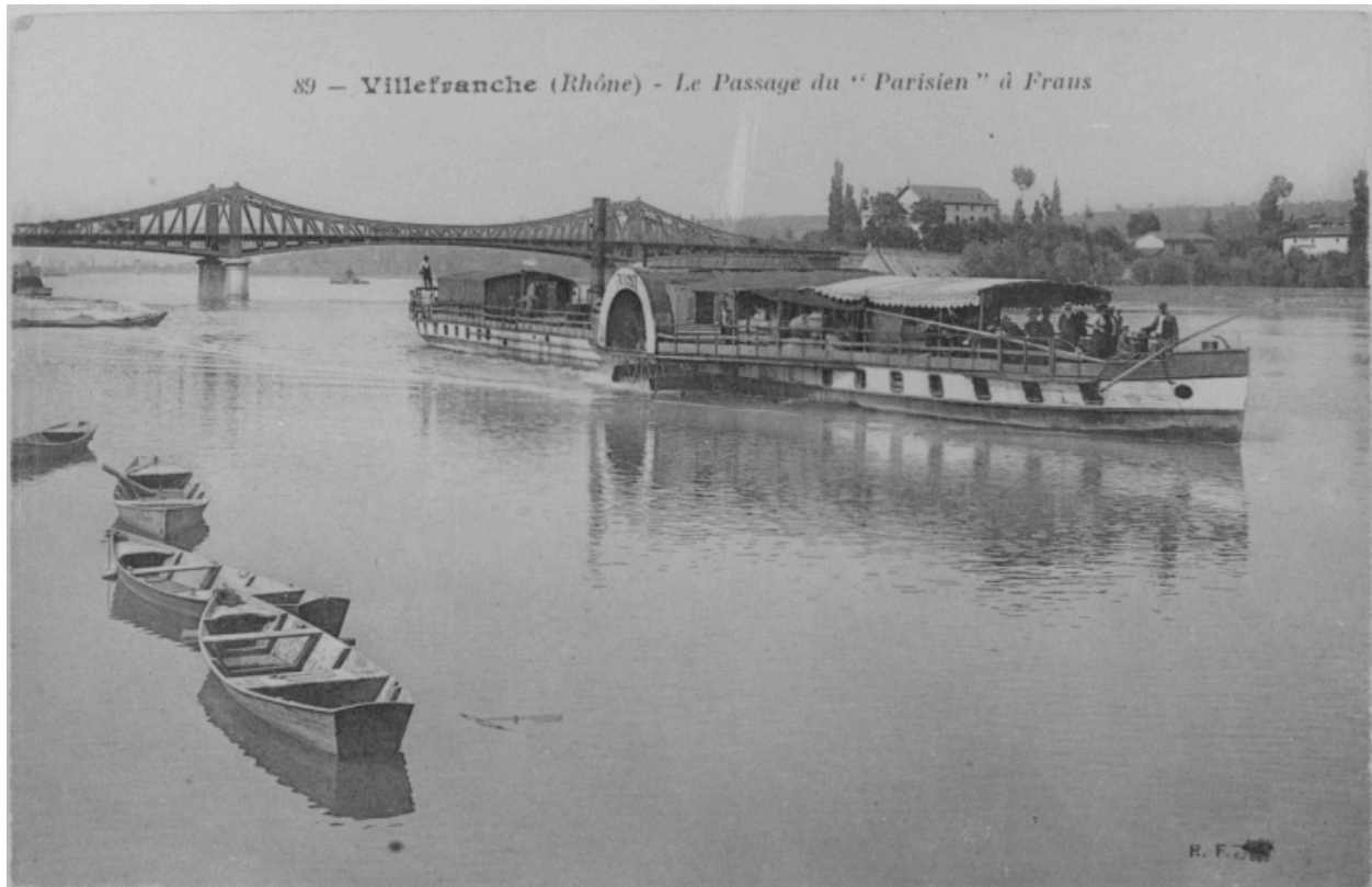
89 - Villefranche (Rhône) - Le passage du Parisien à Frans. Carte postale [1er quart XXe s.].