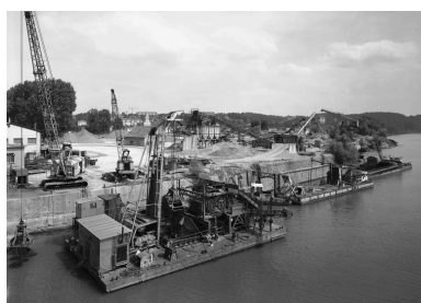
Le port actuel, dit port Gravier, vue prise du pont. IVR82_19920100782P