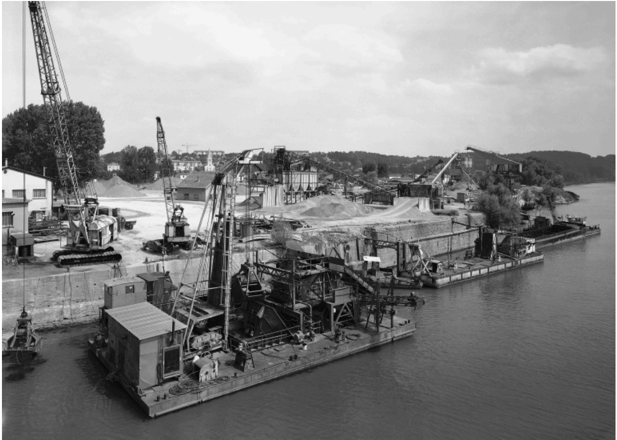
Le port actuel, dit port Gravier, vue prise du pont.