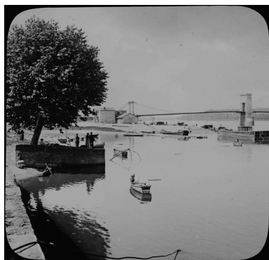
Frans : vue de l'ancien pont sur la Saône et du port depuis la rive gauche.