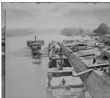
A Frans. Quai du port de Frans, vue depuis le pont (côté Villefranche).