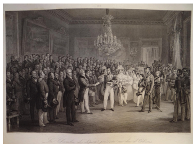
Vue générale 2014-6 IVR84_20216301011NUCA