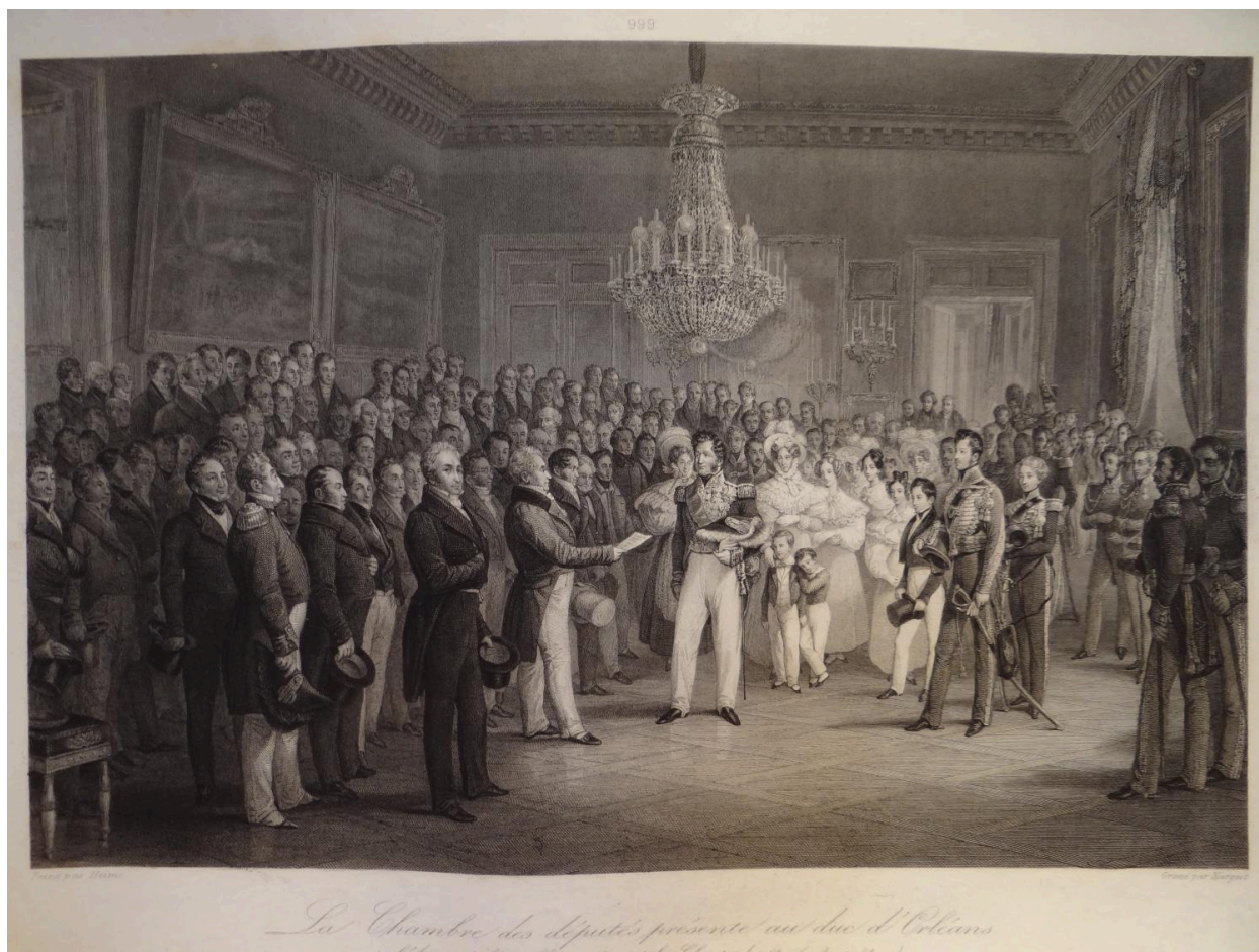
Vue générale DR 2014-6