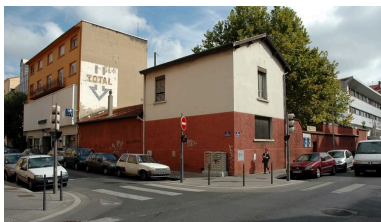
Vue de situation IVR82_20076903116NUCA