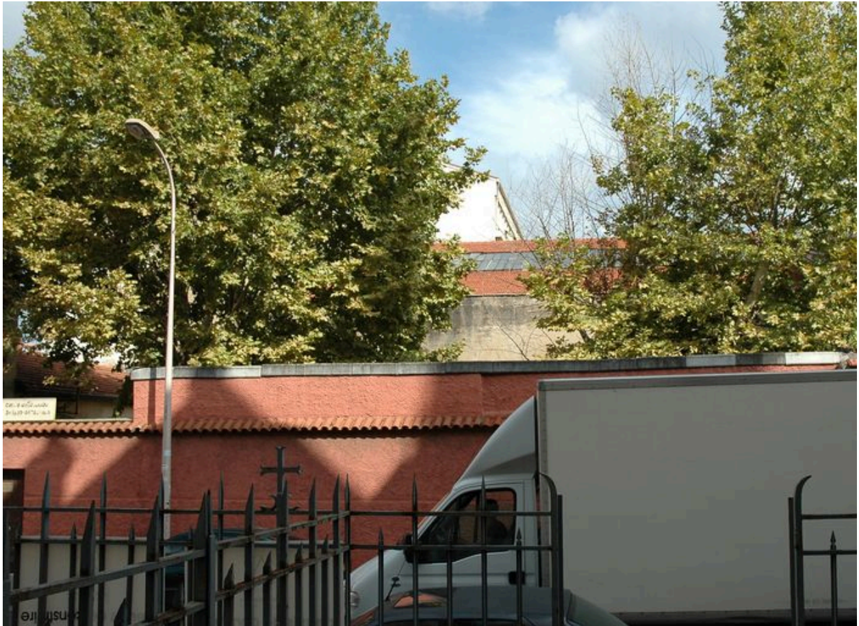
Vue des ateliers depuis la rue de la Viabert