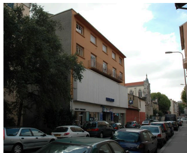
Vue générale IVR82_20076903117NUCA