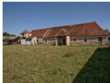
Vue générale de la façade méridionale de la grange.