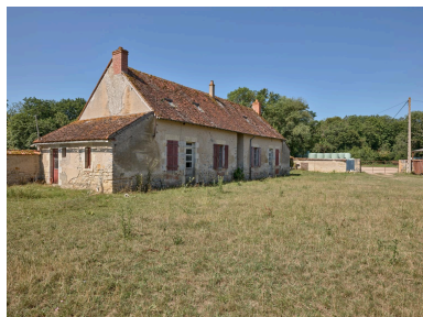
Vue du logis du nord-est IVR84_20230300272NUC4A