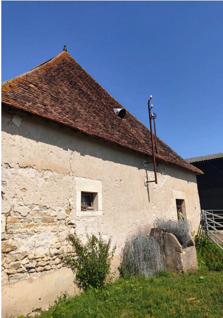
Vue du pignon oriental de la grange.