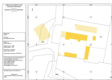
Extrait du plan cadastral, daté 2017, tel qu'en ligne en 2023. IVR84_20230300325NUDA