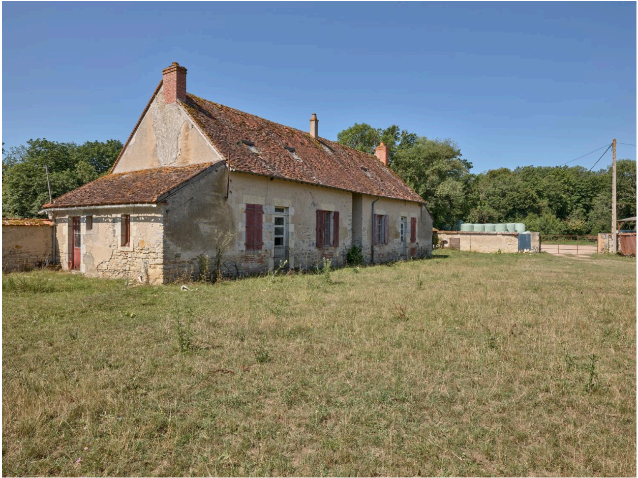
Vue du logis du nord-est