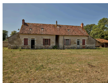
Vue de la façade du logis. IVR84_20230300275NUC4A