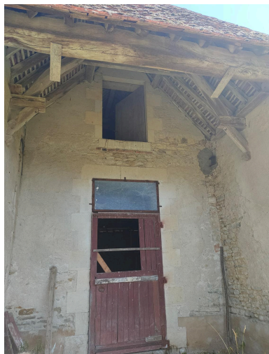
Vue de la sablière portant l'inscription sous la toiture en croupe du auvent central.