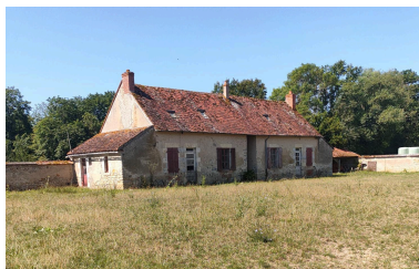
Vue du logis du nord est IVR84_20230300455NUC4A