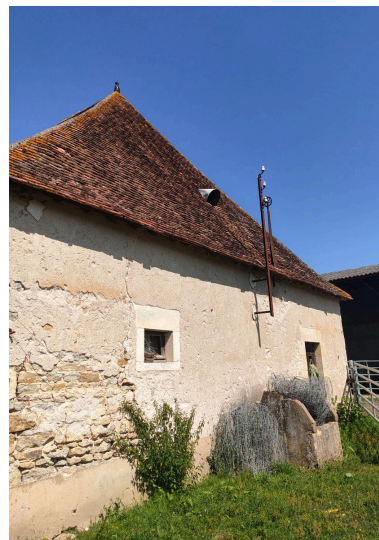
Vue du pignon oriental de la grange.