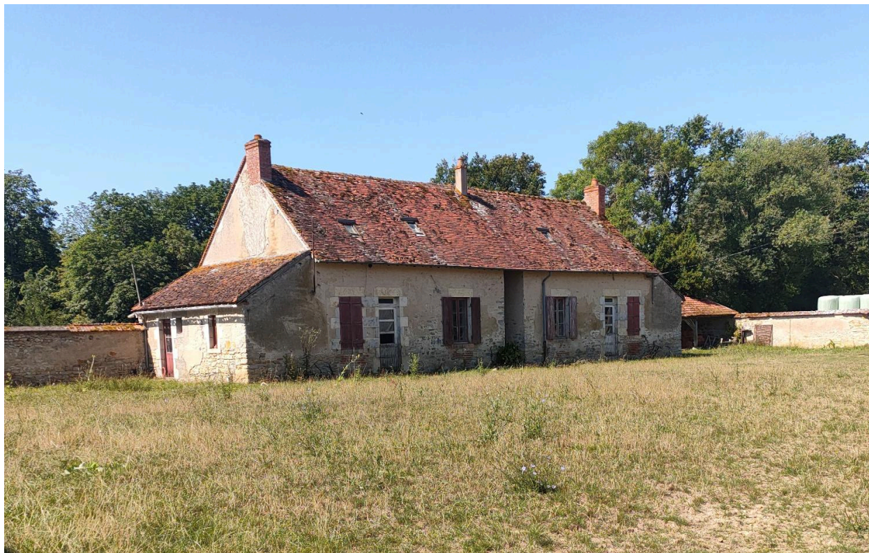
Vue du logis du nord est