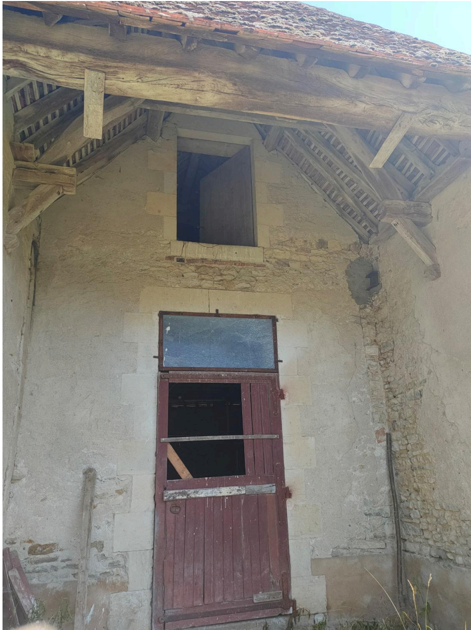
Vue de la sablière portant l'inscription sous la toiture en croupe du auvent central.