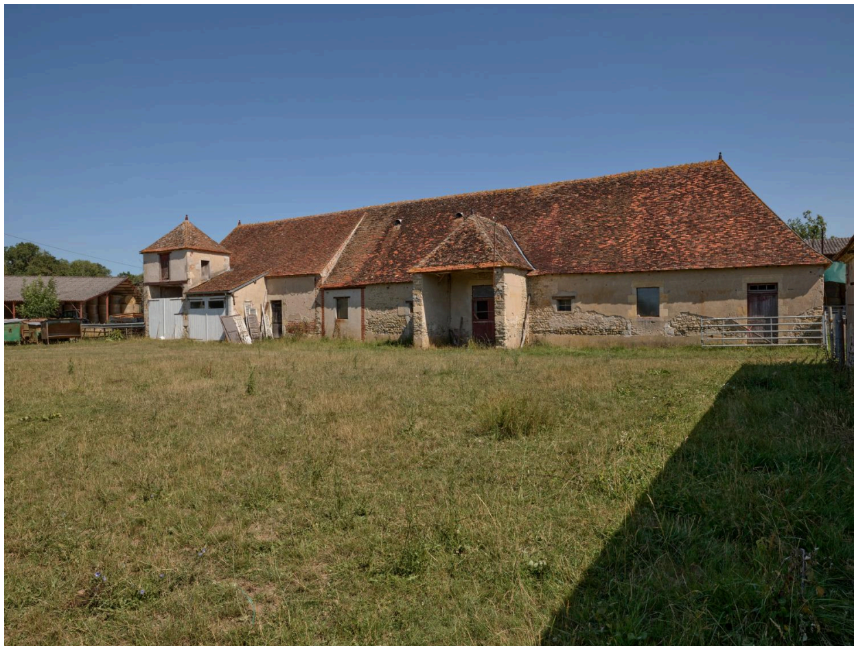
Vue générale de la façade méridionale de la grange.