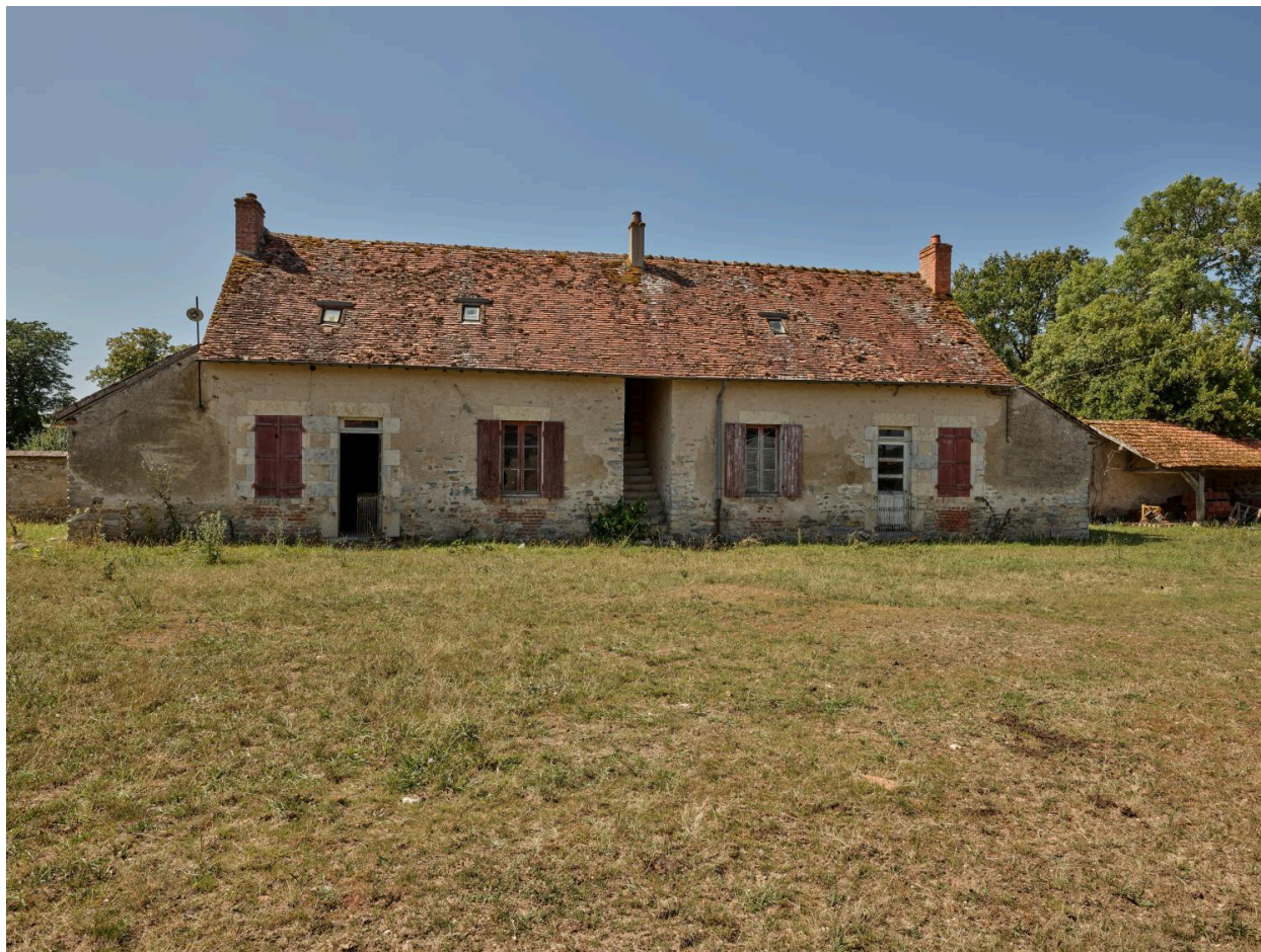
Vue de la façade du logis.