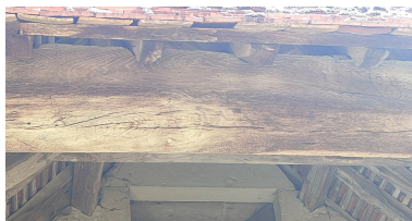
Détail de l'inscription gravée : 18 [motif] 08.