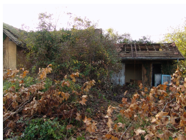
Aile en retour