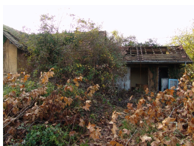
Aile en retour IVR82_20077300688NUCA