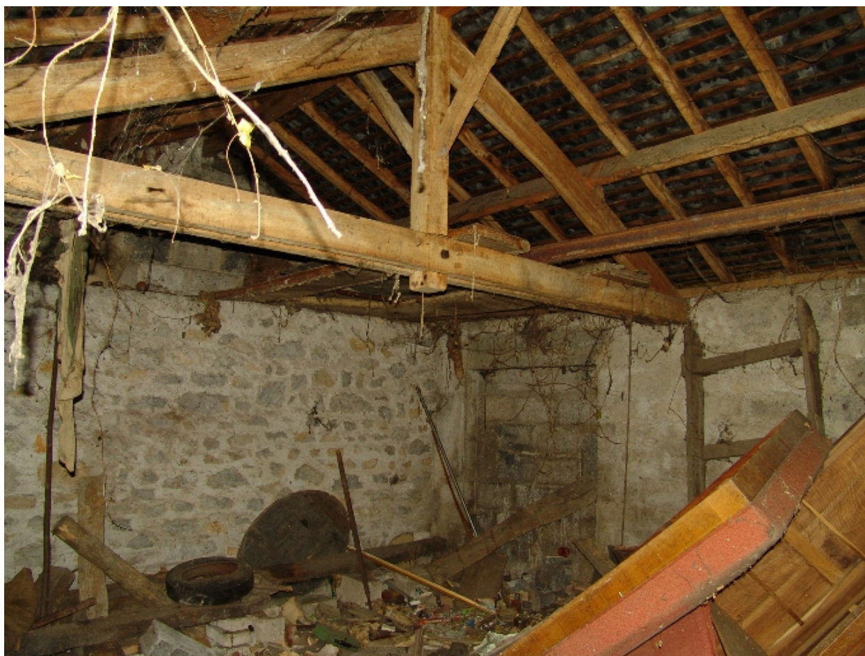
Intérieur du 1er garage à bateau