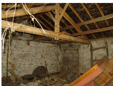
Intérieur du 1er garage à bateau IVR82_20077300690NUCA