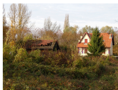
Vue dans le site IVR82_20077300683NUCA