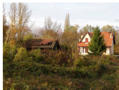
Vue dans le site IVR82_20077300683NUCA