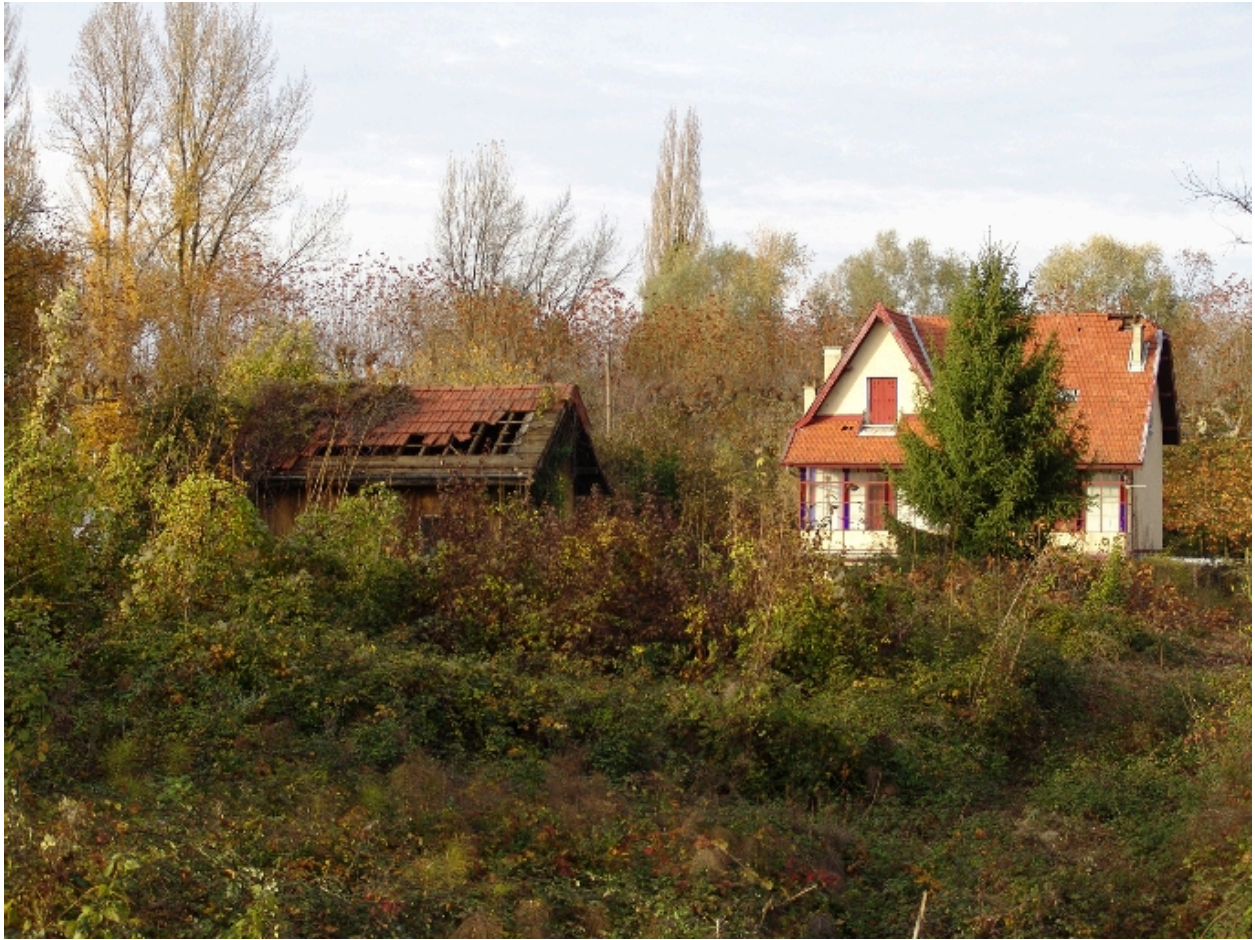
Vue dans le site