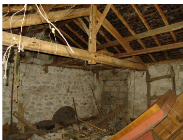
Intérieur du 1er garage à bateau IVR82_20077300690NUCA