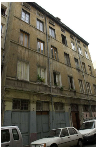
Vue générale IVR82_20026902817NUCA