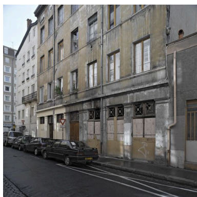
Détail du rez-de-chaussée (boutiques délimitées par des piliers monolithes). Etat en 2005