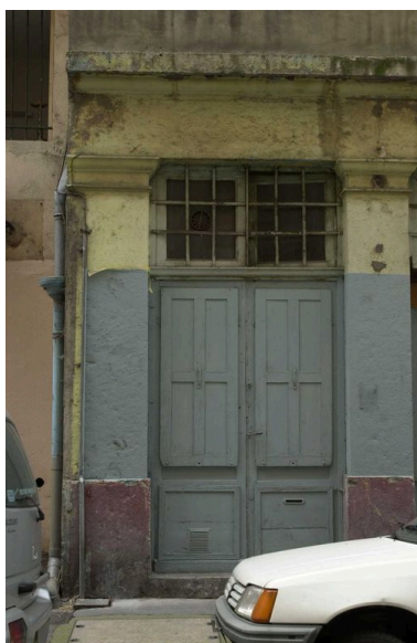
Détail d'une des devantures de boutique en bois IVR82_20026902819NUCA