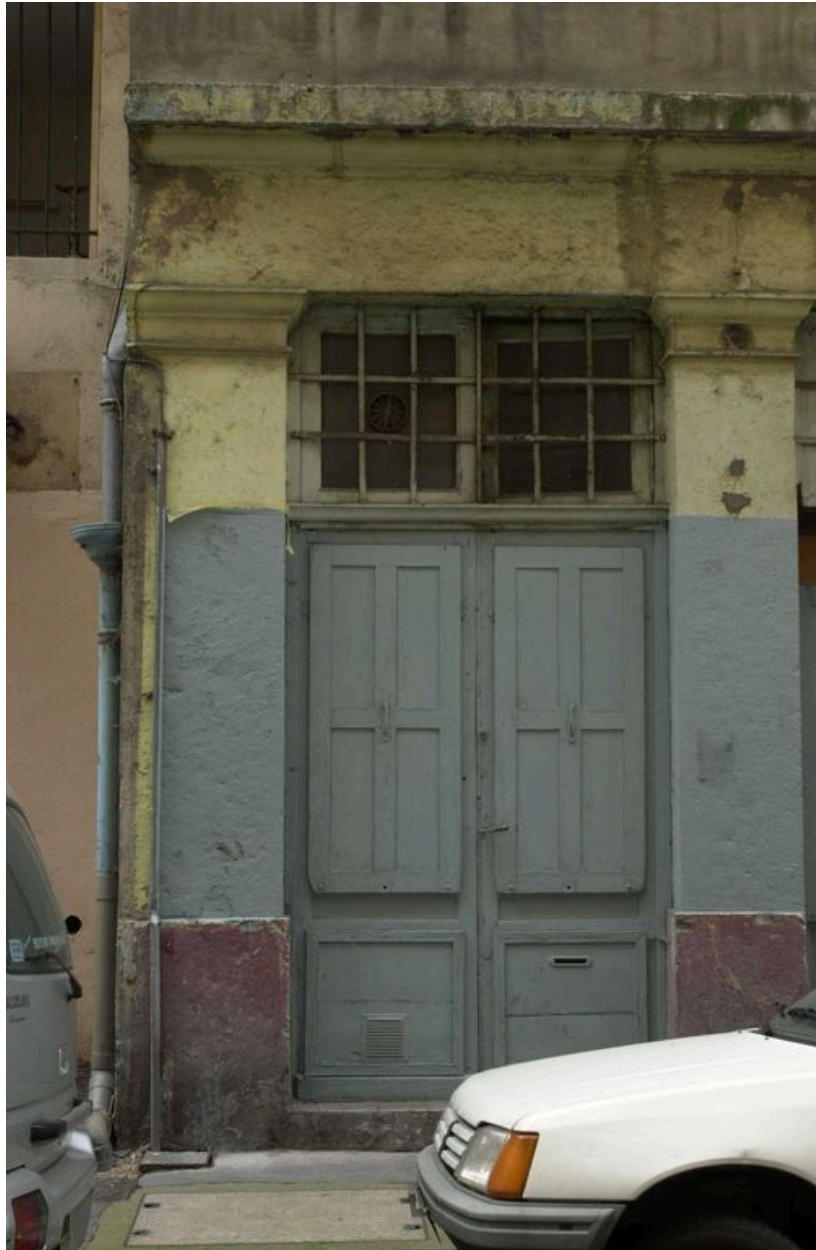
Détail d'une des devantures de boutique en bois