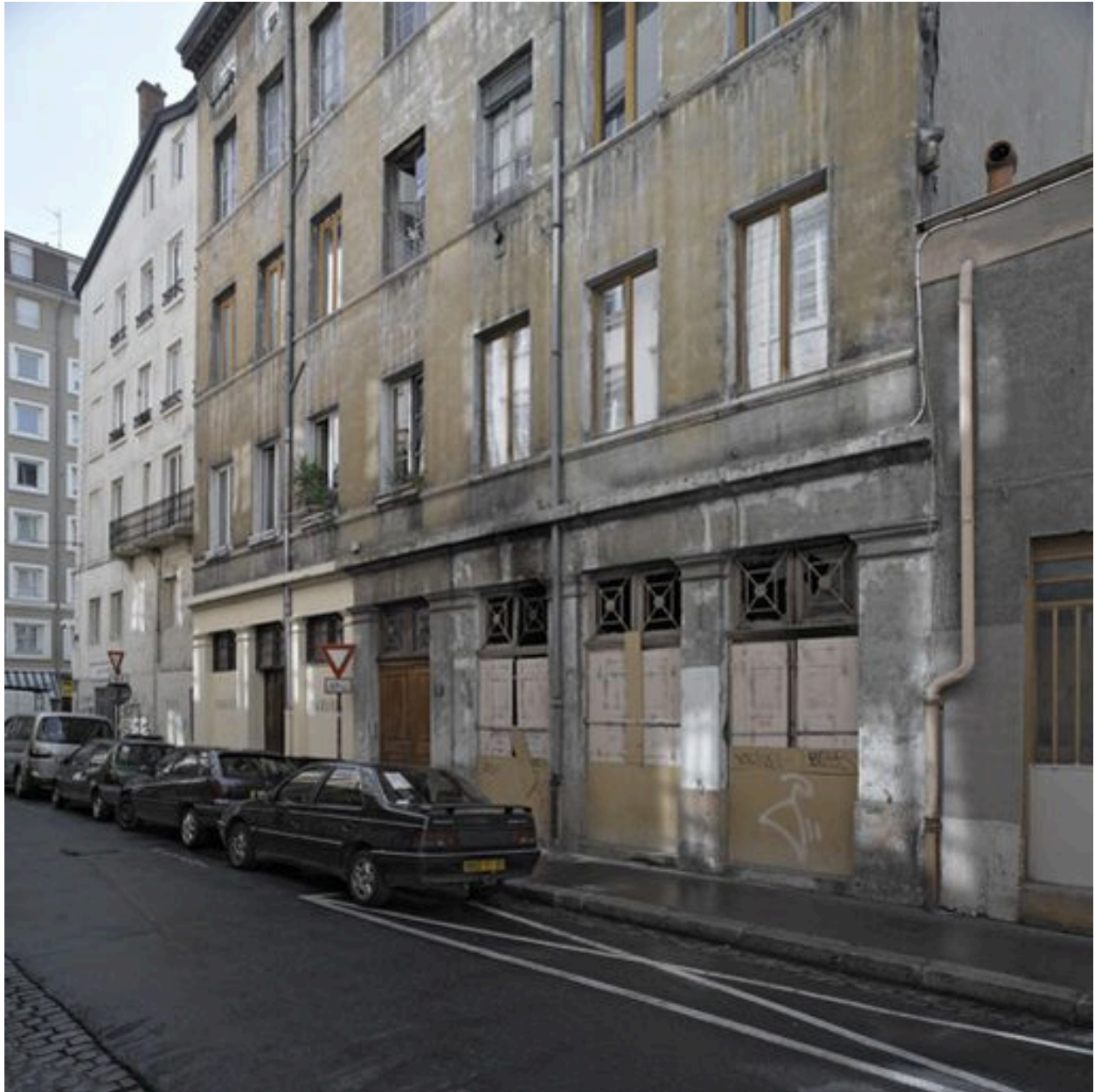
Détail du rez-de-chaussée (boutiques délimitées par des piliers monolithes). Etat en 2005