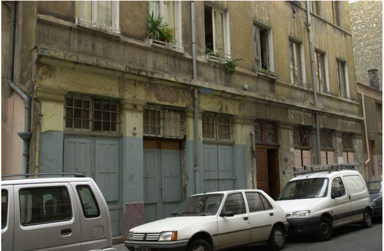
Détail du rez-de-chaussée (boutiques délimitées par des piliers monolithes). Etat en 2002