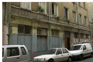
Détail du rez-de-chaussée (boutiques délimitées par des piliers monolithes). Etat en 2002 IVR82_20026902818NUCA