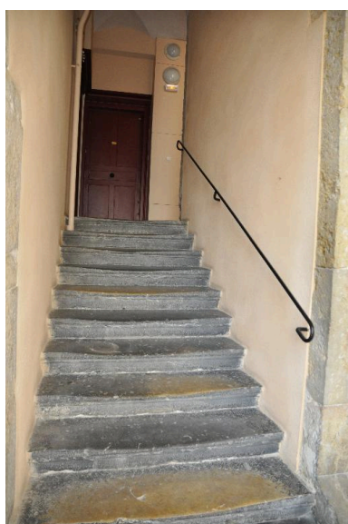
Vue de l'escalier IVR82_20146900448NUCA