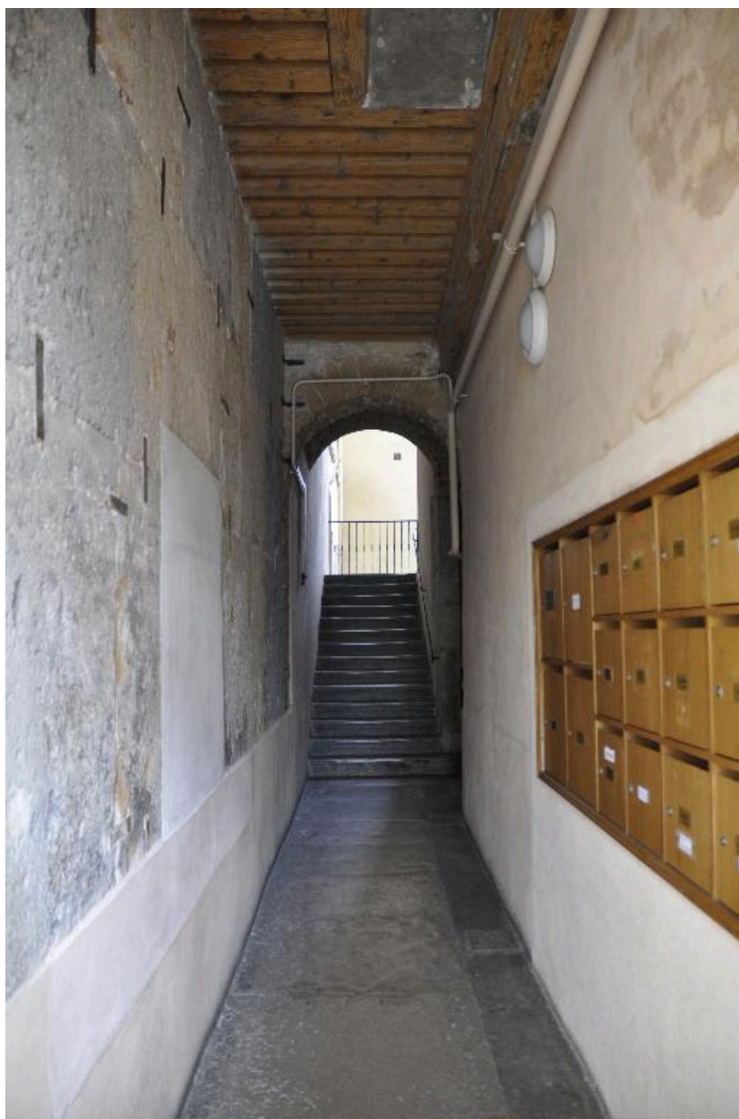
Vue de l'allée