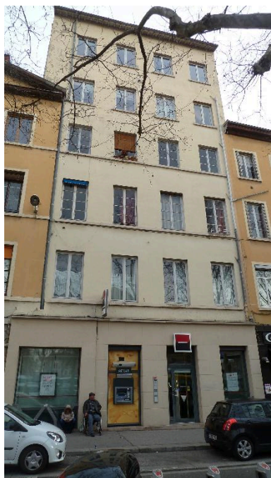
Elévation extérieure de l'immeuble IVR82_20146900444NUCA