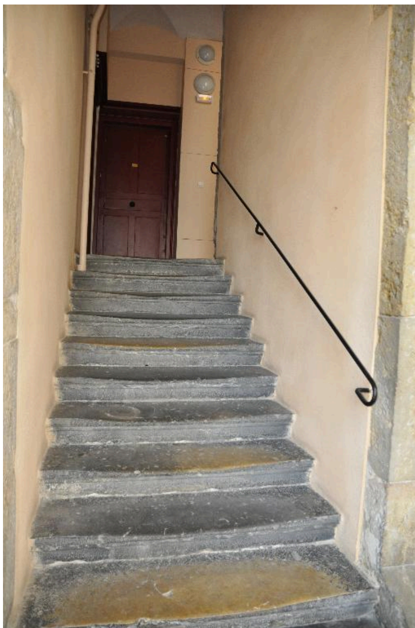
Vue de l'escalier