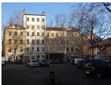
Vue d'ensemble sud de la série des trois immeubles IVR82_20146900299NUCA