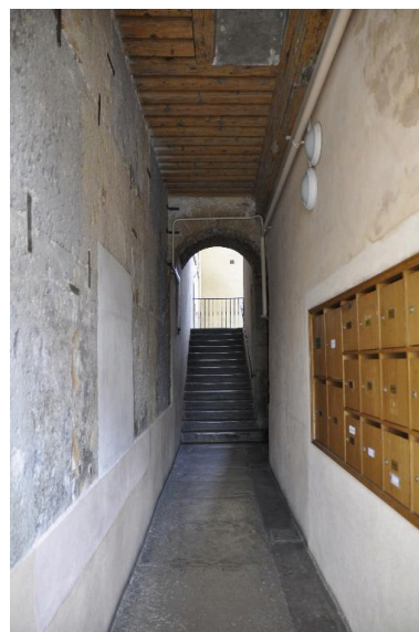
Vue de l'allée IVR82_20146900445NUCA