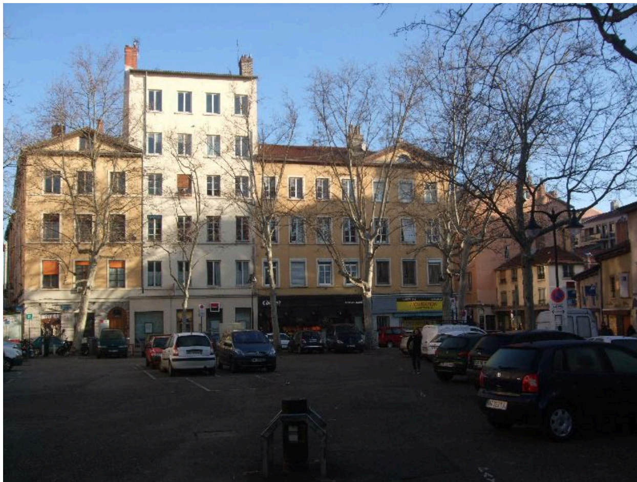
Vue d'ensemble sud de la série des trois immeubles