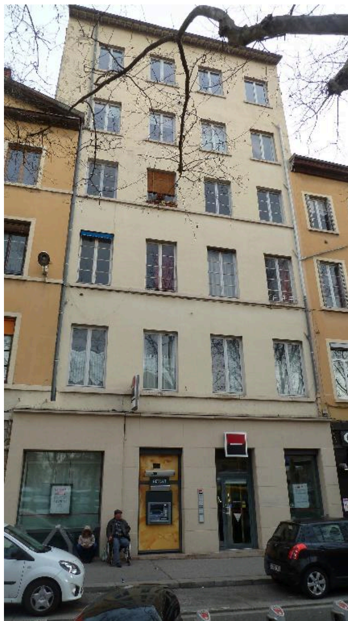
Elévation extérieure de l'immeuble