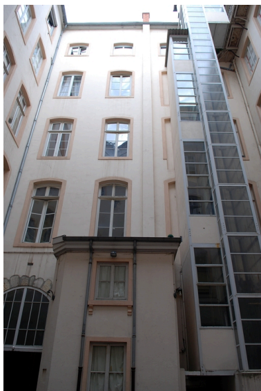
La cour : élévation ouest IVR82_20096904874NUCA