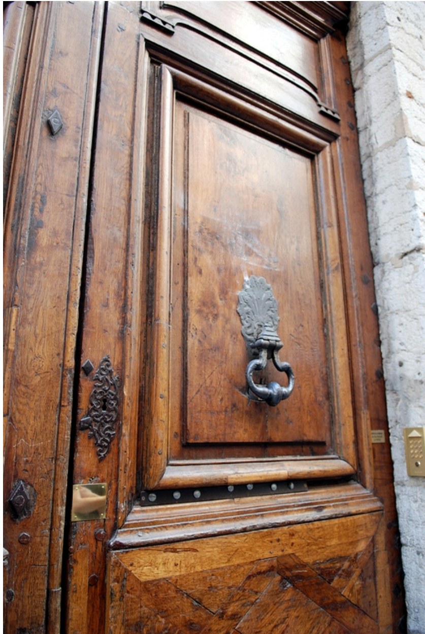
Elévation rue Emile-Zola : détail de la porte cochère