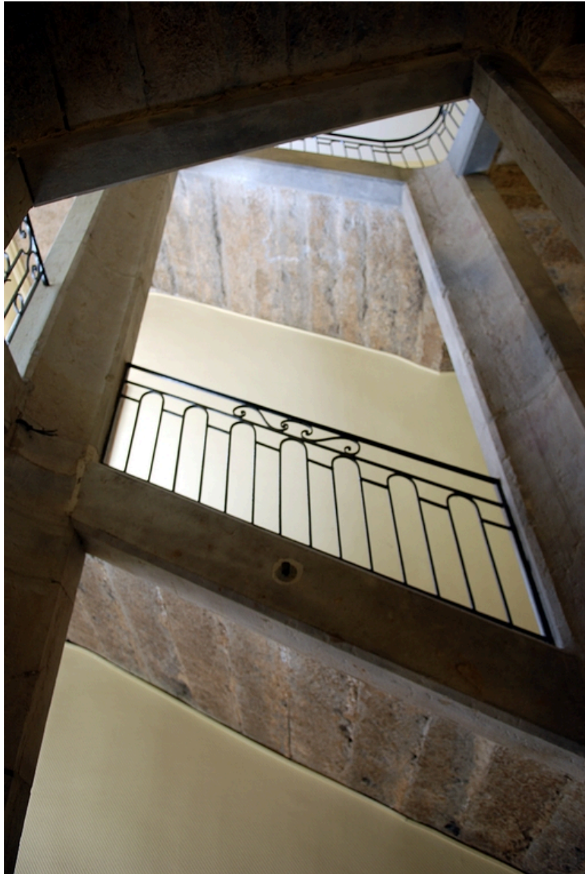
Escalier : détail