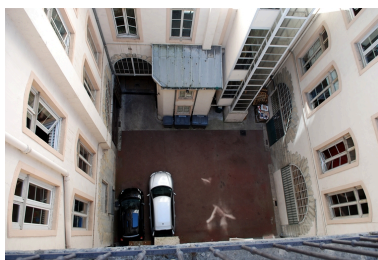
La cour : vue en plongée IVR82_20096904856NUCA