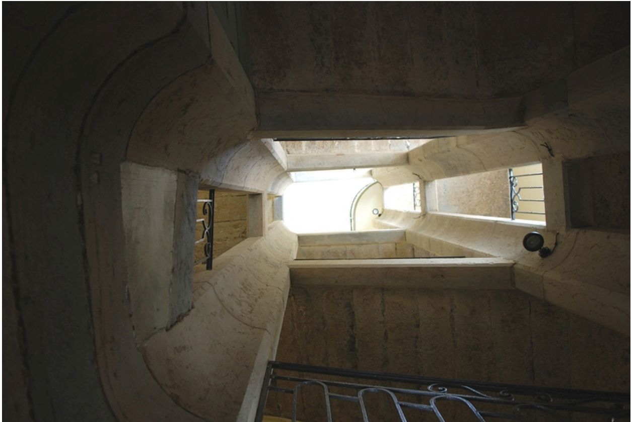
Escalier : le jour en contre-plongée