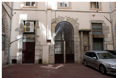
La cour : élévation est, le rez-de-chaussée IVR82_20096904858NUCA