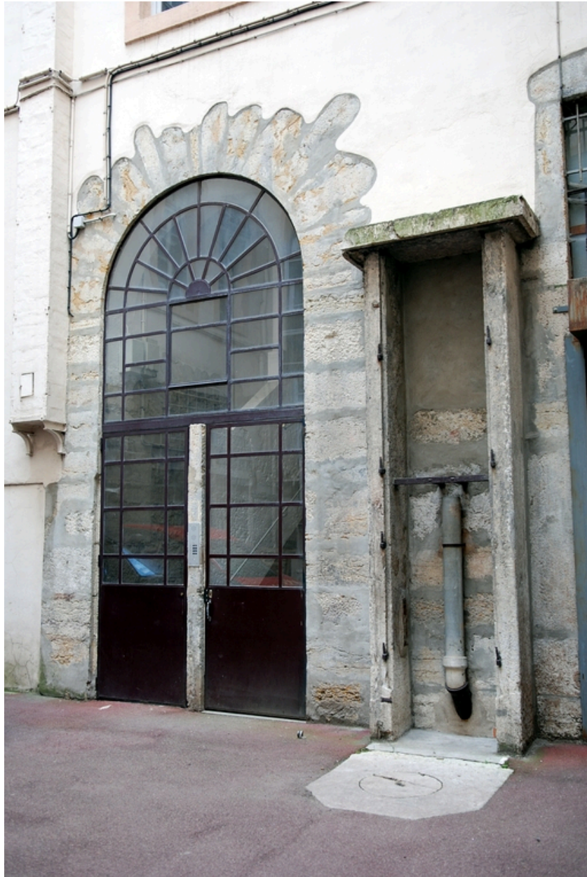
La cour : élévation est, le puits