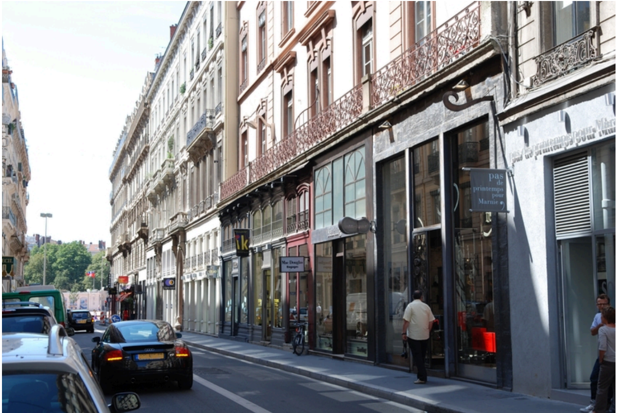
Elévation rue Gasparin : le rez-de-chaussée vers la place Bellecour