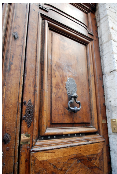
Elévation rue Emile-Zola : détail de la porte cochère IVR82_20096904855NUCA