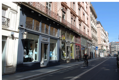
Elévation rue Gasparin : le rez-de-chaussée vers la place des Jacobins IVR82_20096904852NUCA