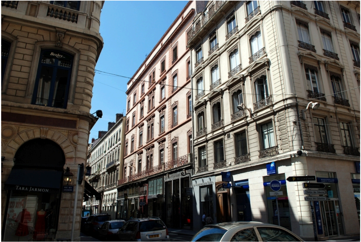
Vue de situation rue Gasparin