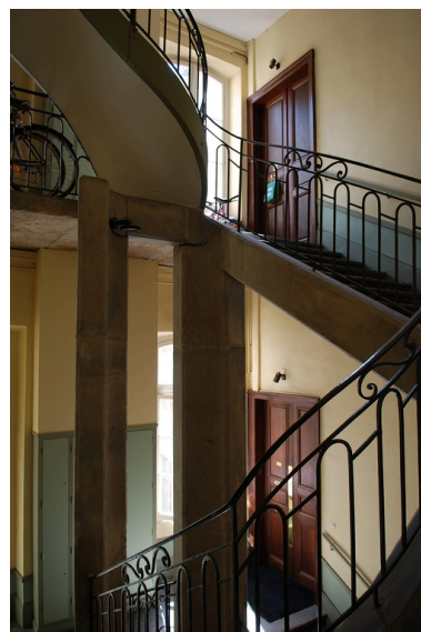
Escalier : détail