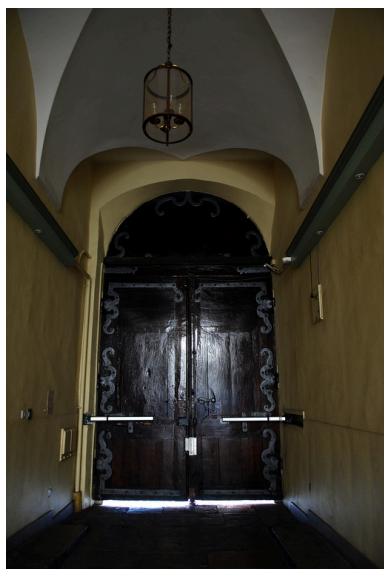
Revers de la porte cochère