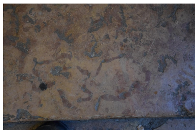
Détail : terriers fossiles