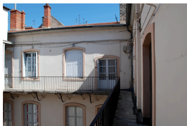
La cour : élévation nord, la coursière au dernier étage IVR82_20096904860NUCA