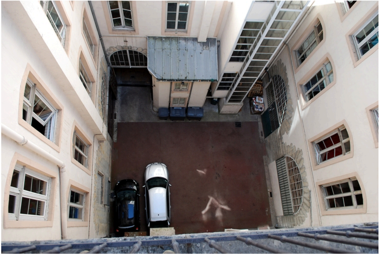
La cour : vue en plongée