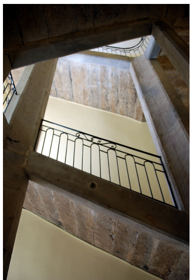
Escalier : détail IVR82_20096904866NUCA