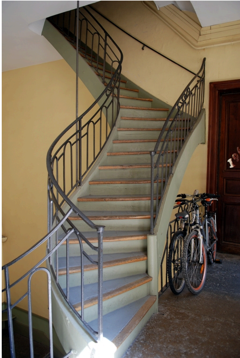
Escalier : volée des étages surélevés