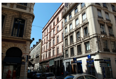
Vue de situation rue Gasparin IVR82_20096904850NUCA