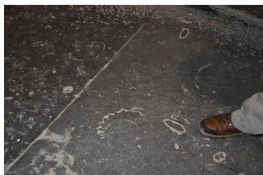
Détail de fossile : ammonite crénelée