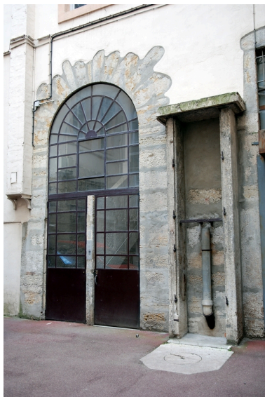
La cour : élévation est, le puits IVR82_20096904873NUCA