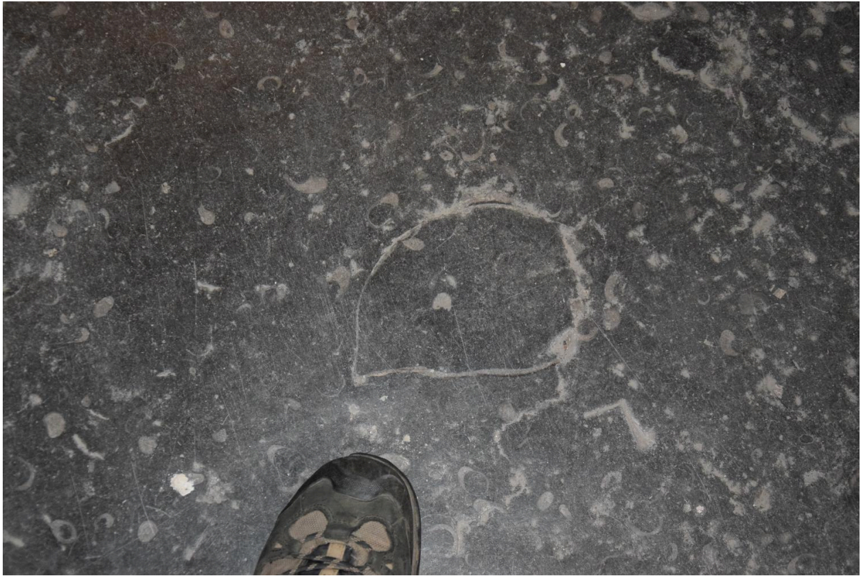
Détail de fossile : grand coquillage bivalve (plagiostoma)