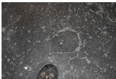
Détail de fossile : grand coquillage bivalve (plagiostoma)