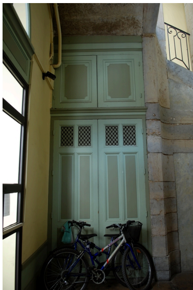
Escalier : boiseries au rez-de-chaussée IVR82_20096904864NUCA