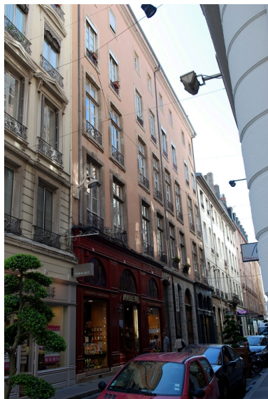
Elévation rue Emile-Zola IVR82_20096904847NUCA