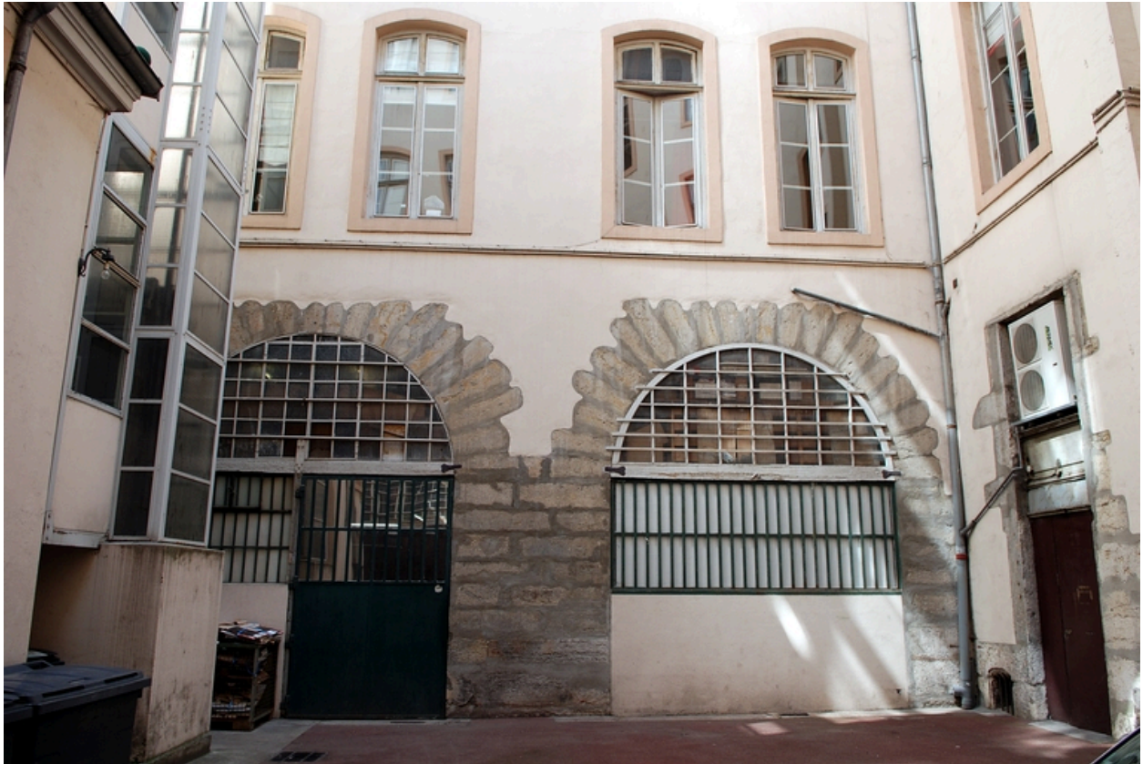
La cour : élévation nord, les premiers niveaux