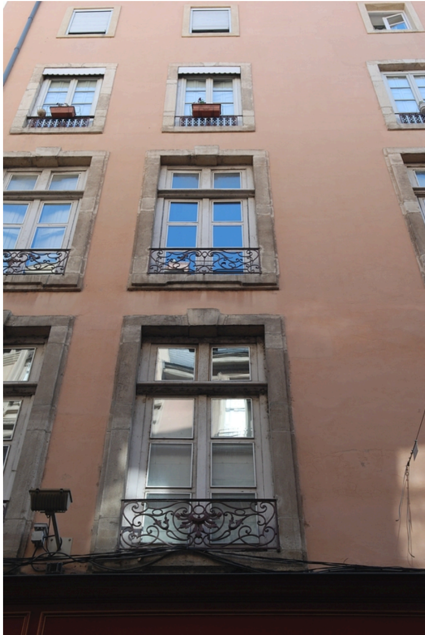
Elévation rue Emile-Zola : vue partielle