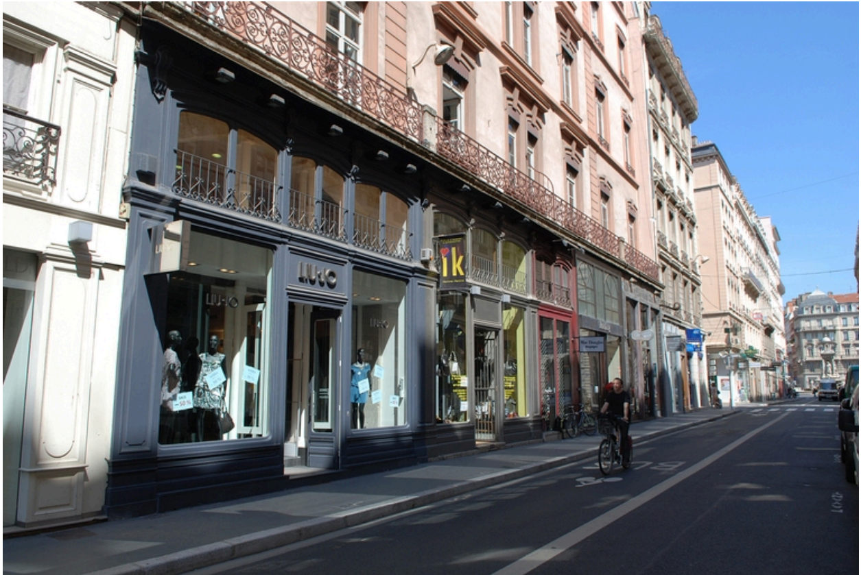
Elévation rue Gasparin : le rez-de-chaussée vers la place des Jacobins