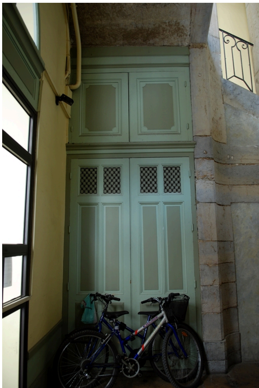
Escalier : boiseries au rez-de-chaussée