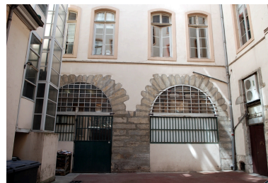
La cour : élévation nord, les premiers niveaux IVR82_20096904859NUCA