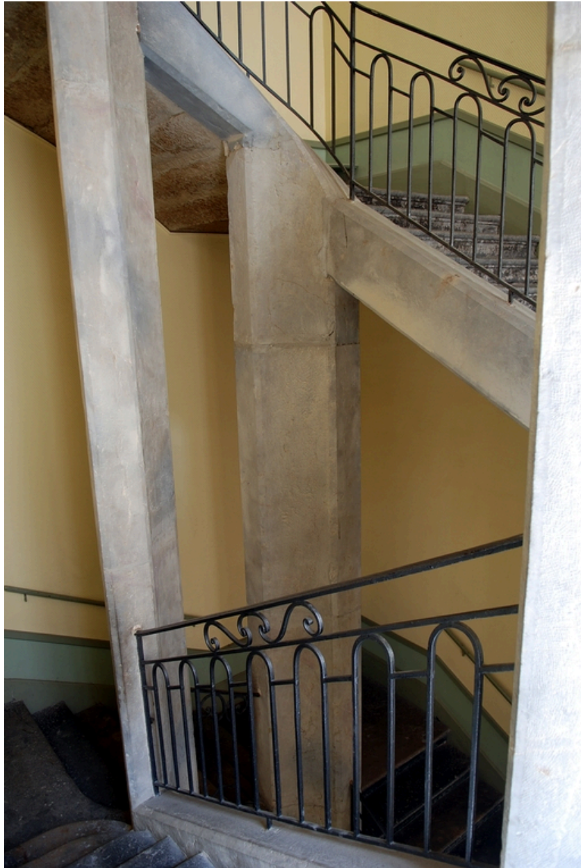
Escalier : détail