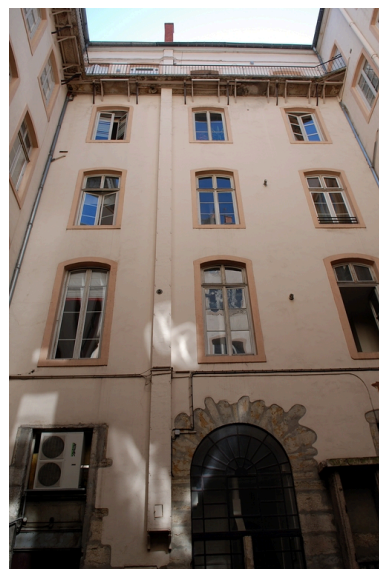
La cour : élévation est