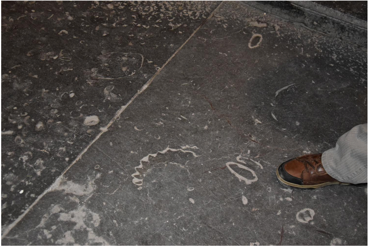
Détail de fossile : ammonite crénelée