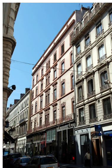
Elévation rue Gasparin IVR82_20096904851NUCA