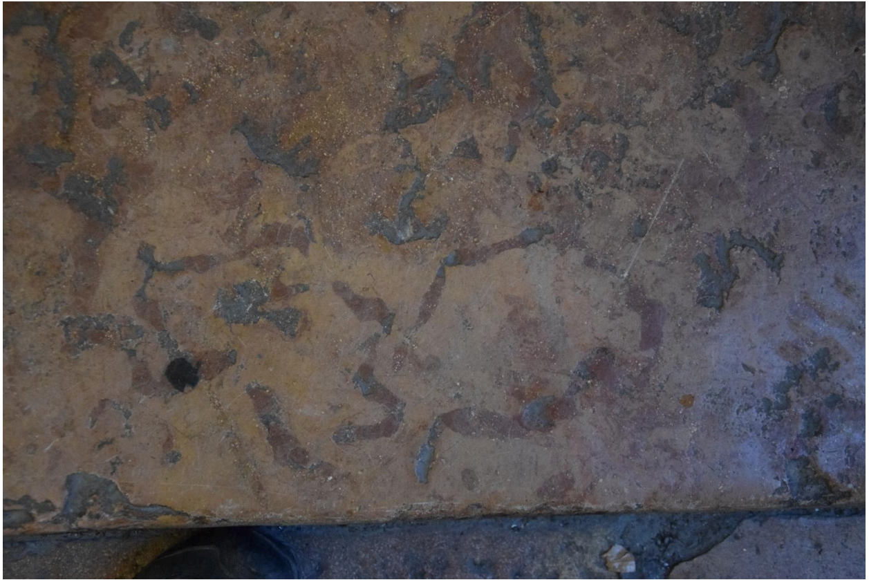
Détail : terriers fossiles