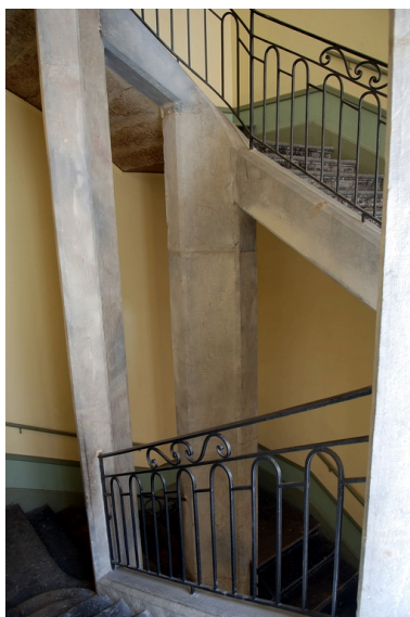
Escalier : détail