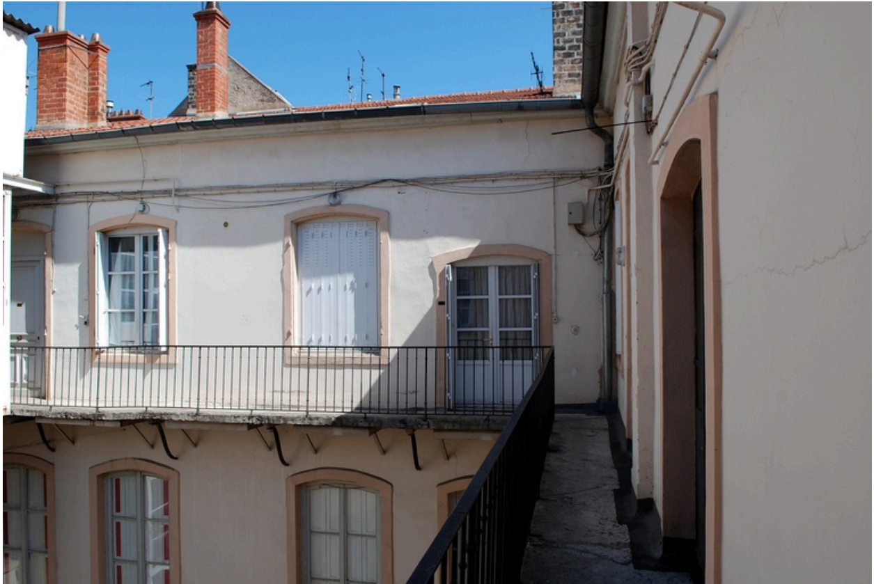
La cour : élévation nord, la coursière au dernier étage