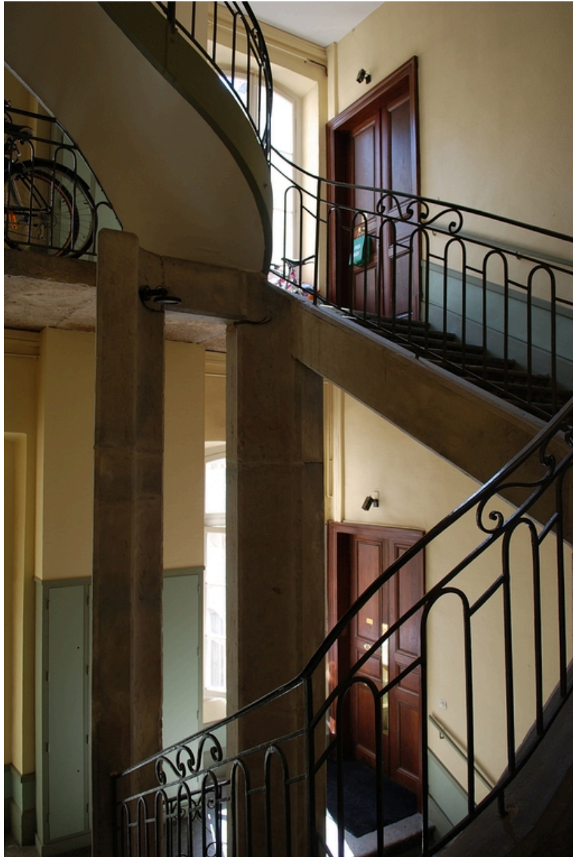
Escalier : détail