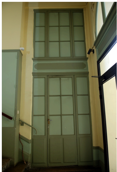
Entrée de la loge de concierge depuis la cage d'escalier IVR82_20096904863NUCA