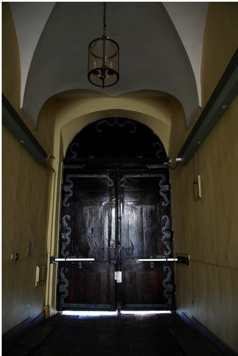
Revers de la porte cochère