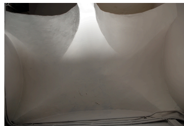
Escalier de service : couverture, berceau en plein cintre à lunettes