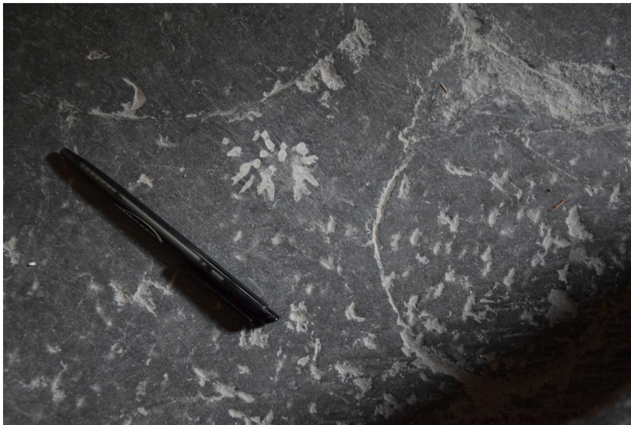
Détail de fossiles : petite colonie de bryozoaires