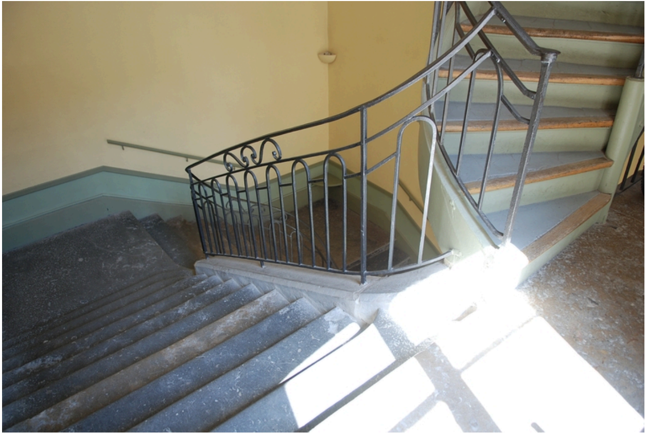
Escalier : détail