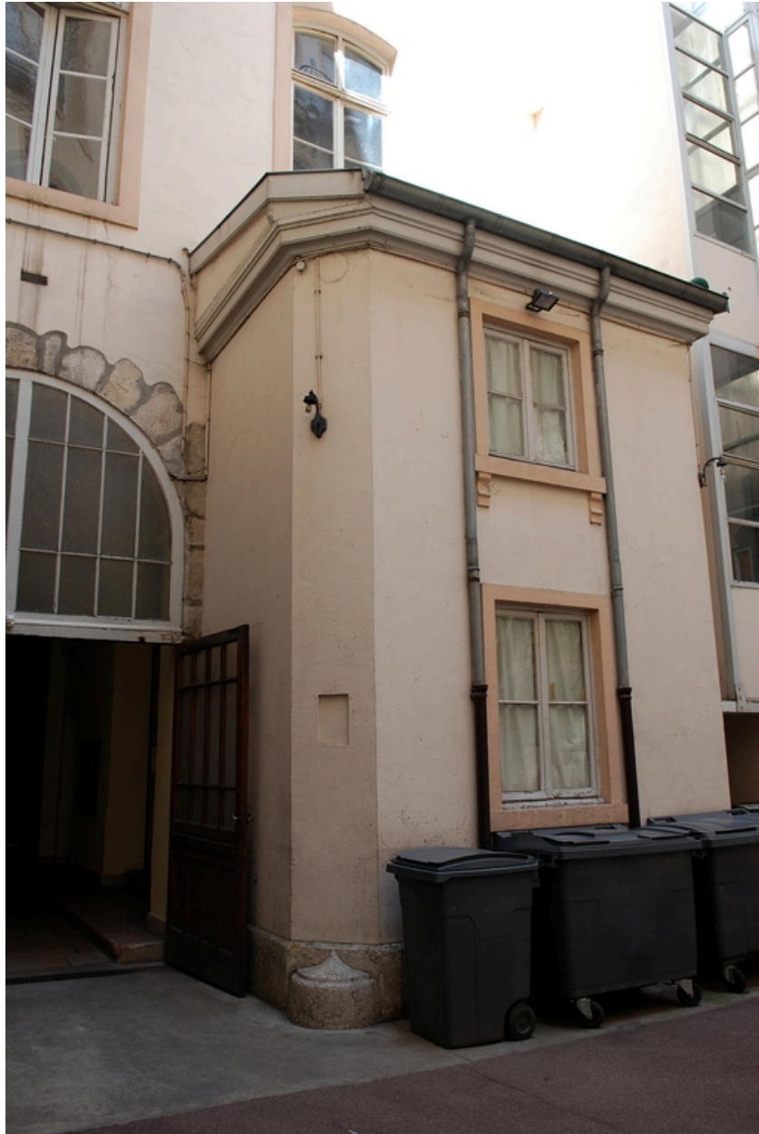
La cour : élévation ouest, loge de concierge