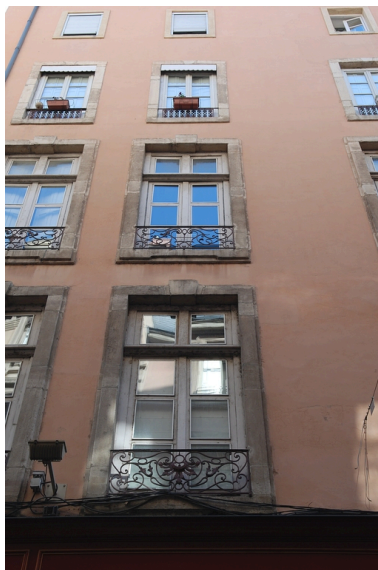
Elévation rue Emile-Zola : vue partielle IVR82_20096904848NUCA