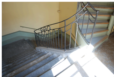
Escalier : détail