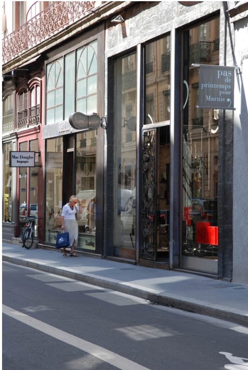
Elévation rue Gasparin : le rez-de-chaussée, détail