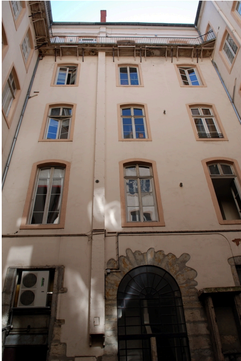
La cour : élévation est