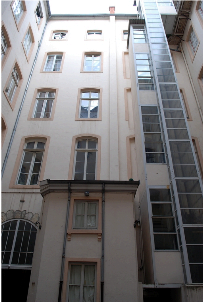
La cour : élévation ouest