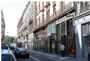
Elévation rue Gasparin : le rez-de-chaussée vers la place Bellecour