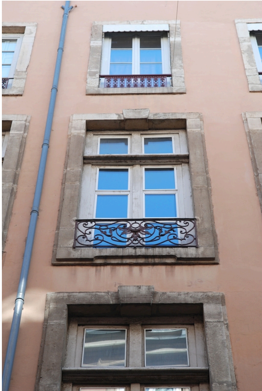
Elévation rue Emile-Zola : détail de fenêtres et de leur garde-corps