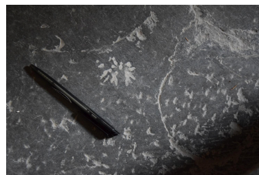
Détail de fossiles : petite colonie de bryozoaires IVR84_20236900518NUCA