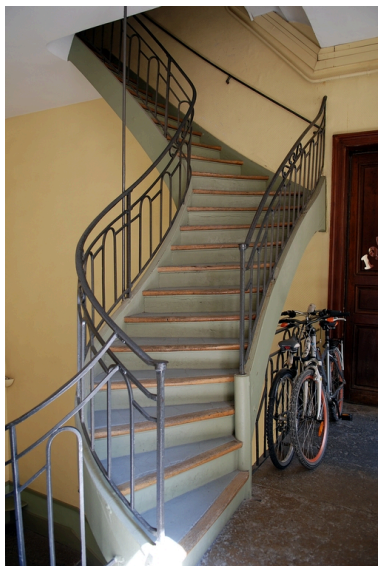
Escalier : volée des étages surélevés IVR82_20096904870NUCA