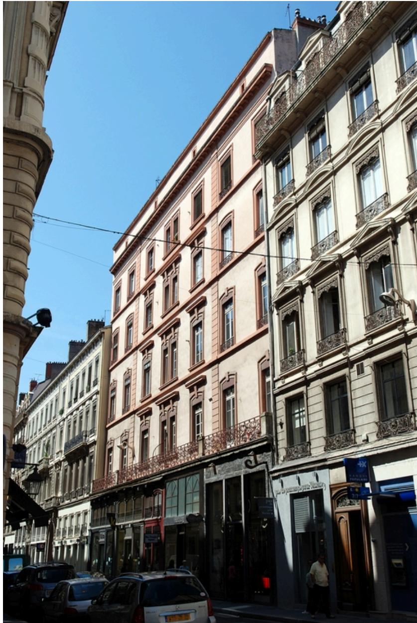
Elévation rue Gasparin