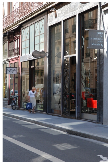
Elévation rue Gasparin : le rez-de-chaussée, détail IVR82_20096904854NUCA