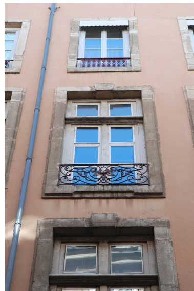
Elévation rue Emile-Zola : détail de fenêtres et de leur garde-corps IVR82_20096904849NUCA