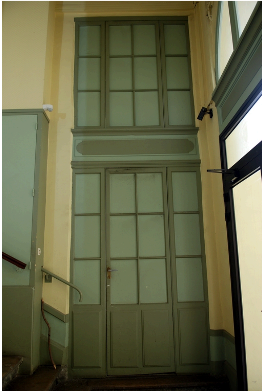
Entrée de la logge de concierge depuis la cage d'escalier