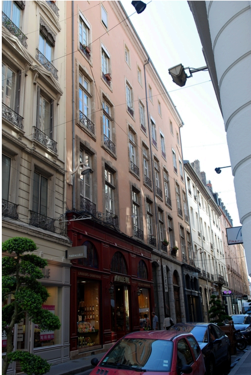
Elévation rue Emile-Zola