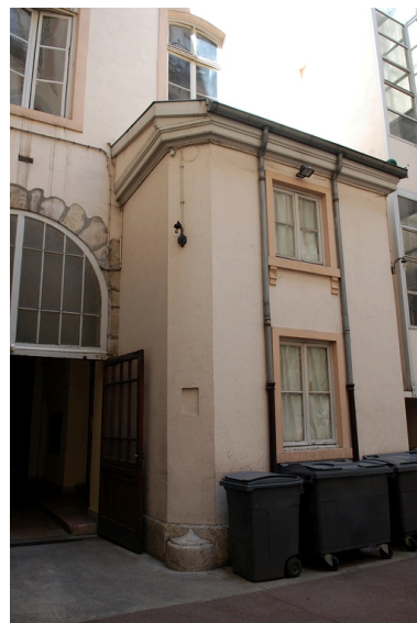
La cour : élévation ouest, loge de concierge