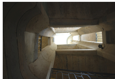
Escalier : le jour en contre-plongée IVR82_20096904865NUCA