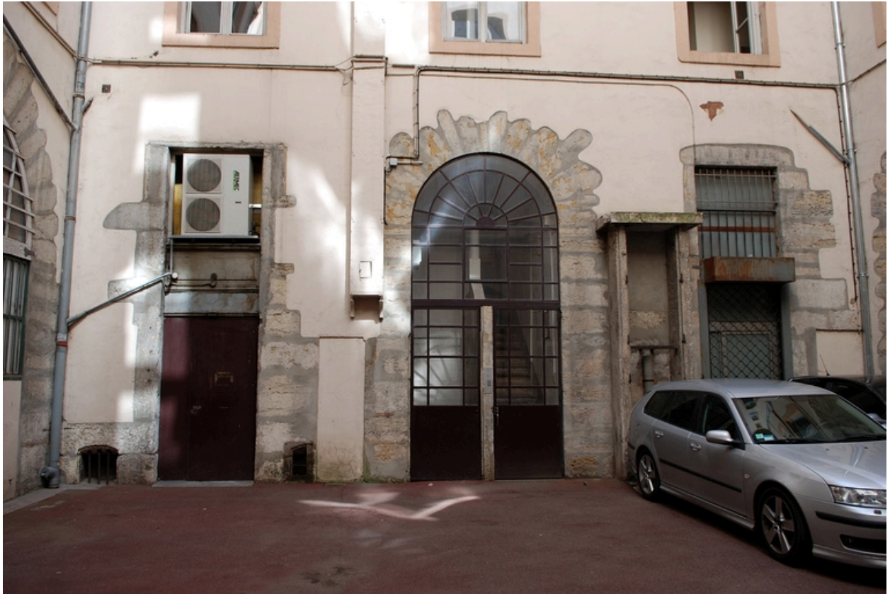
La cour : élévation est, le rez-de-chaussée