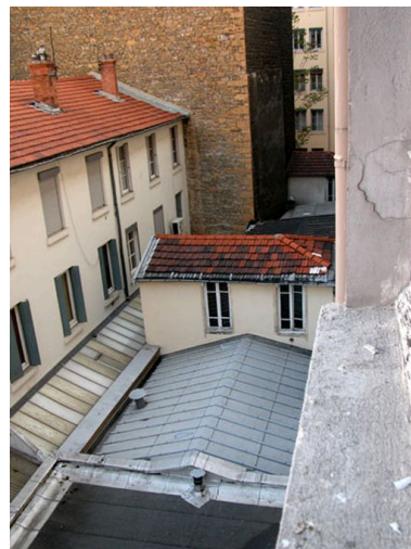
Elévation sud de la loge de concierge