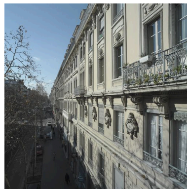
Détail du décor IVR82_20046904043NUCA