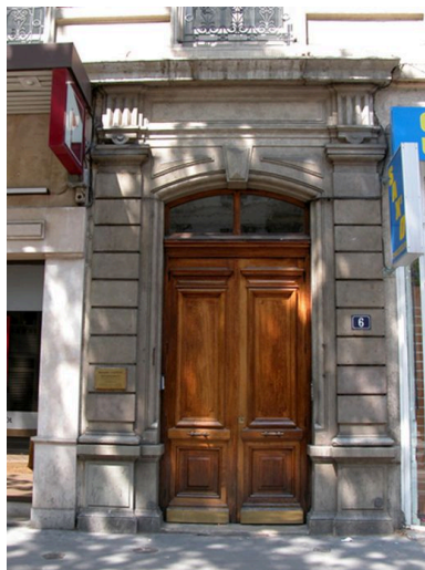
Porte d'entrée IVR82_20046904580NUCA