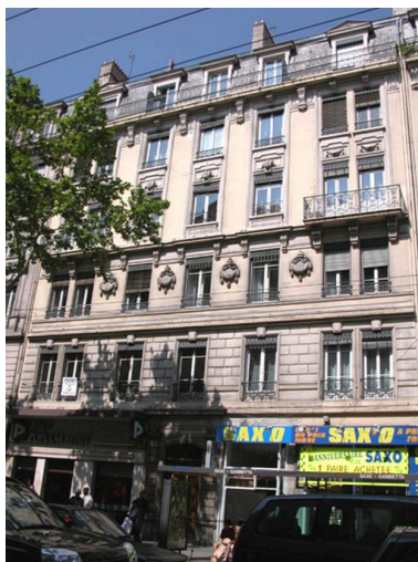
Elévation principale IVR82_20046904578NUCA