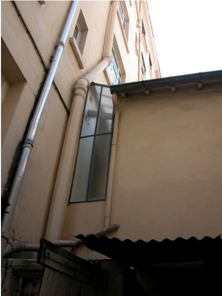
Elévation latérale de la loge de concierge : verrières éclairant l'accès