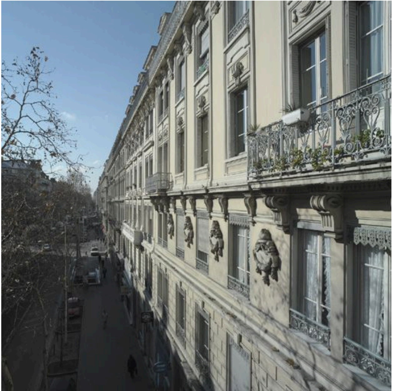
Détail du décor