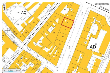
Plan masse et de situation, extrait de http://cadastre.gouv.fr IVR82_20136902202NUDA