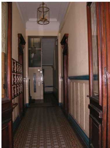
Vue générale du vestibule IVR82_20046904581NUCA