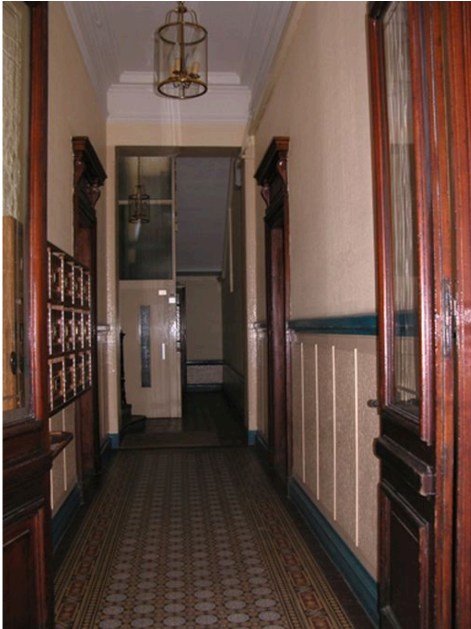
Vue générale du vestibule