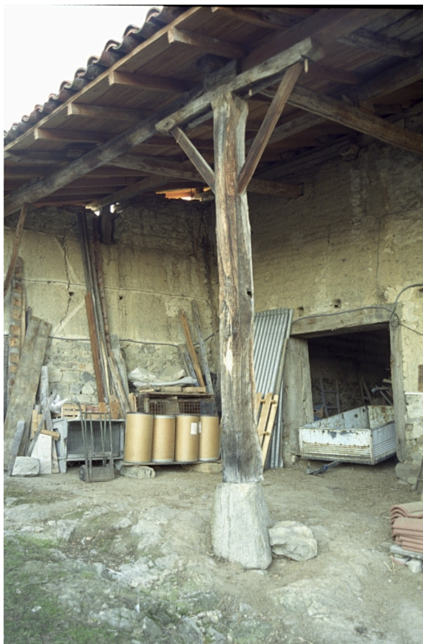
Grange-étable, angle ouest.