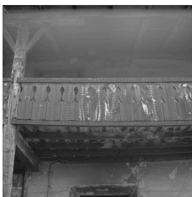
Logis, détail de la galerie en bois découpé. IVR82_20024200964X