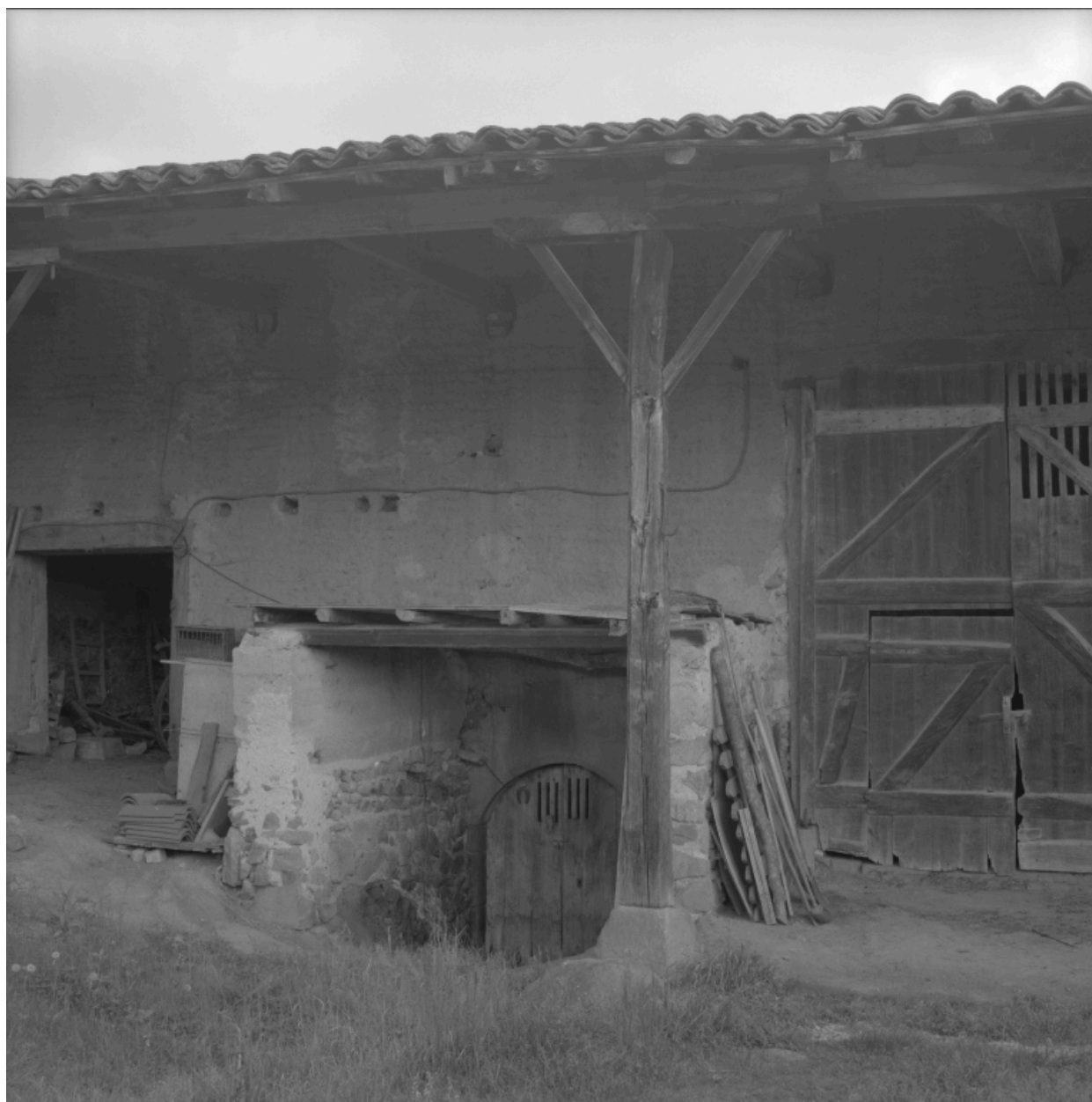
Grange-étable, porte d'entrée de la cave voûtée.