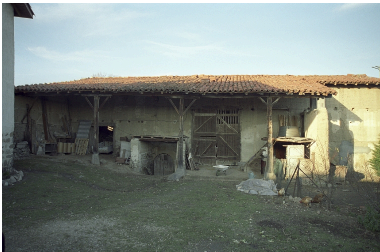
Vue d'ensemble de la grange-étable.