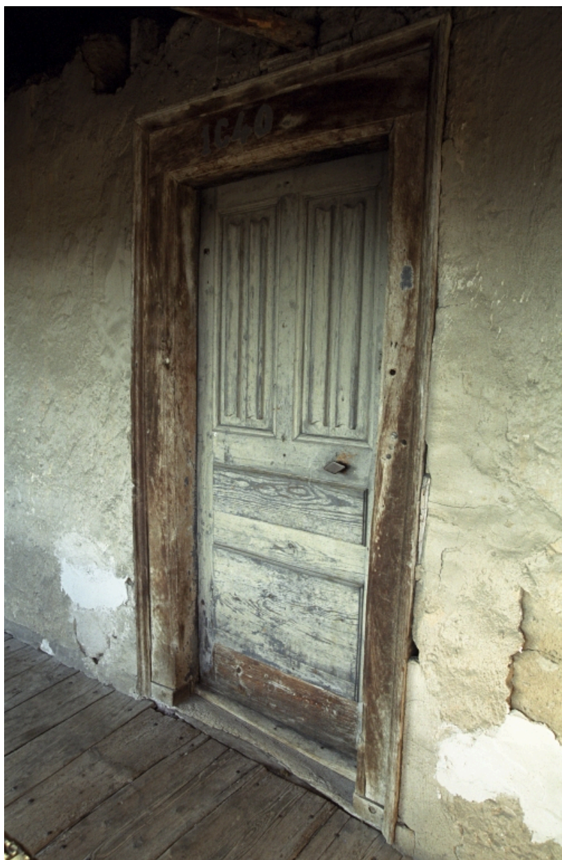
Logis, porte à l'étage donnant sur la galerie.