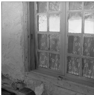
Logis, détail de l'encadrement de la baie à l'étage, trace de croisée en bois. IVR82_20024200965X