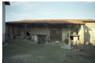
Vue d'ensemble de la grange-étable. IVR82_20044200698ZE