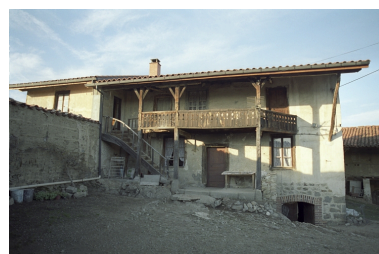
Vue d'ensemble de face du logis. IVR82_20044200696ZE