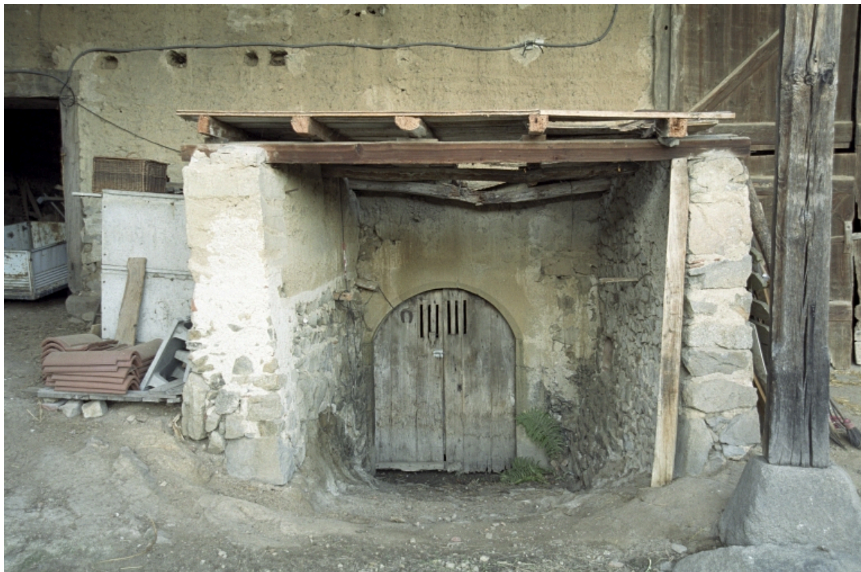
Grange-étable, porte d'entrée de la cave voûtée.