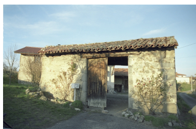
Vue du passage couvert depuis de chemin.