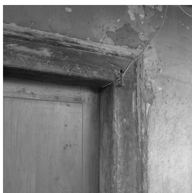
Logis, détail de l'encadrement mouluré de la porte d'entrée du logis.