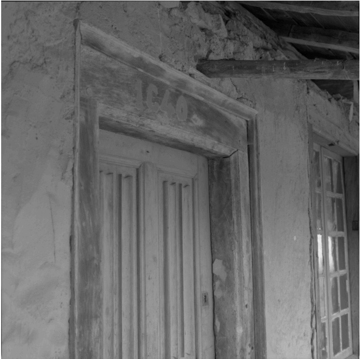
Logis, détail de la porte de l'étage, linteau daté 1640.