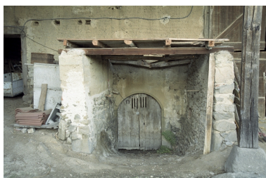
Grange-étable, porte d'entrée de la cave voûtée.