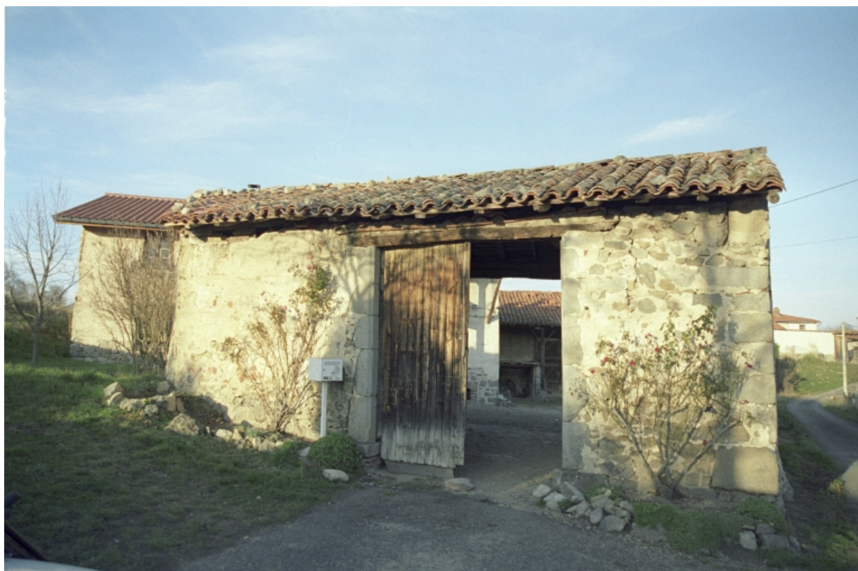
Vue du passage couvert depuis de chemin.