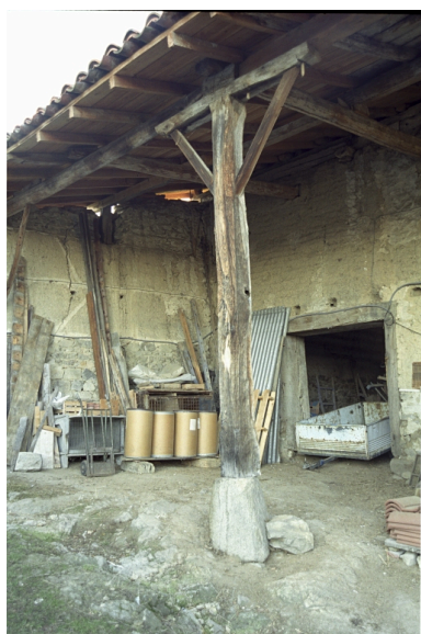
Grange-étable, angle ouest. IVR82_20044200700ZE