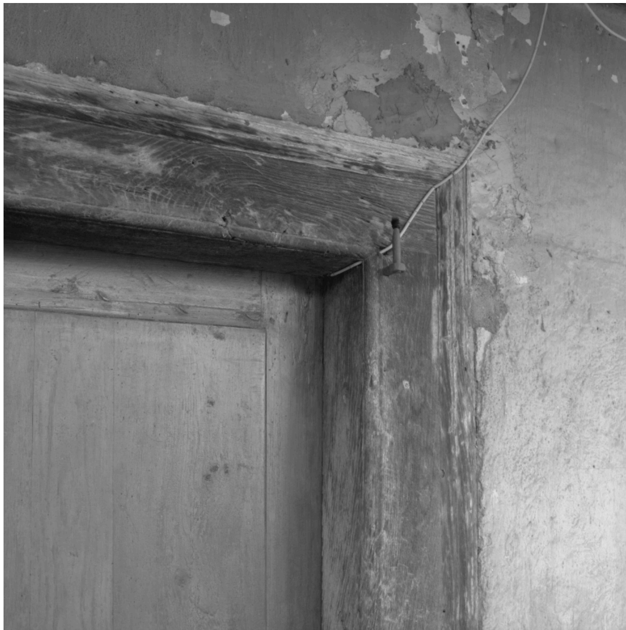
Logis, détail de l'encadrement mouluré de la porte d'entrée du logis.