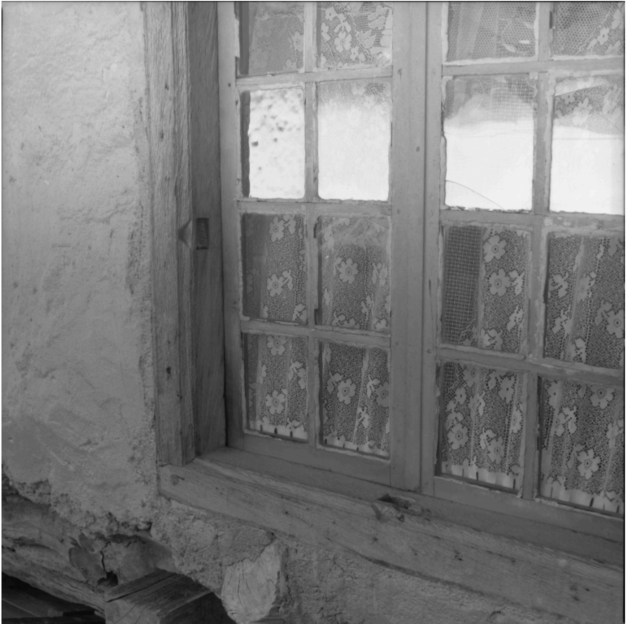
Logis, détail de l'encadrement de la baie à l'étage, trace de croisée en bois.