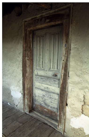
Logis, porte à l'étage donnant sur la galerie.