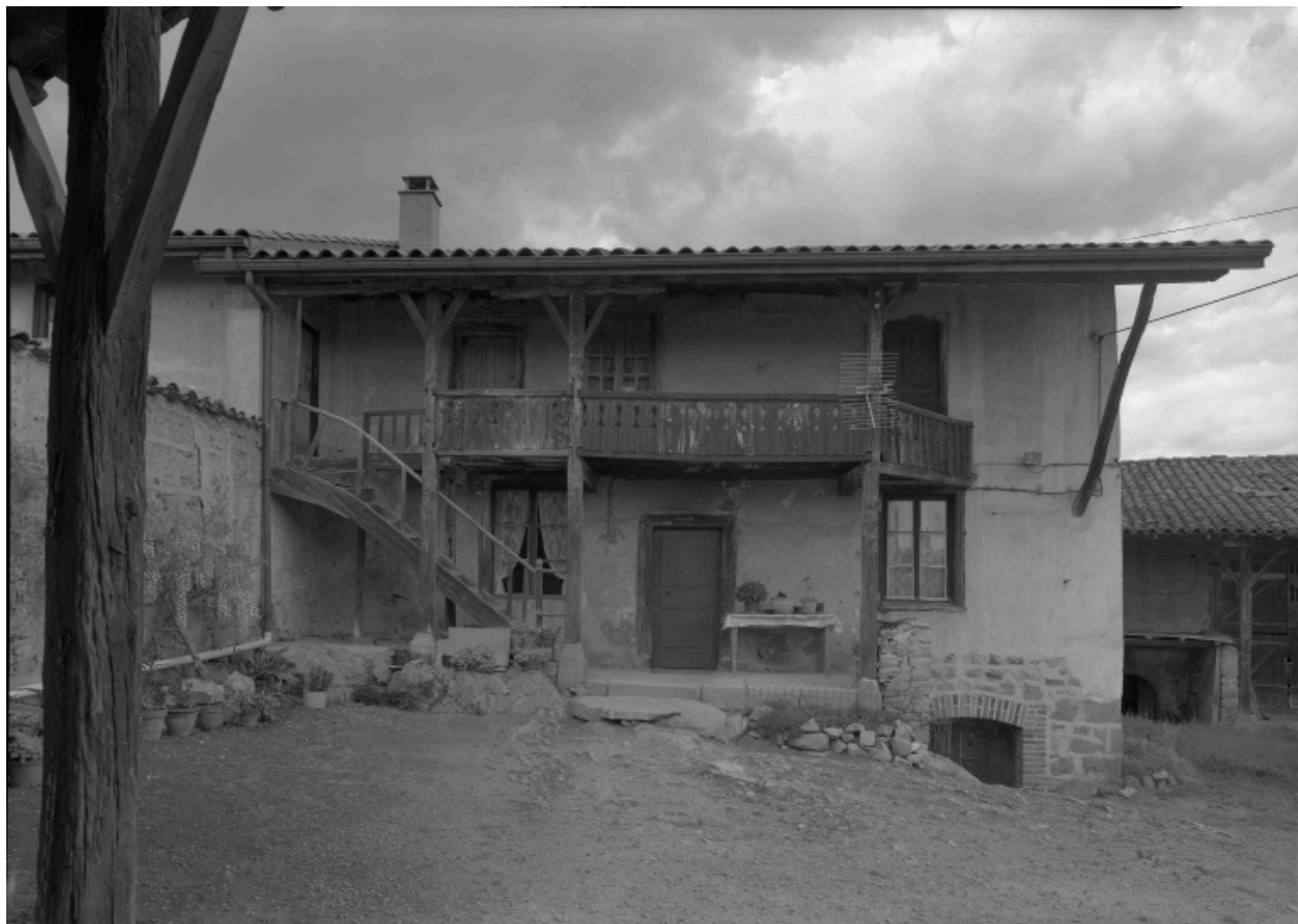
Vue d'ensemble de face du logis.