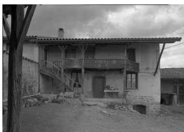
Vue d'ensemble de face du logis. IVR82_20024200962P