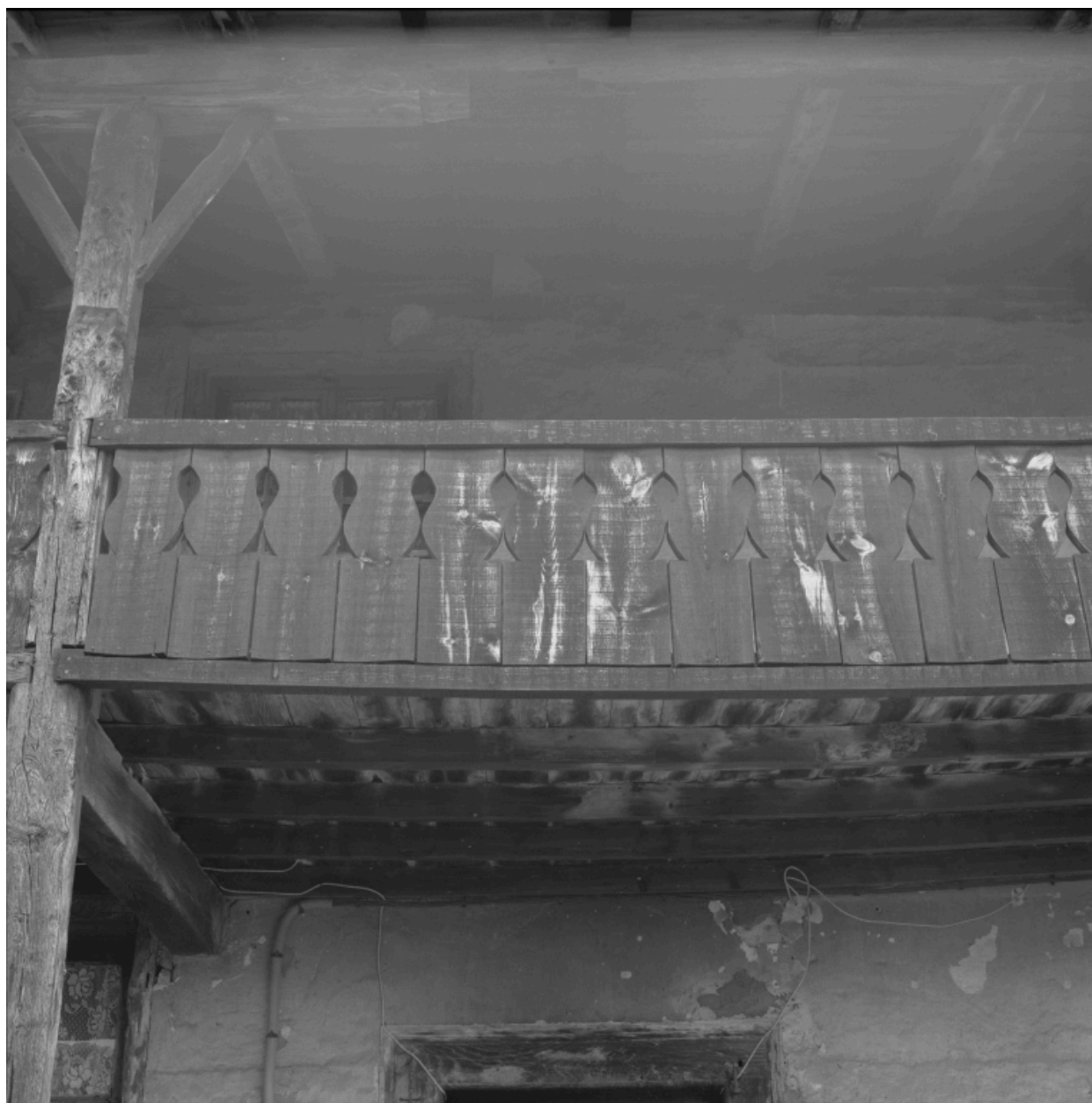
Logis, détail de la galerie en bois découpé.