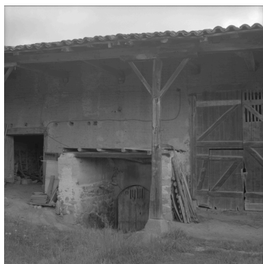
Grange-étable, porte d'entrée de la cave voûtée. IVR82_20024200968X