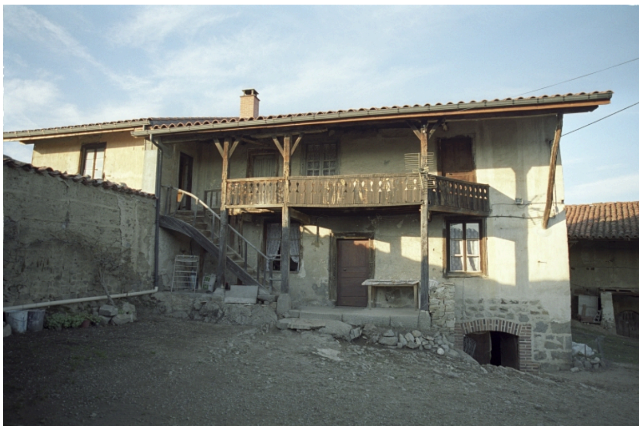
Vue d'ensemble de face du logis.