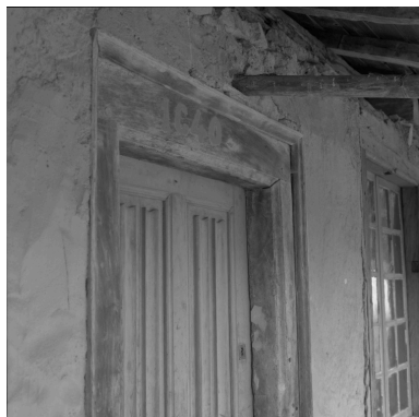
Logis, détail de la porte de l'étage, linteau daté 1640.