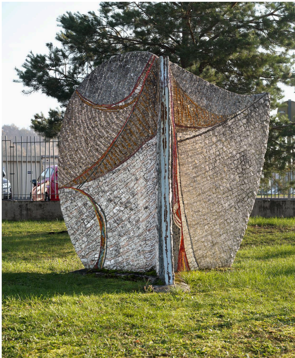
Vue d'ensemble (face côté lycée).