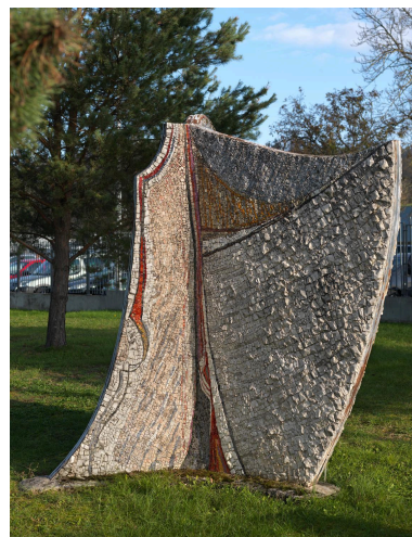
Autre point de vue.