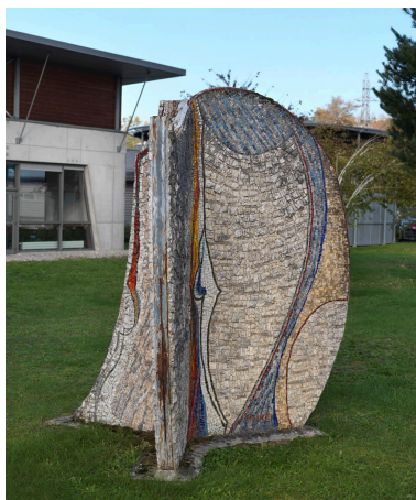
Vue de trois-quarts. IVR84_20193800383NUCAQ