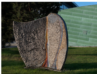
Vue d'ensemble IVR84_20193800375NUCAQ