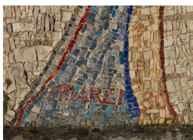
Détail : signature. IVR84_20193800381NUCAQ