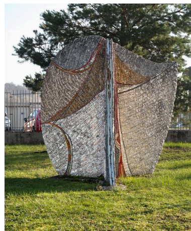
Vue d'ensemble (face côté lycée).