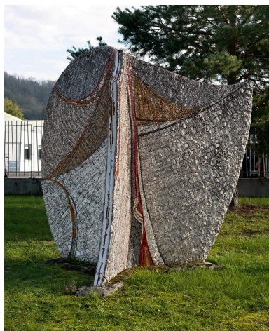
Autre point de vue.