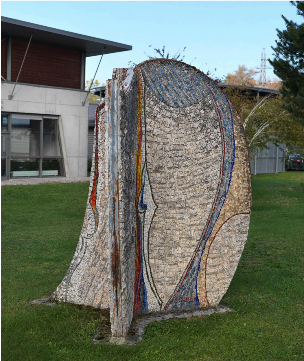
Vue de trois-quarts.