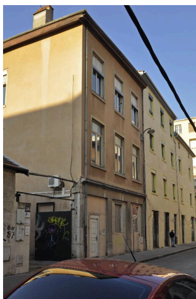
Elévation latérale nord, sur la rue Saint-Michel IVR84_20166902134NUCA