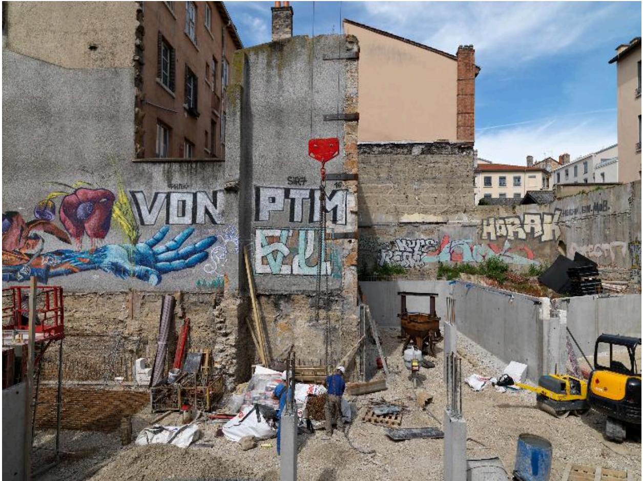
Vue du coeur d'îlot depuis le sud, mur pignon de l'immeuble