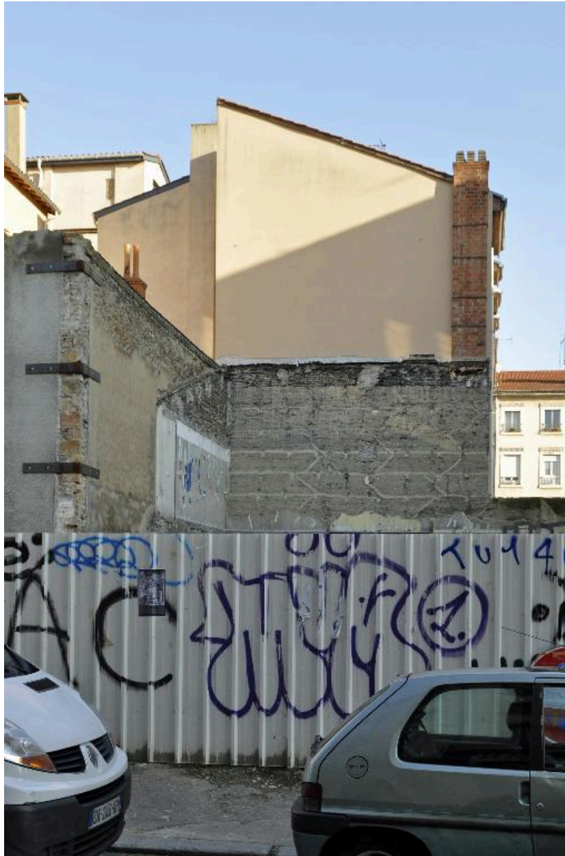
Elévation latérale sud, parties basses en pisé