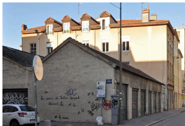
Vue d'ensemble depuis l'est, avant démolition des ateliers