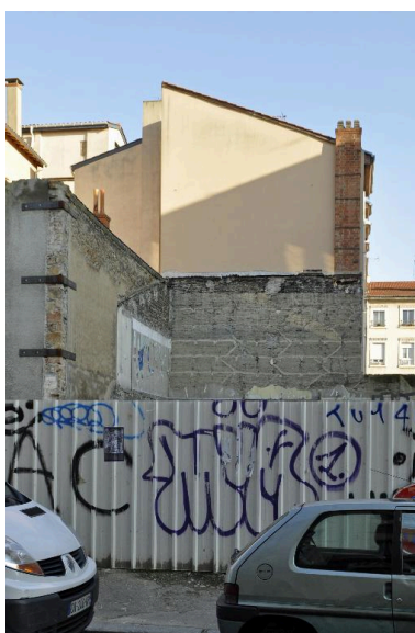
Elévation latérale sud, parties basses en pisé