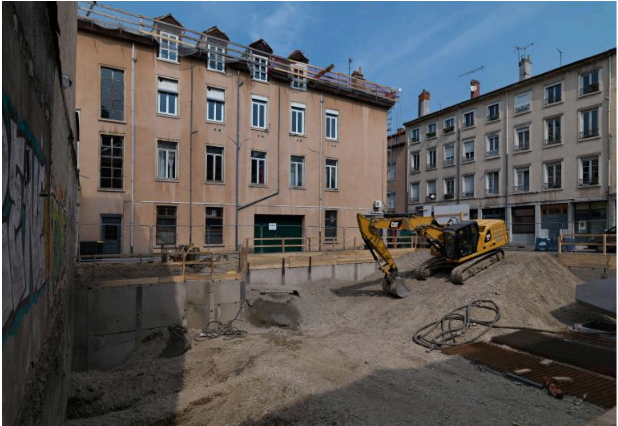
Vue d'ensemble depuis l'est, après démolition des ateliers