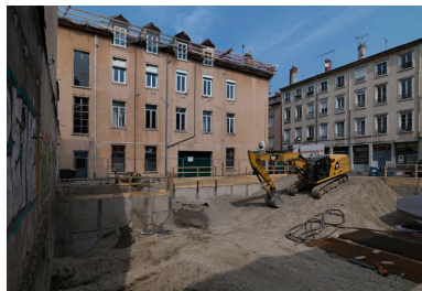
Vue d'ensemble depuis l'est, après démolition des ateliers IVR84_20196900354NUCAQ