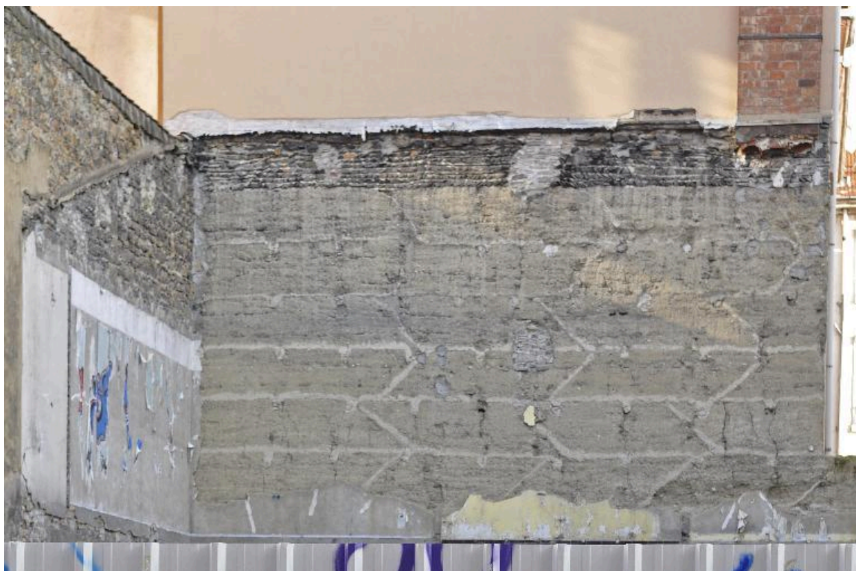
Détail du pisé