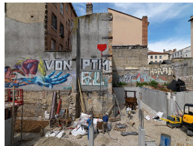
Vue du coeur d'ilôt depuis le sud, mur pignon de l'immeuble