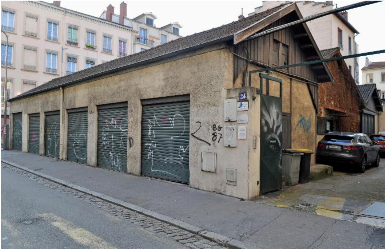
Ateliers sur la parcelle de l'immeuble