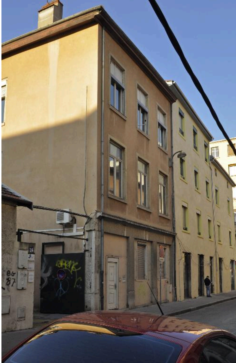
Elévation latérale nord, sur la rue Saint-Michel