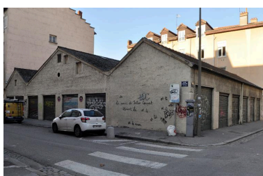
Façade arrière des ateliers sur la rue d'Anvers IVR84_20166902139NUCA