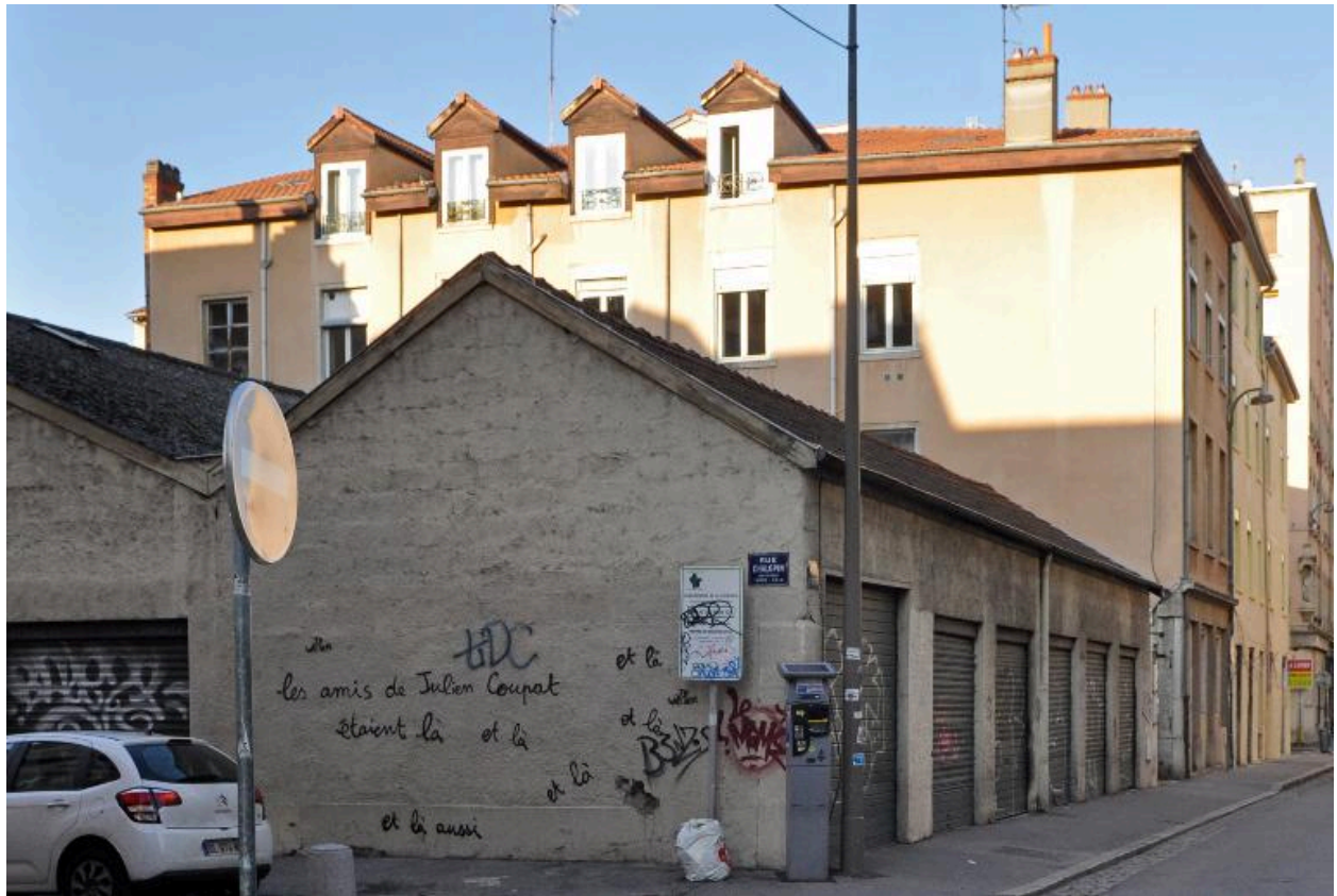
Vue d'ensemble depuis l'est, avant démolition des ateliers