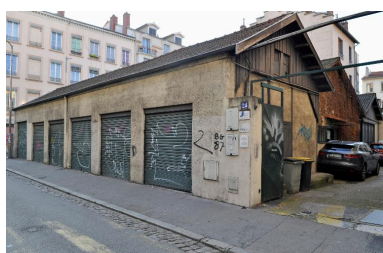
Ateliers sur la parcelle de l'immeuble IVR84_20166902138NUCA