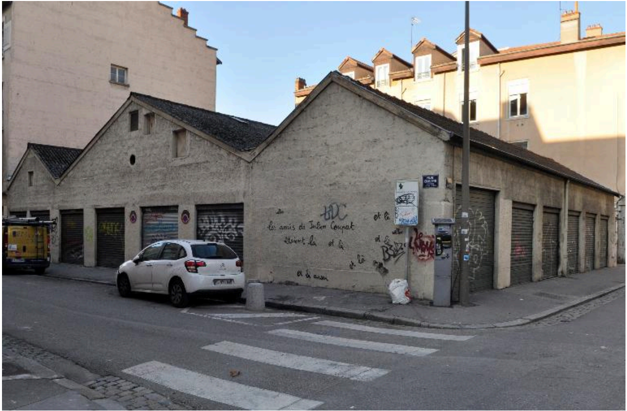
Façade arrière des ateliers sur la rue d'Anvers