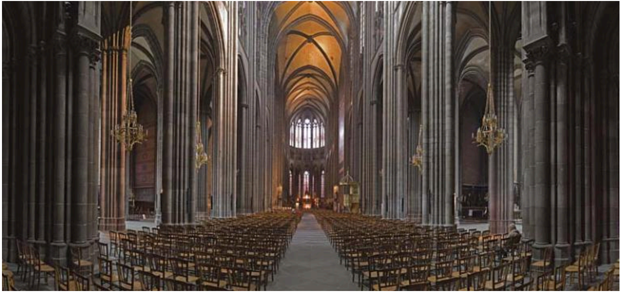
Vue générale de l'intérieur vers le chœur.